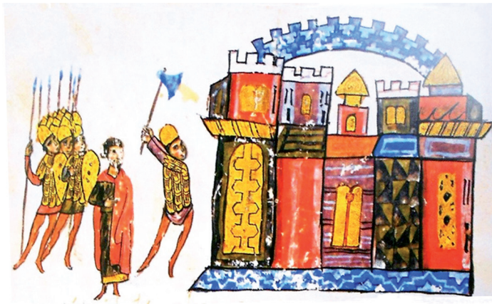
Εικ. 4. Ο στρατηγός Μιχαήλ Βούρτζης σπάει τα κλειθρα στην πύλη της Αντιόχειας με τσεκούρι, Χρονικό Ιωάννη Σκυλίτζη, MS Gr. Vitr. 26-2, φ. 353ν, 12ος αιώνας (TSAMAKDA, The Illustrated Chronicle , εικ. 386).