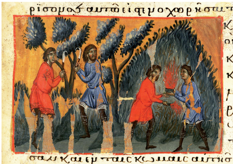
Εικ. 2. Οι Εφραΐμ και Μανασσής, γιοι του Ιωσήφ, αποφιλώνουν τη γη κόβοντας δέντρα, Οκτάτευχος μονής Βατοπεδίου, κώδ. 602, φ. 380γ, περ. 1270-1300 (ΧΡΗΣΤΟΥ κ.ά., Οί θησαυροί του Ἁγίου Ὁρους, τ. Δ', 85, εικ. 132,).