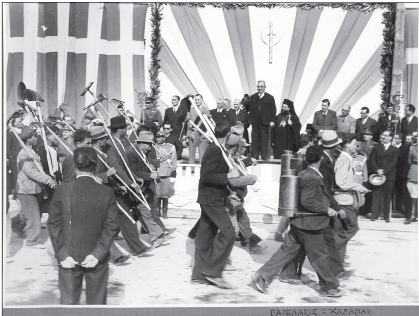
Εικ. 11. Φωτογραφία της παρέλασης των αγροτών με τα εργαλεία τους ενώπιον του Ιωάννη Μεταξά, 25/4/1939.