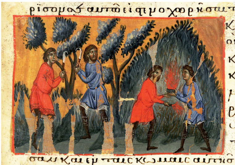
Εικ. 2. Οι Εφραΐμ και Μανασσής, γιοι του Ιωσήφ, αποφιλώνουν τη γη κόβοντας δέντρα, Οκτάτευχος μονής Βατοπεδίου, κώδ. 602, φ. 380γ, περ. 1270-1300 (ΧΡΗΣΤΟΥ κ.ά., Οί θησαυροί του Ἁγίου Ὁρους, τ. Δ', 85, εικ. 132,).