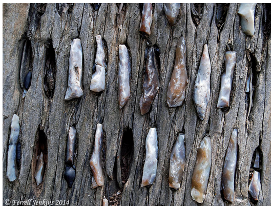
Εικ. 9β. Οι κοφτερές λίθινες λεπίδες στην κάτω επιφάνεια τυκάνης.