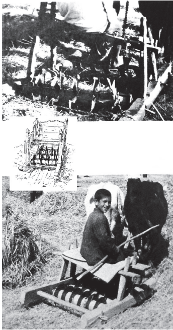
Εικ. 10. Φωτογραφία θεριστικού κάρου σε λειτουργία, Περσία, μέσα του 20ου αιώνα (WULFF, The traditional crafts of Persia , 274, εικ. 382, 383).