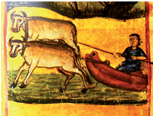
Εικ. 9α. Τυκάνη, Μηνολόγιο μονής Εσφιγιμένου, κώδ. 14, φ. 386ν, περίπου 1075. (Πελεκανιάδης κ.ά., Οί θησαυροί του Άγίου Όρους , τ. Β', Αθήνα 1975, 365, εικ. 347).