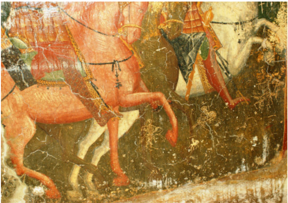
Φωτ. 2. Λεπτομέρεια της φωτογραφίας 1.