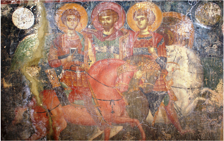
Φωτ. 1. Οι έφιπποι άγιοι Γεώργιος, Θεόδωρος και Δημήτριος (ναός Αγ. Ιωάννη Προδρομού στο Δισκούρι Μυλοποτάμου περίπου στα 1400).