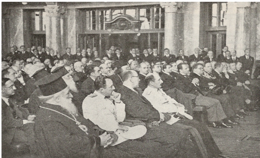
Phot. 2. L'ouverture du IVe Congrès (Sofia, 1934); au premier plan, de gauche à droite, Mgr. Néophyte, Président du Saint-Synode; le Prince Cyrille; K. Guéorguiev, Président du Conseil; le Roi Boris III.