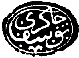
Ἡ σφραγίδα στην πίσω επιφάνεια του εγγράφου.

Μνημονευόμενα έγγραφα: Μολονότι υπάρχει κάποια ασάφεια, που οφείλεται σε επανάληψη, θα πρόκειται για ένα φερμάνι προς τους ήγγυμένους της Μονής Πάτμου, το οποίο επέτρεπε να αγοράζουν κάθε χρόνο είκοσι μύδια σιτάρι από τα Παλάτια (στ. 3 - 6). Πρέπει να αποδοθῆ στον Βαγιαζήτ Β', τον πατέρα του Άλεμσάχ εφόσον ο σουλτάνος που το είχε εκδώσει αναφέρεται ως ζωντανός. Δεν σώζεται σήμερα στο αρχείο της Μονής.