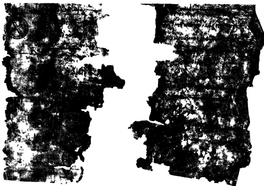
ΜΕΤΕΩΡΑ-ΒΑΡΑΛΛΑΜ, ἀρ. 1 Ἡ ἀρχὴ τοῦ πεμαχίου Α, τὸ τέλος τοῦ πεμαχίου Δ