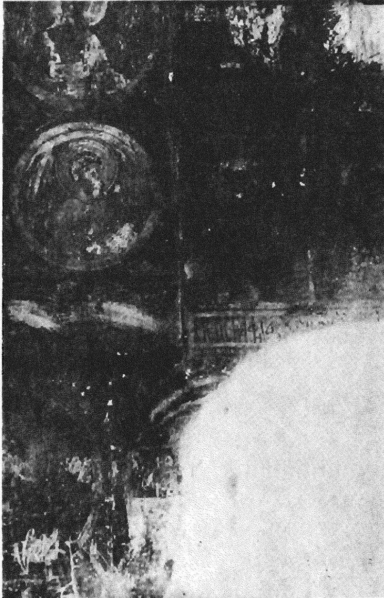
1. Χαράγματα στο ναό της μονής Τράχηλα Σητείας.