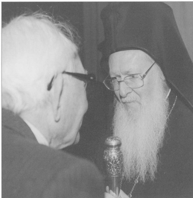
Ὁ Ὀδυσσεὺς Λαμπρίδης συνομιλεῖ μετὰ τὸν Οἰκουμενικὸν Πατριάρχη Βαρθολομαῖο σὲ ἐκδήλωση τοῦ Κέντρου Μικρασιατικῶν Σπουδῶν (23 Ὀκτωβρίου 2000).