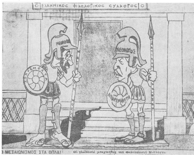
Περ. Άνω Κάτω (Πόλης) 1922. (Βλ. Κ.Μ., σ. 51).