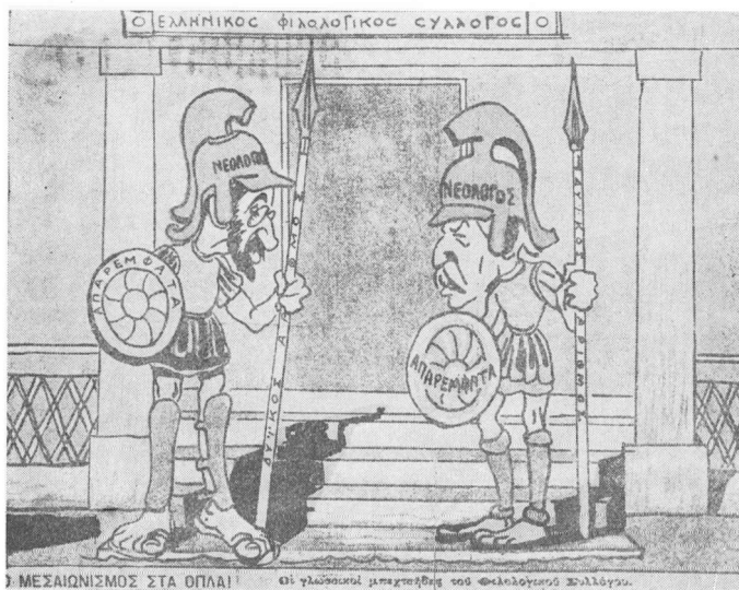
Περ. Ἄνω Κάτω (Πόλης) 1922. (Βλ. Κ.Μ., σ. 51).