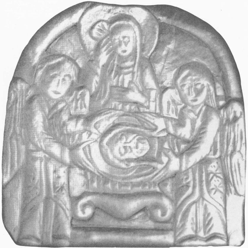
Παράσταση Έπιταφίου Θρήνου από την Αντιόχεια Πισιδίας