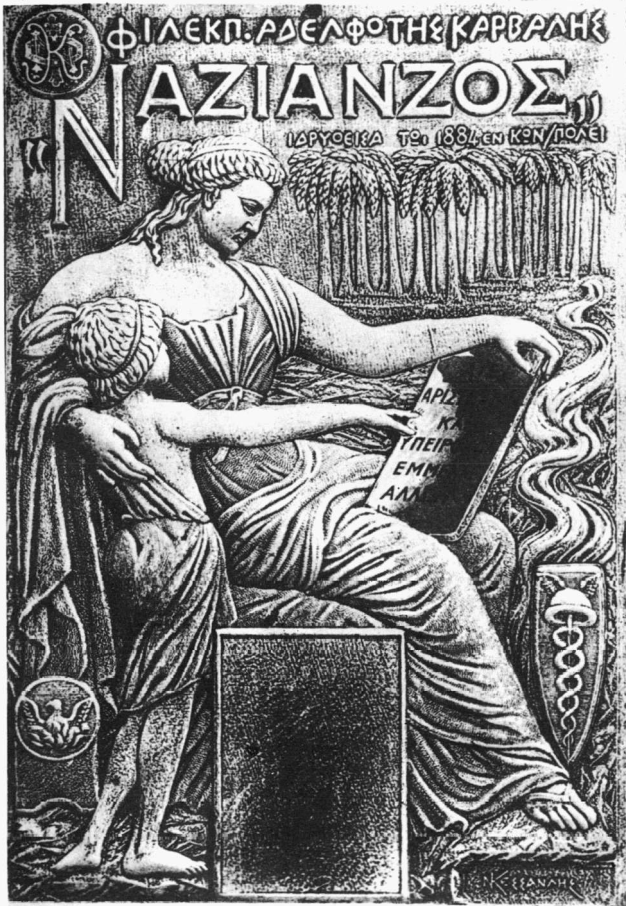
Ἐπιστολικό δελτάριο τῆς φιλεκπ. ἀδελφότητος Καρβάλης «Ναζιανζός». (Φωτογραφικὸ Ἄρχειο Κ.Μ.Σ.).