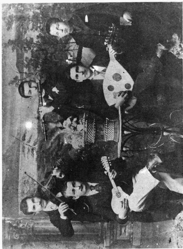
Φιλαρμονική Καδίκιοι Άμισου.