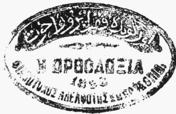
Σφραγίδες καππαδοκικών συλλόγων. (ΓΑΚ και Ἄρχαιο «Ἀνατολῆς»).