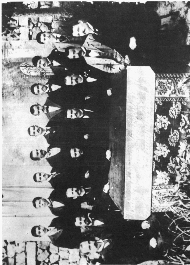
Καθηγητές και τελειόφοιτοι του 1898 στην Ίερατική Σχολή Κατάρειας.