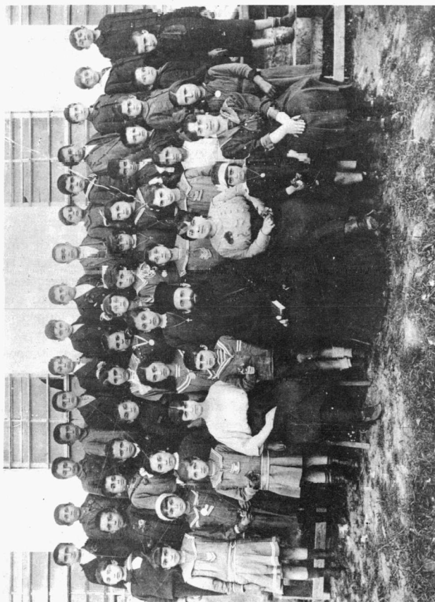
Ἑλληνικό Σχολεῖο Καδίκιοι Ἄμισοι. (Φωτογραφικό Ἄρχειο Κ.Μ.Σ.).