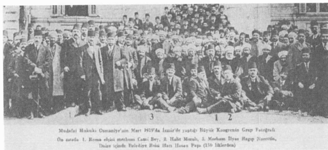
6. Τὸ Μεγάλον Συνέδριον (Μάρτιος 1919)