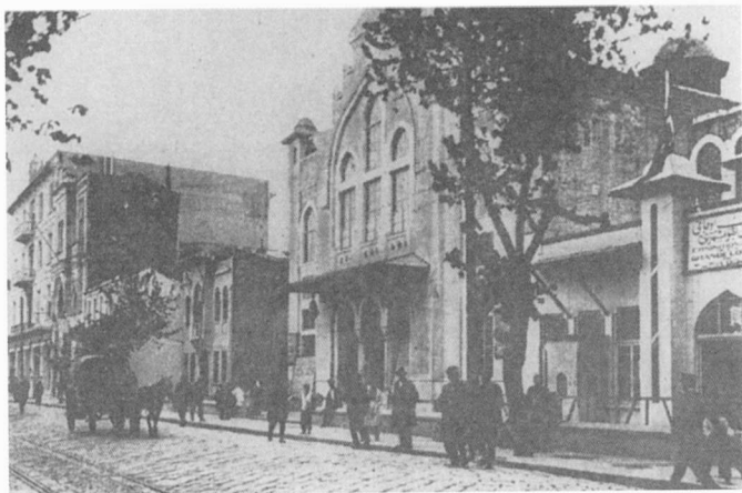
5. Κινηματογράφος Ἐθνικῆς Βιβλιοθήκης