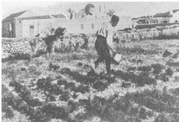
1. Καλλιέργειες κηπευτικών από Μικρασιάτες πρόσφυγες στην Γεράπετρα τῆς Κρήτης