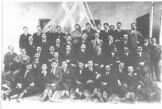
Σύλλογος «Ἀναγέννησις» Μερσίνας (Φωτογραφικὸ Ἄρχειο Κέντρου Μικρασιατικῶν Σπουδῶν).