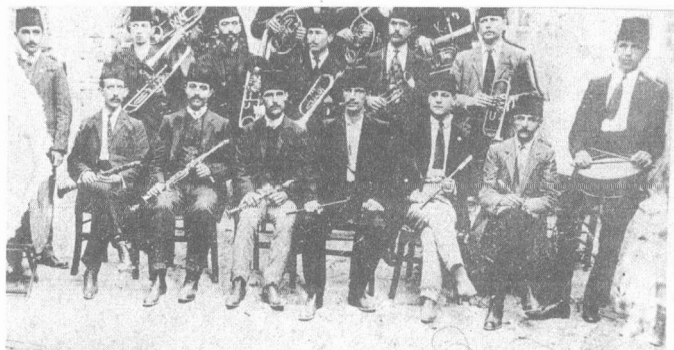
«Μουσικὸς Σὺλλογος Ὀρφεύς» (Γιῶργος Παντελῆς Πεχλιβανίδης, Ἀττάλεια καὶ Ἀτταλειῶτες , τ. Α', Ἀθήνα 1989, σσ. 294-295).