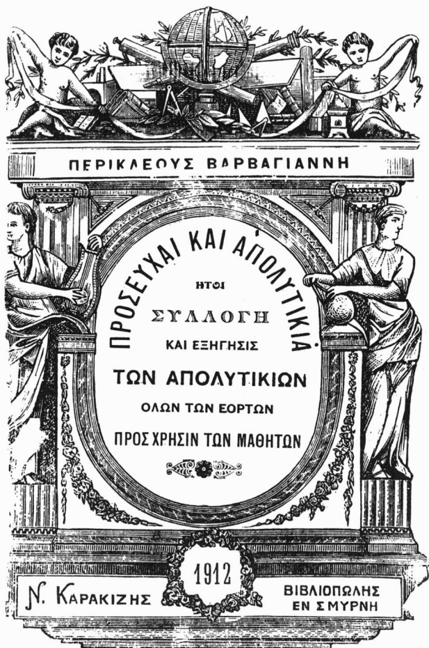
Τὸ ἐξώφυλλο τοῦ ὑπ' ἀρ. 88 βιβλίου.