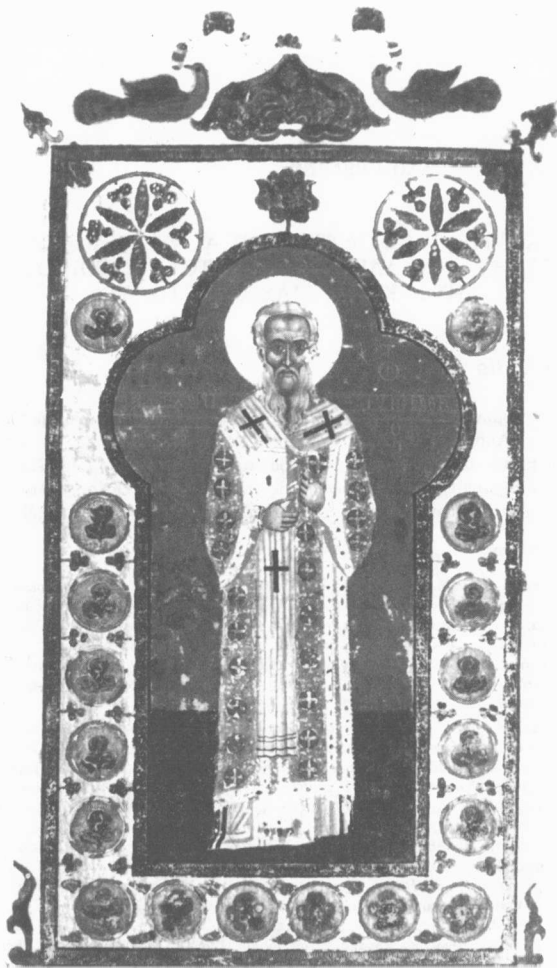
Ὁ Ἅγιος Ἀθανάσιος, Πατριάρχης Κωνσταντινουπόλεως Μονή Ἰβήρων cod. 369 f.3r (17ος αἰ.)

Εὐχαριστίες στὸν Πατέρα Θεολόγο τῆς Μ. Ἰβήρων γιὰ τὴν παραχώρηση τῆς φωτογραφίας τοῦ cod. 369 ποὺ εἰκονίζει τὸν Ἅγιο Ἀθανάσιο.