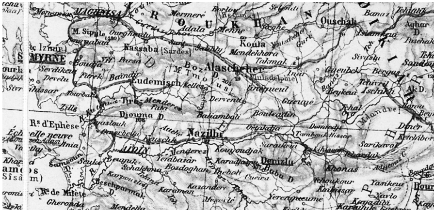
Asie Mineure au XIX e s., carte dressée par le géographe allemand et académicien Heinrich Kiepert (1867).

Mais, malgré les difficultés de ce voyage à Antioche, Renan sera ravi de voir ces belles villes; ses véritables pensées, sentiments et souvenirs – nous l’avons déjà signalé – sont éparpillés dans les petits carnets et on les retrouve après, telles quelles, dans les Apôtres et Saint Paul : “la variété des fleurs, la fraîcheur du gazon, composé d’une multitude inouïe de petites graminées, la beauté des platanes qui bordent l’Oronte, inspirent la gaieté, quelque chose du parfum suave dont s’enivrèrent ces beaux génies de Jean Chrysostome, de Libanius, de Julien”. 18 Retrouvons pour le moment Renan et sa femme à Smyrne. Commençons par le trajet détaillé selon son journal signalons que nous y avons gardé l’orthographe des lieux donné par Renan.