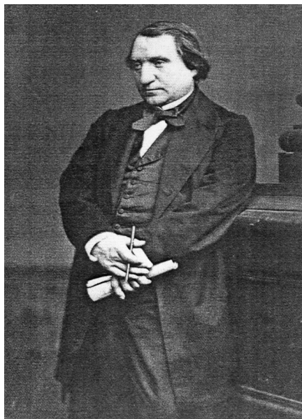
Renan à l'âge de 42 ans, au moment du voyage en Asie Mineure, en 1865.

Les pays qu'il visita sont des pays d'un passé culturel lourd, des pays qui ont joué un rôle crucial dans le cours de l'histoire du monde entier: l'Italie, la Palestine, le Liban, la Syrie, la Grèce, l'Égypte, la Turquie. L'Orient devint l'espace de ses recherches, puisqu'il va lui consacrer toute sa vie de scientifique et où il va faire deux voyages d'une année chacun. Son premier voyage se fera en 1860-1861 pour sa "Mission de Phénicie", commandité par l'empereur Napoléon III, durant laquelle il effectua des fouilles archéologiques de très grande envergure –mais