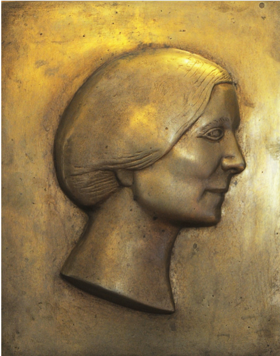
Κλέαρχου Λουκόπουλου, Μέλπω Μερλιέ , 1990, χαλκοκασσίτερος, 39×31×1,5 εκ., Κέντρο Μικρασιατικών Σπουδών (Αΐθουσα «Αναστάσιος Γ. Λεβέντης»).