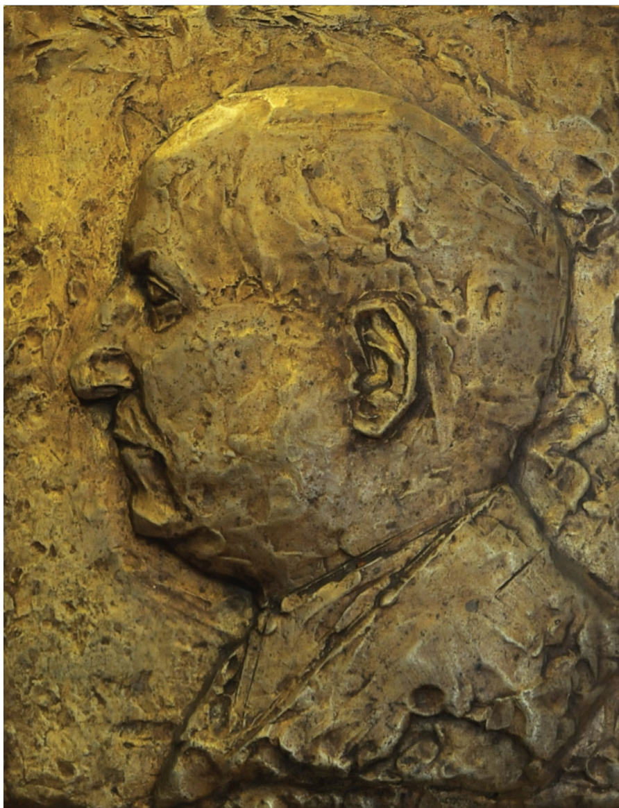
Θανάση Απάρτη, Οκτάβιος Μερλιέ , 1960, χαλκοκασίτερος, 39,3×30,7×1,5 εκ., Κέντρο Μικρασιατικών Σπουδών (Αίθουσα «Αναστάσιος Γ. Λεβέντης»).