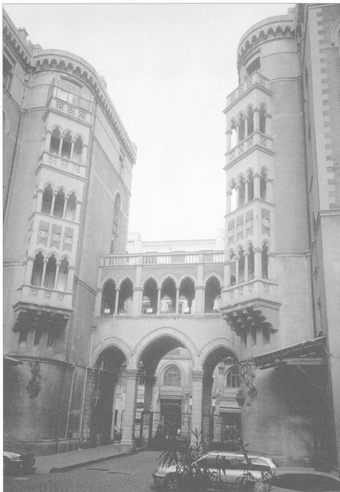
Fig. 5. La cour intérieure de l'église catholique de S. Antoine, Péra/Istiklal Caddesi.