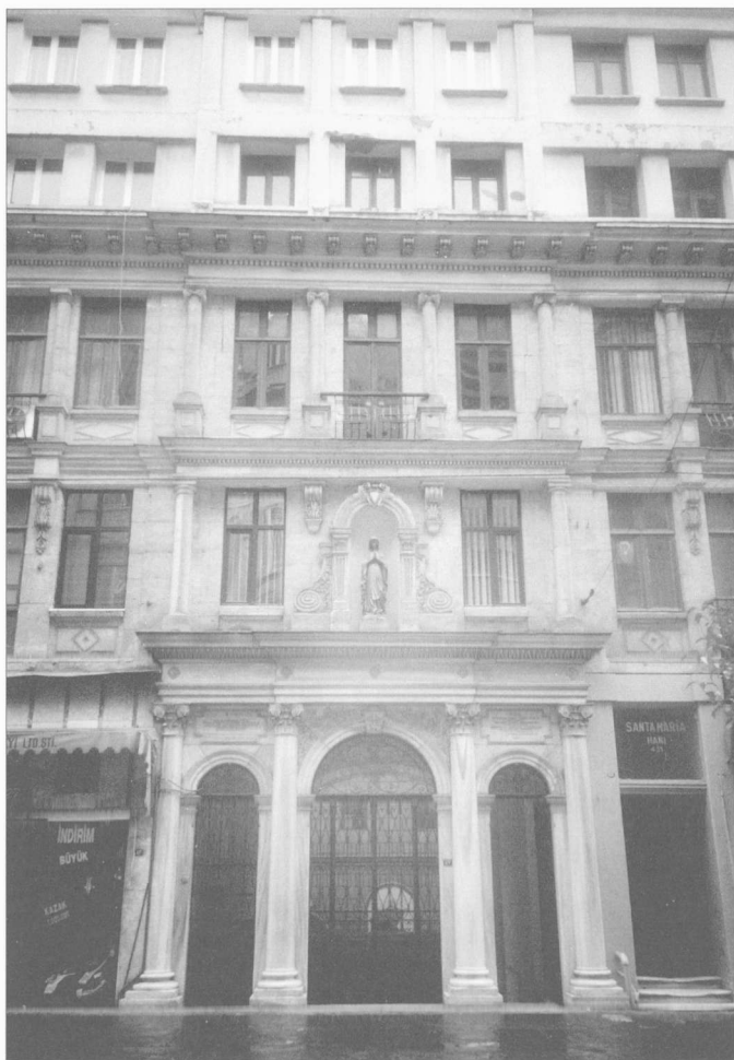
Fig. 6. L'église catholique de Santa Maria Draperis, incorporée dans le frontispice d'un palais situé dans İstiklal Caddesi.