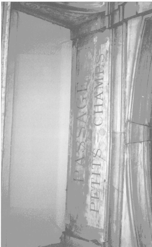
Fig. 2. Passage «Petits Champs», Tepebaşı.