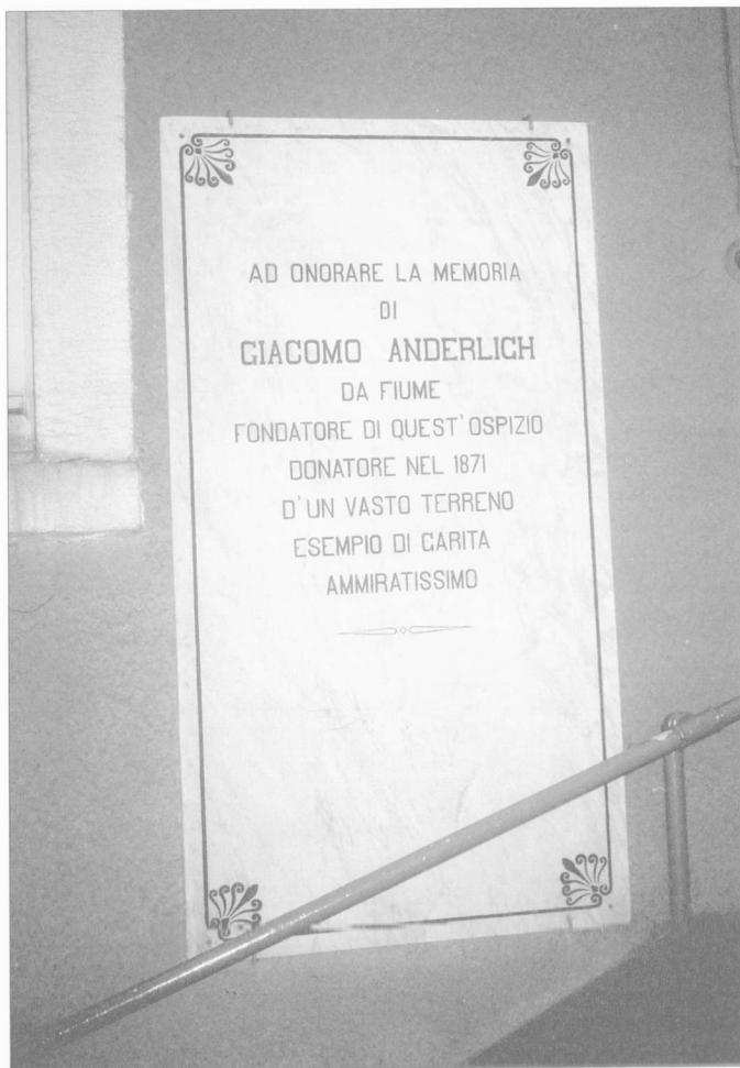
Fig. 4. Plaque commémorative du fondateur de l'Artigiana, Giacomo Anderlich, Artigiana, Harbiye.