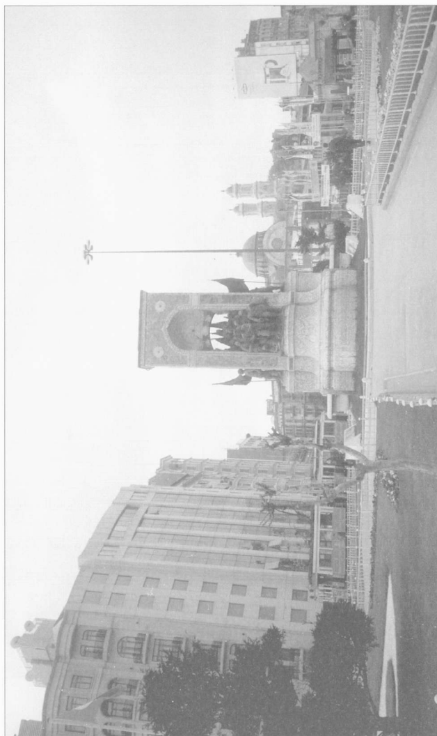
Fig. 3. Place de Taksim, le Monument de la République; à l'arrière-plan l'église grecque-orthodoxe de Agia Triada, Péra.