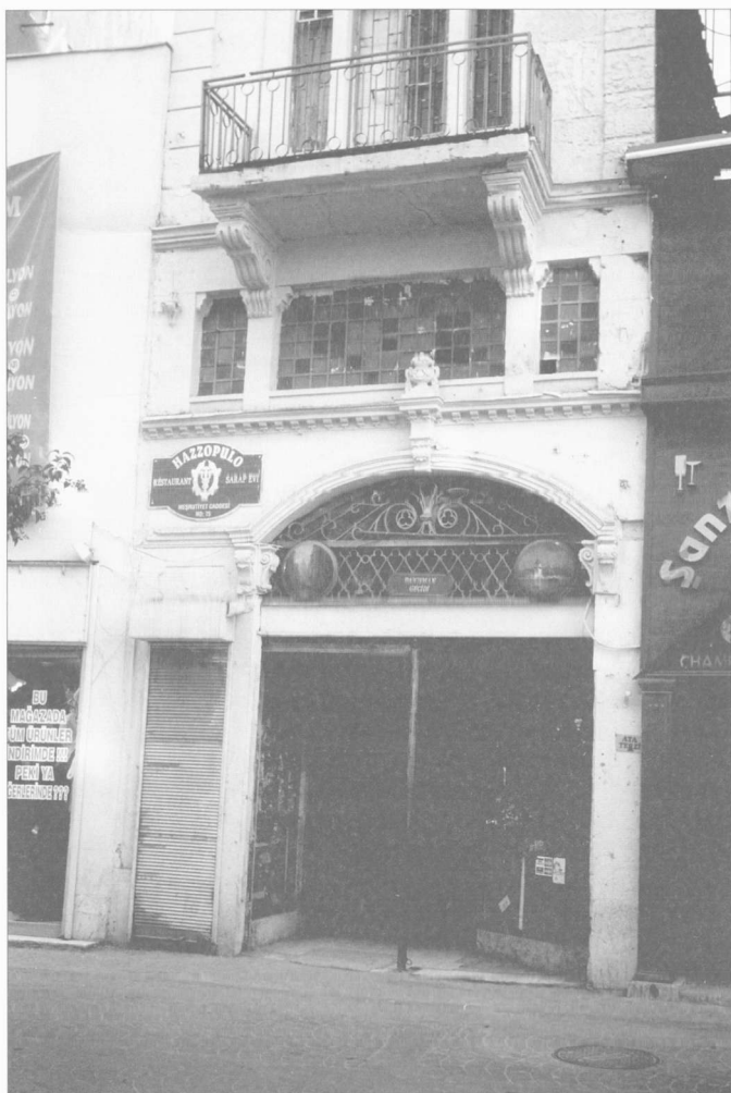
Fig. 1. Passage «Hazzopulo», Péra/Istiklal Caddesi.