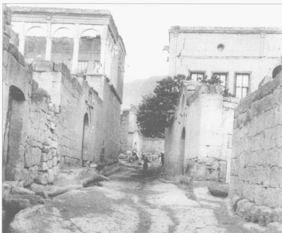
Καππαδοκία, Γκέλβερι, 1959. Ἀντίρογλον μαχλεσί, ὁ μαχαλάς τῶν Ἀνδρεάδηων. Δεξιά, τὸ σπίτι ὅπου γεννήθηκε ὁ πατέρας τοῦ Ἐρμόλαου Ἀχιλλέας.