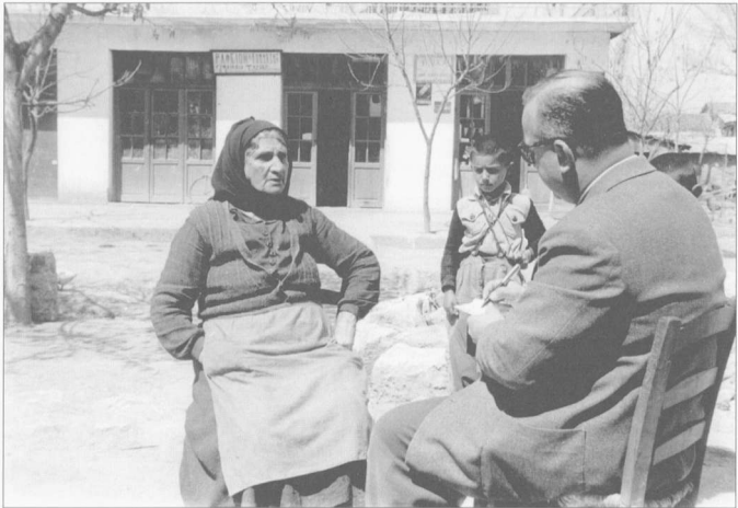
Ἀποστολή στό Πλατύ, Ἀπρίλης 1956.