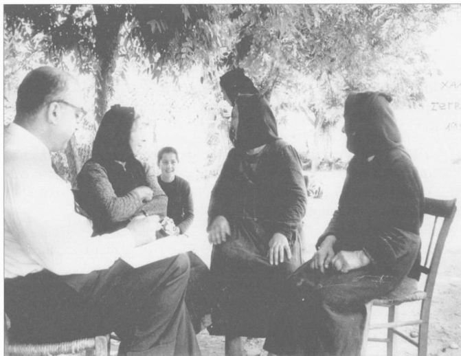
Ζωγράφου Χαλκιδικής, Άνδαβιάλ, 1959.

Σέ ὄδοιπορικό τοῦ καλοκαιριοῦ τοῦ 1951 ἀπὸ τὴν Καππαδοκία μιλάει γιὰ τὴν εὐλογημένη ἐκείνη ὥρα τῆς πρώτης ἐπαφῆς μὲ τὸ Κ.Μ.Σ., ἐνῶ εἶναι χαρακτηριστικός ὁ τρόπος μὲ τὸν ὁποῖο ἐκφράζεται στὸ ἴδιο κείμενο γιὰ τὴ Μικρασία: