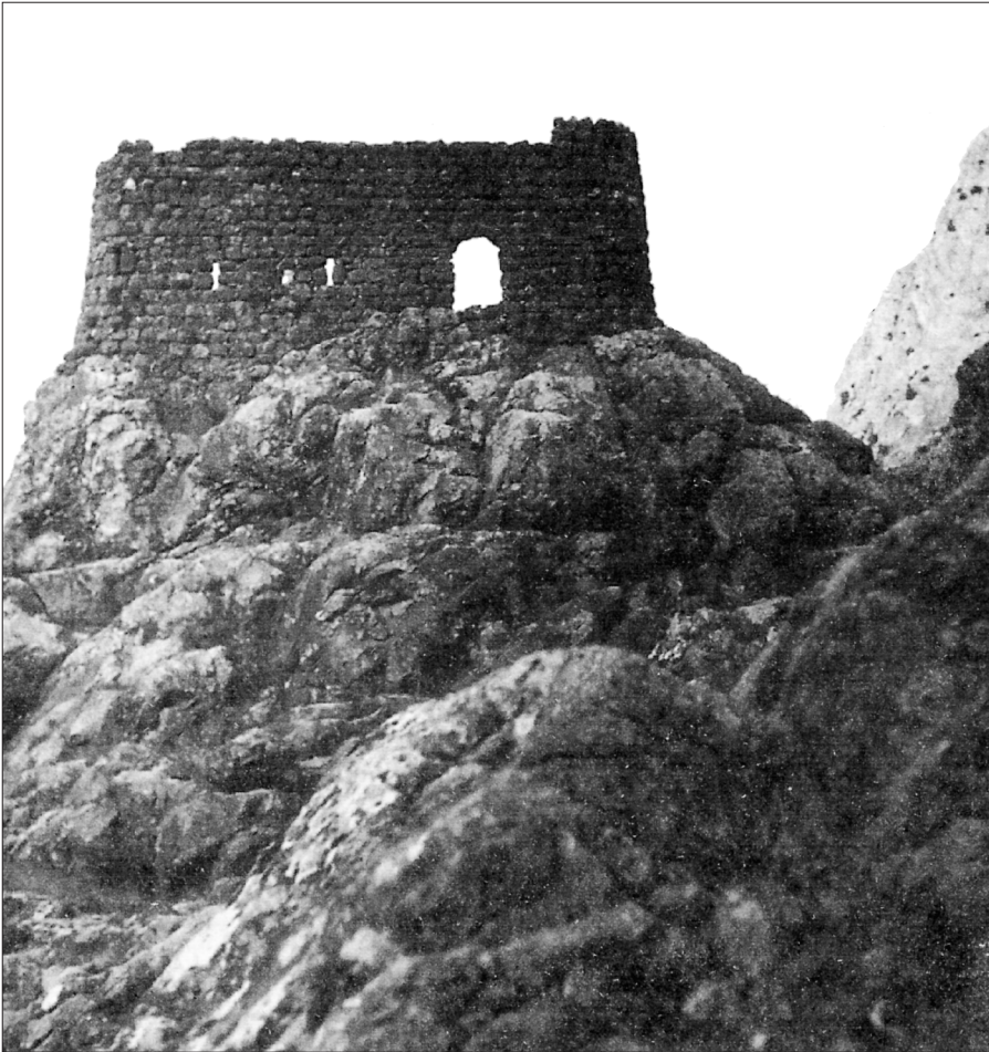
Ερείπια «βυζαντινικού» κάστρου στην Τελμησό.

Παρέμειναν ωστόσο οι μνήμες, οι καταγραφές τους με βάση τις οποίες πραγματοποιήθηκε η μελέτη ορισμένων εκδηλώσεων της λαϊκής δραστηριτικής συμπεριφοράς τους, και βεβαίως η ποικιλότητα διαχείρισής τους από τους απογόνους των προσφύγων σήμερα, κυρίως στο πλαίσιο των συλλόγων τους. Το ζήτημα ωστόσο αυτό είναι ευρύτατο και χρειάζεται ιδιαίτερη πραγμάτευση.