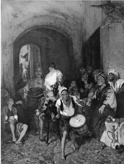
3. Η τιμωρία του ορνιδοκλέπτου (Η διαπόμπευση του κλεφτοκατά), 1873, ελαιογραφία σε μουσαμά, 135×104 εκ., ιδιωτική συλλογή.