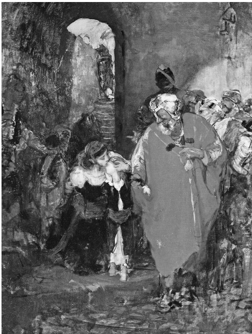
4. Το σκλαβοπάζαρο [1873/4], ελαιογραφία σε μουσαμά, 72×50 εκ., Εθνική Πινακοθήκη και Μουσείο Αλεξάνδρου Σούτζου.