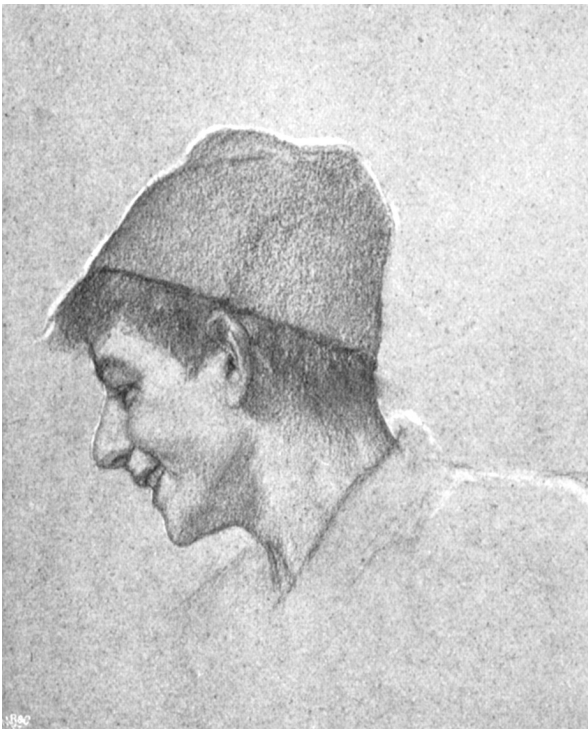
1. Παιδί της Σμύρνης , 1873, μολύβι.

Ο Γύζης σχεδιάζει αδιάκοπα, γεμίζοντας τετράδια με σκαριφήματά του, ιχνογραφήματα και σπουδές ( Παιδί της Σμύρνης ) 14 – χαρακτηριστικούς ανδρώπινους τύπους Ανατολιτών, που θα δώσουν αργότερα τις μορφές για έργα του που δούλεψε στην Αθήνα και στο Μόναχο ( Αραπίνα, Άραβας που καπνίζει, Ανατολίτης με τσιμπούκι, Ανατολίτης με μουσικό όργανο, Το σκλαβοπάζαρο, Παιδί και Ανατολίτης, Ανατολίτης προσευχόμενος, Ο Ανατολίτης με τα φρούτα ), εσωτερικά κατοικιών ( Εσωτερικό σπιτιού στη Σμύρνη, Κόκκινα σπίτια ) 15 .