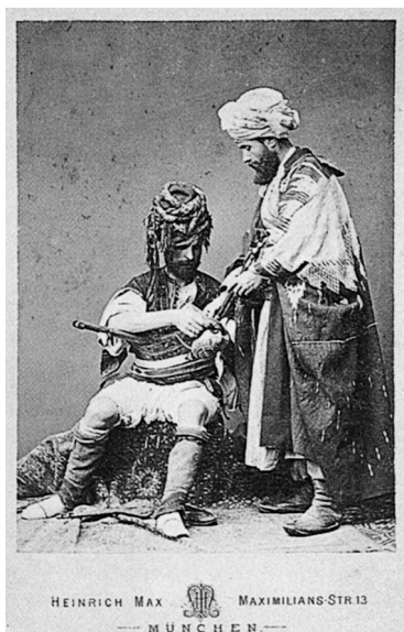
5. Heinrich Max, Οι ζωγράφοι Νικηφόρος Λύτρας (όρθιος) και Νικόλας Γύζης (καδιστός) με ανατολίτικες ενδυμασίες στο Μόναχο, 1876, τύπωμα αλμπουμίνας, Αρχείο Εθνικής Πινακοθήκης και Μουσείου Αλεξάνδρου Σούτζου.