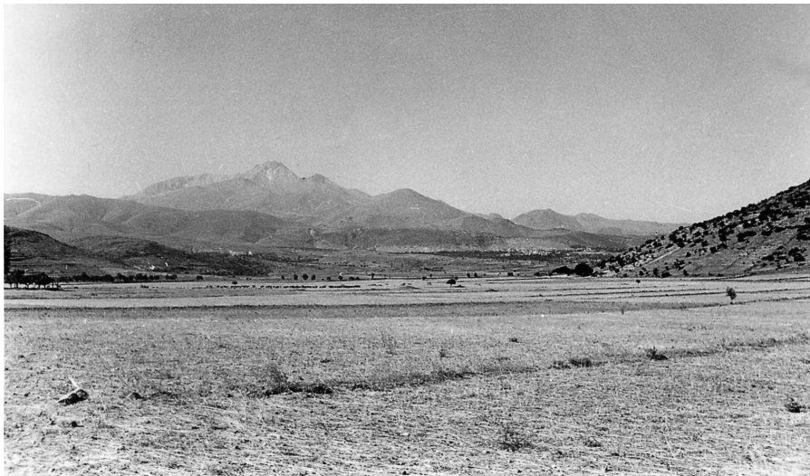
Πανόραμα Καππαδοκίας. Από αριστερά προς τα δεξιά Ανδρονίκι – Kırınardı – Hisartziik, πηγαίνοντας προς το Ακσα Καγιά. Η φωτογραφία παρμένη από Βορρά.

Στο χωριό μάς δέχτηκαν πολύ φιλικά. Όπως συνήθως, μόλις κατεθήκαμε από τα ταξί, μας περιτριγύρισαν παιδιά του χωριού. Μας έκανε εντύπωση το πιο καθαρό και νοικοκυρεμένο ντύσιμό τους.