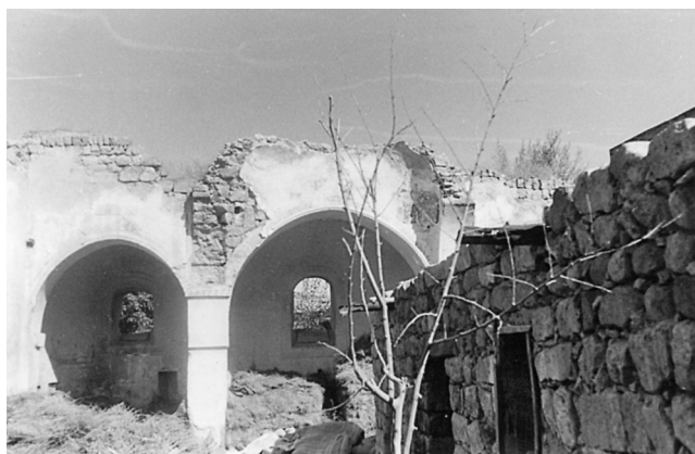
Άϊ Κωστέν. Τα ερείπια του ναού των Αγίων Κωνσταντίνου και Ελένης.