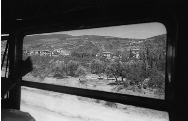
Χάρακας, χωριό αριστερά, δηλ. βόρεια του δρόμου προς Νικομήδεια, 55-60 χλμ. ΝΑ του Σκούταρι και 25 χλμ. ΒΔ της Νικομήδειας.

της Νικομήδειας. Γραφικές ακρογυαλιές. Το χωριό Χάρακας (Hereke), που όπως ξέρουμε από το υλικό του κ. Νικηφορίδη είχε Έλληνες, καταφέραμε και το φωτογραφήσαμε: τη μικρή σκάλα του, με βιομηχανικές εγκαταστάσεις, νότια του δρόμου, και το ίδιο το χωριό, βόρεια του δρόμου 5 . Φωτογραφήσαμε επίσης το χωριό Γιάρουμτζα, αριστερά μας, δηλ. βόρεια του δρόμου 6 . Ο δρόμος μας πέρασε μέσα από το χωριό.