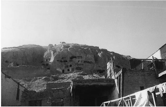
Σίλλη. Ο βράχος με λαξευτά σπίτια, σήμερα ακατοίκητα.

Όλοι όσοι είχαμε φωτογραφικές μηχανές φωτογραφήσαμε ό,τι μπορούσαμε. Τα λαξευτά, δυστυχώς, μόνο από μακριά. Προσπαθήσαμε να πάρουμε έστω και τμηματικά όλες τις γειτονιές του χωριού. Φωτογραφήσαμε επίσης τα δύο γεφύρια πάνω στο ρέμα του χωριού. Το ξύλινο, που στην είσοδό του, στις δυο μεριές, ήταν τοποθετημένες μαρμάρινες κεφαλές λιονταριών, και το πέτρινο, που φαινόταν μάλλον καινούριο. Φωτογραφήσαμε επίσης σπίτια παλιά και πιο καινούρια (τα σπίτια πάνω στο ρέμα, όπως αναφέρεται στο υλικό των Αρχείων του Κέντρου ήταν όλα σχεδόν ελληνικά).