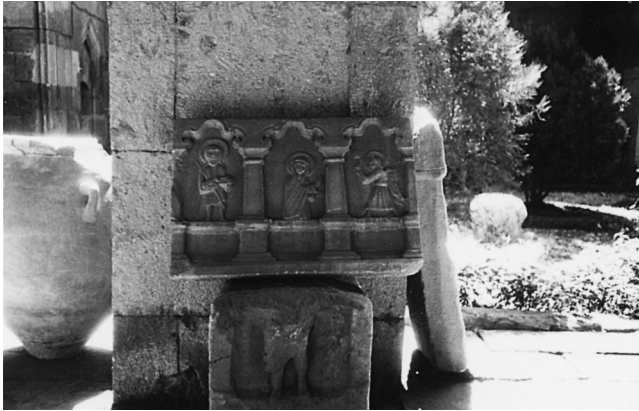
Καισάρεια. Στο Αρχαιολογικό Μουσείο της Καισάρειας τρίπτυχο ανάγλυφο: ο Ιωάννης Βαπτιστής και ο Ευαγγελισμός.

Στην Καισάρεια επισκεφθήκαμε το Αρχαιολογικό Μουσείο, όχι πλούσιο ούτε και ιδιαίτερα καλοβαλμένο. Στεγάζεται σε παλιό τζαμί. Ένα τρίπτυχο μαρμάρινο ανάγλυφο, ο Ιωάννης Βαπτιστής και ο Ευαγγελισμός, μας άρεσε και το φωτογραφήσαμε.