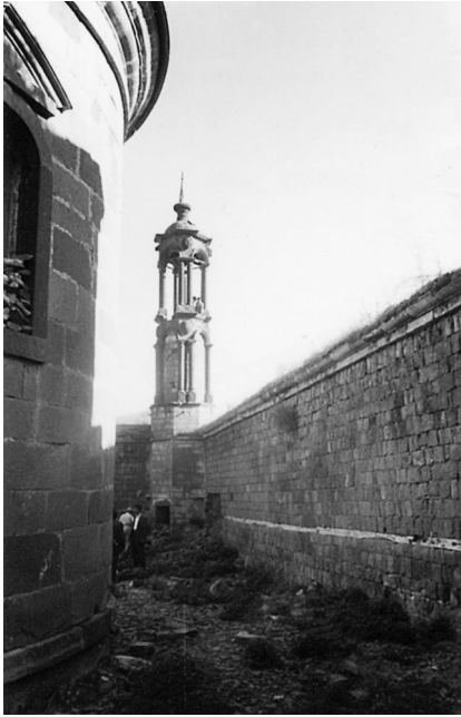
Endürlük. Το καμπαναριό της εκκλησίας των Αγίων Πρόβου, Ανδρονίκου και Ταράχου.

Φεύγοντας από το Ενδύρλικ και πηγαίνοντας προς το Ζιντζίδερε για λίγο είχαμε μπροστά μας και δεξιά το Ακτσάκαγια. Το φωτογραφήσαμε από μακριά.