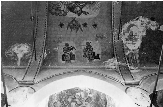
Μιστί. Το εσωτερικό της εκκλησίας του Αγίου Βασιλείου. Αγιογραφίες στον τρούλο και τις καμάρες.

Επιστρέψαμε και πάλι στο δρόμο της Νίγδης για να πάμε μέσω Λίμνας και Μαλακοπής στην Ανακού. Τη Λίμνα την είδαμε αυτή τη φορά από τα ΝΑ. Δεξιά μάς έδειξαν το βουναλάκι «Ταπούρ ντεβέ», όπου οι Τούρκοι κάνουν λειτανίες για βροχή.