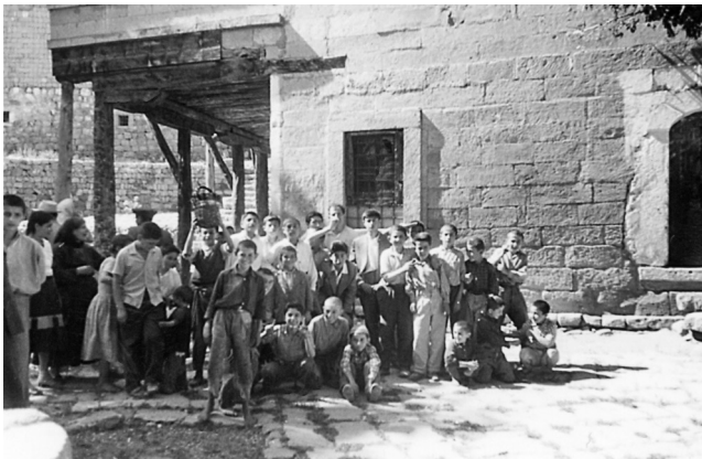
Περιφέρεια Καισαρείας, Βερέκι. Η αρμενική εκκλησία.