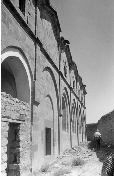
Μιστί. Η εκκλησία του Αγίου Βασιλείου.