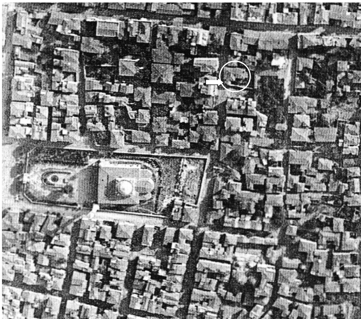
Εικ. 3. Θεσσαλονίκη. Η ευρύτερη περιοχή της Αγίας Σοφίας πριν από το 1917 σε αεροφωτογραφία του Γαλλικού Αεροναυτικού. Με βέλος δηλώνεται η θέση του βυζαντινού τοίχου της αφήγησης του Ντίνου Χριστιανόπουλου.

φραγμένο από τοίχο με αργολιθοδομή. Το τόξο αυτό πλαισιωνόταν αρχικά από δύο μικρότερα, τα οποία όμως καταστράφηκαν σε άγνωστη περίοδο συμπαράσφροντας και τα οριζόντια γείσα του τοίχου. Στη φωτογραφία φαίνεται ότι οι παραπάνω βλάβες αποκαταστάθηκαν με την ανάκτηση του δεξιού τόξου και των οριζόντιων γείσων από διπλή οδοντωτή ταινία. Το αριστερό τόξο δεν αποκαταστάθηκε: τμήμα της ενα-