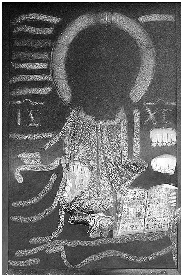
Εικ. 5. Θεσσαλονίκη. Αγίασμα του Προδρομίου. Ο Μέγας Σωτήρ από το ναΐδριο της αφήγησης του Ντίνου Χριστιανόπουλου.

Θεσσαλονίκης με τη μορφή του τρίλοβου ανοίγματος να αποτελέσαν προϊόν μιας τάσης για δημιουργία μνημειακών θολοσκεπών εισόδων στον περίβολο εκκλησιαστικών ιδρυμάτων με μορφολογικά στοιχεία δανεισμένα από τις εισόδους σε εξωνάρθηκες ναών.