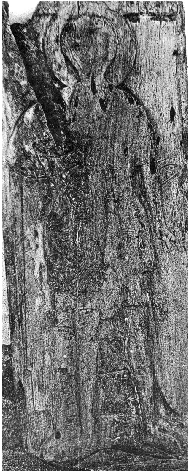
Εικ. 12. Λακκώματα Καστοριάς, ναός του Γενεσίου της Θεοτόκου. Ανάγλυφη εικόνα του αγίου Δημητρίου.