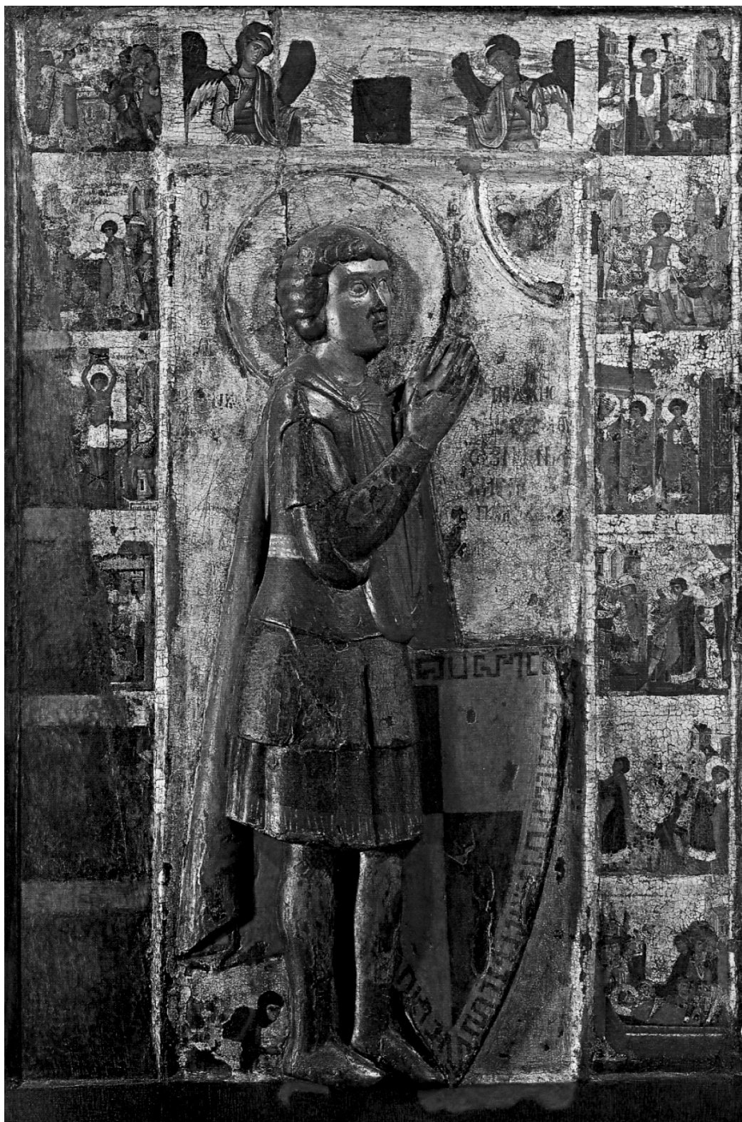
Εικ. 4. Αθήνα, Βυζαντινό και Χριστιανικό Μουσείο. Αμφιπρόσωπη εικόνα, κύρια όψη: ο άγιος Γεώργιος με σκηνές του βίου του.