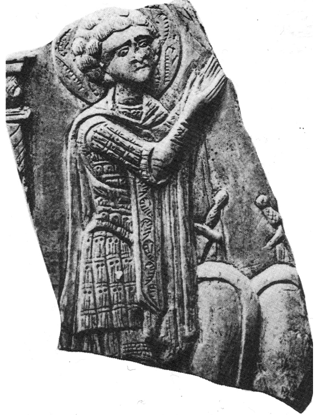
Εικ. 7. Κίβο, Μουσείο Ανατολικής και Δυτικής Τέχνης. Στρατιωτικός άγιος σε στεατίτη.

Οι ερευνητές εστιάζουν κυρίως την παρουσία στοιχείων της δυτικής τέχνης στην εικόνα του αγίου Γεωργίου στον τύπο της στρατιωτικής ενδυμασίας με τις δερμάτινες υψηλές μπότες, χωρίς τις βυζαντινές δρομίδες, στον μεταλλικό απλό θώρακα χωρίς τις φολίδες 38 , όπως και στο τριγωνικό σχήμα με τη θυρεόσχημη μορφή της ασπίδας, που μιμείται τις ασπίδες που έφεραν οι ιππότες των Σταυροφοριών 39 .