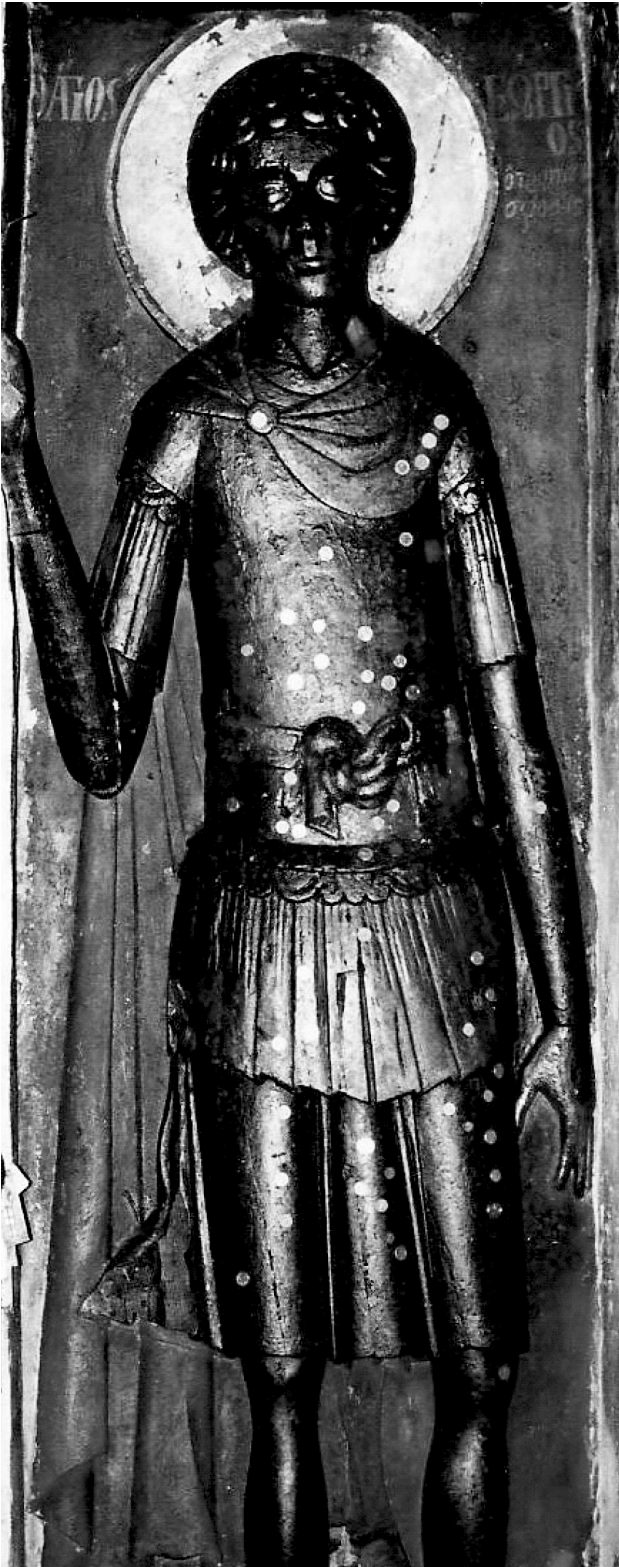
Εικ. 1. Ομοροφοκκλησιά Καστοριάς, ναός Αγίου Γεωργίου. Εικόνα – ξόανο του αγίου Γεωργίου.