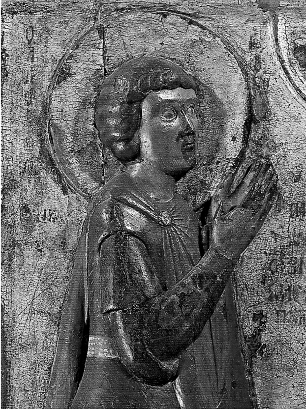
Εικ. 6. Η κεφαλή του αγίου Γεωργίου (λεπτομέρεια της Εικ. 4).