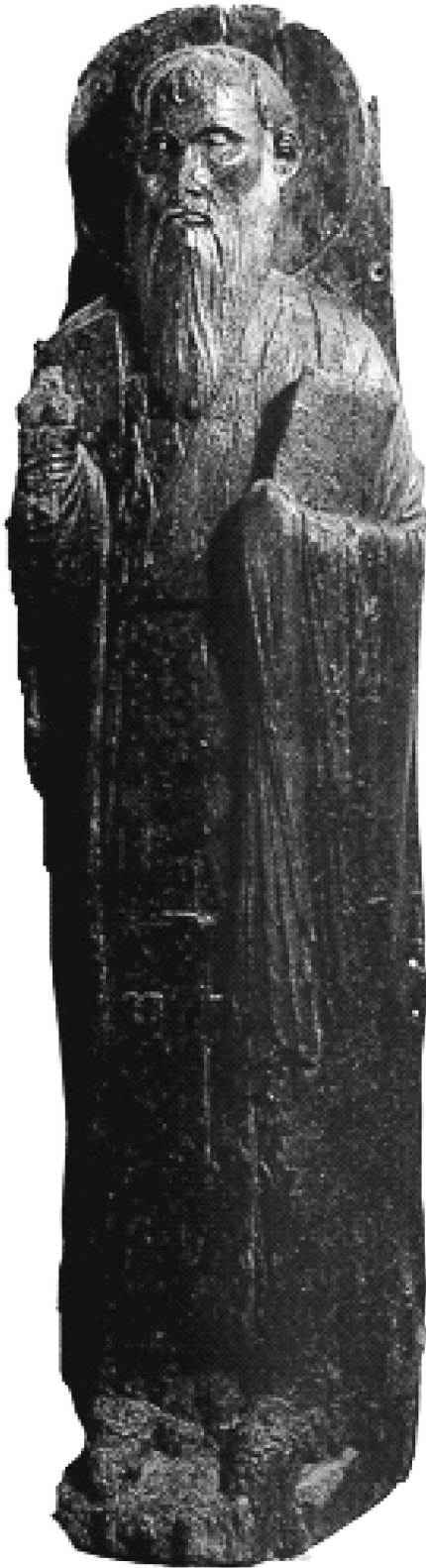
Εικ. 3. Αχρίδα, ναός του Αγίου Κλήμεντος. Εικόνα - ξόανο του αγίου Κλήμεντα Αχρίδος.

του κυρίως ναού, η οποία με βάση τεχνοτροπικά κριτήρια μπορεί να τοποθετηθεί στο τελευταίο τέταρτο του 13ου αιώνα 24 . Ενισχυτικό της άποψης αυτής είναι, μεταξύ άλλων, ότι στις τοιχογραφίες της πρώτης φάσης διακόσμησης του ναού έχουν επισημανθεί εικονογραφικοί τύποι συνήθεις και στη δυτική τέχνη, όπως είναι η ανθρωπόμορφη αγία Τριάδα 25 .