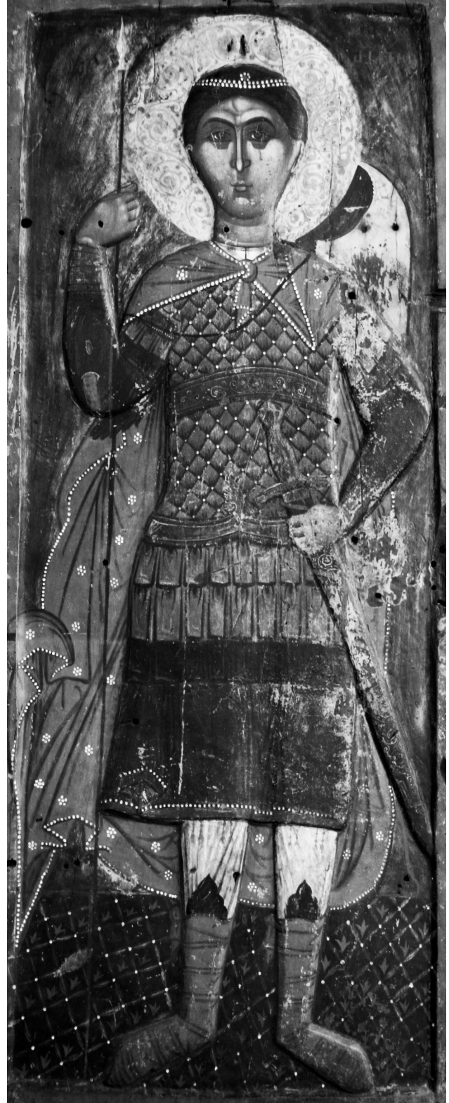
Εικ. 9. Ομορφοκκλησιά Καστοριάς, ναός Αγίου Γεωργίου. Ανάγλυφη εικόνα του αγίου Δημητρίου.

Στην εικόνα, που φιλοτεχνήθηκε σε μονοκόμματο ξύλο διαστάσεων 190×76×7 εκ. με έξοργο πλαίσιο, ο άγιος Δημήτριος αποδίδεται σε χαμηλό επίπεδο ανάγλυφο, πάχους 3 εκ., το οποίο προκύπτει από την αφαίρεση του βάθους. Πάνω στο επίπεδο ανάγλυφο της μορφής, με κοφτά περιγράμματα, αποδίδεται ζωγραφικά, χωρίς εγχαράξεις, ο άγιος Δημήτριος. Η τεχνική αυτή στην απόδοση του αναγλύφου διαφοροποιεί ριζικά την εικόνα του αγίου Δημητρίου της