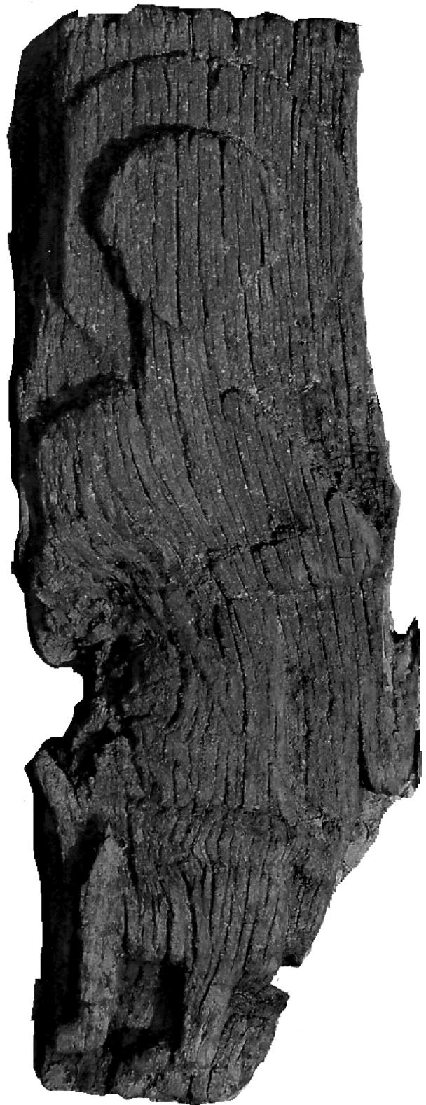
Εικ. 13. Ζευγοστάσι Καστοριάς, ναός της Κοιμήσεως της Θεοτόκου. Ανάγλυφη εικόνα αδιάγνωστου στρατιωτικού αγίου.