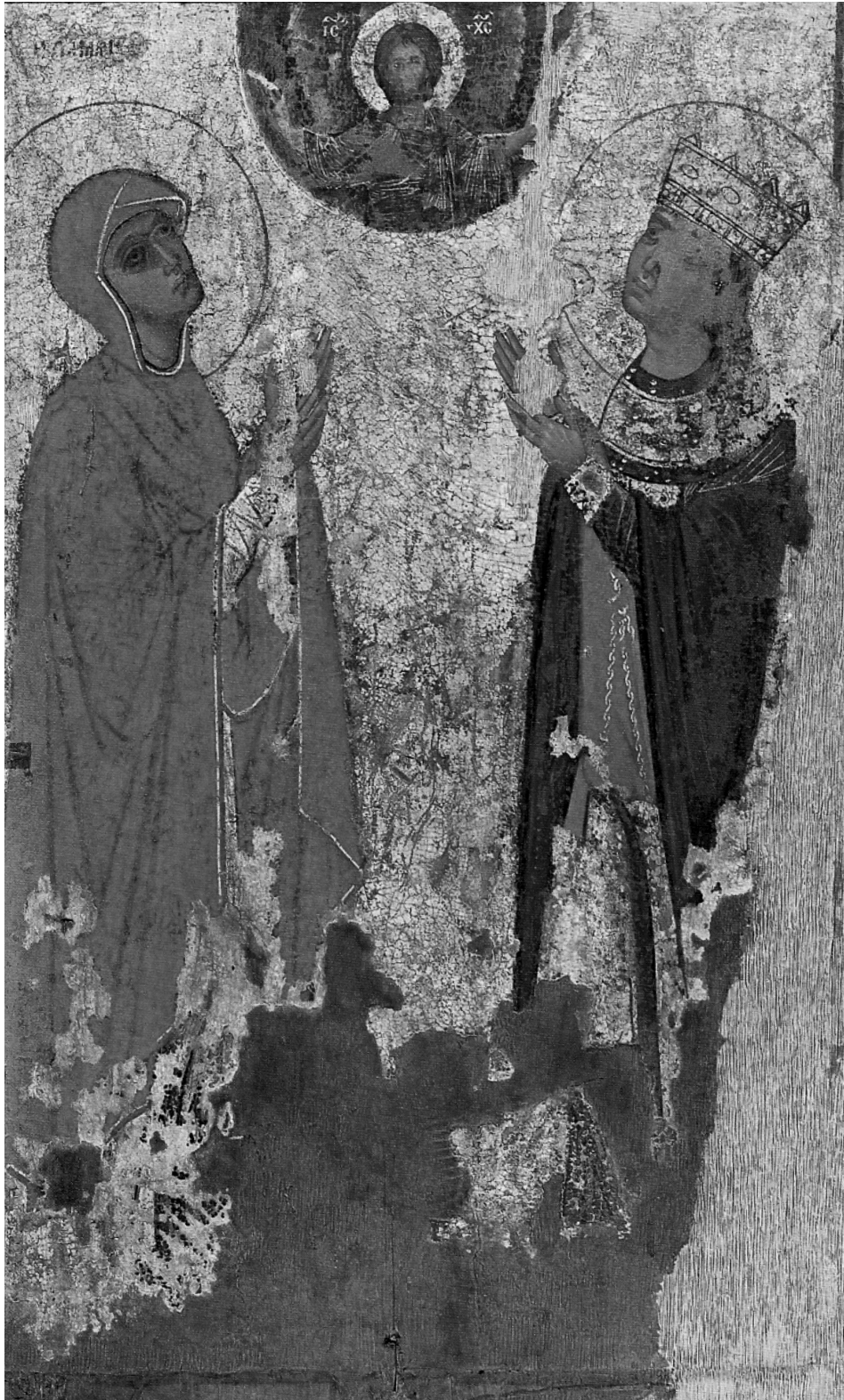
Εικ. 5. Αθήνα, Βυζαντινό και Χριστιανικό Μουσείο. Αμφιπρόσωπη εικόνα, δευτερεύουσα όψη: η αγία Μαρίνα και η αγία Ειρήνη ή Αικατερίνη.