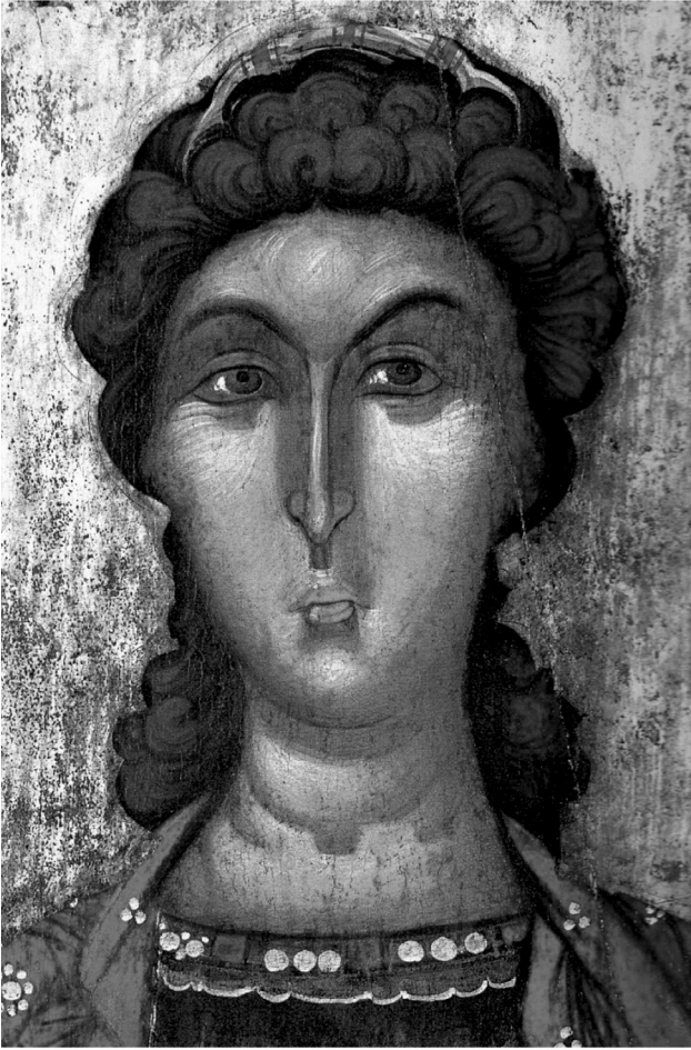
Εικ. 11. Αλβανία, Μουσείο Μεσαιωνικής Τέχνης Κορυτσάς. Εικόνα του αρχαγγέλου Μιχαήλ (λεπτομέρεια).

Η εικόνα έχει χρονολογηθεί παλαιότερα στο τέλος του 13ου με αρχές του 14ου αιώνα 65 . Ο Πέτκος και η Παρχαρίδου με βάση εικονογραφικές, τεχνικές και τεχνοτροπικές παρατηρήσεις χρονολογούν την εικόνα στο δεύτερο μισό του 14ου αιώνα και συνδέουν τη ζωγραφική της με εργαστήρια «της ευρύτερης περιοχής της Μακεδονίας, αλλά ιδιαίτερα της περιοχής της Καστοριάς» 66 . Αντίθετα, ο Σίσιου σε σύντομη αναφορά