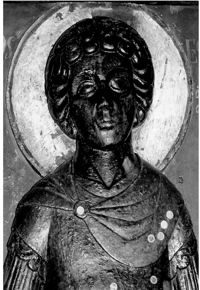
Εικ. 2. Η κεφαλή του αγίου Γεωργίου (λεπτομέρεια της Εικ. 1).

ναῶ 2 ξόανα ἐπεξεωγραφημένα ἀγίου Γεωργίου ὑπερμέγεθες, 3 μ. ὕψους καί ἀγίου Δημητρίου». Το 1923 ο Ν. Γιαννόπουλος αναφέρεται ἐν ὀλίγοις στήν εικόνα: «Ἀλλά τό σπουδαιότατον ἐν αὐτῷ (τόν ναό, δηλαδή, τοῦ Ἀγίου Γεωργίου) εἶναι ἀνάγλυφον τοῦ ἀγίου Γεωργίου ἐπί ξύλου, καθ' ὃ παρίσταται ὁ ἅγιος, ὄρθιος, ὀλόσωμος, ἐν ὕψος ὑπερφυσικόν 2,80 μ.» 11 . Ἀναλυτική περιγραφή τοῦ ξοάνου τοῦ ἀγίου Γεωργίου παρέχει ὁ Σωτηρίου, ὁ ὁποῖος σημειώνει χαρακτηριστικά