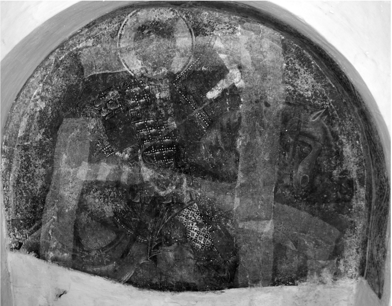
Εικ. 5. Ρόδος, Λάρδος, ναός της Παναγίας Καθολικής. Ο άγιος Νικήτας έφιππος.

τοιχογραφία του αγίου Γεωργίου στα Λαμπρά Ασκληπείου Ρόδου (αρχές 14ου αιώνα) 16 .