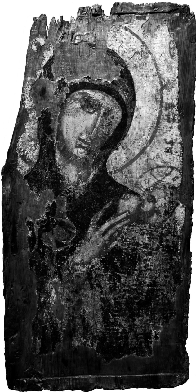
Εικ. 7. Ρόδος, Παλάτι Μεγάλου Μαγίστρου. Εικόνα της Παναγίας Γαλακτοτροφούσας.

Η εικόνα της Πάτμου, κρίνοντας αφενός από το θέμα της, τις διαστάσεις της και τη χρονολόγησή της, αφετέρου από τη χρονολόγηση του τοιχογραφικού διακόσμου του ναού του Αγίου Δημητρίου πιθανότατα μέσα στον 15ο αιώνα, φαίνεται πως παραγγέλθηκε εξ αρχής ως η εφέστια εικόνα του. Σε αυτό συνηγορούν και τα χαρακτηριστικά της αργυρής επένδυσής της, όπου στο βάθος και τα ενδύματα του αγίου κυριαρχούν τετράλοβα ανθέμια εγγεγραμμένα σε συμπλεκόμενους κύκλους, υποδεικνύοντας χρονολόγηση μέσα στον 15ο αιώνα 29 . Το αν η εικόνα φιλοτεχνήθηκε από το εργαστήριο που τοιχογράφησε τον ναό του Αγίου Δημητρίου ξεφεύγει από τους σκοπούς της παρούσης μελέτης, καθώς προϋποθέτει την ενδελεχή μελέτη των τοιχογραφιών. Δεν πρέπει, όμως, να ξενίζει η επιλογή ενός έργου ροδιακού από Πάτιμους πιθανώς δωρητές, με δεδομένες τις αδιάλειπτες ανά τους αιώνες σχέσεις μεταξύ των δύο νησιών αλλά και τον εκεί εντοπισμό τουλάχιστον μίας, μέχρι στιγμής, βυζαντινής ροδιακής εικόνας 30 .