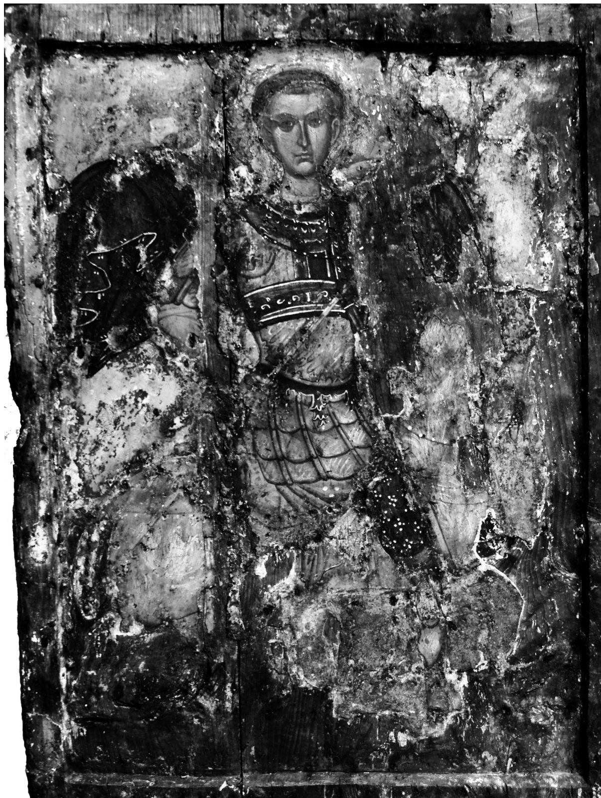
Εικ. 2. Πάτιμος, ναός του Αγίου Δημητρίου. Εικόνα του αγίου Δημητρίου έφιππου (μετά τη συντήρηση).