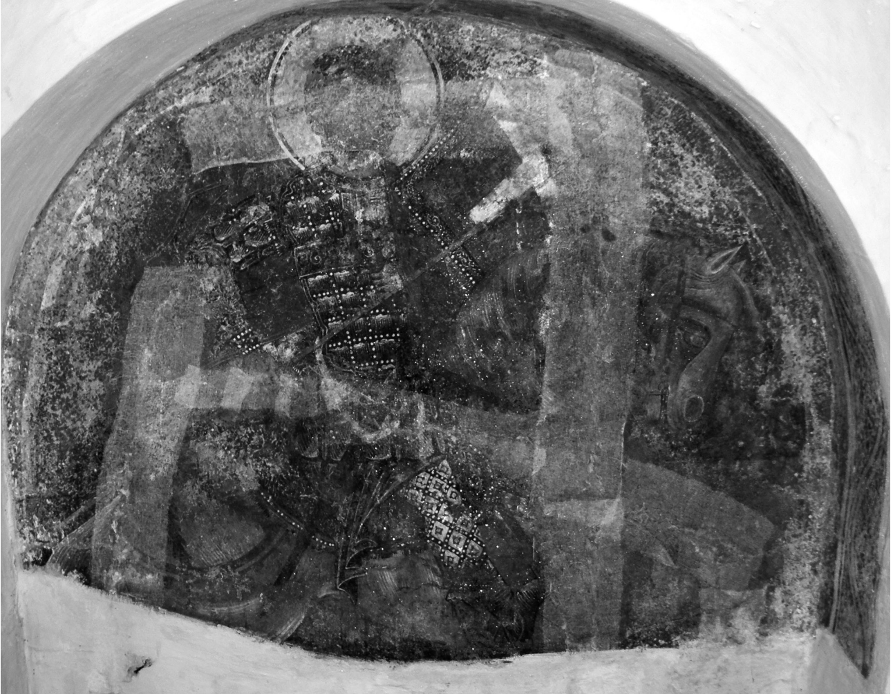
Εικ. 5. Ρόδος, Λάρδος, ναός της Παναγίας Καθολικής. Ο άγιος Νικήτας έφιππος.

τοιχογραφία του αγίου Γεωργίου στα Λαμπρά Ασκληπείου Ρόδου (αρχές 14ου αιώνα) 16 .