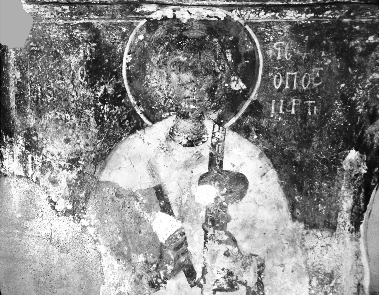
Εικ. 4. Ρόδος, Πεύκοι (Λίνδος), ναός του Αγίου Ιωάννη του Μερογλίτη. Ο άγιος Στέφανος.

ζονται στα αδιόρατα, λεπτά φωτίσματα του διακόνου. Στην τοιχογραφία του έφιππου στρατιωτικού αγίου Νικήτα, από το αρκοσόλιο του βόρειου τοίχου της Παναγίας της Καθολικής στη Λάρδο 14 (Εικ. 5), των μέσων περίπου του 15ου αιώνα, ακολουθείται η ίδια εικονογραφία με την εικόνα μας. Οι θερμοί χρωματικοί τόνοι εδώ κυριαρχούν, με τη χρήση του ερυθρού, εκτός από το άλογο και την ιπποσκευή, στον μανδύα και την ασπίδα. Στην όμοια στάση και αντίληψη της όλης σύνθεσης, με μικρές επιμέρους διαφοροποιήσεις ως προς την πολυτελέστερη εξάρτηση του αγίου Νικήτα,