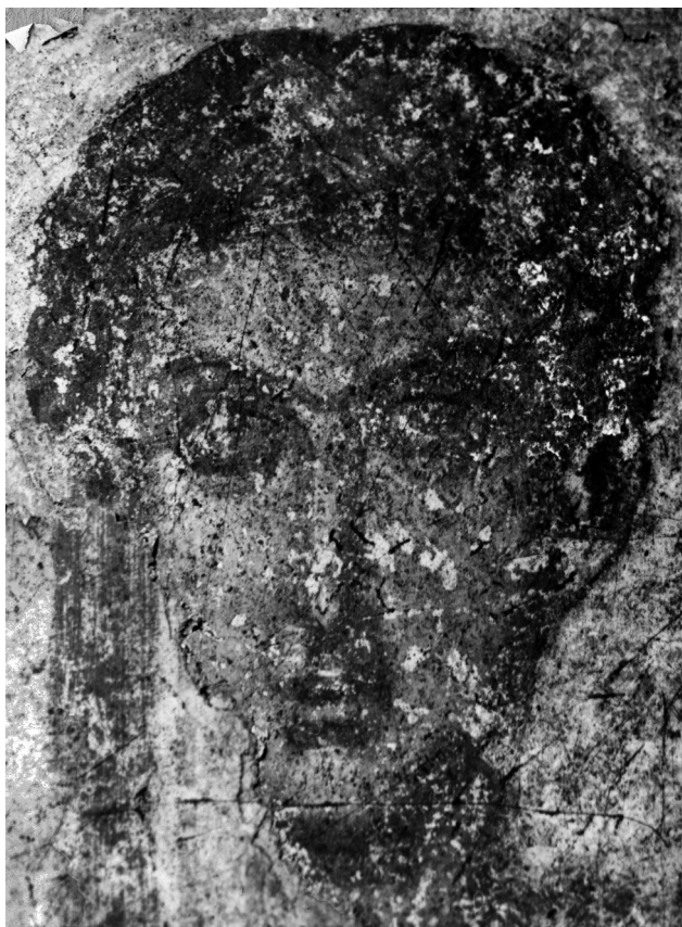
Εικ. 6. Ρόδος, μεσαιωνική πόλη, ναός του Αγίου Σπυρίδωνα. Ο άγιος Δημήτριος (λεπτομέρεια).

της Ρόδου, την πιθανότητα της προσγραφής της σε εργαστήριο ή ζωγράφο του νησιού ενισχύει η σύγκρισή της με ένα φορητό έργο, προερχόμενο από ναό της πρωτεύουσας του νησιού. Πρόκειται για την προαναφερθείσα εικόνα της Παναγίας Γαλακτοτροφούσας, ευρισκόμενη σήμερα στην έκθεση του Παλατιού του Μεγάλου Μαγίστρου στη Ρόδο (Εικ. 7) 25 . Η αντιπαραβολή της εικόνας αυτής με την αντίστοιχη του αγίου Δημητρίου, τόσο ως προς τα τεχνοτροπικά χαρακτηριστικά, το πλάσιμο και τα φωτισμάτα, αλλά και ως προς την επιλογή του ωχροκίτρινου κάμπου, οδηγεί αναπόφευκτα στην αναχρονολόγησή της στα