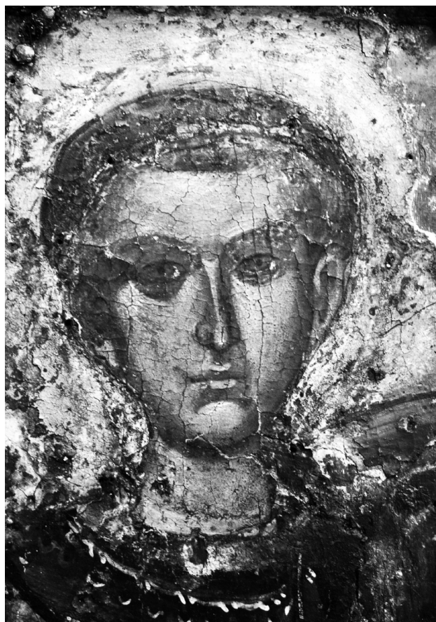
Εικ. 3. Άγιος Δημήτριος (λεπτομέρεια της Εικ. 2).

Η τέχνη που απηχείται στην εικόνα μας μπορεί να ανιχνευθεί σε παραδείγματα της μνημειακής, κυρίως, ζωγραφικής της Ρόδου. Με την τοιχογραφία του αγίου Στεφάνου από το ιερό του ναού του Αγίου Ιωάννη του Μερογλίτη στους Πεύκους 13 (Εικ. 4), των τελών του 14ου ή των αρχών του 15ου αιώνα, η εικόνα μας συγκλίνει τόσο ως προς το σχήμα του προσώπου με τα νεανικά χαρακτηριστικά όσο και ως προς το ύφος και τις τονικές αντιθέσεις μεταξύ σκιασμένης και φωτισμένης σάρκας. Οι μεταξύ τους διαφορές περιορί-