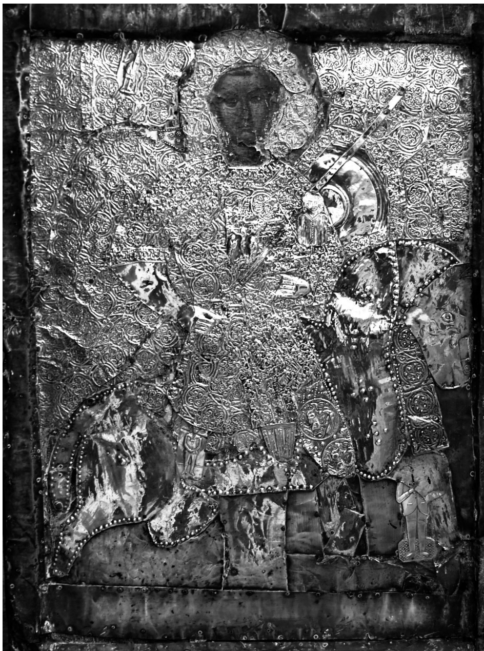
Εικ. 1. Πάτιος, ναός του Αγίου Δημητρίου. Εικόνα του αγίου Δημητρίου έφιππου (πριν από τη συντήρηση).

στο μεγαλύτερο μέρος του κατώτατου τμήματος της εικόνας, περιμετρικά του σημείου ένωσης των δύο σανίδων, στο αριστερό χέρι του αγίου, στην ασπίδα του και στο κεφάλι του αλόγου.