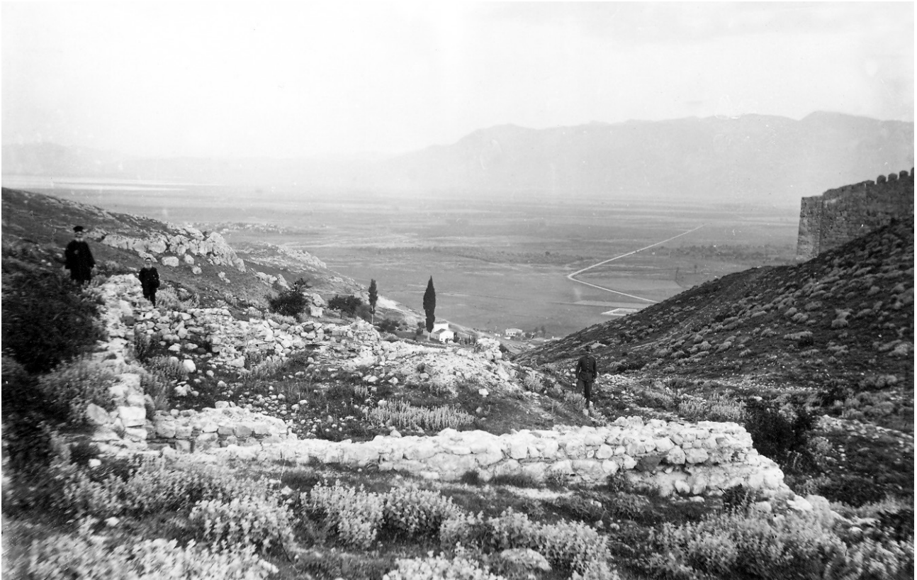
Εικ. 2. Φωτογραφία των ερειπίων της χαμένης σήμερα «Επισκοπής» Ζητουνίου. Ως ανθρώπινες κλίμακες ο Λαμπάκης έχει τοποθετήσει στον χώρο δύο ιερωμένους και έναν χωροφύλακα (Απρίλιος 1904).

μετέφερε από τη Στυλίδα στον Βόλο 46 , κατά την οποία χάθηκαν αποσκευές επιβατών –ίσως και οι δικές του, με τις σημειώσεις του.