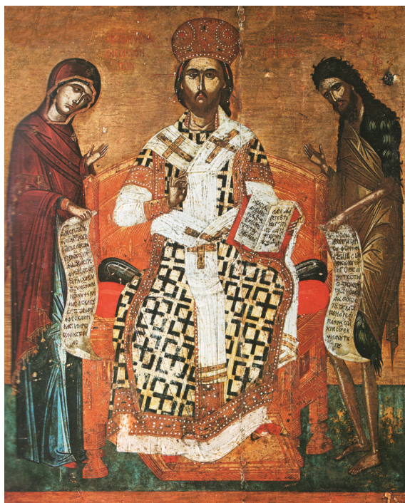
Fig. 13. Patmos. Icône de la Déisis c. 1600-1610.