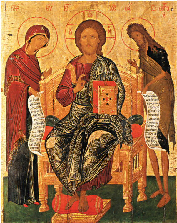
Fig. 11. Athènes, musée Byzantin. Icône de la Déisis, c.1500.