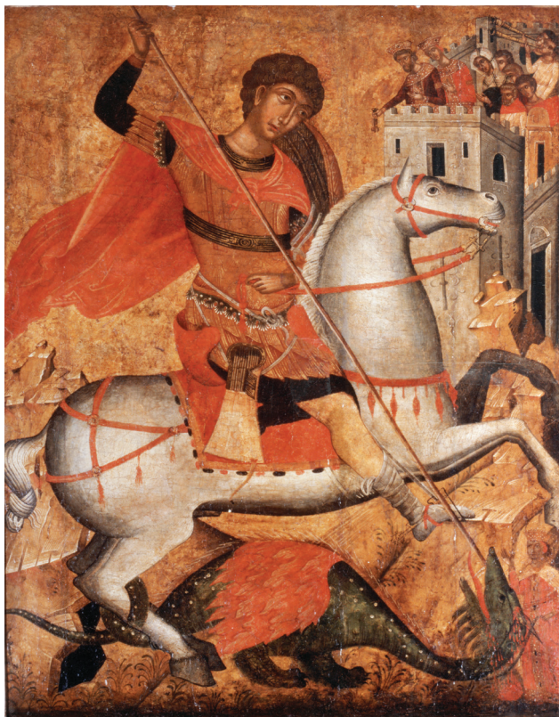
Fig. 4. Venise, collection privée. Icône de Saint Georges, milieu du XV e siècle.