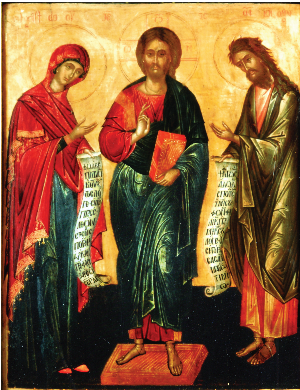
Fig. 7. Strasbourg, musée de l'Œuvre Notre-Dame. Icône de la Déisis, milieu du XVIe siècle.