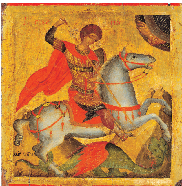
Fig. 2. Athènes, musée Benaki. Icône de Saint Georges, peintre Angelos, première moitié du XVe siècle.