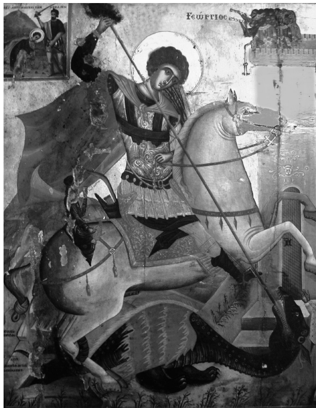
Fig. 5. Siphnos, Saint-Georges Aphantis. Icône de saint Georges, peintre Zacharias Tzankaropoulos, 1635.

de 1630, incrustée sur la façade au-dessus de la porte d'entrée de la même église (Fig. 6) 23 .