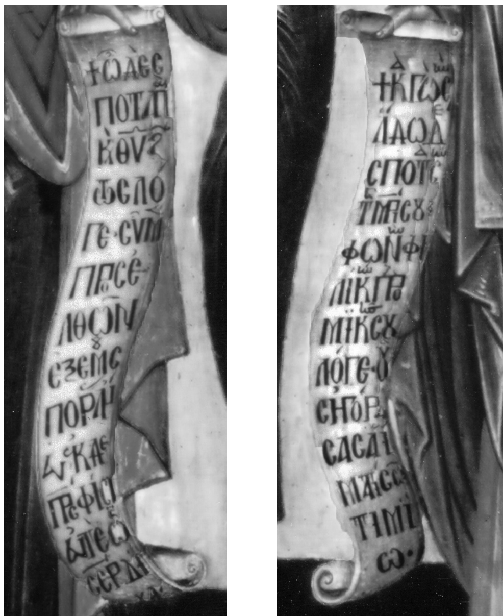
Fig. 8. Strasbourg, musée de l' Œuvre Notre-Dame. Icône de la Déisis (détail).

avec élégance des accents, des esprits, des ligatures et quelques lettres en minuscule, intercalées discrètement dans le texte, alors que le début de la prière est précédé d'une croix (Fig. 8).