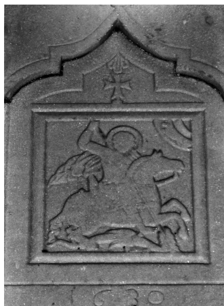
Fig. 6. Siphnos, Saint-Georges Aphantis. Icône en marbre, saint Georges, 1630.

Il faut enfin signaler que le cheval sur l'icône de Strasbourg, alors qu'il est bien ajusté en largeur dans l'encadrement, semble pourtant légèrement décroché de l'espace physique, puisque ses pieds arrière ne sont pas disposés conformément aux pentes du sol. Bien que sur la plupart des exemples déjà mentionnés le cheval soit très attentivement adapté au paysage, comme sur l'icône d'Angelos du musée Benaki (Fig. 2), il y a d'autres exemples de haute qualité comme les icônes de Corfou de la fin du XV e siècle (Fig. 3) et de la collection privée de Venise (Fig. 4) marquées par une négligence à ce sujet, observée également sur l'icône de Tzankaropoulos de Siphnos (1635) (Fig. 5).