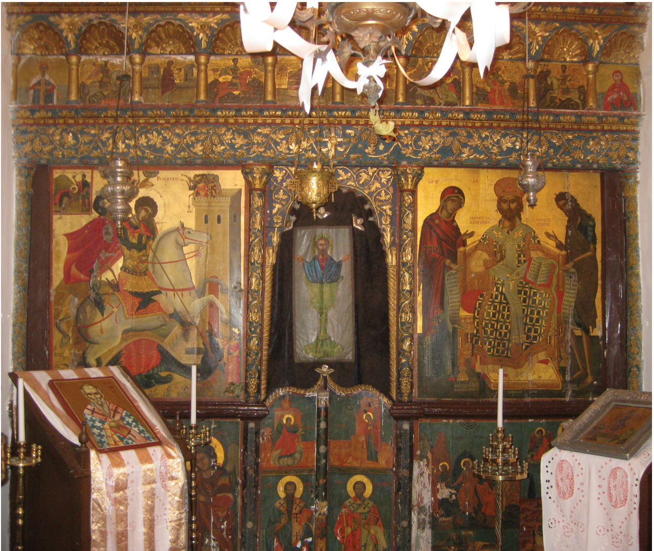
Fig. 15. Siphnos. Templon de Saint-Georges Aphantis 1635.

rouleaux dépliés avec des inscriptions, où le Christ trônant au centre est vêtu du costume de Grand Archiprêtre, tenant l'évangile ouvert avec l'inscription appropriée, comme sur une icône à Patmos datée vers 1600-1610 (Fig. 13) 45 qui se rapproche par ses dimensions (47×38 cm)