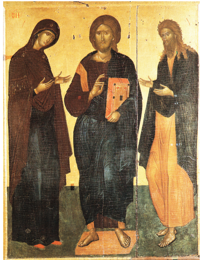
Fig. 9. Crète, Moni Odigitrias. Icône de la Déisis, c.1400.

Le sujet de la Déisis où la Vierge et saint Jean, tournés en prière vers le Christ, tiennent des rouleaux avec inscriptions, est assez répandu sur les fresques qui décorent la conque de l'abside ou bien d'autres parties des