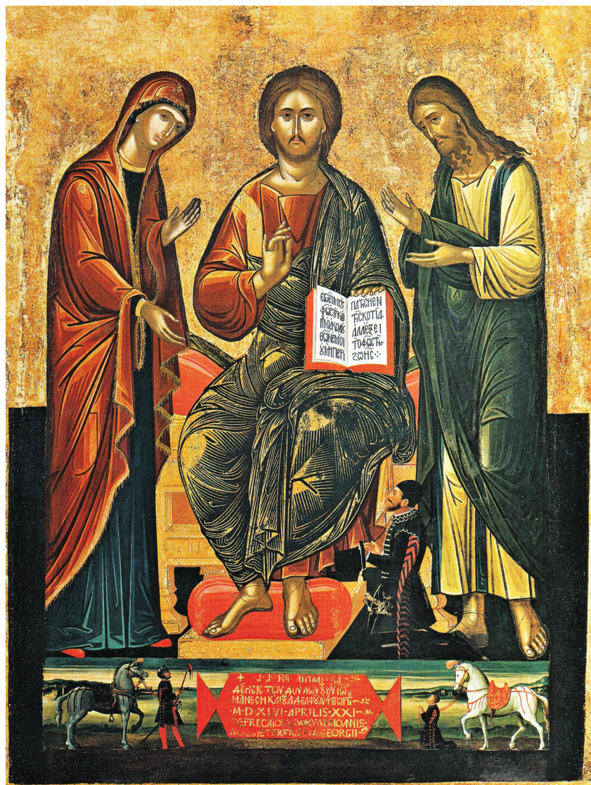
Fig. 10. Venise, église de Saint-Georges des Grecs. Icône de la Déisis, donateurs frères Manassis, Venise 1546.

sur un piédestal comme sur notre icône 34 (Fig. 9). Sur une autre icône de la Déisis, datant du début du XVI e siècle, au musée de Princeton, nous trouvons encore un exemple de cette iconographie 35 . Des variantes de ce type