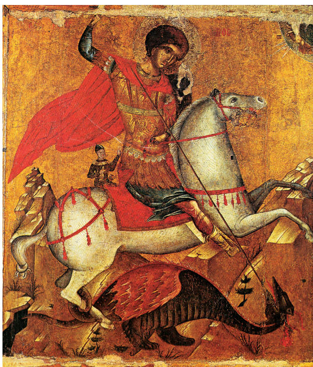
Fig. 3. Corfou, musée de l'Antivouniotissa. Icône de Saint Georges, c. 1500.

icônes, l'armement du saint sur l'icône de Strasbourg est enrichi par un arc accroché ensemble avec un carquois rempli de flèches, sur la selle du cheval derrière le dos du saint. Finement dessinés, ces éléments apparaissent également sur d'autres représentations où le saint cavalier est représenté en parade, comme sur les fresques de l'église de Prassès Kydonias en Crète (première moitié du XVe siècle) et l'icône de Lithines, en Crète (milieu XVe siècle) 18 , ainsi que sur une autre icône du Musée de la ville de la Canée, datée vers 1500 19 , où saint Georges est représenté terrassant le dragon, comme sur notre icône. Nous retrouvons le même équipement du saint sur une série d'icônes où l'iconographie est enrichie par certains détails narratifs, comme la princesse libérée devant la tour du palais et le jeune esclave libéré monté sur le dos du cheval, comme sur l'icône d'une collection privée de Venise datée vers le milieu du XVe siècle 20 (Fig. 4). Une autre icône du peintre crétois Zacharias Tzankaropoulos 21 (108×91cm), signée et datée de 1635, sur le templon de l'église de saint Georges Aphantis au quartier de Hagios Loukas d'Artémonas, à Siphnos 22 (Fig. 5), offre un exemple représentatif de la diffusion du même modèle parmi les peintres crétois du XVIIe siècle. En plus, il est intéressant de noter que la formule iconographique simple du saint cavalier tuant le dragon se trouve également sculptée en relief sur une plaque de marbre datée