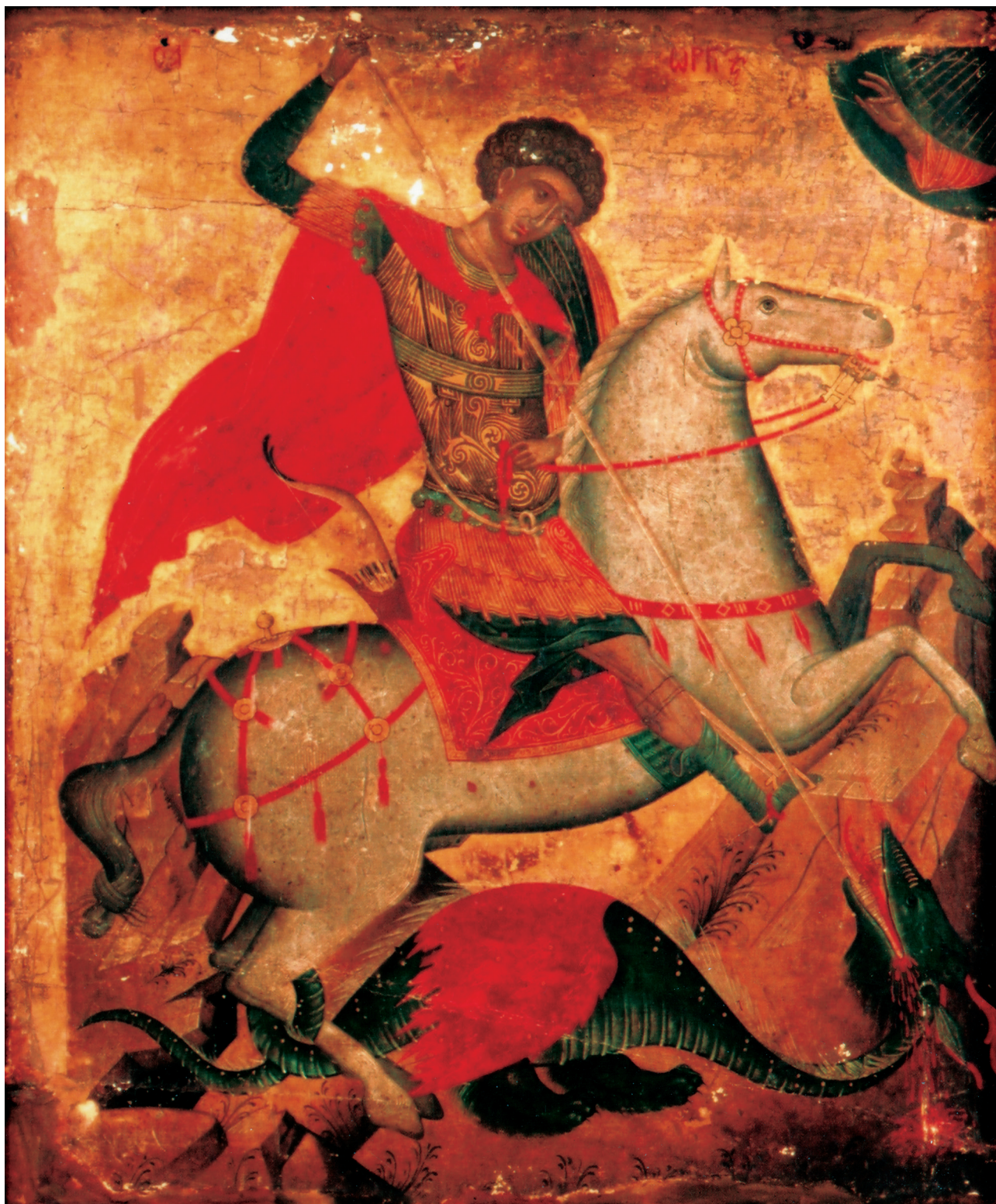
Fig. 1. Strasbourg, musée de l'Œuvre Notre-Dame. Icône de Saint Georges, deuxième moitié du XVe siècle.