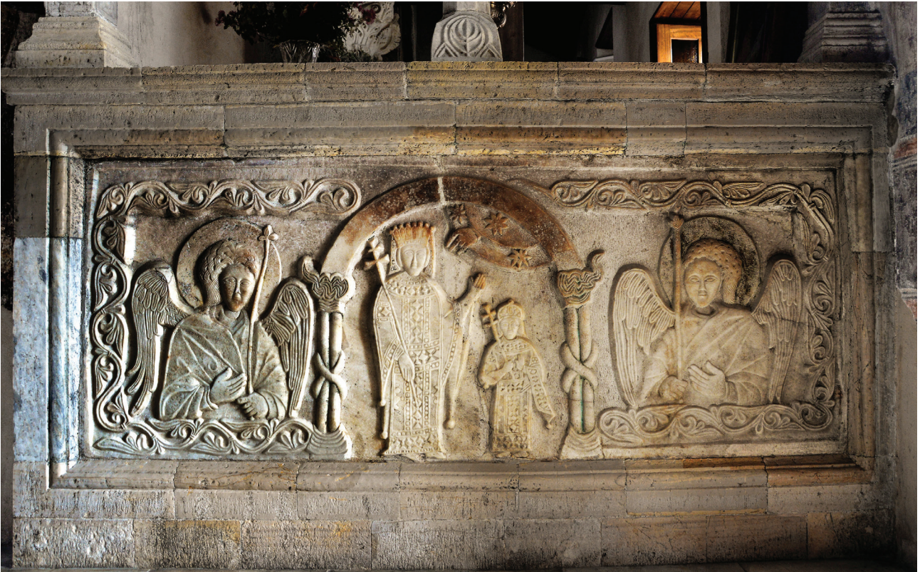
Εικ. 1. Ναός της Αγίας Θεοδώρας στην Αρτα. Η ψευδοσαρκοφάγος στο ταφικό μνημείο της οσίας Θεοδώρας.

μοναστήρια που ίδρυσε ο δεσπότης Μιχαήλ Δούκας, «τῷ μεγαλομάρτυρι καὶ αὐτῇ Γεωργίῳ θεῖον ἀνήγειρε σεμνεῖον, καὶ εἰς γυναικεῖον τοῦτο συνεστήσατο». Εκεί αποσύρθηκε η βασίλισσα ευθύς μετά τον θάνατο του συζύγου της. Με το πλήρωμα του χρόνου, η μοναχή Θεοδώρα «χαίρουσα τὸ πνεῦμα εἰς χεῖρας Θεοῦ παρέθετο· καὶ κατετέθη ἐν αὐτῇ τῇ παρ' αὐτῆς ἀνεγερθεῖση μονῇ», η οποία τιμήθηκε κατόπιν στο όνομα της αγίας. Από στοιχεία που προέκυψαν τελευταία ορίζεται ότι η Θεοδώρα απεβίωσε μετά το 1282/83 7 .