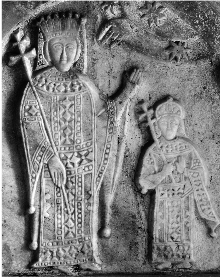
Εικ. 2. Βασίλισσα και δεσπότης της Άρτας. Λεπτομέρεια της Εικ. 1.

του μικρού Θωμά, η ηλικία του οποίου ταιριάζει με του παρισταμένου δεσπότη 10 .