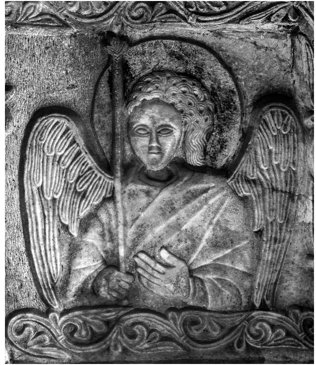
Εικ. 4. Αρχάγγελος. Λεπτομέρεια της Εικ. 1.

της Άννας με τον Θωμά, μάλιστα με την τοποθέτηση, καίτοι ασυνήθιστη 12 , της γλυπτής πλάκας στο ταφικό μνημείο της αοίδιμης Θεοδώρας, τόνιζε τη νομιμότητα της εξουσίας της βυζαντινής πριγκίπισσας και υποστήριζε τα αδιαπραγμάτευτα δικαιώματα του ανήλικου Θωμά στην επικράτεια της Ηπείρου. Ο κίνδυνος ήταν παρών εξαιτίας των εδαφικών διεκδικήσεων και της αξίωσης για την υποτέλεια του Θωμά που προέβαλλε ο Φίλιππος του Τάραντος, γιος του Καρόλου Β΄ του Ανδηγαυικού, κατόπιν των όσων είχαν συμφωνηθεί με τον Νικηφόρο της Άρτας κατά τον γάμο της θυγατέρας του Θάμαρ με τον Φίλιππο το 1294.