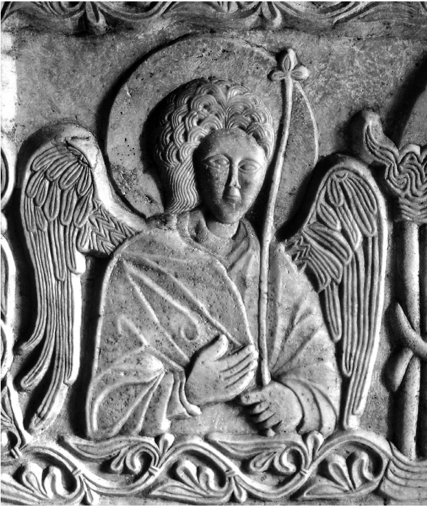
Εικ. 3. Αρχάγγελος. Λεπτομέρεια της Εικ. 1.