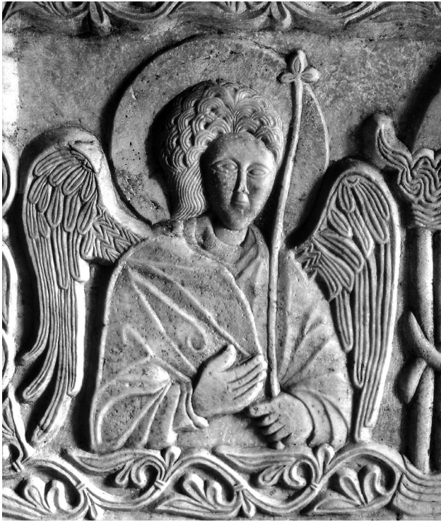
Εικ. 3. Αρχάγγελος. Λεπτομέρεια της Εικ. 1.