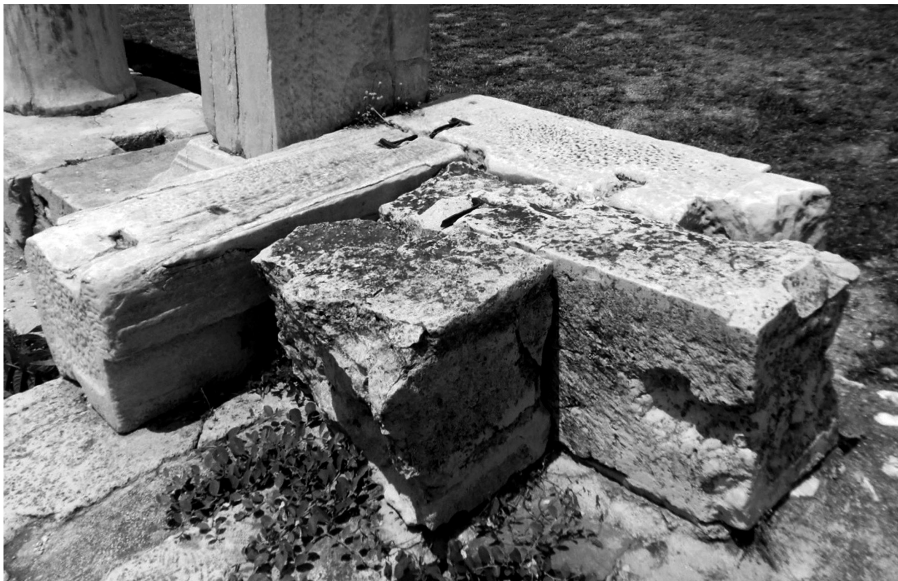
Εικ. 3. Αθήνα, Βιβλιοθήκη του Αδριανού. Τετράκογχο, τοιχοδομία στην νοτιοανατολική γωνία.