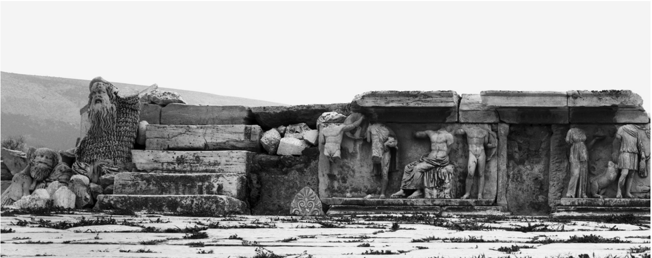
Εικ. 1. Αθήνα, Θέατρο του Διονύσου Ελευθερέως. Το Βήμα του Φαίδρου.

που ακολούθησαν 22 . Τα μνημεία που χρονολογούνται σε αυτήν την εποχή, ενισχύουν σημαντικά την παραπάνω υπόθεση.