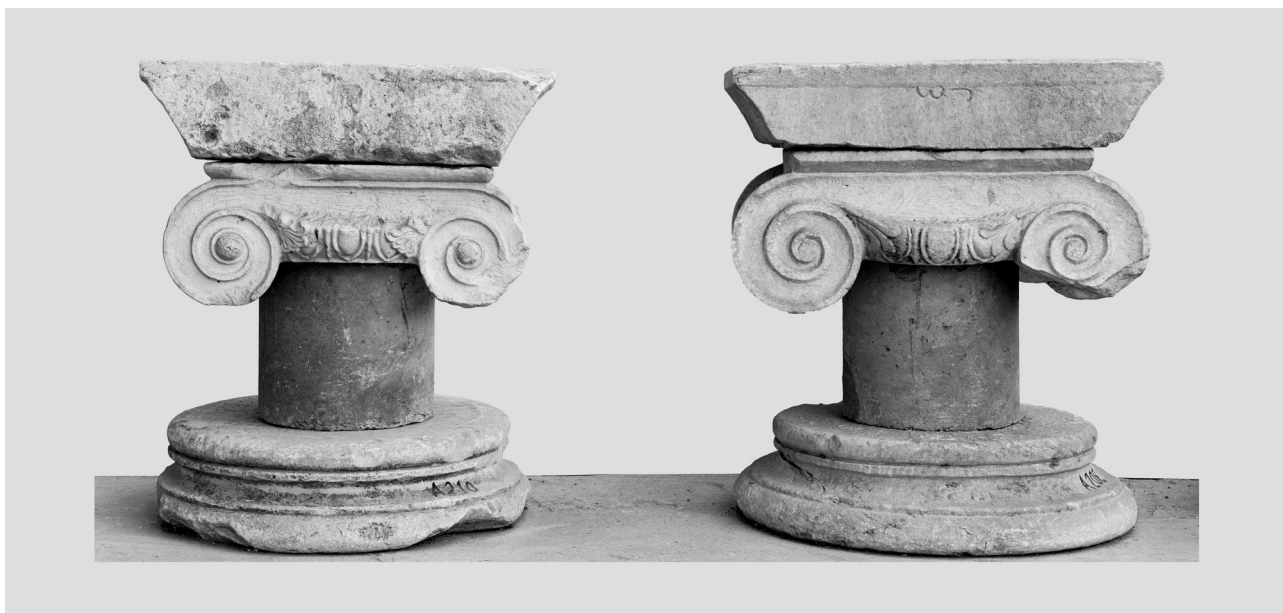
Εικ. 7. Αθήνα, Κεραμεικός. Οδός με κιονοστοιχίες (Hallenstraße), αρχιτεκτονικά μέλη.

Όλα τα παραπάνω συμφωνούν με την συστηματική χρήση σπολίων, δηλαδή το νέο σχήμα οργάνωσης των εργασιών που εισάγεται δυναμικά στην αυτοκρατορία μετά την οικονομική συρρίκνωση του 3ου αιώνα. Στην Ρώμη ο Arcus Novus (303;) και το Τόξο του Κωνσταντίνου (315) αποτελούν αντιπροσωπευτικά μνημεία αυτής της τάσης 45 . Η αύξηση των οικοδομικών προγραμμάτων μέσα στον 4ο αιώνα, την οποία απεικονίζει παραστατικά ο ψηφοθέτης στο δάπεδο από το Qued Ramel της Τυνησίας 46 , συνδέεται με αλλαγές