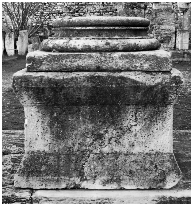
Εικ. 5. Αθήνα, Βιβλιοθήκη του Αδριανού. Ανατολική κιονοστοιχία περιστυλίου, βάθρο.