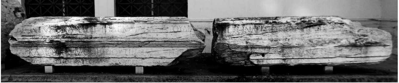
Εικ. 2. Αθήνα, Εθνικό Αρχαιολογικό Μουσείο. Τμήματα επιστυλίου από το Διογένειον (:). Αριθ. ευφ. Δ 95-96 (ΕΑΜ ©ΥΠΠΟΑ/ΤΑΠΑ).

σφραγίδα που δήλωνε τον έπαρχο του Ιλλυρικού, κατ' εντολή του οποίου συγκεντρώθηκαν μέλη από διαλυμένα κτήρια της πόλης και στην κατοχή του οποίου αυτά τα μέλη περιήλθαν. Η ταύτιση του επάρχου του μονογράμματος με τὸν θεσμῶν ταμίην Ἐρκοῦλιον, ἄγνὸν ὕπαρχον της επιγραφής στο Πρόπυλο της Βιβλιοθήκης (χρονολογημένης μεταξύ 408-410) 32 , ανοίγει εκ νέου την συζήτηση γύρω από τον χορηγό, την χρονολόγηση και την αρχική χρήση αυτού του περιεκτεντρού κτηρίου της Αθήνας 33 .