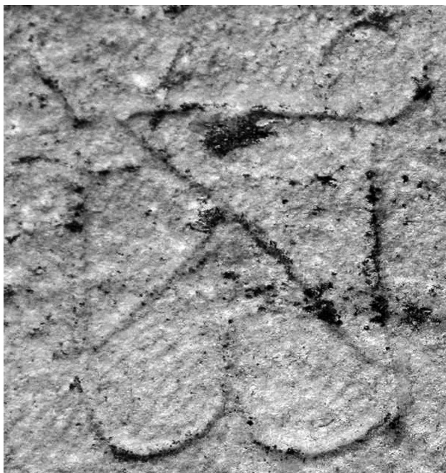
Εικ. 4. Αθήνα, Βιβλιοθήκη του Αδριανού. Τετράκογχο, μονόγραμμα στο κατώφλι της εισόδου.