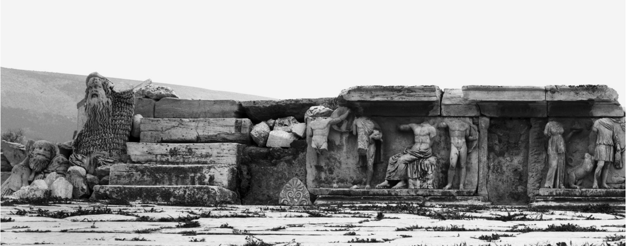
Εικ. 1. Αθήνα, Θέατρο του Διονύσου Ελευθερέως. Το Βήμα του Φαίδρου.

που ακολούθησαν 22 . Τα μνημεία που χρονολογούνται σε αυτήν την εποχή, ενισχύουν σημαντικά την παραπάνω υπόθεση.