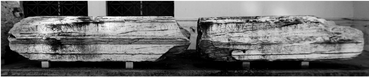
Εικ. 2. Αθήνα, Εθνικό Αρχαιολογικό Μουσείο. Τμήματα επιστυλίου από το Διογένειον (:). Αριθ. ευφ. Δ 95-96.

σφραγίδα που δήλωνε τον έπαρχο του Ιλλυρικού, κατ' εντολή του οποίου συγκεντρώθηκαν μέλη από διαλυμένα κτήρια της πόλης και στην κατοχή του οποίου αυτά τα μέλη περιήλθαν. Η ταύτιση του επάρχου του μονογράμματος με τὸν θεσμῶν ταμίην Ἐρκοῦλιον, ἄγνὸν ὕπαρχον της επιγραφής στο Πρόπυλο της Βιβλιοθήκης (χρονολογημένης μεταξύ 408-410) 32 , ανοίγει εκ νέου την συζήτηση γύρω από τον χορηγό, την χρονολόγηση και την αρχική χρήση αυτού του περιεχόμενου κτηρίου της Αθήνας 33 .