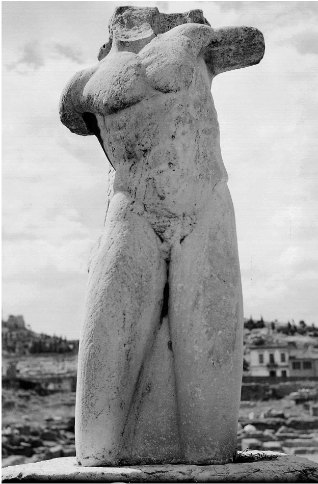
Εικ. 6. Αθήνα, Αρχαία Αγορά. Ανάκτορο των Γιγάντων, Γίγας.

ύψος της μύτης του Γίγαντος, οδηγεί στην σκέψη ότι αυτή υπαγορεύθηκε από τις διαστάσεις του μαρμάρου (τουλάχιστον 2,47 μ. σε ύψος) που είχαν στην διάθεσή τους οι γλύπτες 38 . Σε αυτό το πλαίσιο αξίζει να σημειωθεί ότι η πλειονότητα των βάθρων αγαλμάτων στην Αθήνα της ύστερης αρχαιότητας, ξεκινώντας από αυτό του Δεξιππου (περίπου 270), σώζουν ίχνη επανάχρησης 39 , ενώ η απουσία κορμών αγαλμάτων στην