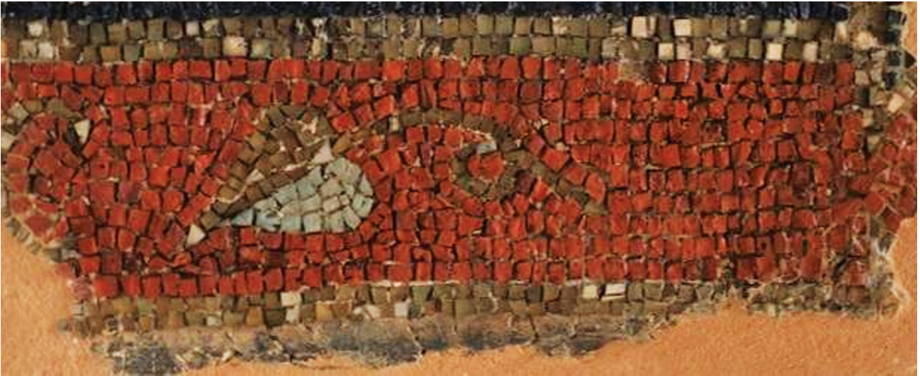
Εικ. 7. Θεσσαλονίκη, Αχειροποίητος. Φύλλο κισσού στην απόληξη του πρώτου στίχου της επώνυμης επιγραφής, βλ. Εικ. 4.

δωρητών να λάβουν την ευλογία του Θεού. Η αντικατάσταση του ονόματος από τη φράση οὗ οἶδεν ὁ Θεὸς τὸ ὄνομα , με την οποία διατηρείται η ανωνυμία του δωρητή, είναι ιδιαίτερα συνήθης την ίδια περίοδο, καθώς με αυτόν τον τρόπο εκφράζεται η ταπεινότητα του χριστιανικού ιδεώδους 20 . Ανάλογες αφιερωματικές επιγραφές, τόσο επώνυμων όσο και ανώνυμων δωρητών, απαντούν συχνά στα εντοίγια ψηφιδωτά ναών της Θεσσαλονίκης. Ο τύπος της ανώνυμης επιγραφής εντοπίζεται στο πρωτοβυζαντινό ψηφιδωτό του τεταρτοσφαιρίου της αψίδας του καθολικού της μονής Λατόμου 21 , δύο φορές στο πρώτο και το τέταρτο