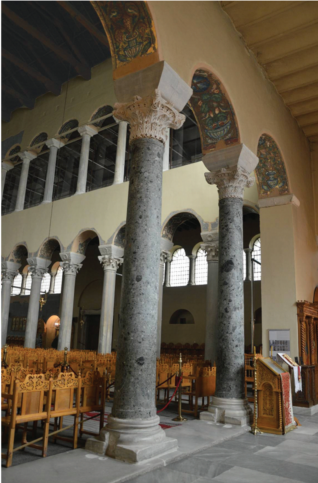
Εικ. 2. Θεσσαλονίκη, Αχειροποίητος. Το τρίβηλο της βασιλείου πύλης, άποψη από τα βορειοδυτικά.