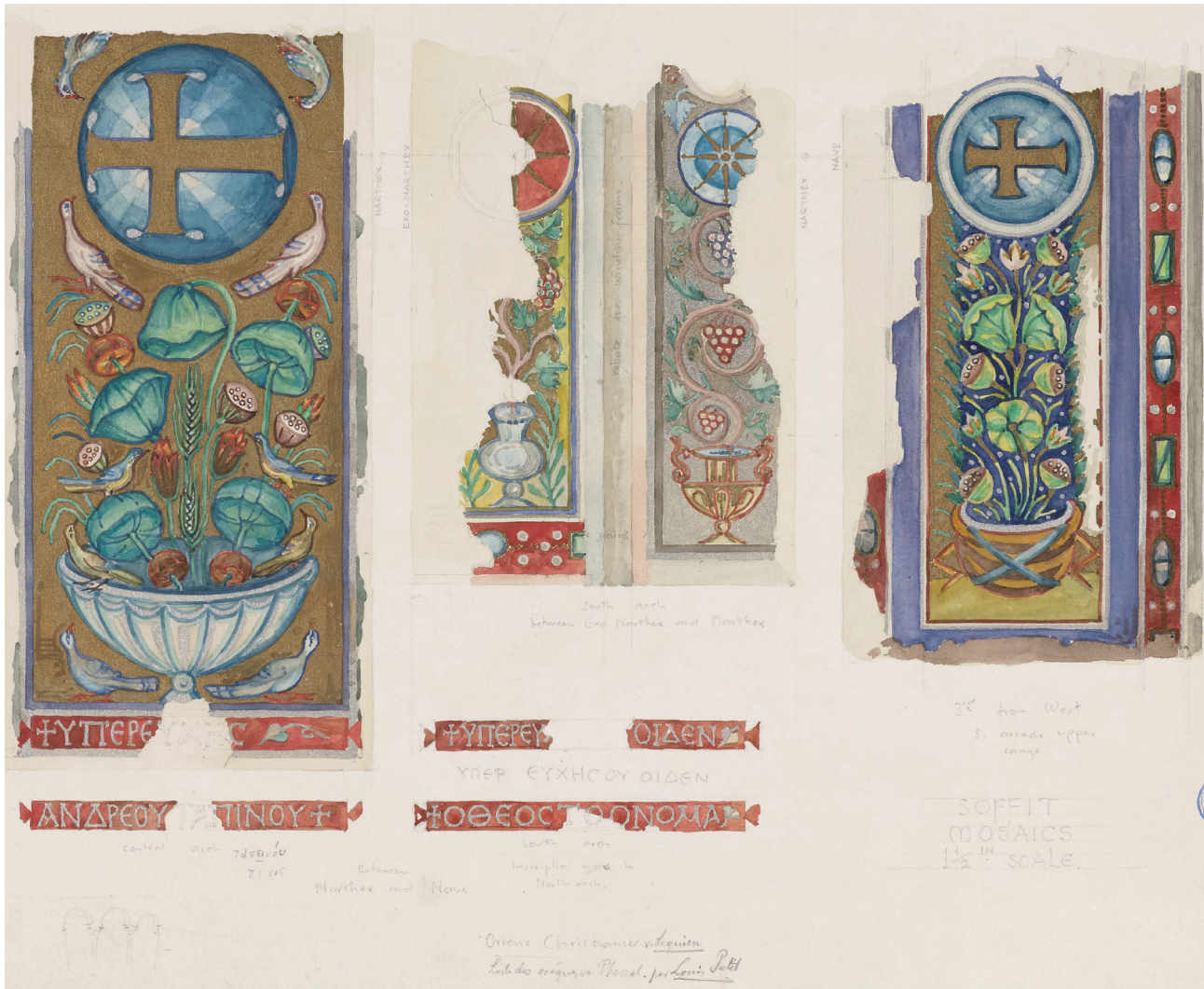
Εικ. 6. Υδατογραφία του W. S. George, που εικονίζει ψηφιδωτά από εσωράχια τόξων της Αχειροποιήτου: του τριβήλου (κεντρικό και νότιο τόξο) με τις αφιερωματικές επιγραφές (αριστερά), του παραθύρου του νάρθηκα (κέντρο επάνω), του νότιου υπερώου (δεξιά). Μολύβι και υδρόχρωμα σε χαρτί, 1909, βλ. Εικ. 3-5.

των γραμμάτων, με ψηφίδες που έφεραν φύλλο αργύρου επί ερυθρού φόντου, παραπέμπει στην επιγραφή του εντοίχιου ψηφιδωτού της αψίδας του καθολικού της μονής Λατόμου (Όσιος Δαυίδ) στη Θεσσαλονίκη 18 .