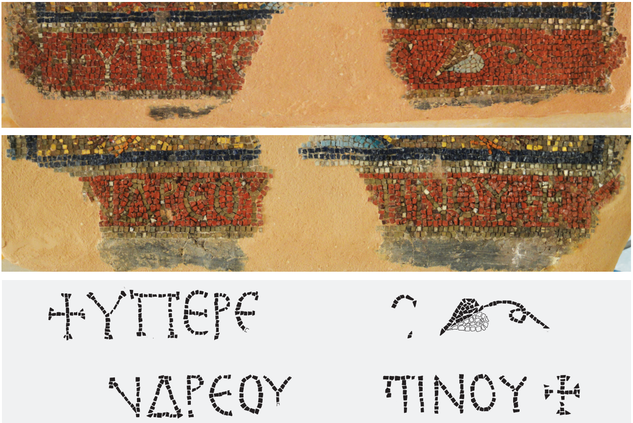
Εικ. 4. Θεσσαλονίκη, Αχειροποίητος. Τριβήλο, εσωράχιο του κεντρικού τόξου. Ο πρώτος και ο δεύτερος στίχος της επώνυμης επιγραφής: + ΥΠΕΡ ΕΥΧΗ C Ϟ / [Α]ΝΑΡΕΟΥ [ΤΑ] ΠΙΝΟΥ +

Μια εκούσια, όπως τεκμαίρεται από τη συμμετρική κανονικότητά της, φθορά στην αντίστοιχη θέση του ψηφιδωτού εσωραχίου του βόρειου τόξου του τριβήλου υποδηλώνει την ύπαρξη και τρίτης ψηφιδωτής επιγραφής 10 , η οποία αφαιρέθηκε επιμελώς 11 , πιθανώς