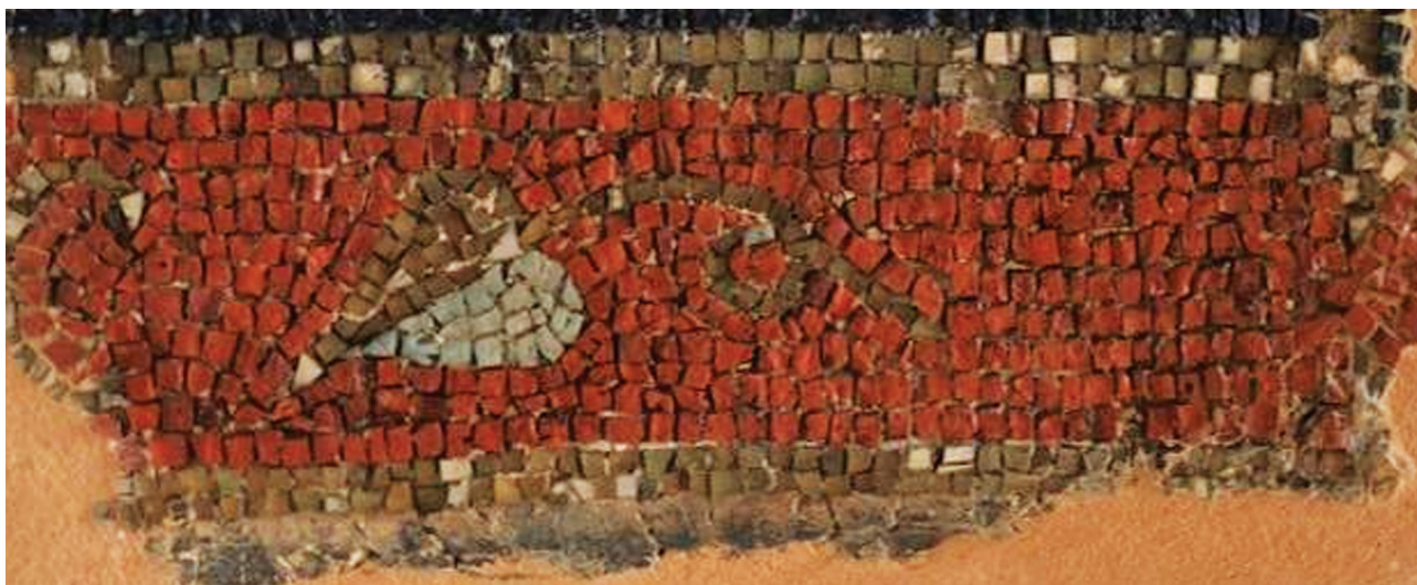
Εικ. 7. Θεσσαλονίκη, Αχειροποίητος. Φύλλο κισσού στην απόληξη του πρώτου στίχου της επώνυμης επιγραφής, βλ. Εικ. 4.

δωρητών να λάβουν την ευλογία του Θεού. Η αντικατάσταση του ονόματος από τη φράση οὐ οἶδεν ὁ Θεὸς τὸ ὄνομα , με την οποία διατηρείται η ανωνυμία του δωρητή, είναι ιδιαίτερα συνήθης την ίδια περίοδο, καθώς με αυτόν τον τρόπο εκφράζεται η ταπεινότητα του χριστιανικού ιδεώδους 20 . Ανάλογες αφιερωματικές επιγραφές, τόσο επώνυμων όσο και ανώνυμων δωρητών, απαντούν συχνά στα εντοίχια ψηφιδωτά ναών της Θεσσαλονίκης. Ο τύπος της ανώνυμης επιγραφής εντοπίζεται στο πρωτοβυζαντινό ψηφιδωτό του τεταρτοσφαιρίου της αψίδας του καθολικού της μονής Λατόμου 21 , δύο φορές στο πρώτο και το τέταρτο