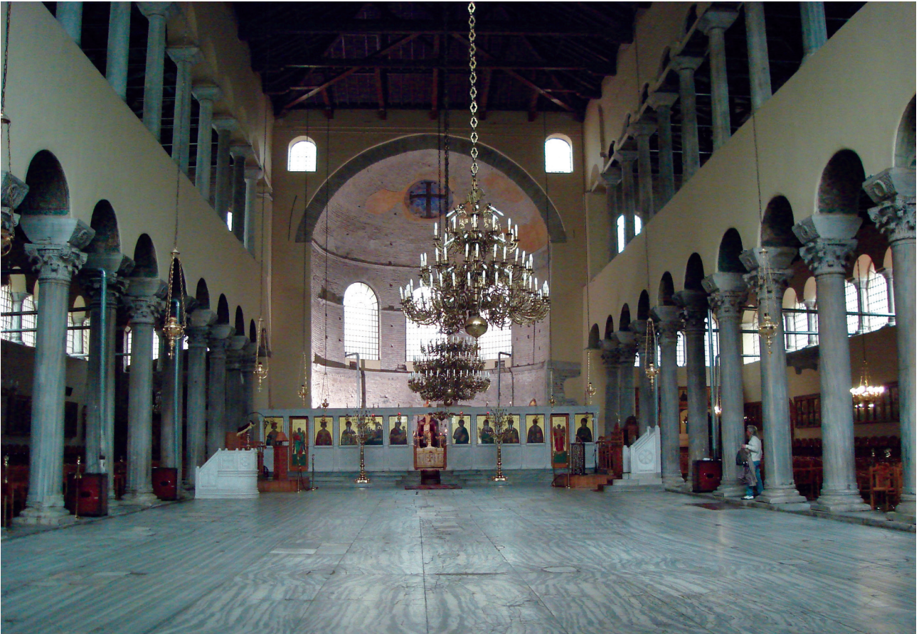
Εικ. 1. Θεσσαλονίκη, Αχειροποίητος. Το κεντρικό κλίτος, άποψη προς τα ανατολικά.

έδρα της οποίας υπήρξε κατά την περίοδο ανέγερσης της βασιλικής η Θεσσαλονίκη.