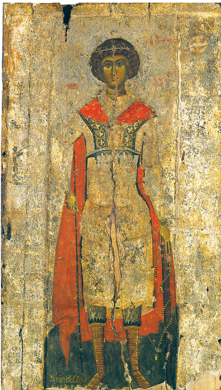
Εικ. 3. Καστοριά. Αμφίγραπτη εικόνα. Κύρια όψη: Ο άγιος Γεώργιος με σκηνές του βίου του, 1160-1180.

μαργαριταρένιο διάδημα. Ανάλογης μορφής σώματα παρατηρούνται σε ολόσωμους αγίους σε μνημεία εργαστηρίων της Καστοριάς της τελευταίας εικοσαετίας του 14ου αιώνα, όπως στον Άγιο Αθανάσιο του Μουζάκη (1383/84), στους Αγίους Τρεις (1400/1) στην