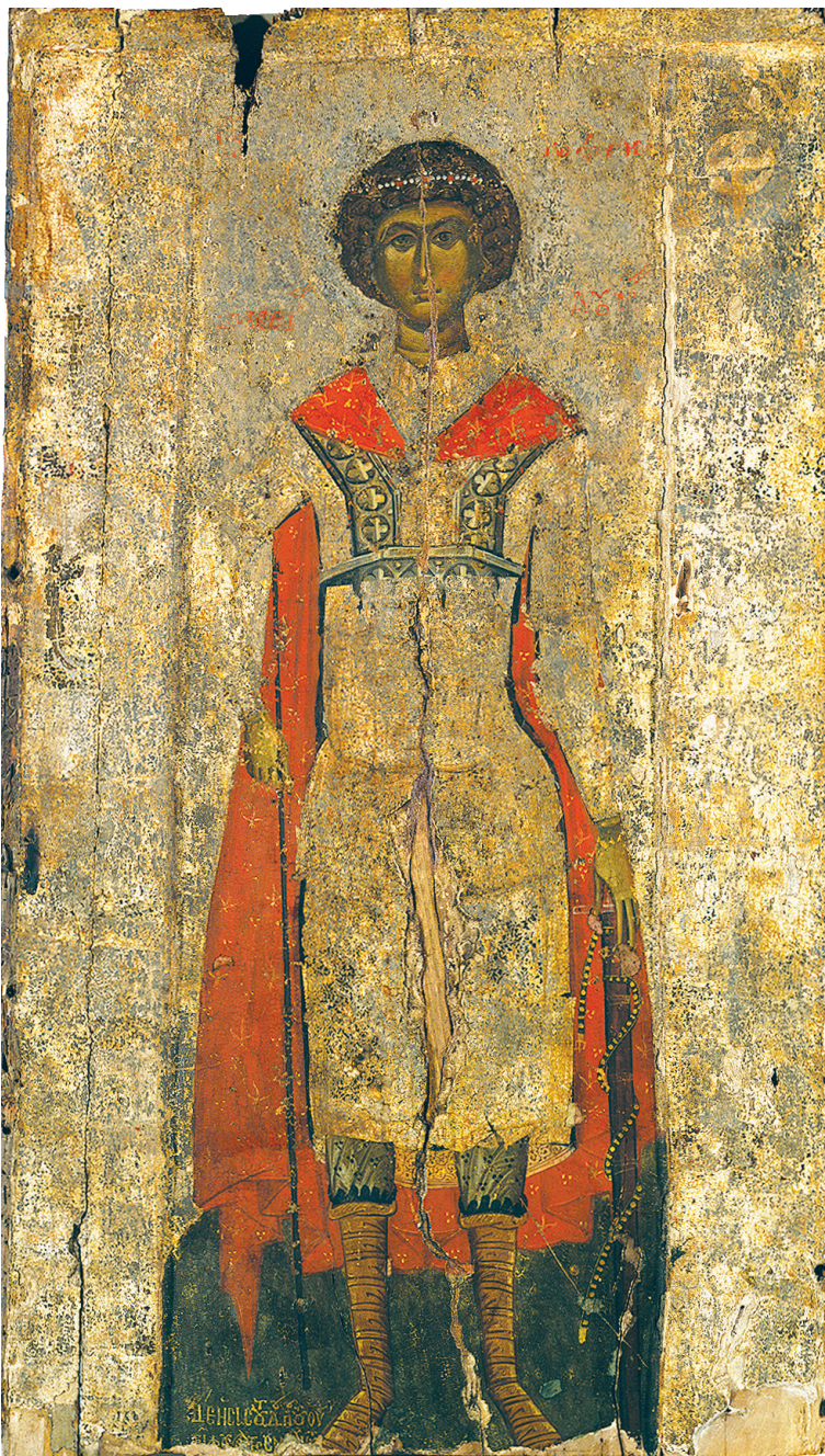
Εικ. 3. Καστοριά. Αμφίγραπτη εικόνα. Κύρια όψη: Ο άγιος Γεώργιος με σκηνές του βίου του, 1160-1180.

μαργαριταρένιο διάδημα. Ανάλογης μορφής σώματα παρατηρούνται σε ολόσωμους αγίους σε μνημεία εργαστηρίων της Καστοριάς της τελευταίας εικοσαετίας του 14ου αιώνα, όπως στον Άγιο Αθανάσιο του Μουζάκη (1383/84), στους Αγίους Τρεις (1400/1) στην