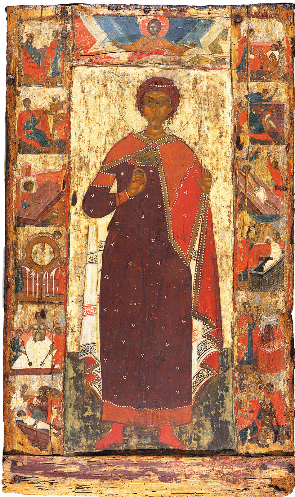
Εικ. 1. Καστοριά. Αμφίγραπτη εικόνα. Κύρια όψη: Ο άγιος Γεώργιος με σκηνές του βίου του, τέλος του 14ου αιώνα.