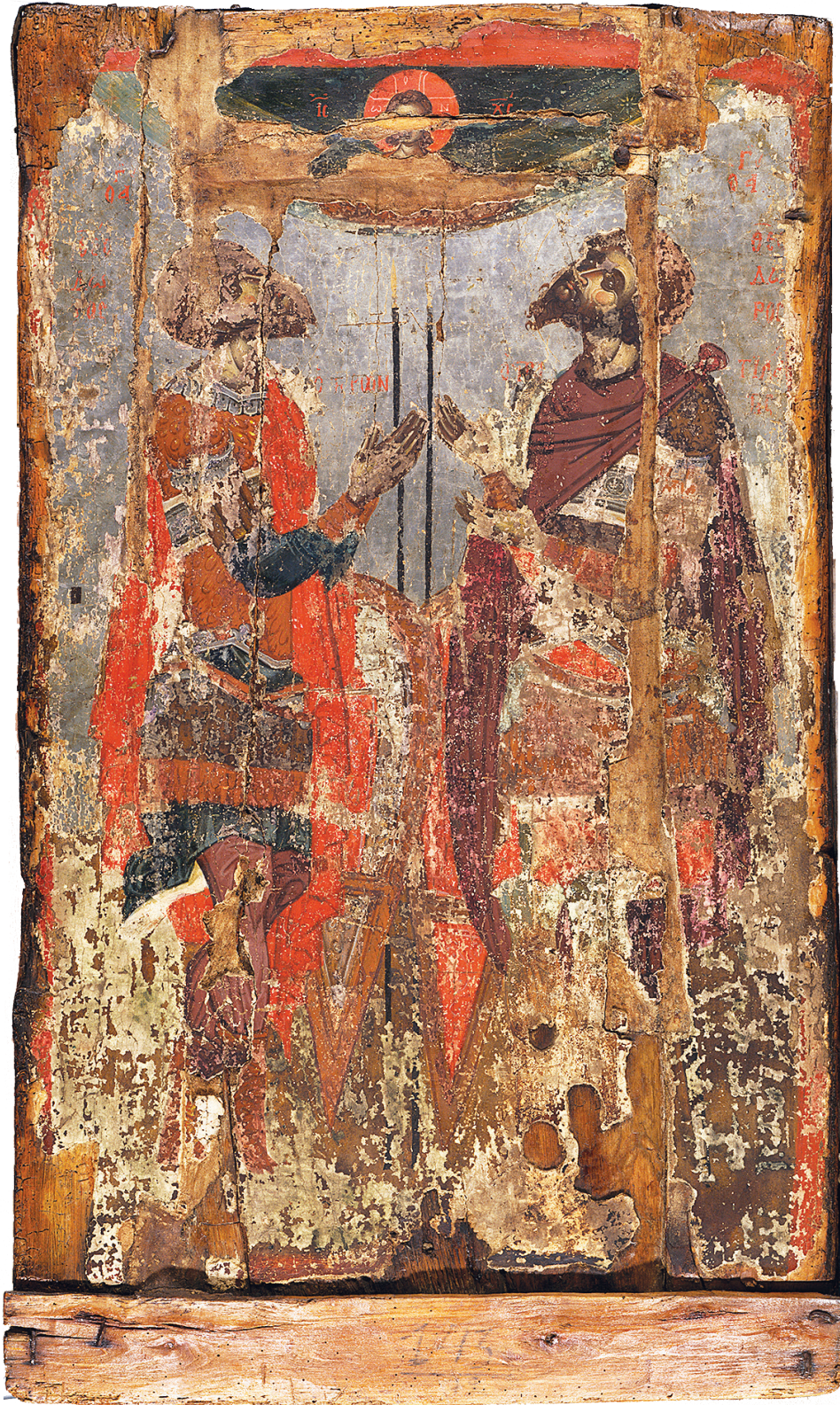
Εικ. 2. Καστοριά. Αμφίγραπτη εικόνα. Πίσω όψη. Οι άγιοι Θεόδωροι αντωποί (τέλος του 14ου αιώνα).