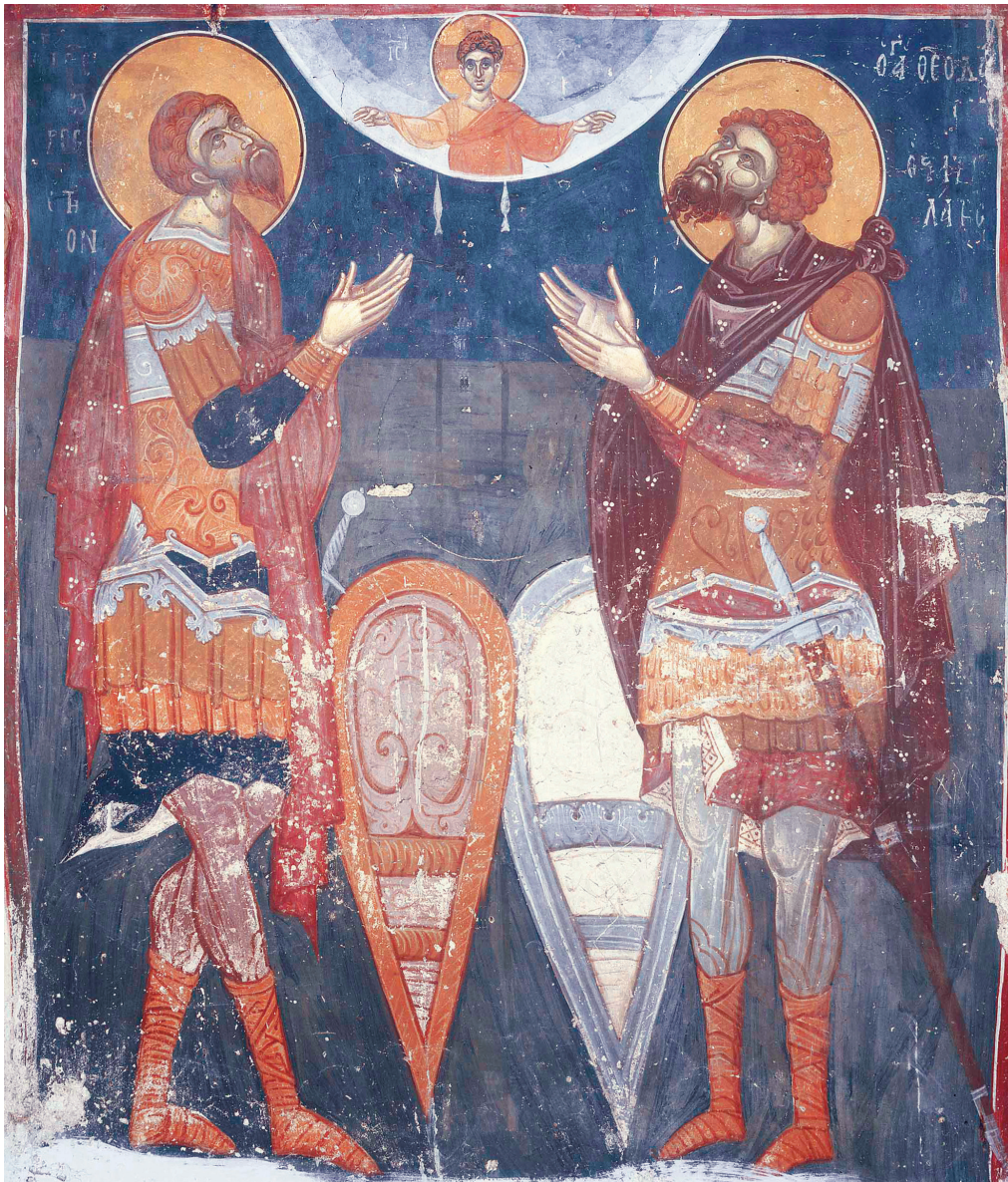
Εικ. 5. Καστοριά. Άγιος Γεώργιος του Βουνού (1368-1385). Κυρίως ναός, νότιος τοίχος. Οι άγιοι Θεόδωροι αντωποί.

Από τεχνοτροπική άποψη, παρά την κακή κατάσταση διατήρησης της εικόνας, ο προσωπογραφικός τύπος της μορφής του αγίου Θεοδώρου του Στρατηλάτη (Εικ. 6) και η τεχνική απόδοση του προσώπου με τα βαθυσκιασμένα μάτια, τα τοξωτά φρύδια, την αυγόσχημη διαγραφή του όγκου στην παρειά, τη λεπτή μύτη και τον κωνικό λαϊμό συνδέονται άμεσα με τον ομώνυμο άγιο στον Άγιο Γεώργιο του Βουνού (1368-1385) (Εικ. 7) και στον Χριστό Ζωοδότη στο Βορτζε της