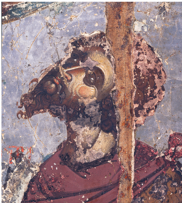
Εικ. 6. Ο άγιος Θεόδωρος ο Στρατηλάτης. Λεπτομέρεια της Εικ. 2.