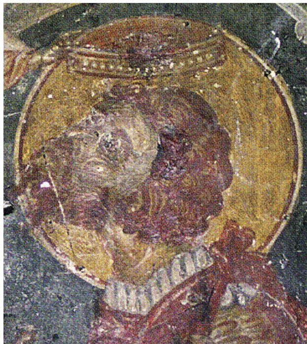
Εικ. 8. Βορje Κορυντσάς. Χριστός Ζωοδότης, 1389/90. Ο άγιος Θεόδωρος ο Στρατηλάτης, λεπτομέρεια.