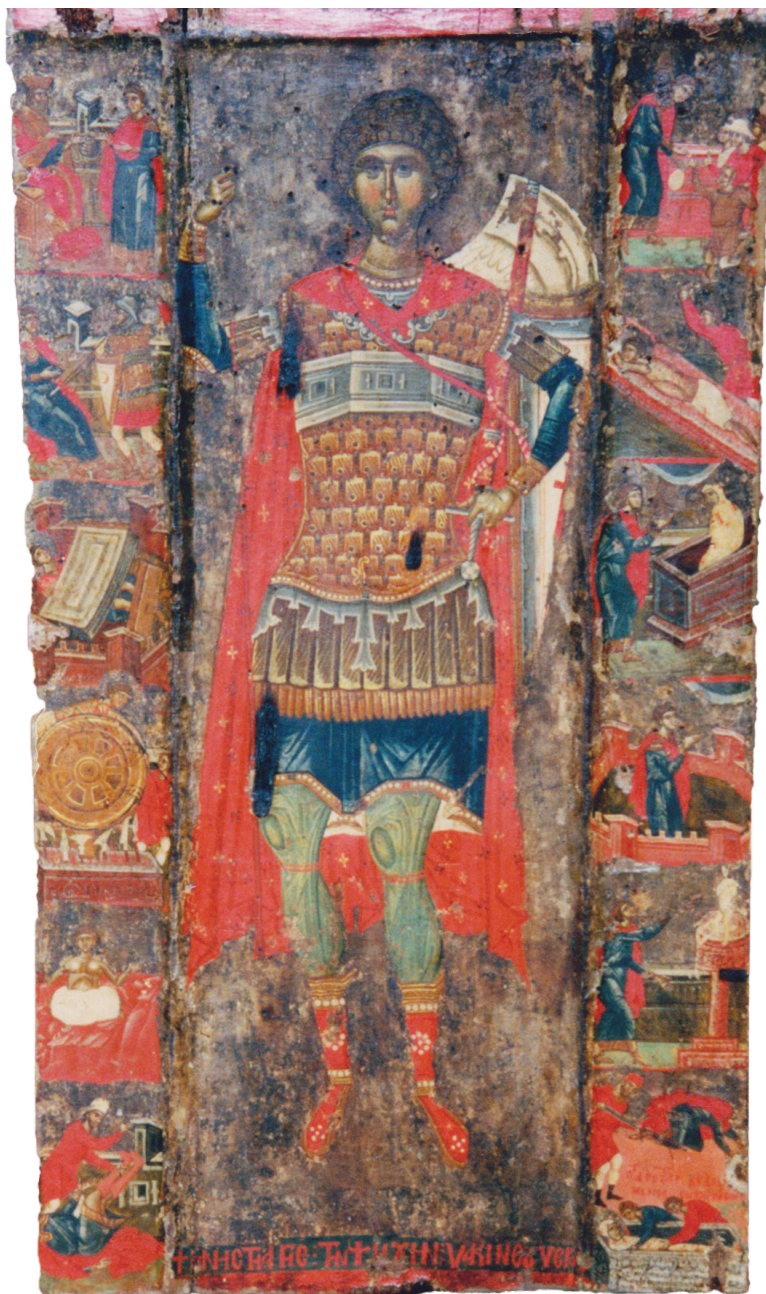
Εικ. 4. Καστοριά, Άγιος Αλύπιος. Αμφίγραπτη εικόνα Κύρια όψη: Ο άγιος Γεώργιος με σκηνές του βίου, τέλος του 14ου – αρχές του 15ου αιώνα.

Το πρόσωπο του αγίου είναι τριγωνικό, με έντονα καμαρωτά φρύδια, βαθυσκιασμένα μάτια, λεπτή μύτη και καλογραμμένα χείλη. Η σάρκα αποδίδεται με