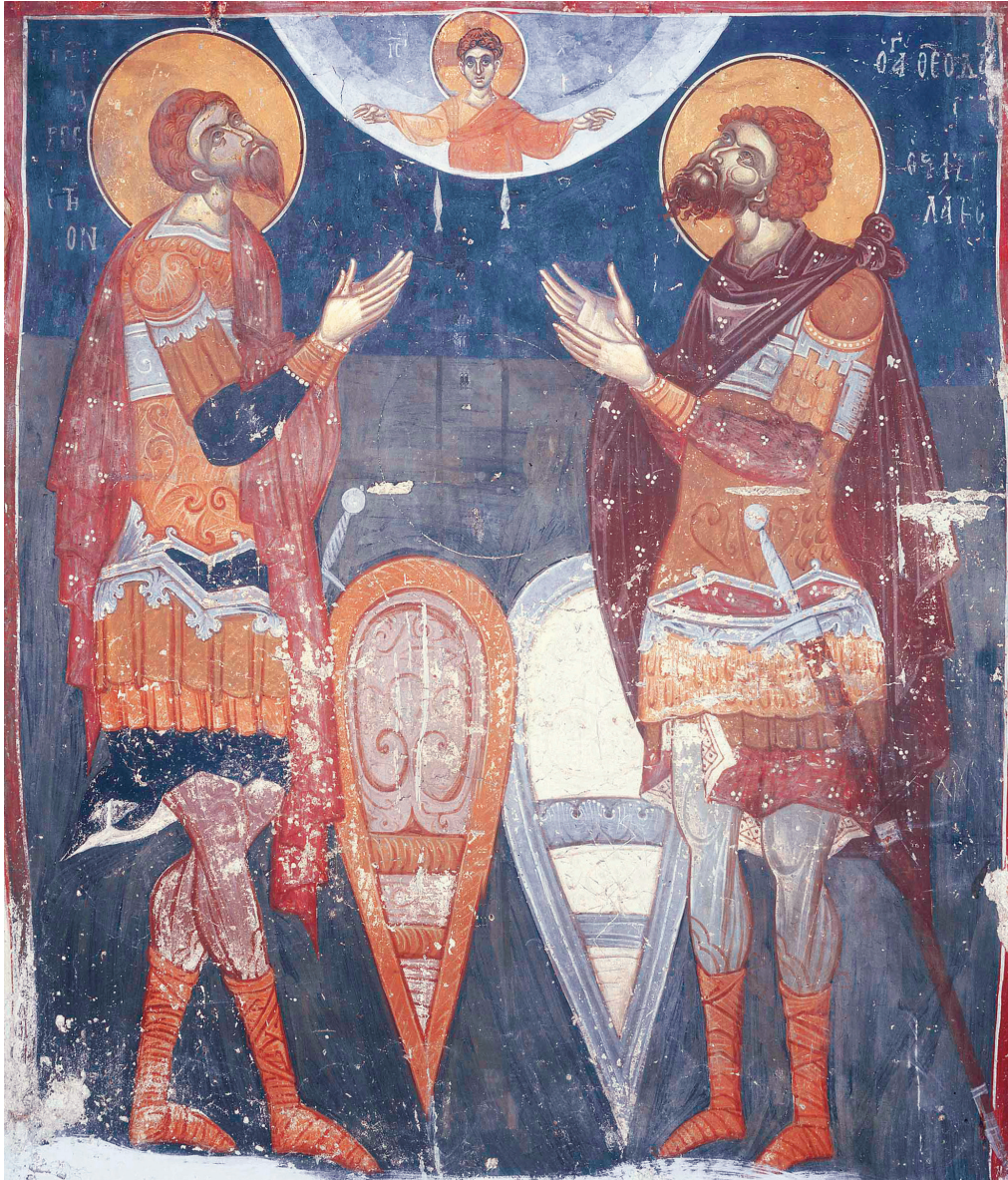
Εικ. 5. Καστοριά. Άγιος Γεώργιος του Βουνού (1368-1385). Κυρίως ναός, νότιος τοίχος. Οι άγιοι Θεόδωροι αντωποί.

Από τεχνοτροπική άποψη, παρά την κακή κατάσταση διατήρησης της εικόνας, ο προσωπογραφικός τύπος της μορφής του αγίου Θεοδώρου του Στρατηλάτη (Εικ. 6) και η τεχνική απόδοση του προσώπου με τα βαθυσκιασμένα μάτια, τα τοξωτά φρύδια, την αυγόσχημη διαγραφή του όγκου στην παρειά, τη λεπτή μύτη και τον κωνικό λαϊμό συνδέονται άμεσα με τον ομώνυμο άγιο στον Άγιο Γεώργιο του Βουνού (1368-1385) (Εικ. 7) και στον Χριστό Ζωοδότη στο Βορτζε της