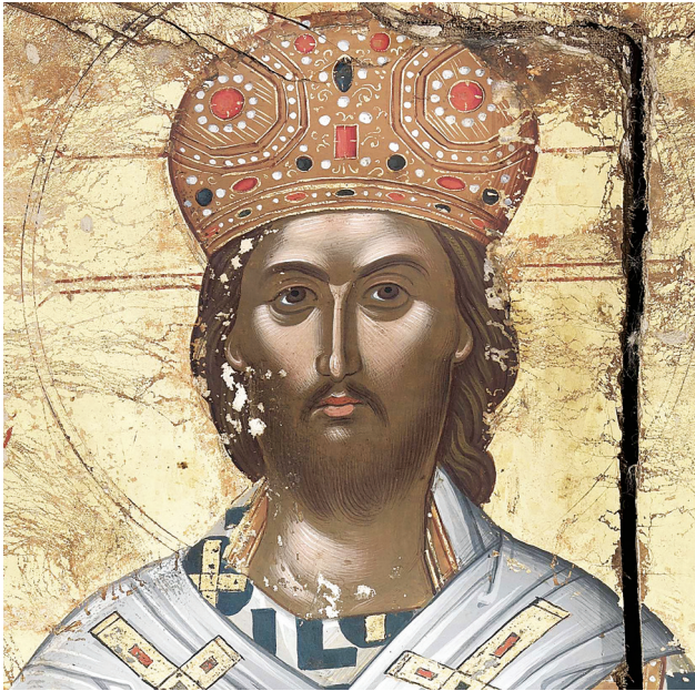
Εικ. 8. Μονή Ρουσάνου. Χριστός Μέγας Αρχιερέας (λεπτομέρεια της Εικ. 1).