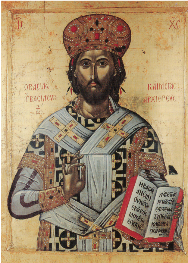
Εικ. 6. Μονή Σταυρονικήτα. Χριστός Μέγας Αρχιερέας, 1545/46.