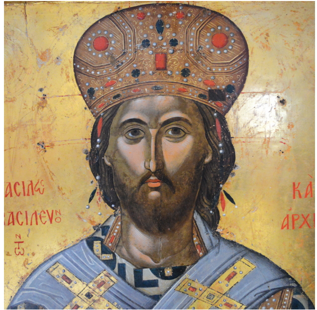
Εικ. 9. Μονή Σταυρονικήτα. Χριστός Μέγας Αρχιερέας (λεπτομέρεια της Εικ. 6).

στον τρόπο απόδοσης του προσώπου με την άψογη τεχνική εκτέλεση. Τα χαρακτηριστικά αυτά αναγνωρίζονται σε καθιερωμένους φυσιογνωμικούς τύπους και καλλιτεχνικούς τρόπους κρητικών εικόνων, όπως αυτό διαπιστώνεται στη σύγκριση της εικόνας της μονής Ρουσάνου με την εικόνα του Χριστού Μεγάλου Αρχιερέα της μονής Γωνιάς (Εικ. 3, 10), που χρονολογείται στο δεύτερο μισό του 15ου αιώνα και αποδίδεται στον Ανδρέα Ρίτζο. Σύμφωνα με νεότερες έρευνες του καθηγητή Ε. Τσιγαρίδα, η εικόνα της μονής Γωνιάς θα μπορούσε να αποδοθεί στον Θεοφάνη 29 . Μάλιστα, η εικόνα του Χριστού Μεγάλου Αρχιερέα της μονής Ρουσάνου στη μαλακή απόδοση και στη γαλήνια έκφραση του προσώπου βρίσκεται πλησιέστερα τεχνοτροπικά στην εικόνα της μονής Γωνιάς, απ' ό,τι στην εικόνα της μονής Σταυρονικήτα.