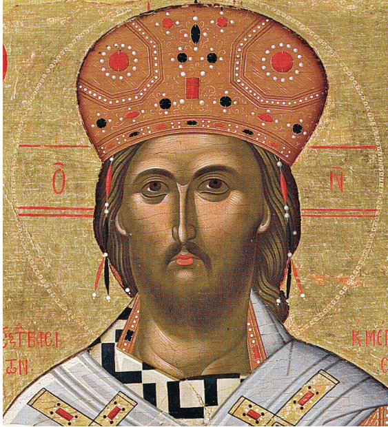
Εικ. 10. Μονή Γωνιάς, Χριστός Μέγας Αρχιερέας (λεπτομέρεια της Εικ. 3).

Δοχειαρίου 35 . Ανάλογη διαμόρφωση του θρόνου με βαθμιδωτή απόδοση του υποποδίου εντοπίζεται στη μονή Φιλανθρωπινών 36 . Άξιο προσοχής είναι ότι δεν απεικονίζονται τα δύο πίσω πόδια του θρόνου, καθώς αυτός αποδίδεται μετωπικά και όχι υπό γωνία, όπως ανάλογα παρατηρείται στην εικόνα του Χριστού Παντοκράτορα της μονής Γρηγορίου 37 . Πανομοιότυπος είναι και ο τρόπος, με τον οποίο σχεδιάζονται τα τοξύλλια της εικόνας μας με την εικόνα του Χριστού Παντοκράτορα της μονής Γρηγορίου. Κοινό στοιχείο που μαρτυρεί την ιστόρηση της εικόνας από τον ίδιο καλλιτέχνη αποτελεί και η πανομοιότυπη γραφή στη συμμετρική επιγραφή που πλαισιώνει την εικόνα μας με τις επιγραφές που συνοδεύουν την τοιχογραφία του καθολικού της μονής Αναπαυσά και τη φορητή εικόνα της μονής Σταυρονικήτα 38 . Τα παλαιογραφικά