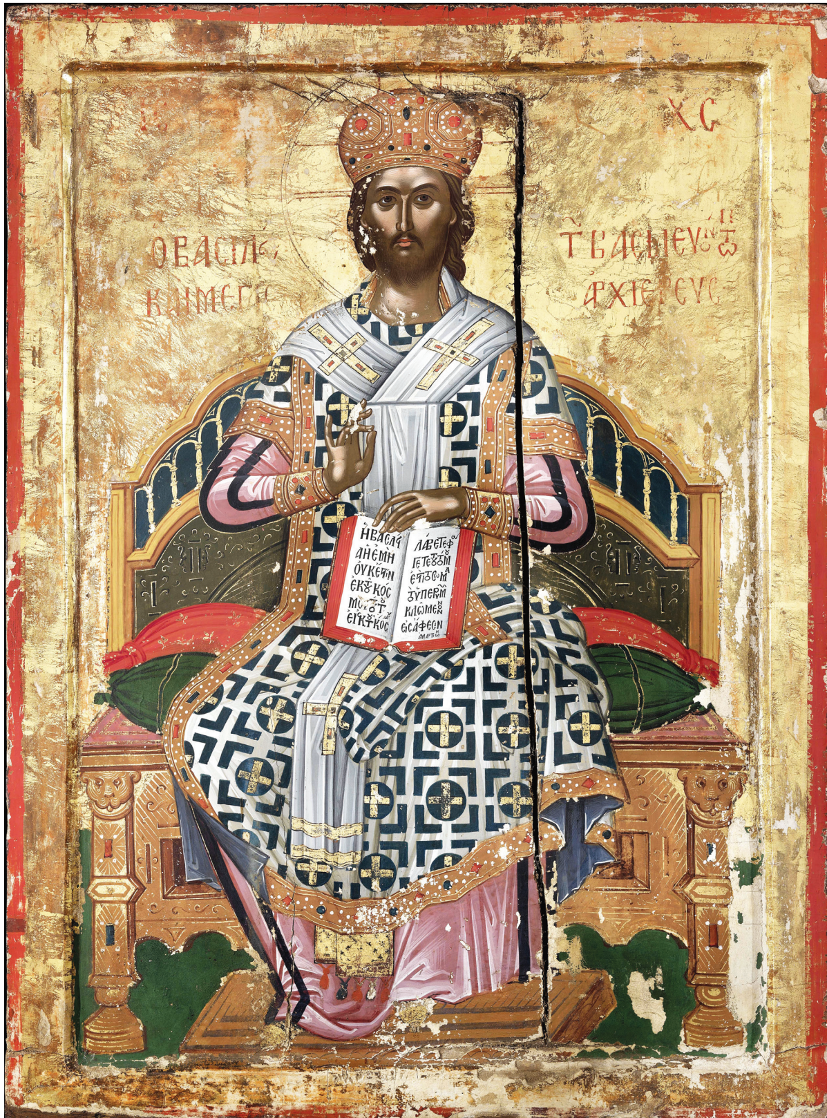
Εικ. 1. Μονή Ρουσάνου. Χριστός Μέγας Αρχιερέας, 1527.