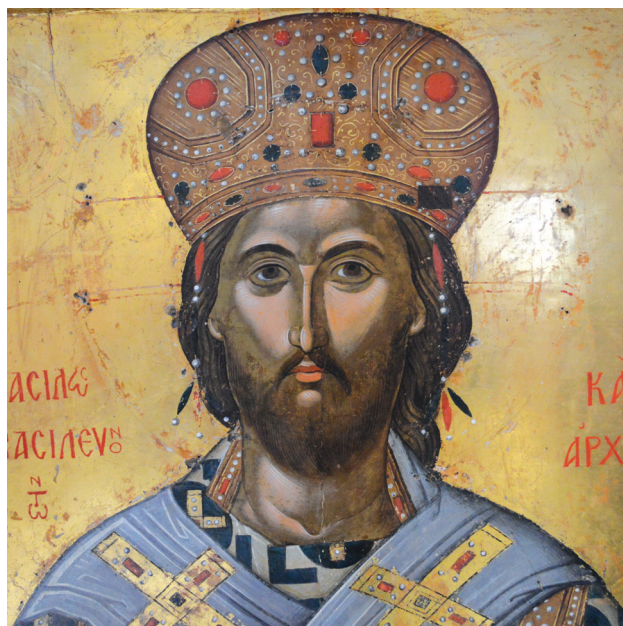
Εικ. 9. Μονή Σταυρονικήτα. Χριστός Μέγας Αρχιερέας (λεπτομέρεια της Εικ. 6).

στον τρόπο απόδοσης του προσώπου με την άψογη τεχνική εκτέλεση. Τα χαρακτηριστικά αυτά αναγνωρίζονται σε καθιερωμένους φυσιογνωμικούς τύπους και καλλιτεχνικούς τρόπους κρητικών εικόνων, όπως αυτό διαπιστώνεται στη σύγκριση της εικόνας της μονής Ρουσάνου με την εικόνα του Χριστού Μεγάλου Αρχιερέα της μονής Γωνιάς (Εικ. 3, 10), που χρονολογείται στο δεύτερο μισό του 15ου αιώνα και αποδίδεται στον Ανδρέα Ρίτζο. Σύμφωνα με νεότερες έρευνες του καθηγητή Ε. Τσιγαρίδα, η εικόνα της μονής Γωνιάς θα μπορούσε να αποδοθεί στον Θεοφάνη 29 . Μάλιστα, η εικόνα του Χριστού Μεγάλου Αρχιερέα της μονής Ρουσάνου στη μαλακή απόδοση και στη γαλήνια έκφραση του προσώπου βρίσκεται πλησιέστερα τεχνοτροπικά στην εικόνα της μονής Γωνιάς, απ' ό,τι στην εικόνα της μονής Σταυρονικήτα.