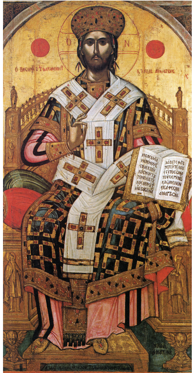
Εικ. 4. Κέρκυρα. Πρώτο Δημοτικό Κοιμητήριο. Μιχαήλ Δαμασκηνός, Χριστός Μέγας Αρχιερέας, δεύτερο μισό του 16ου αιώνα.

Αρχιερέα στη φορητή εικόνα της μονής Σταυρονικήτα (1545/46) 9 (Εικ. 6) και τις παραστάσεις του έθρονου Χριστού Μεγάλου Αρχιερέα που απεικονίζονται στη λιτή των καθολικών των μονών Αγίου Βησσαρίωνος Δουσίκου (1557) 10 και Δοχειαρίου (1568) 11 . Ειδικότερα, ο Χριστός Μέγας Αρχιερέας της μονής Ρουσάνου ακολουθεί στο γενικό εικονογραφικό σχήμα αλλά και στις λεπτομέρειες, όπως στον τρόπο ευλογίας, τάσεις που είναι αποκρυσταλλωμένες στα μέσα του 16ου αιώνα και που οφείλονται προφανώς σε κοινό εικονογραφικό πρότυπο, η επιλογή του οποίου υπαγορεύθηκε από κριτήρια θεολογικά και αισθητικά, όπως απαντάται στην τοιχογραφία του καθολικού της μονής Αναπαυσά και στη φορητή εικόνα της μονής Σταυρονικήτα 12 . Ο τύπος του έθρονου Χριστού Μεγάλου Αρχιερέα επαναλαμβάνεται αργότερα στο Πρώτο Δημοτικό Κοιμητήριο της Κέρκυρας (δεύτερο μισό του 16ου αιώνα) (Εικ. 4) 13 , στα καθολικά των μονών Δουσίκου (1557) και Δοχειαρίου (1568) 14 , στον ναό της Κοιμήσεως Θεοτόκου της παλαιάς μητρόπολης Καλαμπάκας (1573) 15 , στο παρεκκλήσιο του Μητροπολιτικού Μεγάλου Ιωαννίνων (17ος αιώνας) 16 και αλλού. Ο τρόπος με τον οποίο ο Χριστός στην εικόνα της μονής Ρουσάνου ευλογεί με την παλάμη γυρισμένη προς