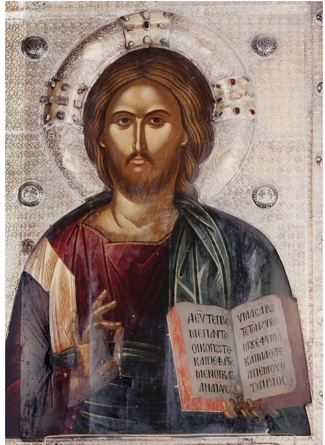
Εικ. 7. Μονή Λαύρας. Χριστός Παντοκράτορας, 1535.

καλλιτεχνικούς τρόπους οικείους στην κρητική σχολή. Τα μαλλιά και τα γένια αποδίδονται με αυλακώσεις σε βαθύτερο τόνο του καστανού χρώματος, ενώ τα χείλη τονίζονται με κόκκινο χρώμα, κάνοντας τη σάρκα πιο συγκεκριμένη. Περιορισμένη έκταση κατέχουν τα φώτα στα ενδύματα, όπου με ανοιχτότερο γραμμικό τόνο του ίδιου χρώματος υποδηλώνονται οι πτυχώσεις στον σάκκο, στο στιχάριο και στο ωμοφόριο.