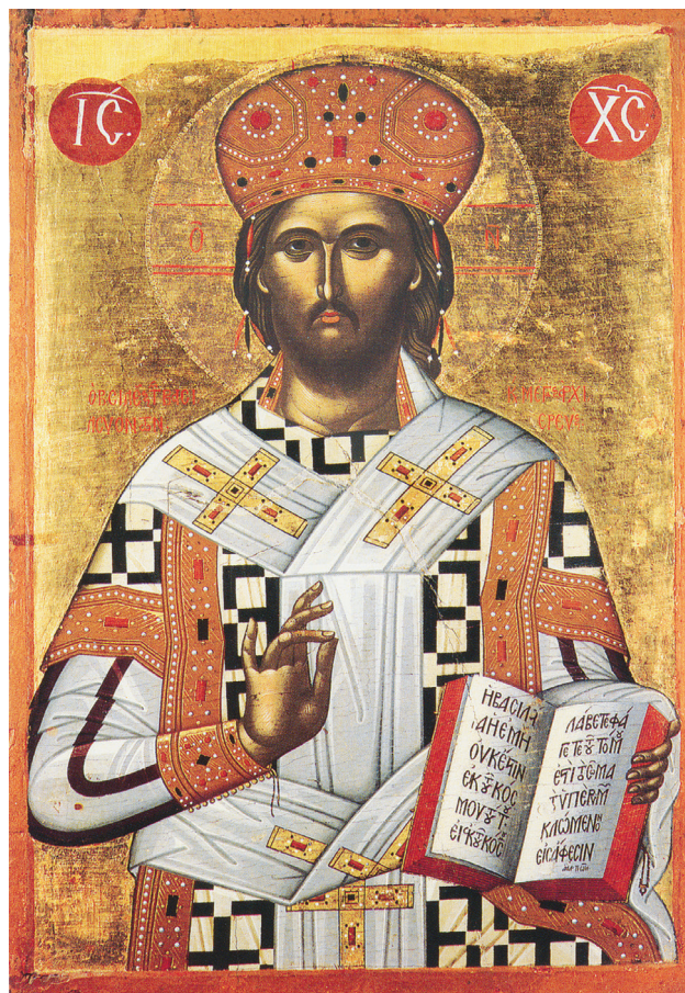
Εικ. 3. Μονή Γωνιάς. Χριστός Μέγας Αρχιερέας, δεύτερο μισό του 15ου αιώνα.

Άγιου Νικολάου Άναπαυσά. Ιστορία – Τέχνη / Holy Meteora. The Monastery of St Nicholas Anapafsas. History an Art, Τρίκαλα 2003, 79-99, 134-330, εικ σ. 168. Αλ. Αναγνωστόπουλος, Οι τοιχογραφίες του καθολικού της Μονής Αναπαυσά Μετεώρων (αδημ. μεταπτυχιακή εργασία), Θεσσαλονίκη 2002, 18-213, εικ. 2-201 και ειδικά 55-56, εικ. 53.