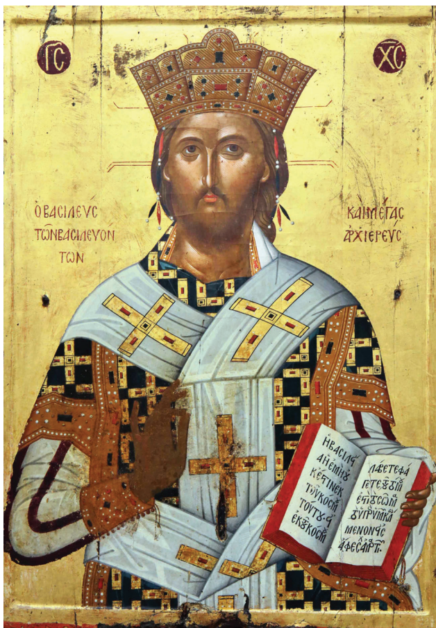
Εικ. 2. Μονή Πάτιμου. Χριστός Μέγας Αρχιερέας, γύρω στο 1500.