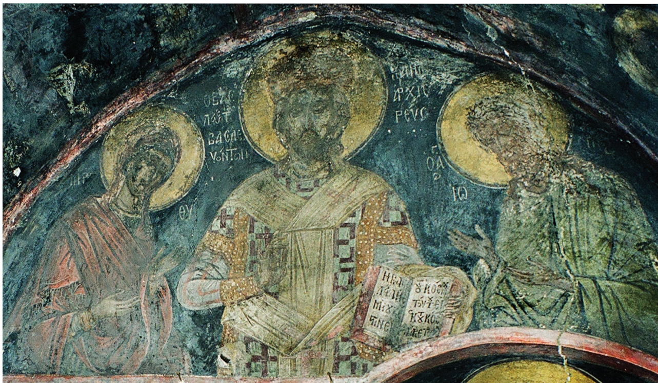
Εικ. 5. Μονή Αναπαυσά. Δέηση, ο Χριστός Μέγας Αρχιερέας, 1527.

τρόπος ευλογίας απαντάται στην εικόνα της μονής Γωνιάς 18 , στο καθολικό της μονής Αναπαυσά 19 , στην εικόνα της μονής Σταυρονικήτα 20 , στη λιτή του καθολικού και στη φορητή εικόνα της μονής Μεγάλου Μετεώρου (1552) 21 , στη λιτή του καθολικού της μονής Δουσίκου (1557) 22 , στη λιτή του καθολικού της μονής Δοχειαρίου (1568) 23 , στην παράσταση στον παλαιό μητροπολιτικό ναό της Κοιμήσεως Θεοτόκου Καλαμπάκας