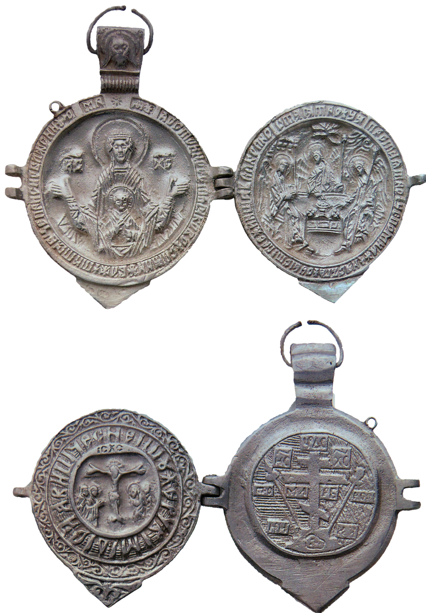
Εικ. 2. Μονή Βατοπεδίου. Παναγιάριο-εγκόλπιο, 15ος αιώνας. (α) Εσωτερική και (β) εξωτερική όψη.

Σπυρίδωνα, Ιωάννη Χρυσόστομο και σεραφείμ, και η Δέηση, πλαισιωμένη από συμπλεκόμενους κύκλους και ταινίες, καθώς και τα σύμβολα των τεσσάρων ευαγγελιστών. Στις εξωτερικές όψεις παριστάνονται η Ανάληψη, πλαισιωμένη από τους άγιους Δημήτριο, Γεώργιο, Θεόδωρο Τήρωνα, Θεόδωρο Στρατηλάτη και γεωμετρικά θέματα, και ο Ευαγγελισμός, περιβαλλόμενος από τους αποστόλους Παύλο και Πέτρο, τους ευαγγελιστές