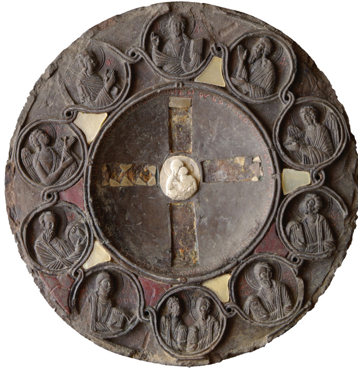
Εικ. 1. Μονή Βατοπεδίου. Παναγiάριο, δεύτερο μισό του 14ου – αρχές του 15ου αιώνα.

εγχάρακτο ή σμαλτωμένο. Ανήκουν είτε στον απλό τύπο, στον οποίο το παναγiάριο συνίσταται από ένα μόνο εικονίδιο, είτε στον πιο σύνθετο, στον οποίο δύο δίσκοι – εικονίδια, που συνδέονται ή όχι με στροφέα, συναρμόζουν στον δεύτερο τύπο απαντούν και μικρών διαστάσεων παναγiάρια-εγκόλπια.