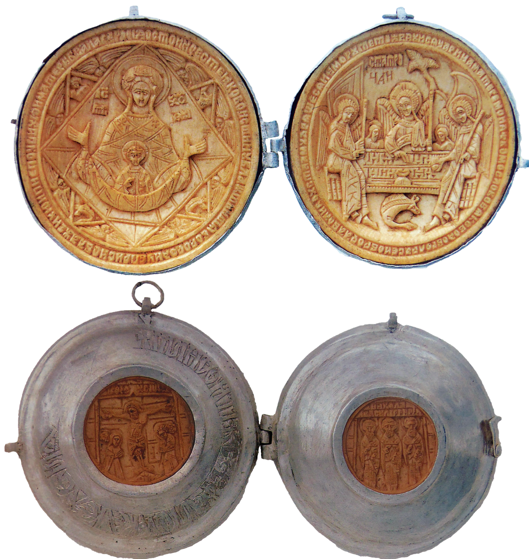
Εικ. 5. Μονή Βατοπεδίου. Παναγιάριο-εγκόλλιο, δώρο των άγνωστης καταγωγής Στεφάνου και Έλενας, δεύτερο μισό του 16ου αιώνα. (α) Εσωτερική και (β) εξωτερική όψη.

Στα οστέινα εικονίδια κυριαρχούν οι ραδινές, αποδοσμένες με κοίλα περιγράμματα, μορφές, με φυσιογνωμικά χαρακτηριστικά σχηματοποιημένα, σχεδόν πανομοιότυπα. Ο τεχνίτης επιπλέον απέδωσε ικανοποιητικά τα διαφορετικά επίπεδα στις σκηνές. Τα γνωρίσματα αυτά απαντούν σε έργα φιλοτεχνημένα στη βόρεια Βαλκανική στο δεύτερο μισό του 16ου αιώνα 42 και θεωρούμε ότι απηχούν μια παλαιότερη παράδοση που καλλιεργήθηκε σε εργαστήρια των Παραδουνάβιων