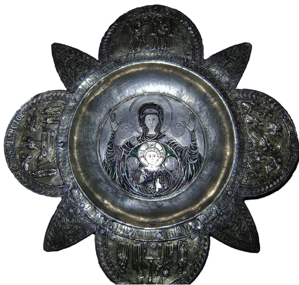
Εικ. 4. Μονή Ιβήρων. Παναγιάριο, αρχές του 16ου αιώνα.

ηγεμόνων και αξιωματούχων της Βλαχίας και Μολδαβίας στην πρώτη εικοσαετία του 16ου αιώνα σε εργαστήρια των Παραδουνάβιων Χωρών 37 .