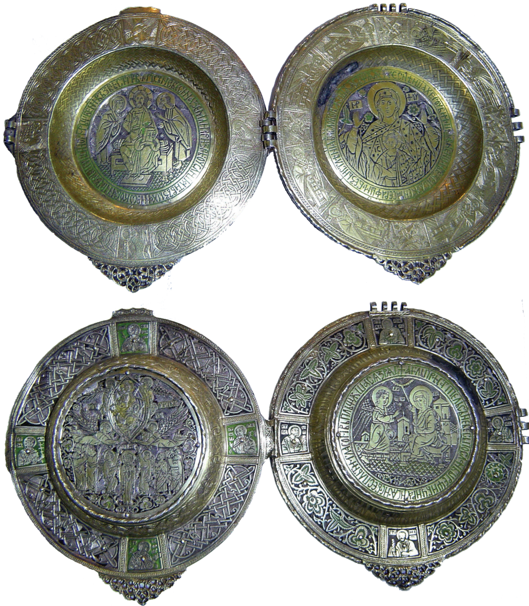
Εικ. 3. Μονή Βατοπεδίου. Παναγιάριο, δώρο του Μεγάλου Κόμισου της Βλαχίας Νεαγκόε (1510-1511). (α) Εσωτερική και (β) εξωτερική όψη.

+ СЪН ПΑΝΑΓΙΑΡ · СЪТВОРΗ ЖЪ ПΑΝ ΝΕΓΟΛ · ΒΕΛΗ- ΚΥΙ ΚΟΜΗΣ ΔΑ СЕ ВЪСПΟΜΗΝΑΝΑΜ ΤΗ С(ΒΕΤΧ ГОРΧ) Χ ΒΑΤΟΠΕД [Το παρόν παναγιάριο κατασκευά-