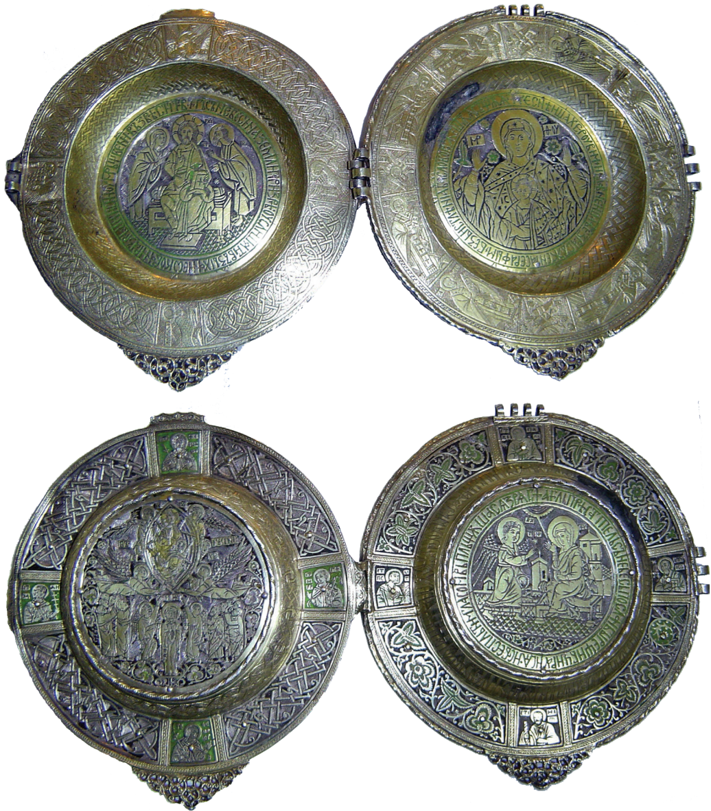
Εικ. 3. Μονή Βατοπεδίου. Παναγιάριο, δώρο του Μεγάλου Κόμισου της Βλαχίας Νεαγκόε (1510-1511). (α) Εσωτερική και (β) εξωτερική όψη.

+ СЪН ПΑΝΑΓΙΑΡ · СЪТВОРΗ ЖЪ ПАН ΝΕΓΟΛ · ΒΕΛΗ- ΚΥΙ ΚΟΜΗΣ ΔΑ СЕ ВЪСПΟΜΗΝΑΝΑΜ ΤΗ С(ΒΕΤЪ ГОРЪ) Χ ΒΑΤΟΠΕΔ [Το παρόν παναγιάριο κατασκευά-