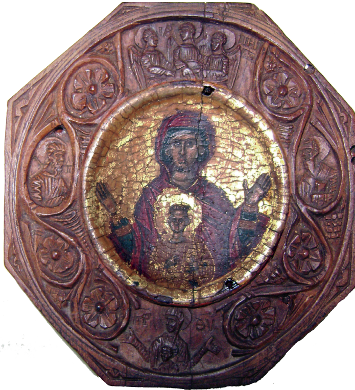
Εικ. 6. Μονή Βατοπεδίου. Παναγιάριο, δεύτερο μισό του 16ου αιώνα.

εργαστήρια της βόρειας Βαλκανικής 44 . Το ιδίωμα αυτό υιοθετείται, καλλιεργείται και εξελίσσεται από τους μοναχούς τεχνίτες έργων μικροξυλογλυπτικής από τα μέσα του 16ου αιώνα και μετά 45 .