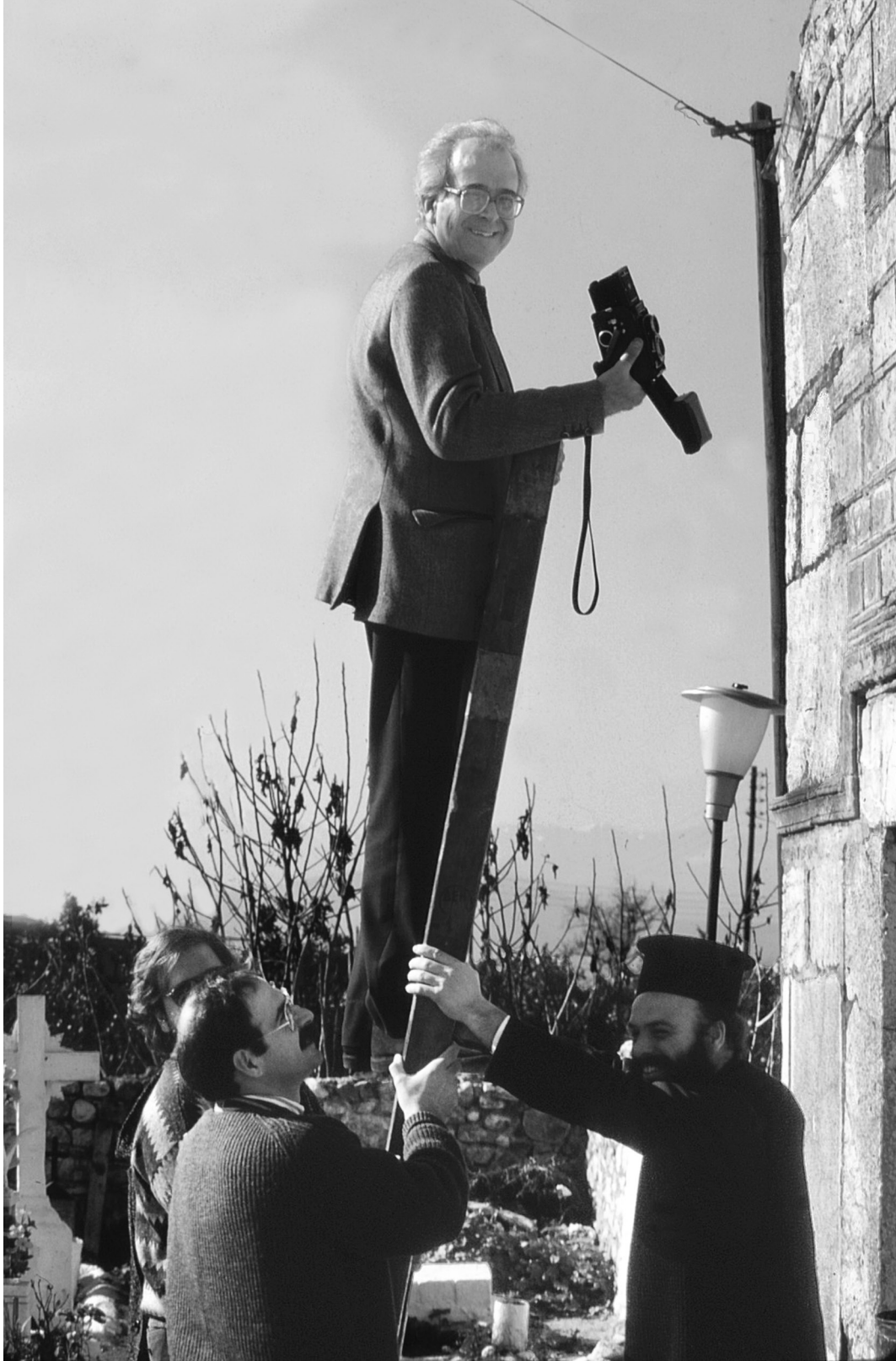
Φωτογραφίζοντας την Άγία Τριάδα του Μέριπακα (Φωτ.: Π. Α. Βοζοτόπουλος, 8 Ιανουαρίου 1990).