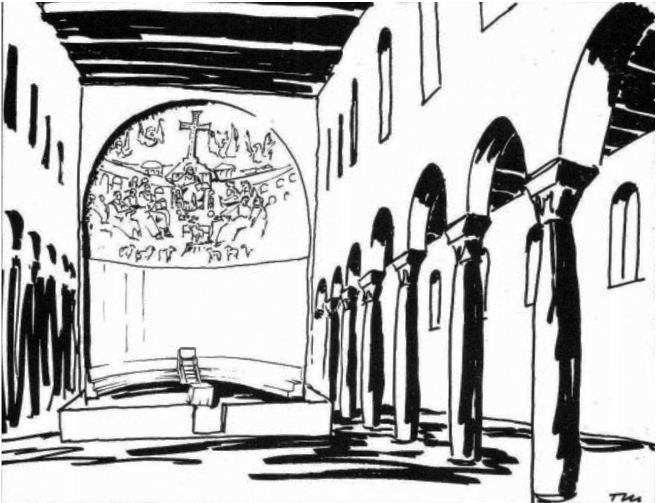
Εικ. 4. Ρώμη, Santa Pudenziana. σκαρίφημα του ιερού, π. 400.

των ιερέων στην εξέδρα πίσω από την αγία τράπεζα συνέδεε συμβολικά την εικόνα και τα τελούμενα του Μυστικού Δείπνου με το συμπόσιο και την τράπεζα