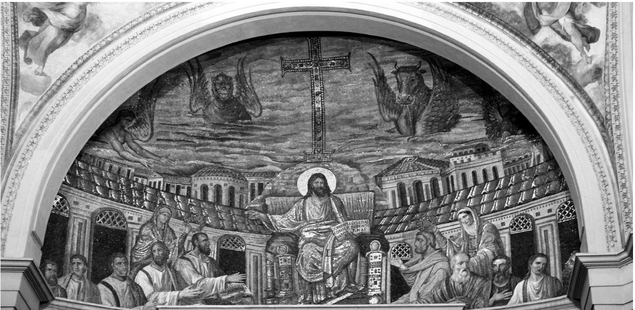
Εικ. 3. Ρώμη, Santa Pudenziana, το ψηφιδωτό της αψίδας, π. 400.

αρχαιότητας. Την πλέον ξεκάθαρη επιβεβαίωση μας προσφέρει ο Ευσέβιος κατά την παρουσίαση του Χριστού ως ιερού διδασκάλου: «διατριβάς και διδασκαλεῖα καθ' ὅλης τῆς τῶν ἔθνῶν οἰκουμένης πηξάμενος ἔν [τε] χώραις και κώμαις ἀγροῖς τε και ἔρημίαις ταῖς θ' ἅπανταχοῦ πόλεσιν εἰς τὴν τῶν ἐνθέων μαθημάτων παιδείωσιν ἀφθόνως ἐπικαλεῖται, Ἑλληνας ὁμοῦ και βαρβάρους, σοφοὺς και ἰδιώτας [...]». 52 Ἄλλου χαρακτηρίζει τους μαθητές του Χριστού ως φοιτητές που ἀνοῖξαν σε ὅλη τὴν οἰκουμένη διδασκαλεῖα για να διαβάξονται οι ευσεβεῖς νόμοι που παρέδωσε εκείνος: «διδασκαλεῖα πανταχοῦ γῆς ἀνοίξας, εἰς ἐπήκοον ἀνθρώποις πᾶσι βαρβάρους ὁμοῦ και Ἑλλησιν». 53 Ὡς διδασκαλεῖα που ἰδρύθηκαν παντοῦ, ἀναφέρει, βέβαια, τους χριστιανικούς ναούς και ως διατριβές τα σύνθρονα, ὅπου οι ἐπίσκοποι εἰς τύπον Χριστοῦ και οι ιερεῖς εἰς τύπον των μαθητῶν-αποστόλων κάθονταν στις ἐξέδρες των αψίδων μετατρέποντας τους ναούς σε διδασκαλεῖα τῆς Θεῆς Σοφίας, ως συνεχιστές τῆς παράδοσης των ἀρχαίων ιερῶν διδασκάλων.