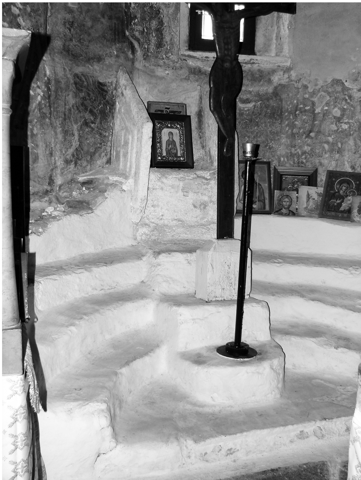
Εικ. 1. Νάξος, Παναγία Πρωτόθρονη, το σύνθρονο, μέσα 7ου αιώνα.