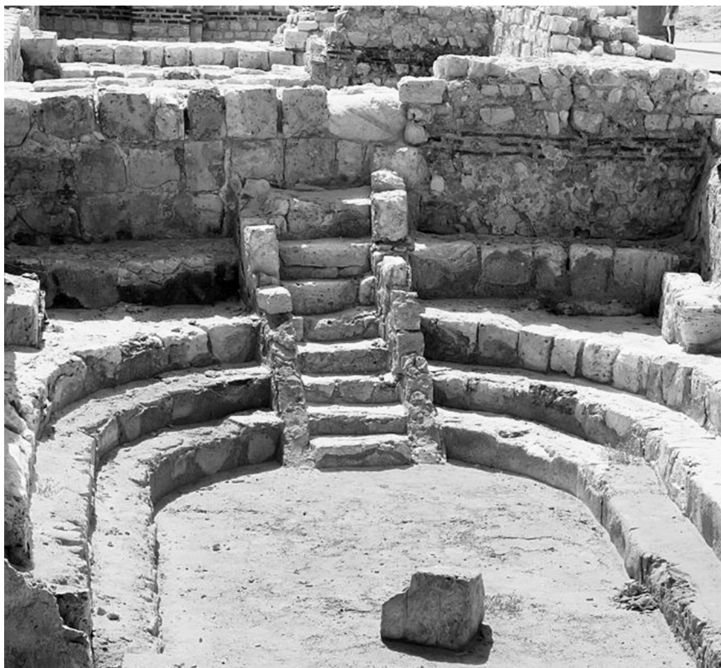
Εικ. 2. Αλεξάνδρεια. Kom El-Dikka, Διδασκαλείο (Auditorium K), ύστερος 5ος ή πρώιμος 6ος αιώνας.

κάθεται στον θρόνο ανάμεσα στους ιερείς, συμβολίζει τον Χριστό ανάμεσα στους μαθητές του.