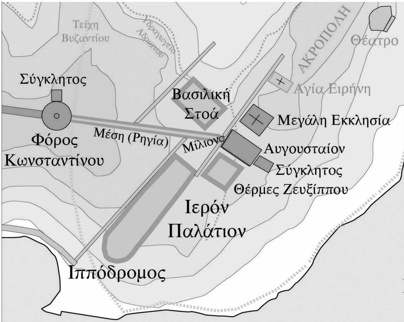
Εικ. 5. Το μνημειακό κέντρο της Κωνσταντινούπολης.

μνημειακού κέντρου της Κωνσταντινούπολης (Εικ. 5), όπου ο καθεδρικός ναός της Πόλης αφιερώθηκε στη Θεία Σοφία και αντιπαρατέθηκε με τα Θέατρα των Μουσών της Βασιλικής Στοάς. Ο επίσκοπος της Πόλης εις τύπον του διδασκάλου Χριστού δίδασκε τη Θεία Σοφία από την καθηγητική καθέδρα του στο σύνθρονο της βασιλικής της Σοφίας του Θεού, ενώ συγχρόνως δίπλα στον ναό, στα παιδευτήρια της Βασιλικής Στοάς, φιλόσοφοι, ρήτορες, σοφιστές και γραμματικοί 56 ,