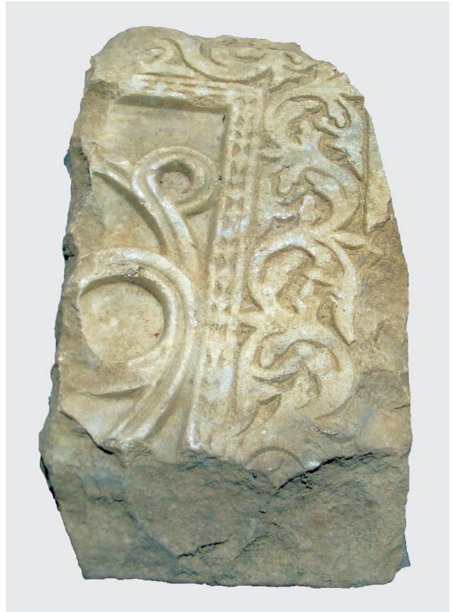
Εικ. 15. Πίσω όψη του ίδιου θωρακίου με επιπεδόγλυφα πλαίσια.

παρέχει αργότερα ο Ανδρέας Κρήτης 82 . Ο πανηγυρικός λόγος «εις τὸν Ἅγιον, καὶ μακάριον, καὶ πανεύφημον τοῦ Χριστοῦ ἀπόστολον Τίτον» 83 εκφωνήθηκε ἀπὸ τον ἐπίσκοπο ἐνώπιον του λαοῦ και της σύναξης των ιερῶν ἀνήμερα της εορτῆς του αἰγίου, μέσα στον ναό που ἦταν αφιερωμένος στη μνήμη του 84 και πιθανότατα μπροστά στον τάφο που περιείχε το λείψανό του 85 .