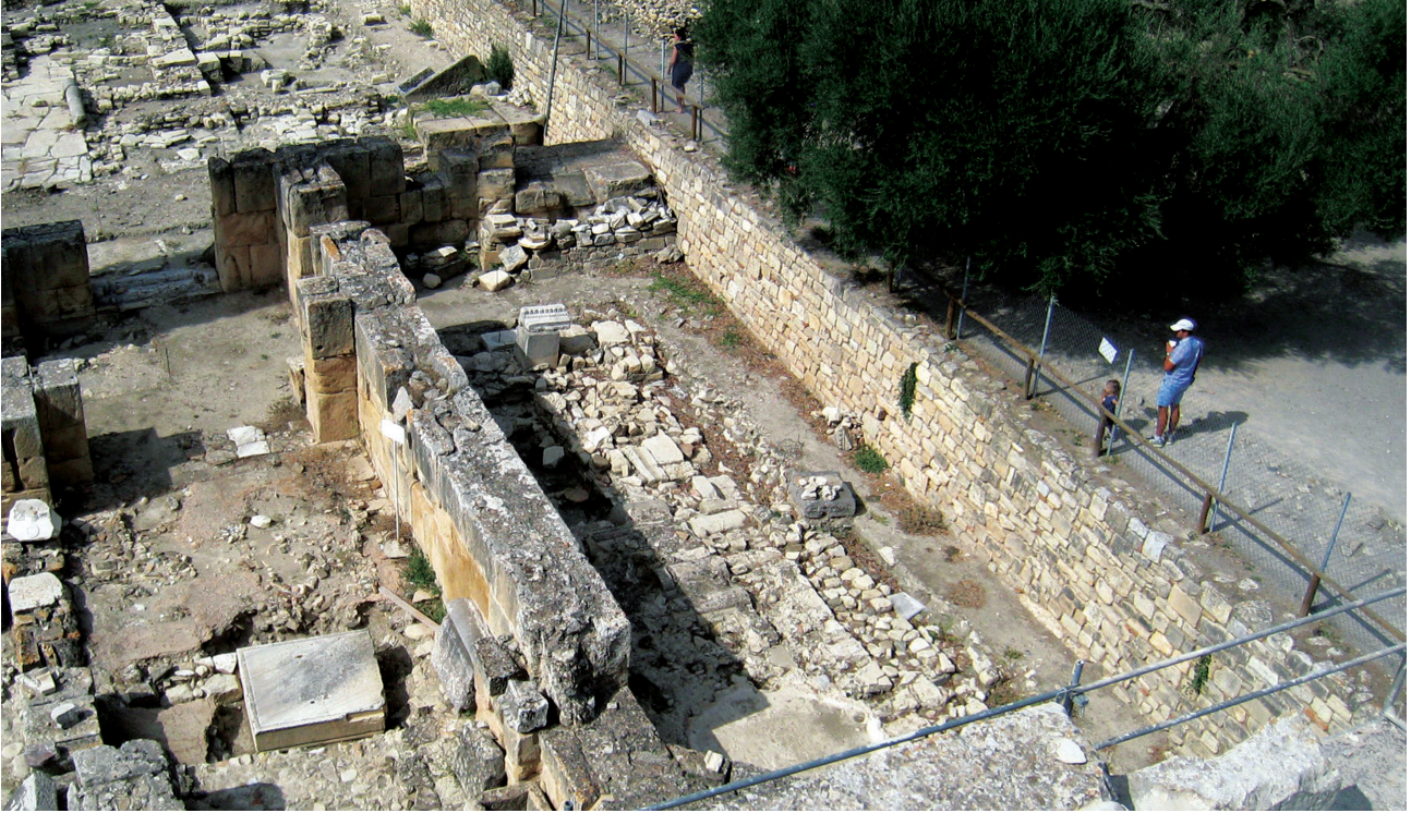
Εικ. 4. Άποψη του βόρειου πλευρικού χώρου της ανασκαφής από τον θόλο του ναού.

«Νότιο Κτήριο», ό.π. (υποσημ. 15), 575-584. Αναφέρουμε, ενδεικτικά, θραύσματα αμφορέων που αποτελούν όψιμες παραλλαγές ή επιβιώσεις των τύπων LRA1 και LRA2, μεταξύ αυτών τοπικές παραλλαγές TRC, Yassi Ada, αιγιακοί κ.λπ., LR4, συροπαλαιστινιακοί, σπαθεία κ.ά., που ήταν σε χρήση από τον 7ο ως τις αρχές του 9ου αιώνα, η ακριβής τυπολογία των οποίων θα προσδιοριστεί μετά τη συγκόλληση των αγγείων [βλ. ενδεικτικά, E. Portale – I. Romeo, «Contenitori da trasporto», Gortina V.3, Lo scavo del Pretorio (1989-1995), I materiali , Πάδοβα 2000, 302-367, 384-393, 399-406. N. Poulou-Papadimitriou – E. Nodarou, «Transport Vessels and Maritime Trade Routes in the Aegean from the 5th to the 9th c. A.D. Preliminary Results of the EU Funded “Pythagoras II” Project: the Cretan Case Study», N. Poulou-Papadimitriou – E. Nodarou – V. Kilikoglou (επιμ.), LRCW 4. Late Roman Coarse Wares and Amphorae in the Mediterranean: Archaeology and archaeometry. The Mediterranean: A market without frontiers , τ. I, Οξφόρδη 2014, 874-875], αφρικανικές εισαγωγές LRSW παραγωγής D (κυρίως τις φόρμες Hayes 104, 105, 106, 107 και 109/Bonifay 60B) του 7ου και 8ου αιώνα [M. A. Rizzo, «Terra sigillata africana», Gortina V.3, Πάδοβα 2000 , 45-54. Perna, «Νότιο Κτήριο», ό.π. (υποσημ. 15), 578-579], μικρασιατικές παραγωγές LRC (φόρμες Hayes 3H και 10) που χρονολογούνται από τα τέλη του 6ου ως το α΄ μισό του 7ου αιώνα (A. Rizzo, «Terra sigillata LRC», Gortina V.3, Πάδοβα 2000 , 60-61), λίγα όστρακα όψιμης κυπριακής κεραμικής