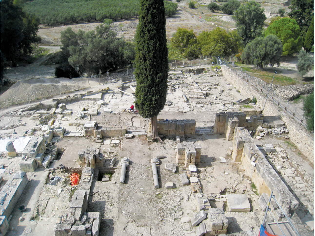
Εικ. 5. Γενική άποψη του χώρου της ανασκαφής από τον θόλο του ναού προς τα δυτικά.

Βετράνιο 29 μετά από ισχυρό σεισμό, που πιθανότατα προκάλεσε κατάρρευση του φωταγωγού, επιβάλλοντας την εκτεταμένη επισκευή του ψηφιδωτού δαπέδου του κεντρικού κλίτους και προφανώς την αντικατάσταση των σύνθετων ιωνικών κιονοκράνων των υπερώνων. Πρόκειται πιθανότατα για τον ίδιο σεισμό που έπληξε την τρίκλιτη βασιλική της ρωμαϊκής Αγοράς μεταξύ του 610 και 616, και οδήγησε στην ανακατασκευή της δικαστικής βασιλικής του