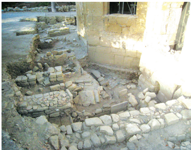
Εικ. 3. Αποψη του νεκροταφείου της βενετοκρατίας κατά την αφαίρεση της επίχωσης ανατολικά των ασφίδων.

αδιάγνωστου αξιωματούχου εντοπίστηκε στο στρώμα κρημνισμάτων του κεντρικού κλίτους, ενώ ένα ακόμη από τη Γόρτυνα, με μονόγραμμα του Αντωνίου, εκτίθεται στο Ιστορικό Μουσείο Κρήτης 11 .