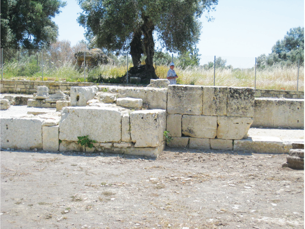
Εικ. 17. Λείψανα της έμφραξης τμήματος του νότιου στυλοβάτη (επέμβαση περιόδου βενετοκρατίας).

βασιλικής, καθώς διατυπώθηκε η άποψη ότι εκεί βρισκόταν το λείψανο του αποστόλου, ως την καταστροφή της, αν και στους πρωτοβυζαντινούς χρόνους τα μαρτύρια δεν λειτουργούσαν ως καθεδρικοί (Άγιος Πέτρος Ρώμης, Άγιοι Απόστολοι Κωνσταντινούπολης, Άγιος Ιωάννης Εφέσου, Άγιος Λεωνίδης στο Λέχαιο, Άγιος Αχίλλειος Λάρισας, Άγιος Δημήτριος Θεσσαλονίκης). Έτσι, αμφισβητήθηκαν οι πρωιμότερες μαρτυρίες των περιηγητών C. Buondelmonti του 1415 [Van Spitael, Buondelmonti , ό.π. (υποσημ. 27), 173-176] και O. Belli του 1596 (L. Beschi, Onorio Belli Accademico Olimpico. Scritti di antiquaria e botanica, 1586-1602 , Βενετία 2000, 24), αλλά και του F. Cornelius του 1755 [F. Cornelius, Creta Sacra , ό.π. (υποσημ. 77), 194-195], και δόθηκε έμφαση στην αναφορά των ντόπιων ως «Παναγία Κερά» [F. Halbherr, «Greek Christian Inscriptions in the Cyclades and in Crete», The Athenaeum 3336 (1891), 459]. Αφορμή για τη σύγχυση στάθηκαν, απ' ό,τι φαίνεται, η αφιέρωση το 1842 του βόρειου παρεκκλησίου στην Παναγία Τιμία