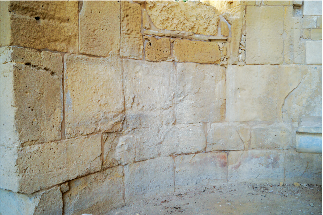
Εικ. 16. Εσωτερική όψη της κεντρικής αψίδας του ιερού, κάτω από το βόρειο παράθυρο: αρχική ψευδοϊσόδομη κατασκευαστική φάση.

αποφασίσει ν' αποσυρθούν στον οχυρωμένο λόφο της ελληνιστικής ακρόπολης 87 . Μάλιστα, παρά τη δημογραφική και οικονομική καταστροφή, το νέο κτίσμα δεν υπήρξε ταπεινό, ούτε πρόχειρο, αλλά μια μνημειακών διαστάσεων επιβλητική κατασκευή, υψηλής τεχνικής δυσκολίας, η οποία πειραματίστηκε πάνω σ' έναν ακόμη εξελισσόμενο αρχιτεκτονικό τύπο, μια κατασκευή αντάξια του ιστορικού παρελθόντος της κατεστραμμένης πόλης και προφανώς του τιμώμενου αγίου.