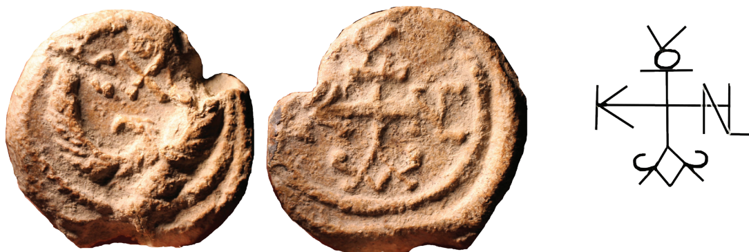
Εικ. 10. Μολυβδόβουλλο Κωνσταντίνου με παράσταση αετού από την επίχωση ανατολικά της αφίδας.

του μαρμάρου στα σωζόμενα μέρη (πεντελικό στη βάση του εξώστη, Υμηττού στο θωράκιο, ίσως Πάρου στα ορθογώνια στηρίγματα και Αλυκής στους πεσσίσκους) και κυρίως η ανεπιτυχής συναρμογή του εξώστη προς τη βάση, λόγω διαφορετικής καμπυλότητας. Δεδομένου ότι ο ναός ανεγέρθηκε σε μια εποχή που η μαζική παραγωγή και εξαγωγή αμβώνων από τα εργαστήρια της Κωνσταντινούπολης είχε πια ατονήσει και η πόλη αγωνιζόταν ν' ανασυνταχθεί στην ακρόπολη μετά από μια τεράστιας κλίμακας καταστροφή, η συναρμογή σπολίων ήταν πιθανότατα η μόνη εύκαιρη λύση 57 . Υπό το πρίσμα αυτό, ο άμβωνας του Αγίου Τίτου πρέπει να αξιολογηθεί όχι σύμφωνα με τα παλαιοχριστιανικά πρότυπα αλλά με τις ανάγκες της εποχής και τις ιδιαιτερότητες του μνημείου που τον φιλοξένησε.