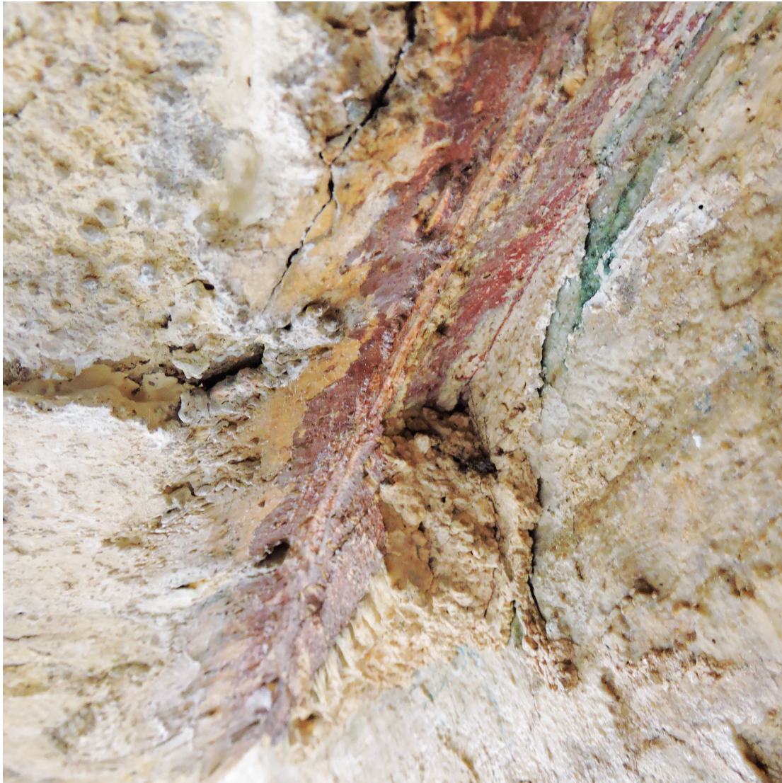
Εικ. 13. Λείψανα των επάλληλων φάσεων επιτοίχιου διακόσμου κάτω από τον λίθινο κοσμήτη του ημισφαιρίου της βόρειας κόγχης του Βήματος.

αντιθέτως, υποδέχονταν –ξύλινες πιθανότατα– δοκούς που λειτουργούσαν ενισχυτικά, αποτρέποντας την υποχώρηση των κλειδιών των ανωφλίων. Το μοναδικό μαρμάρινο ανώφλιο, που εντοπίστηκε σε δύο τεμάχια 74 πρέπει, με βάση τις διαστάσεις του, να αποδοθεί σε κάποιο από τα εξωτερικά θυρώματα του ναού.