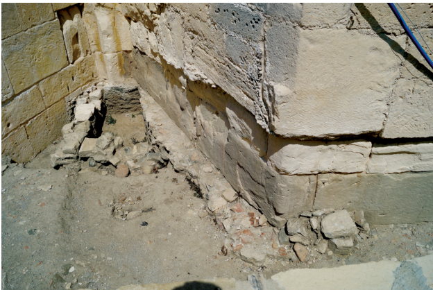
Εικ. 8. Νότια εξωτερική πλευρά της κεντρικής αψίδας και τμήμα της ανατολικής τοιχοποιίας του νότιου κλίτους αποκομμένου από την κατασκευή της νότιας αψίδας.

δύο βάσεις κιόνων, που απείχαν μεταξύ τους 1,00 μ. και από τις παραστάδες ±1,60 μ. 43 . Αργότερα, τα ανατολικά διάστυλα, μήκους 1,62 μ., αντικαταστάθηκαν με τοιχοποιία και κατά συνέπεια η αρχική τοξοστοιχία καταργήθηκε ή διαφοροποιήθηκε. Σε οψιμότερη εποχή, στη νότια κόγχη του ναού διανοίχθηκε θύρα