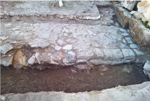
Εικ. 9. Δοκιμαστική τομή στη νότια πλευρά τους εγκάρσιου κλίτους, στην ένωση του Βήματος με το νότιο παράβημα, που αποκάλυψε τη θεμελίωση του νότιου στυλοβάτη της παλαιοχριστιανικής βασιλικής.

Από τα φράγματα των κλιτών φαίνεται να προέρχονται τα πολυάριθμα τμήματα επιπεδόγλυφων θωρακίων, από μάρμαρο πιθανότατα Αλυκής, ορισμένα από τα οποία είναι αμφίγλυφα. Τα περισσότερα κοσμούνται με συνδυασμούς ρόμβων ή σταυρούς 49 . Η ομοιογένεια του υλικού και της τεχνικής υποδηλώνει ότι ανήκουν σε μια ενιαία χρονολογικά ομάδα, που εκτελέστηκε στα χρόνια του επισκόπου Συνεσίου 50 . Ο Συνέσιος παραμένει άγνωστος, αλλά η τεχνοτροπική συνάφεια του υλικού με παραδείγματα κυρίως του 8ου-9ου αιώνα 51 τον καθιστά πιθανό πάτρωνα του μνημείου, στην