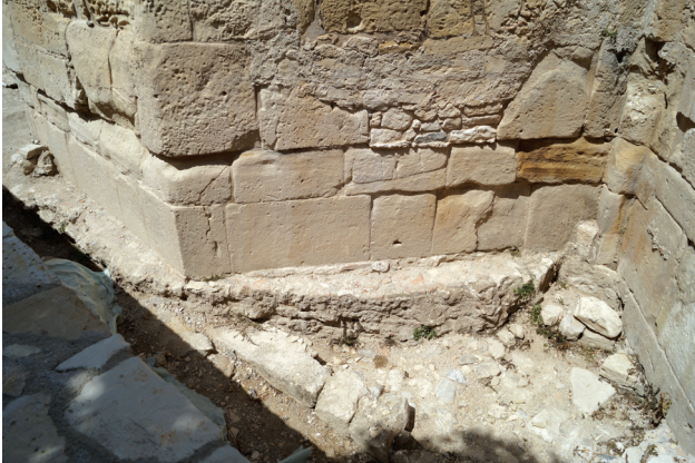
Εικ. 7. Βόρεια εξωτερική πλευρά της κεντρικής αψίδας. Διακρίνεται η προεξοχή ανάμεσα στην αρχική κατασκευαστική φάση και τη συμπλήρωση της βενετοκρατίας, καθώς και η ημικυκλική θεμελίωση της αψίδας της παλαιοχριστιανικής βασιλικής. Στα δεξιά διακρίνεται η θεμελίωση του βόρειου παραβήματος.