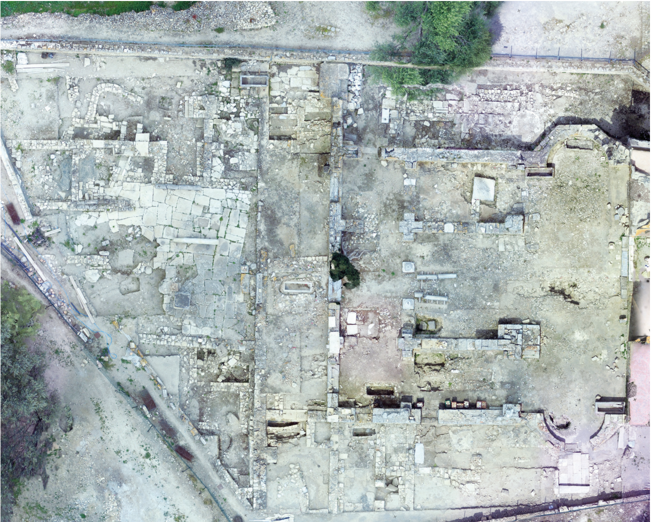
Εικ. 2. Γενική άποψη του χώρου της ανασκαφής (φωτογραμμετρική λήψη).

στρεπτού κίονα μετρίου μεγέθους (πιθανόν από κιβώριο), θραύσματα αφρικανικών και μικρασιατικών πινακίων και θραύσματα αμφορέων. Στα ανώτερα στρώματα, μαζί με υλικό της βενετοκρατίας, βρέθηκε μια πόρπη τύπου Συρακουσών και ένα μολυβδόβουλλο, που στη μια όψη φέρει σταυρόσχημο μονόγραμμα σε στεφάνι από ψαροκόκκαλο, που πιθανότατα αναλύεται ΚΩΝΣΤΑΝΤΙΝΟΥ 8 , ενώ στην άλλη παράσταση αετού με απλωμένα φτερά, κάτω από τα αρχικά