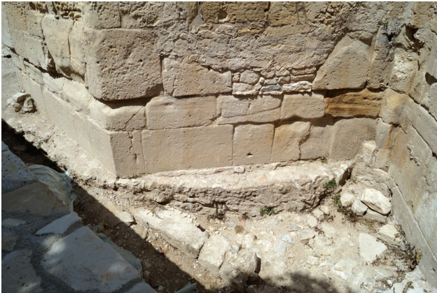
Εικ. 7. Βόρεια εξωτερική πλευρά της κεντρικής αψίδας. Διακρίνεται η προεξοχή ανάμεσα στην αρχική κατασκευαστική φάση και τη συμπλήρωση της βενετοκρατίας, καθώς και η ημικυκλική θεμελίωση της αψίδας της παλαιοχριστιανικής βασιλικής. Στα δεξιά διακρίνεται η θεμελίωση του βόρειου παραβήματος.