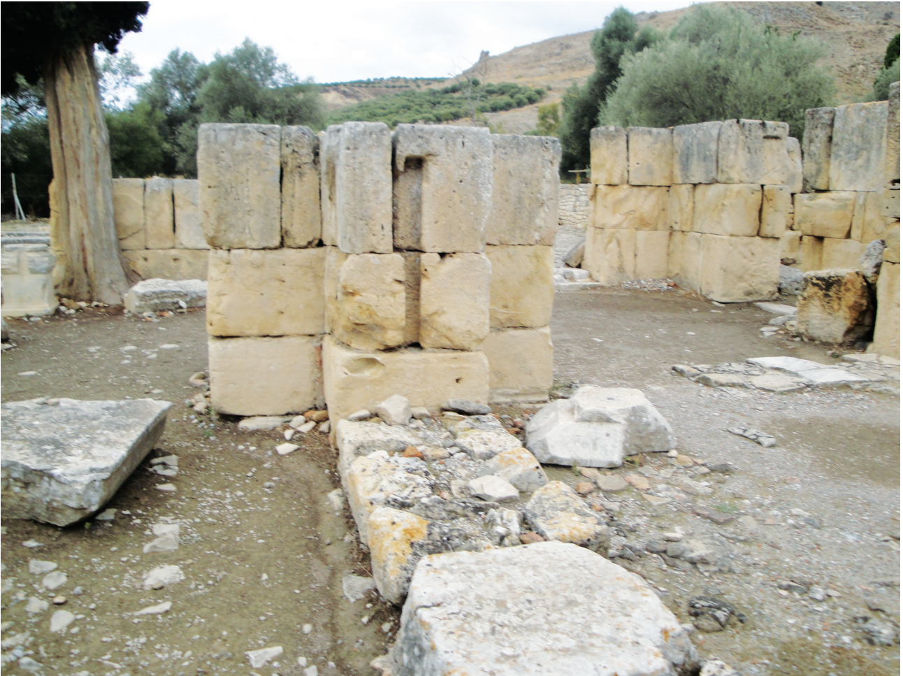
Εικ. 11. Βόρειος στυλοβάτης του τρουλλαίου ναού προς τα δυτικά. Διακρίνεται η αρχική στάθμη του στυλοβάτη και η εγκοπή υποδοχής διαχωριστικού θωρακίου.

του Αν. Ορλάνδου, έχει σήμερα χαθεί 69 . Τμήμα ενός αντίστοιχου θωρακίου βρέθηκε κατά την πρόσφατη ανασκαφή επαναχρησιμοποιημένο ως καλυπτήρια πλάκα σε τάφο του νεκροταφείου της βενετοκρατίας, ανατολικά του νότιου παραβήματος, και πιθανόν αποτελούσε ζεύγος με το προηγούμενο (Εικ. 14, 15). Από το παγώνι σώζεται μέρος της κυκλικού σχήματος ουράς με αντίστοιχη γραμμική απόδοση στο φτέρωμα, πάνω σε βάθος με ελισσόμενο βλαστό, πανομοιότυπο μ' εκείνον στην κάτω επιφάνεια του τμήματος επιστυλίου που διατηρείται κατά χώραν 70 .