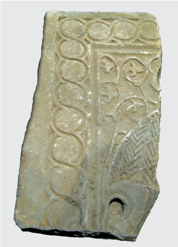
Εικ. 14. Τμήμα θωρακίου τέμπλου με λείψανα παράστασης παγωνιού και ελισσόμενο βλαστό (κύρια όψη).