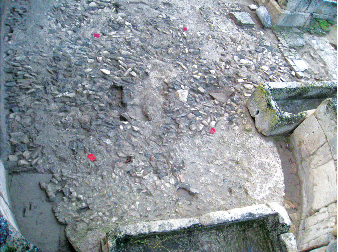
Εικ. 12. Βόρεια ασπίδα του εγκάρσιου κλίτους (από ψηλά). Διακρίνεται το στρώμα κρημνισμάτων που χρησιμοποιήθηκε ως προετοιμασία του δαπέδου και το ίχνος του περιμετρικού θρανίου. Η λαξευτή τοιχοποιία που διακρίνεται στο περίγραμμα του ίχνους, ανήκει στο κτήριο των ελληνιστικών - ρωμαϊκών χρόνων.

του G. Gerola 71 και με ένα κιονόγραμμα που εντοπίστηκε στο Ιστορικό Μουσείο Κρήτης με ένδειξη προέλευσης τον Άγιο Τίτο. Τέλος, τέσσερα θραύσματα μικρότερων επιστυλίων, εκ των οποίων το ένα είχε θεωρηθεί υπέρθυρο 72 , έχουν σαφείς τεχνικές και τεχνοτροπικές