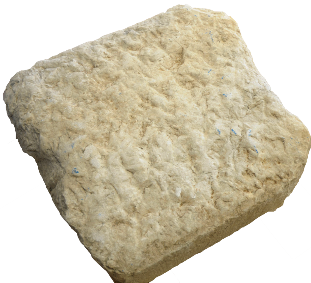
Εικ. 6. Η οπίσθια όψη της ενεπίγραφης στήλης.

ίδιο χρονικό ορίζοντα οδηγούν οι διαθέσιμες ιστορικές μαρτυρίες, καθώς και τα αρχαιολογικά κατάλοιπα που έχουν αποκαλυφθεί στο κάστρο της Λάρισας, όπως θα αναφερθεί στην συνέχεια.