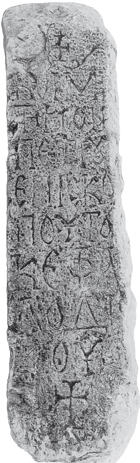
Εικ. 4. Η επιτύμβια επιγραφή του επισκόπου Κεφαλονδίου Πέτρου.

της εποχής των εικονομάχων αυτοκρατόρων, όπως μιλιαρέσια του Λέοντος Γ΄ Ισαύρου (717-741) 40 , του νομισματοκοπέιου της Κωνσταντινουπόλεως (720-741), μιλιαρέσιο βασιλείας Λέοντος Ε΄ του Αρμενίου (813-820) 41 , επίσης του ίδιου νομισματοκοπέιου, της περιόδου 813-820, καθώς και μιλιαρέσια της βασιλείας του Θεοφίλου (829-842) 42 , του νομισματοκοπέιου της Κωνσταντινουπόλεως, των περιόδων 830 ή 831, 830/1-838, 838-840, 840-842. Ακόμη, υπάρχει αντιστοιχία του σταυρού της επιγραφής του Άργους με σφραγίδες εικονομάχων αυτοκρατόρων, που φέρουν στον οπισθότυπο ανισοσκελή σταυρό 43 . Ομοιότητα στον τρόπο χάραξης του σταυρού αναγνωρίζεται και στην μνημειακή ζωγραφική της εικονομαχικής περιόδου, όταν ο σταυρός γίνεται σταδιακά το κυρίαρχο σύμβολο των βυζαντινών εκκλησιών, τόσο στην πρωτεύουσα όσο και στις επαρχίες της αυτοκρατορίας· αντιστοιχεί στην απεικόνιση του Χριστού και προσλαμβάνει βαθιά θεολογική έννοια 44 . Τέλος, όμοιος ανισοσκελής