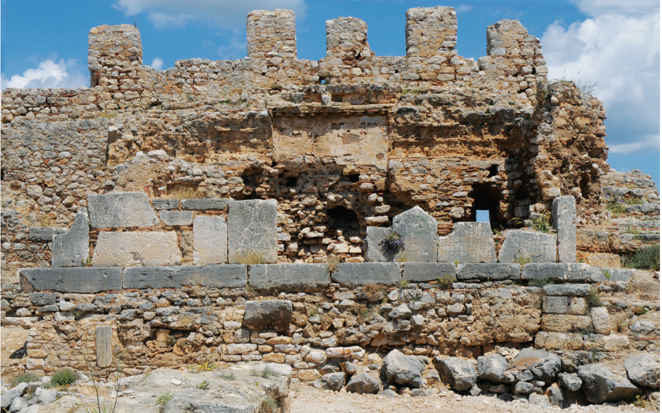
Εικ. 5. Άργος, κάστρο της Λάρισας, ο μεσοβυζαντινός ναός της Κοίμησης της Θεοτόκου.

σταυρός υπάρχει, επίσης, και στην άνω επιφάνεια της κτιστής τράπεζας της προθέσεως στον Άγιο Ιωάννη στ' Αθησαρού στην Νάξο 45 , καθώς και στην τοιχογραφία της κόγχης του ανατολικού παρεκκλησίου της