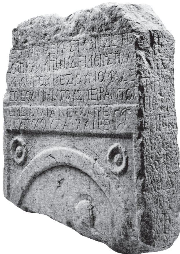
Εικ. 2. Η ενεπίγραφη στήλη με τις δύο επιγραφές στην πρόσθια και την πλάγια όψη.

22 Mango, «Byzantine Epigraphy», ό.π. (υποσημ. 14), 246 εικ. 25.