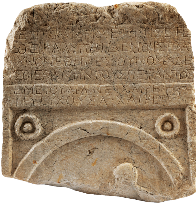
Εικ. 3. Το ρωμαϊκό επιτύμβιο επίγραμμα, 2ος αιώνας μ.Χ.

Κλάδωνος του 926 28 . Επίσης, στην ίδια εποχή παραπέμπει η γραφή του έψιλον με τις στρογγυλεμένες απολήξεις, που παρουσιάζει ομοιότητες με επιγραφή των τειχών της Νικαίας 29 , του μητροπολίτη Ηρακλείας 30 , του ναού του Αγίου Γρηγορίου του Θεολόγου (871/2) 31 και του ναού της Παναγίας της Σκριπού (873/874) 32 . Το κάππα παρουσιάζει μεγάλη ομοιότητα με εκείνα της επιγραφής του μητροπολίτη Ηρακλείας 33 , της επιγραφής των τειχών της Θεσσαλονίκης (861/2) 34 , του ναού του Αγίου Γρηγορίου του Θεολόγου 35 , του ναού