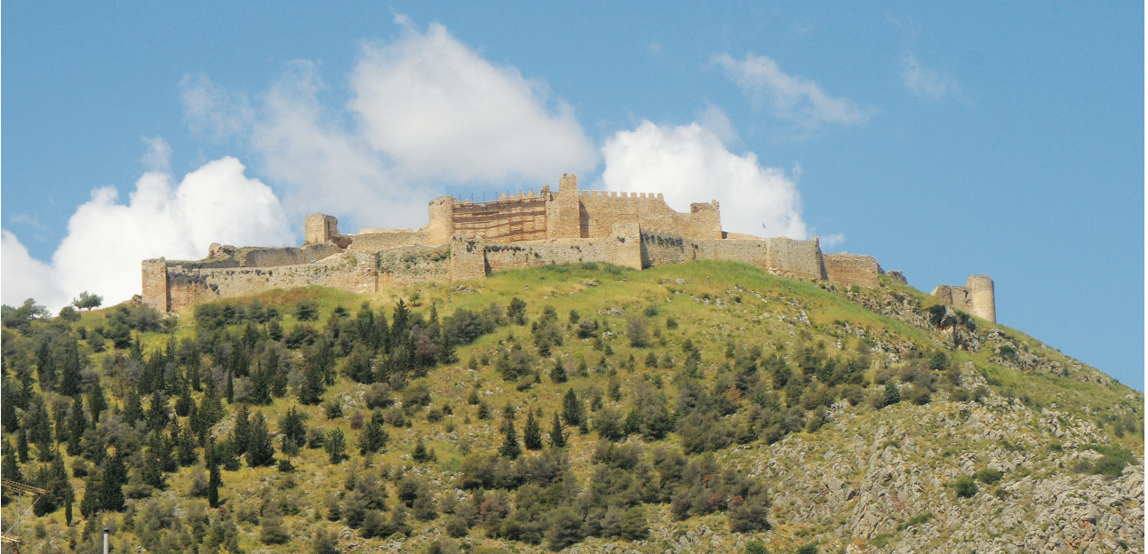
Εικ. 1. Άργος, κάστρο της Λάρισας, γενική άποψη.

Η χρονολόγηση αυτή βασίστηκε κυρίως στον τύπο του σταυρού, τον λακωνικό τύπο της αναγραφής και στην μορφή των γραμμάτων 12 . Ο επιγραφολόγος Denis Feissel το 2002 διατύπωσε πρώτος επιφύλαξη για την πρωμότητα του μνημείου προτείνοντας χρονολόγηση της επιγραφής στον 8ο ή ακόμη και στον 9ο αιώνα. 13