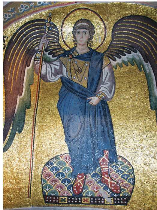
Εικ. 7. Μονή Δαφνίου, καθολικό της Κοίμησης της Θεοτόκου. Ιερό. Νότια κόγχη: ο αρχάγγελος Γαβριήλ.