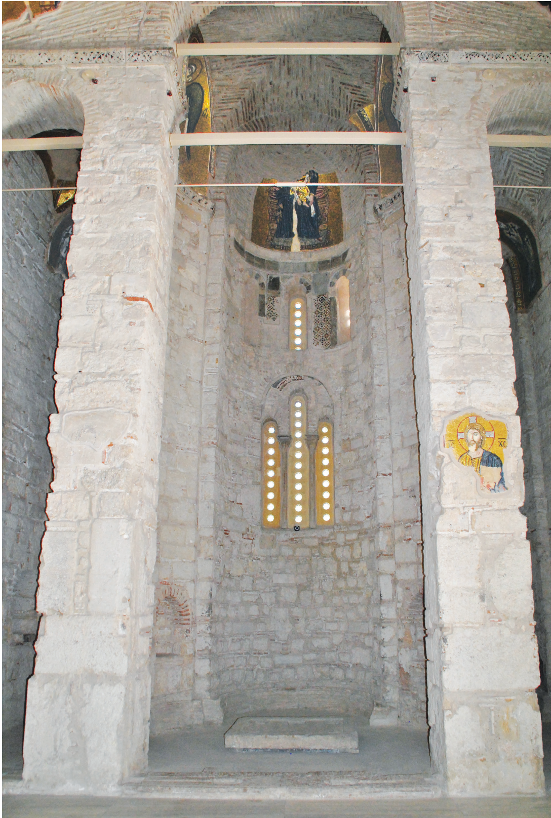
Εικ. 1. Μονή Δαφνίου, καθολικό της Κοίμησης της Θεοτόκου. Όψη προς το ιερό.