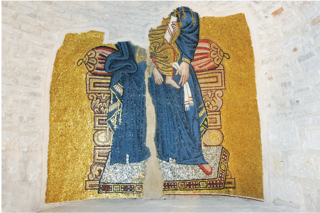
Εικ. 6. Μονή Δαφνίου, καθολικό της Κοίμησης της Θεοτόκου. Ιερό, αψίδα: η Παναγία ένθρονη βρεφοκρατούσα.

Στο εσωράχιο του τόξου, εμπρός από την κόγχη του διακονικού, αντίστοιχα με τον Σίλβεστρο και τον Άνθιμο της πρόθεσης, εικονίζονται οι επίσκοποι Ελευθέριος, Ο Α(ΓΙΟ) Ε/Λ/ΕΥ//ΘΕ/ΡΙ/Ο/Σ , «εκ της μεγαλόπολεως Ρώμης», επίσκοπος Ιλλυρικού 54 , και Αβέρκιος, Ο Α(ΓΙΟ) <Α>Β/ΕΡ//Κ/Ι/Ο/Σ 55 (Εικ. 11), επίσκοπος Ιεράπολης στη Φρυγία, με μεγάλη θαυματουργική και ιεραποστολική δράση 56 .