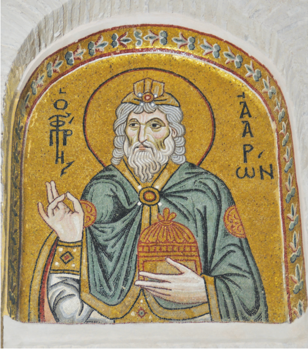
Εικ. 9. Μονή Δαφνίου, καθολικό της Κοίμησης της Θεοτόκου. Πρόθεση. Βόρειος τοίχος: ο προφήτης Ααρών. Σήμερα: κυρίως ναός. Βόρειος τοίχος.