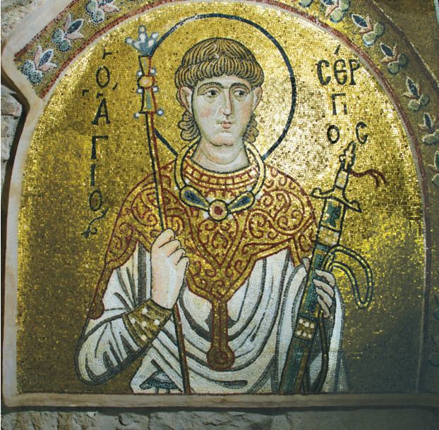
Εικ. 16. Μονή Δαφνίου, καθολικό της Κοίμησης της Θεοτόκου. Δυτικός τοίχος: ο άγιος Σέργιος.