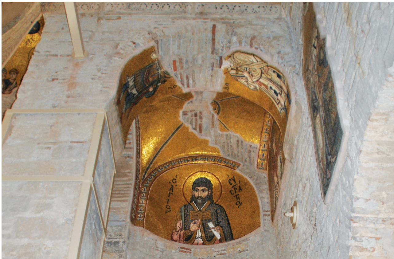
Εικ. 18. Μονή Δαφνίου, καθολικό της Κοίμησης της Θεοτόκου. Νοτιοδυτικό διαμέρισμα, νότια κόγχη: ο άγιος Ευστράτιος, στο εσωράχιο είναι ορατοί οι άγιοι Μαρδάριος και Ορέστης.

νίσσεται αγάπη προς τη θαυματουργική δράση 105 .