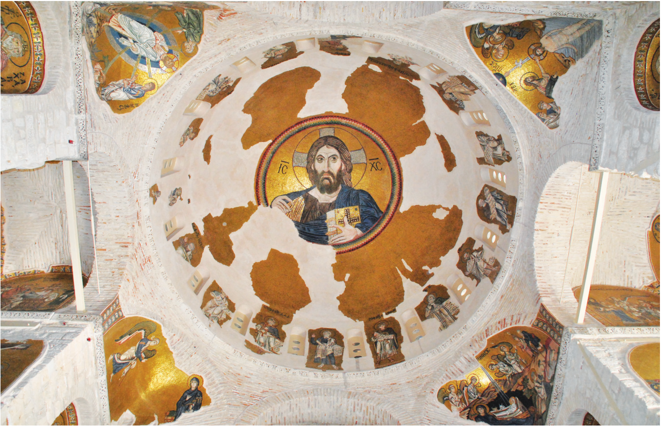
Εικ. 3. Μονή Δαφνίου, καθολικό της Κοίμησης της Θεοτόκου. Τρούλος: ο Παντοκράτορας με τους προφήτες. Ημιχόνια: Ο Ευαγγελισμός, η Γέννηση, η Βάπτιση, η Μεταμόρφωση.

/ ΠΑΝ[ΤΑΣ] 30 , που υμνεί τη μεγαλοσύνη του Κυρίου.