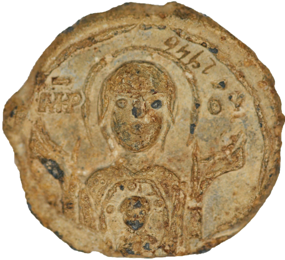
Εικ. 20. Αθήνα, Νομισματικό Μουσείο. Μολυβδόβουλλο, ΚΟ 94 (ΑΕ2946). Εμπροσθότυπος: η Παναγία Επίσκεψις Μονόγραμμα: Μήτηρ Θεού.