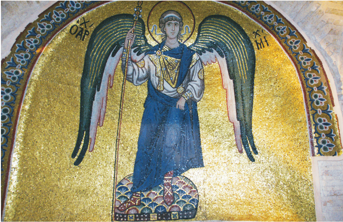
Εικ. 5. Μονή Δαφνίου, καθολικό της Κοίμησης της Θεοτόκου. Ιερό. Βόρεια κόγχη: ο αρχάγγελος Μιχαήλ.

Θ<Α>Υ/ΜΑ/ΤΟΥΡ/ΓΟ/С 48 (Εικ. 13), επίσκοπος Νεοκαισαρείας του Πόντου. Είχαν τοποθετηθεί στην αντίστοιχη θέση 49 και σε όμοια εμφαντική κλίμακα με τους αρχιερείς της Παλαιάς Διαθήκης Ααρών και Ζαχαρία, κρατώντας με καλυμμένη την αριστερά το Ευαγγέλιο και ακουμπώντας το ευλαβικά με τη δεξιά. Ο άγιος Γρηγόριος ο Ακρραγαντίνος έλαβε μέρος στην ΣΤ΄ Οικουμενική Σύνοδο (680-681) και στην έν Τρούλλω (692)