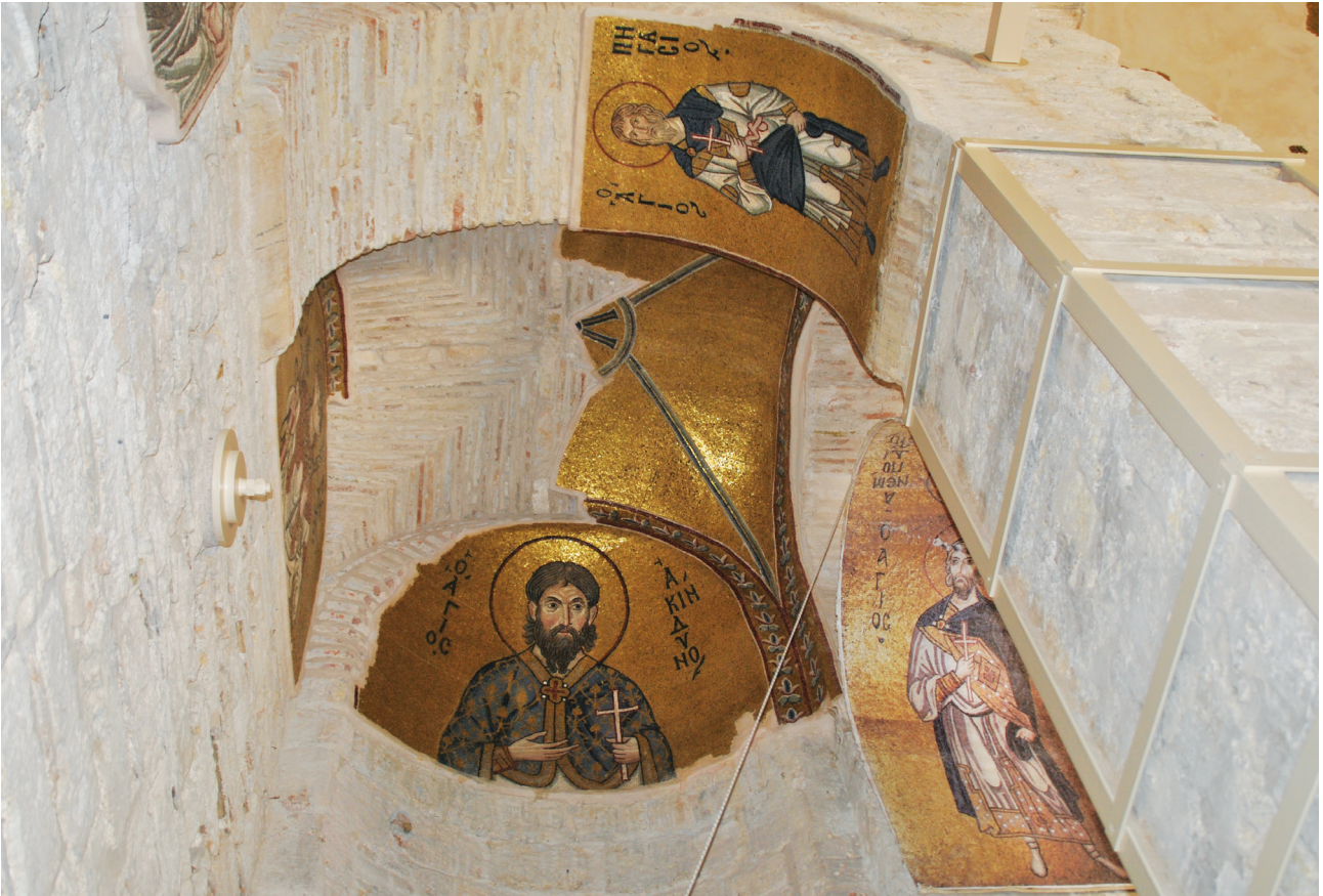
Εικ. 19. Μονή Δαφνίου, καθολικό της Κοίμησης της Θεοτόκου. Βορειοδυτικό διαμέρισμα, βόρεια κόγχη: ο άγιος Ακίνδυνος, στα εσωράχια είναι ορατοί οι άγιοι Πηγάσιος και Ακίνδυνος.

μεγάλο πλούτο. Ίδρυσε το μοναστήρι και αφιέρωσε το καθολικό του στην Κοίμηση της Θεοτόκου, εκφράζοντας παράλληλα ιδιαίτερη τιμή σε δύο ιεράρχες με το όνομα Γρηγόριος, γιατί αυτό ήταν πιθανώς το όνομά του. Τα χαρακτηριστικά αυτά, όπως συγκεντρώθηκαν παραπάνω, ωθούν στην αναζήτηση ενός προσώπου στα τέλη του 11ου με αρχές 12ου αιώνα, με ανάλογη προσωπικότητα. Ιδιαίτερα ενδιαφέρουσες πληροφορίες προς αυτήν την κατεύθυνση μας προσφέρουν τρία δημοσιευμένα μολυβδόβουλλα, ένα στη συλλογή του Dumbarton Oaks και δύο στο Νομισματικό Μουσείο Αθηνών, τα οποία χρονολογούνται στην περίοδο από τα τέλη του 11ου μέχρι το πρώτο τέταρτο του 12ου αιώνα και ανήκουν στον Γρηγόριο Καματηρό. 109 Και τα τρία αυτά μολυβδόβουλλα φέρουν στην εμπρόσθια