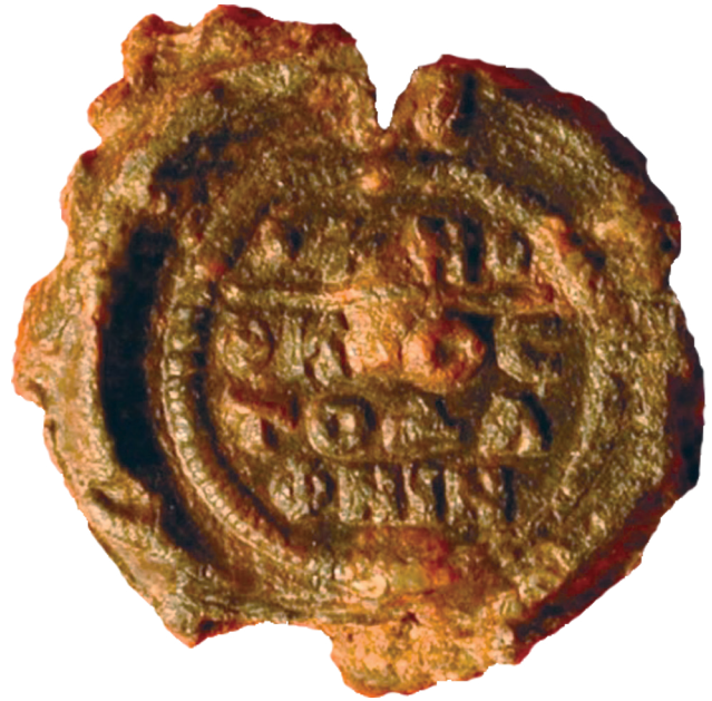
Εικ. 23. Παρίσι, Bibliothèque nationale de Paris , BNF 1723b. Μολυβδόβουλλο εγγράφων της Μονής Δαφνίου. Οπισθότυπος: + Η Θεοτόκος το Δαφνίν.

τη μονή Δαφνίου 166 . Στον εμπροσθότυπο εικονίζεται η Παναγία Επίσκεψις , όμοια πολύ κατά τον τύπο με την παράσταση που κοσμεί τα μολυβδόβουλλα του Γρηγορίου 167 , αν και πρόκειται για πολύ κοινό τύπο απεικόνισης της Παναγίας σε μολυβδόβουλλα αυτήν την εποχή. Οι μικρές διαστάσεις, σε συνδυασμό με την ύπαρξη αύλακας, δείχνουν πιθανόν ότι πρόκειται για σφραγίδια που χρησιμοποιούσε η μονή σε έγγραφα για τη διαχείριση των υποθέσεών της. Είναι αξιοσημείωτο, μάλιστα, για τις διασυνδέσεις της Μονής και ίσως του κτήτορά της, ότι ένα σφραγίδιο από τα έξι δημοσιευμένα παραδείγματα, που, όπως έχει υποστηριχθεί,