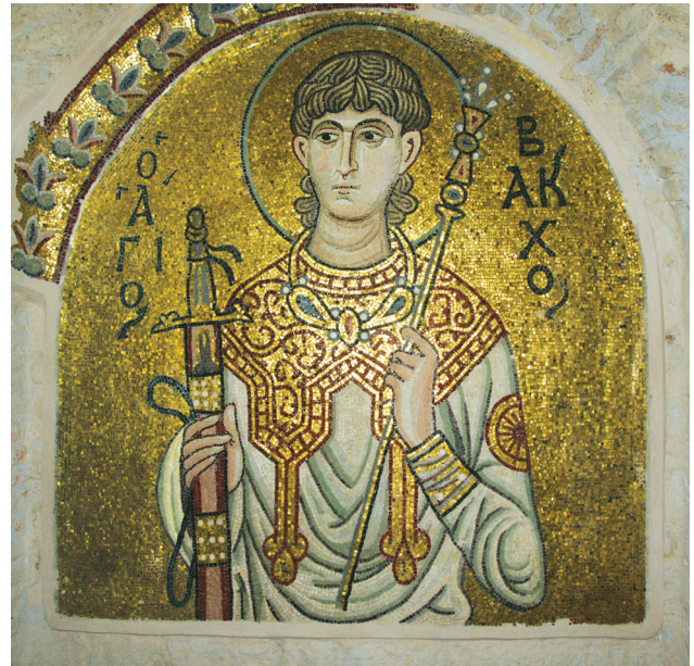
Εικ. 17. Μονή Δαφνίου, καθολικό της Κοίμησης της Θεοτόκου. Δυτικός τοίχος: ο άγιος Βάχχος.

μοναστικών αγίων 94 και αγίων γυναικών 95 , όπως φαίνεται από τις σωζόμενες παραστάσεις.