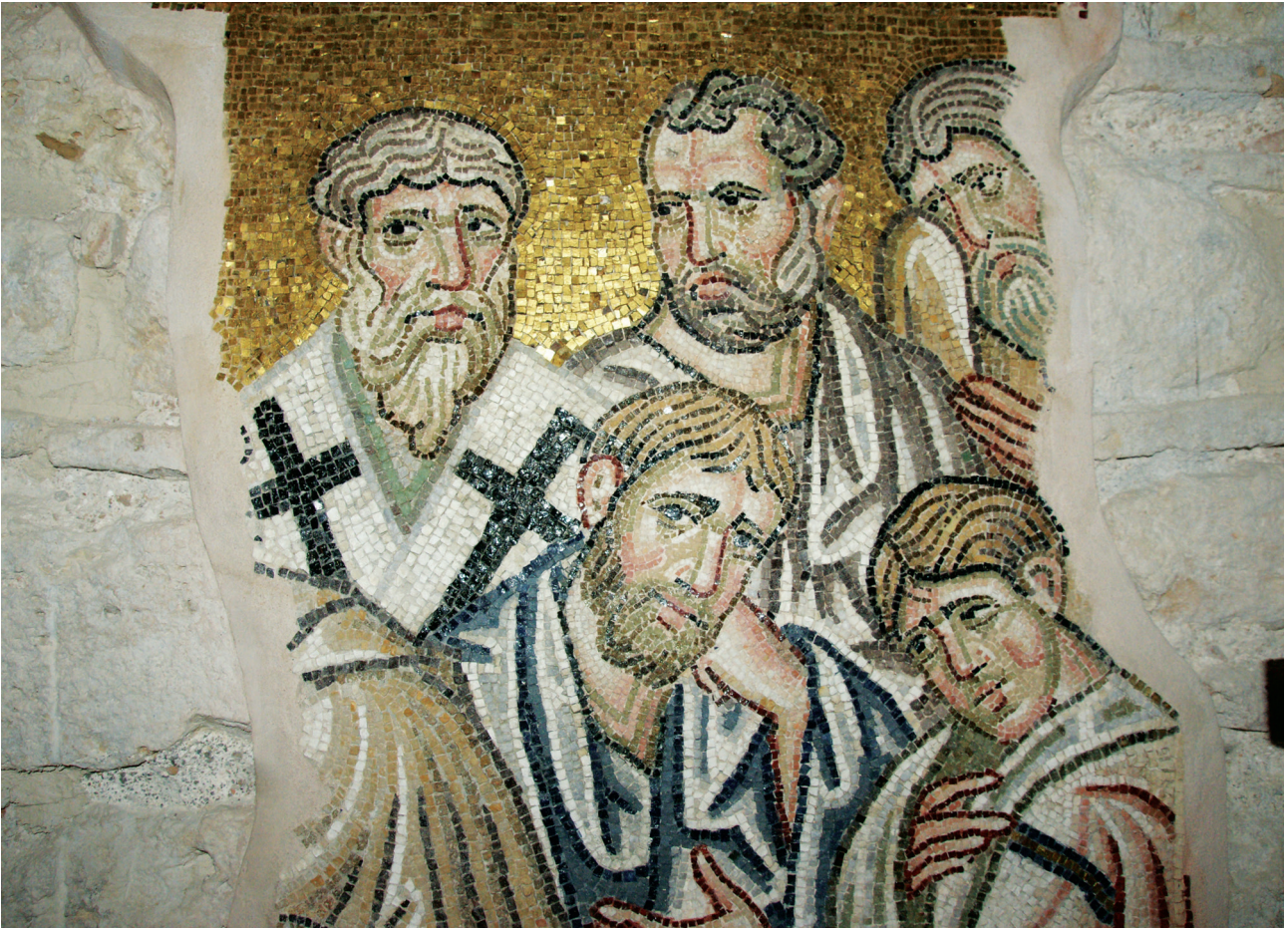
Εικ. 15. Μονή Δαφνίου, καθολικό της Κοίμησης της Θεοτόκου. Κυρίως ναός. Δυτικός τοίχος: η Κοίμηση της Θεοτόκου, λεπτομέρεια.

Τις αντίστοιχες επιφάνειες στη βορειοδυτική πλευρά του ναού, που ήταν καλυμμένη –αντίστοιχα με τη νοτιοδυτική– με διακοσμημένο σταυροθόλιο, καταλάμβαναν οι πέντε πέρσες μάρτυρες, ο Ακίνδυνος, Ο / Α/Γ/Ι/Ο/Σ Α/ΚΙΝ/Δ/Υ/ΝΟ/Σ , στην κόγχη, ο Ελπιδηφόρος, Ο / Α/Γ/Ι/Ο/Σ ΕΛ/ΠΙ/Δ<Η>/ΦΟ/ΡΟ/Σ 91 , ο Ανεμπόδιστος, Ο / Α/Γ/Ι/Ο/Σ Α/ΝΕΜ/ΠΟ/ΔΙ/ΣΤΟ/Σ , και ο Πηγάσιος, Ο / Α/Γ/Ι/Ο/Σ ΠΗ/ΓΑ/ΣΙ/Ο/Σ , στα εσωράγια των τόξων. Ο Αφθόνιος δεν σώζεται 92 (Εικ. 19).