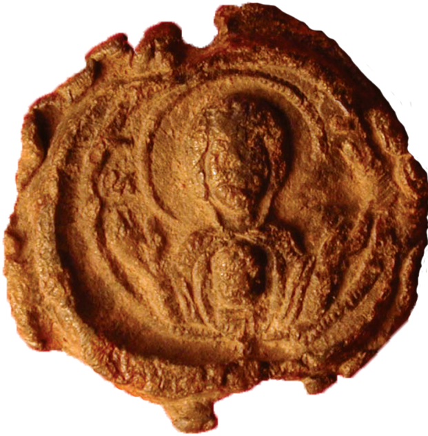
Εικ. 22. Παρίσι, Bibliothèque nationale de Paris , BNF 1723a. Μολυβδόβουλλο εγγράφων της Μονής Δαφνίου. Εμπροσθότυπος: η Παναγία Επίσκεψις.