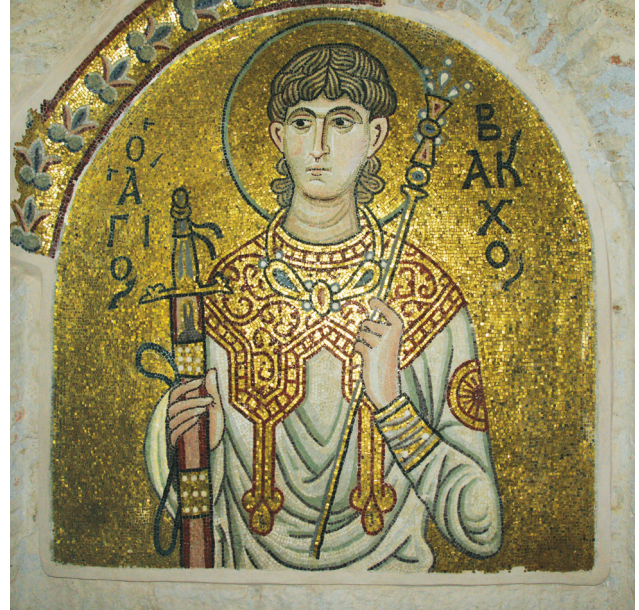
Εικ. 17. Μονή Δαφνίου, καθολικό της Κοίμησης της Θεοτόκου. Δυτικός τοίχος: ο άγιος Βάχχος.

μοναστικών αγίων 94 και αγίων γυναικών 95 , όπως φαίνεται από τις σωζόμενες παραστάσεις.