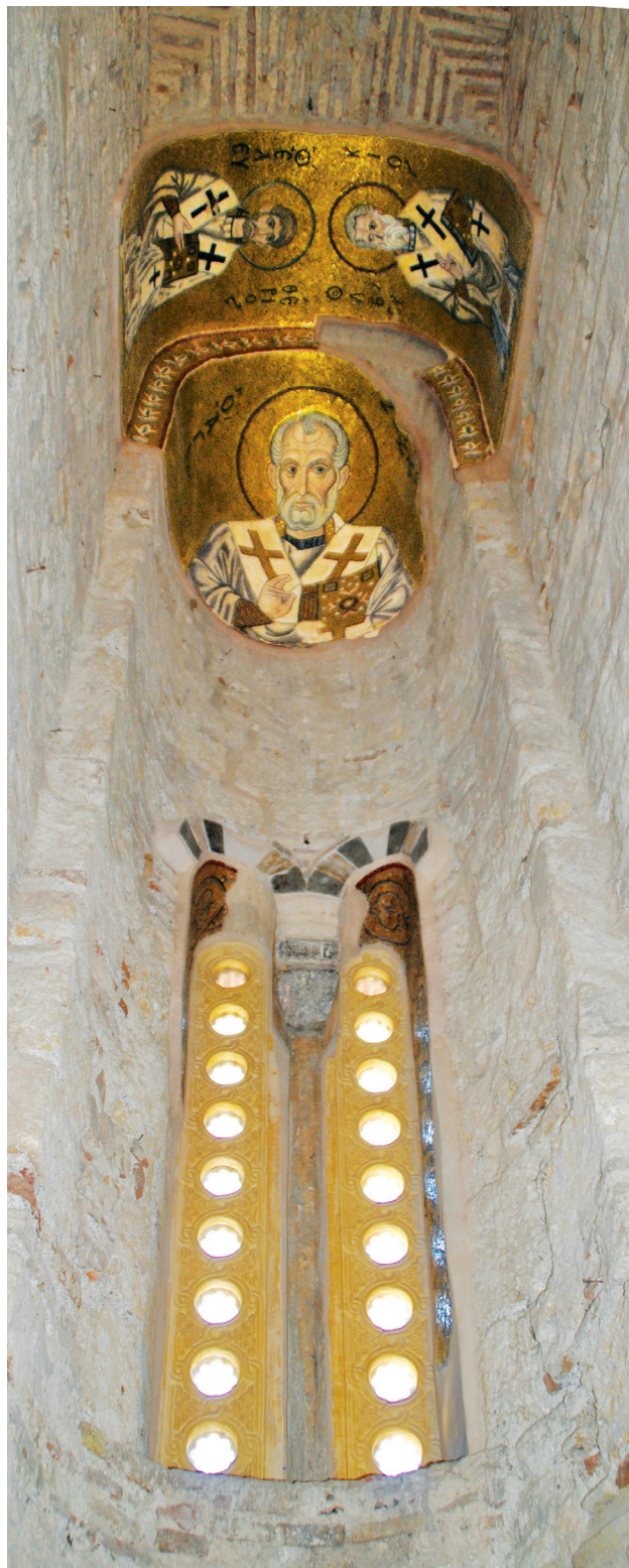
Εικ. 11. Μονή Δαφνίου, καθολικό της Κοίμησης της Θεοτόκου. Διακονικό. Τεταρτοσφαιρίο: ο άγιος Νικόλαος. Εσωράχιο τόξου: ο άγιος Ελευθέριος και ο άγιος Αβέροκιος.

77 Όπως μόλις αναφέρθηκε και για τον κύκλο του Πάθους, Lafontaine-Dosogne, «L'évolution», ό.π. (υποσημ. 72), 319, έτσι και για τον μαριολογικό, J. Lafontaine-Dosogne, Iconographie de l'Enfance de la Vierge dans l'Empire byzantin et en Occident , Βρυξέλλες 1992 (επανεκδ.), 37-39, 68-81, 89-120, 128-133, 136-167. Η ίδια, «Iconography of the Life of Virgin», P. Underwood (επιμ.), The Kariye Djami , 4, 1975, 165-166. Για την εμπλοκή των εικονογραφικών κύκλων του βίου των αγίων στα εικονογραφικά προγράμματα από τον 11ο αιώνα, βλ. Sv. Tomekonović, «Les répercussions du choix du saint patron sur le programme iconographique des églises du 12 e siècle en Macédoine et dans le Péloponnèse», Zograf 12 (1981), 40-42.