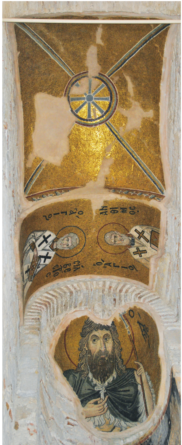
Εικ. 8. Μονὴ Δαφνίου, καθολικὸ τῆς Κοίμησης τῆς Θεοτόκου. Πρόθεση. Τεταρτοσφαίριο: ὁ ἅγιος Ἰωάννης ὁ Πρόδρομος. Εσωράχιο τόξου: ὁ ἅγιος Σίλβεστρος καὶ ὁ ἅγιος Ἀνθίμος.