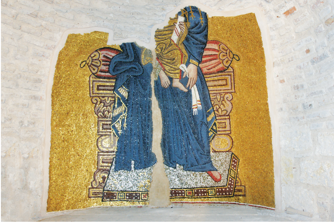
Εικ. 6. Μονή Δαφνίου, καθολικό της Κοίμησης της Θεοτόκου. Ιερό, αψίδα: η Παναγία ένθρονη βρεφοκρατούσα.

Στο εσωράχιο του τόξου, εμπρός από την κόγχη του διακονικού, αντίστοιχα με τον Σίλβεστρο και τον Άνθιμο της πρόθεσης, εικονίζονται οι επίσκοποι Ελευθέριος, Ο Α(ΓΙΟC) Ε/Λ/ΕΥ//ΘΕ/ΡΙ/Ο/C , «εκ της μεγαλόπόλεως Ρώμης», επίσκοπος Ιλλυρικού 54 , και Αβέρκιος, Ο Α(ΓΙΟC) <Α>Β/ΕΡ//Κ/Ι/Ο/C 55 (Εικ. 11), επίσκοπος Ιεράπολης στη Φρυγία, με μεγάλη θαυματουργική και ιεραποστολική δράση 56 .