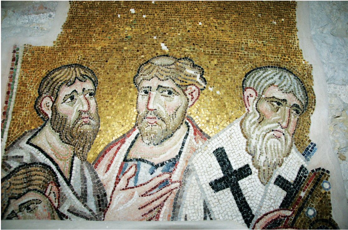
Εικ. 14. Μονή Δαφνίου, καθολικό της Κοίμησης της Θεοτόκου. Κυρίως ναός. Δυτικός τοίχος: η Κοίμηση της Θεοτόκου, λεπτομέρεια.

Α(ΓΙΟC) ΑΝ/ΔΡ/Ο//ΝΙ/Κ/ΟC, Τάραχος, [Ο ΑΓΙΟC ΤΑ//ΡΑ/ΧΟ/C, και Πρόβος, [Ο ΑΓΙΟC] ΠΡΟ//Β/Ο/Ο/C 86 , και στην αντίστοιχη νότια πλευρά οι άγιοι μάρτυρες της Έδεσσας, Σαμωνάς, Ο ΑΓΙΟC/ C/Α//Μ/Ο/ΝΑC, Γουρίας, Ο ΑΓΙΟC / Γ/ΟΥ//Ρ/Ι/Α/C, που θα συνοδεύονταν και από τον Άβιβο, ο οποίος δεν σώζεται 87 .