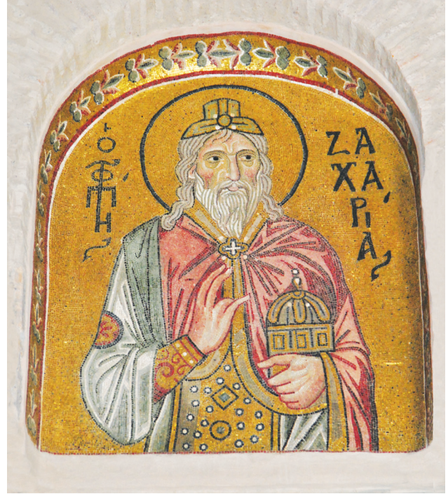
Εικ. 10. Μονή Δαφνίου, καθολικό της Κοίμησης της Θεοτόκου. Πρόθεση. Νότιος τοίχος: ο προφήτης Ζαχαρίας. Σήμερα: κυρίως ναός. Βόρειος τοίχος.

Τέσσερις χριστολογικές σκηνές που αποτελούν κατεξοχήν Θεοφάνειες, κοσμοούν τα ημιχώνια 65 : ο Ευαγγελισμός 66 , η Γέννηση, [H] ΓΕΝΝΗCIC 67 (Εικ. 3), η Βάπτιση, H ΒΑ//ΠΤICIC 68 , και η Μεταμόρφωση,