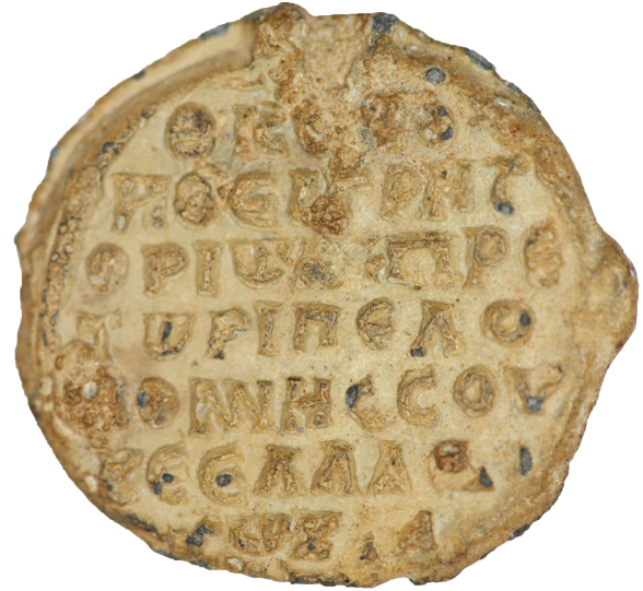
Εικ. 21. Αθήνα, Νομισματικό Μουσείο. Μολυβδόβουλλο, ΚΟ 94 (ΑΕ2946). Οπισθότυπος: Θεοτόκε βοήθει Γρηγορίω πρωτοπρέτωρι Πελοποννήσου κέ Ἑλλάδος τῷ Καματηρῷ.

όψη τους παράσταση της Θεοτόκου στον τύπο τον λεγόμενο Επίσκεψις –στοιχείο ενδιαφέρον, εφόσον στη Θεοτόκο είναι αφιερωμένο το καθολικό της μονής Δαφνίου. 110 Στον οπισθότυπο, μαζί με την επίκληση στη Θεοτόκο δηλώνεται από την επιγραφή ότι ο Γρηγόριος Καματηρός ήταν πραιίτωρ των Θεμάτων Ελλάδος και Πελοποννήσου (Εικ. 20-21). 111 Εκτός από τα προαναφερθέντα τρία μολυβδόβουλλα έχουν σωθεί και άλλα, των οποίων ο κάτοχος φέρει το όνομα Γρηγόριος Καματηρός, με την ίδια παράσταση στον εμπροσθότυπο, τα οποία είναι πιθανό να ταυτίζονται με το ίδιο πρόσωπο. 112