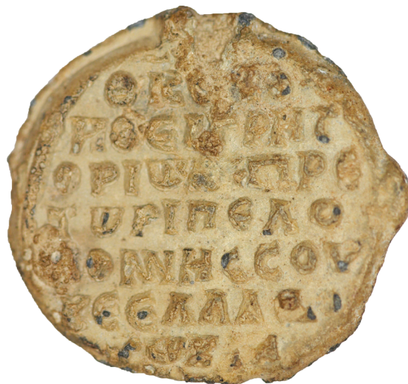
Εικ. 21. Αθήνα, Νομισματικό Μουσείο. Μολυβδόβουλλο, ΚΟ 94 (ΑΕ2946). Οπισθότυπος: Θεοτόκε βοήθει Γρηγορίω πρωτοπρέτωρι Πελοποννήσου κέ Ἑλλάδος τῷ Καματηρῷ.

όψη τους παράσταση της Θεοτόκου στον τύπο τον λεγόμενο Επίσκεψις –στοιχείο ενδιαφέρον, εφόσον στη Θεοτόκο είναι αφιερωμένο το καθολικό της μονής Δαφνίου. 110 Στον οπισθότυπο, μαζί με την επίκληση στη Θεοτόκο δηλώνεται από την επιγραφή ότι ο Γρηγόριος Καματηρός ήταν πραιίτωρ των Θεμάτων Ελλάδος και Πελοποννήσου (Εικ. 20-21). 111 Εκτός από τα προαναφερθέντα τρία μολυβδόβουλλα έχουν σωθεί και άλλα, των οποίων ο κάτοχος φέρει το όνομα Γρηγόριος Καματηρός, με την ίδια παράσταση στον εμπροσθότυπο, τα οποία είναι πιθανό να ταυτίζονται με το ίδιο πρόσωπο. 112