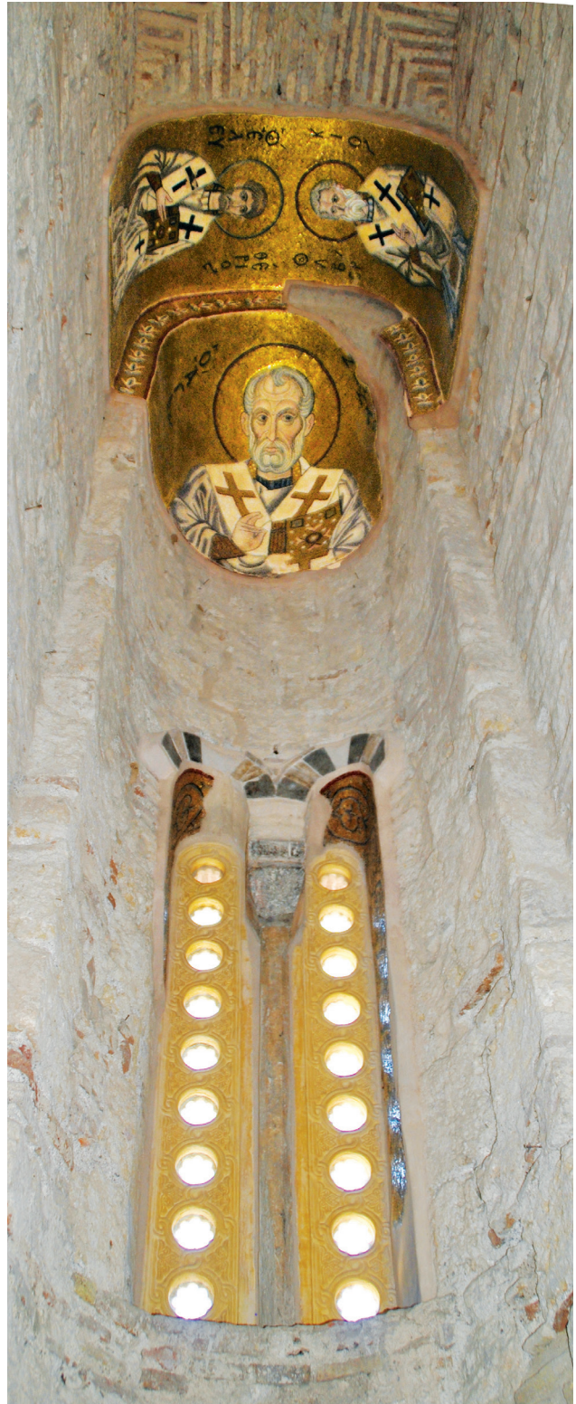
Εικ. 11. Μονή Δαφνίου, καθολικό της Κοίμησης της Θεοτόκου. Διακονικό. Τεταρτοσφαίριο: ο άγιος Νικόλαος. Εσωράχιο τόξου: ο άγιος Ελευθέριος και ο άγιος Αβέροκιος.

77 Όπως μόλις αναφέρθηκε και για τον κύκλο του Πάθους, Lafontaine-Dosogne, «L'évolution», ό.π. (υποσημ. 72), 319, έτσι και για τον μαριολογικό, J. Lafontaine-Dosogne, Iconographie de l'Enfance de la Vierge dans l'Empire byzantin et en Occident , Βρυξέλλες 1992 (επανεκδ.), 37-39, 68-81, 89-120, 128-133, 136-167. Η ίδια, «Iconography of the Life of Virgin», P. Underwood (επιμ.), The Kariye Djami , 4, 1975, 165-166. Για την εμπλοκή των εικονογραφικών κύκλων του βίου των αγίων στα εικονογραφικά προγράμματα από τον 11ο αιώνα, βλ. Sv. Tomekonović, «Les répercussions du choix du saint patron sur le programme iconographique des églises du 12 e siècle en Macédoine et dans le Péloponnèse», Zograf 12 (1981), 40-42.