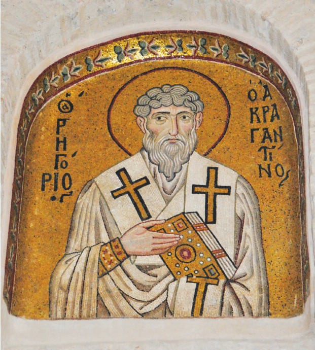
Εικ. 12. Μονή Δαφνίου, καθολικό της Κοίμησης της Θεοτόκου. Διακονικό. Βόρειος τοίχος: ο άγιος Γρηγόριος ο Ακραγαντίνος. Σήμερα: κυριως ναός. Νότιος τοίχος.