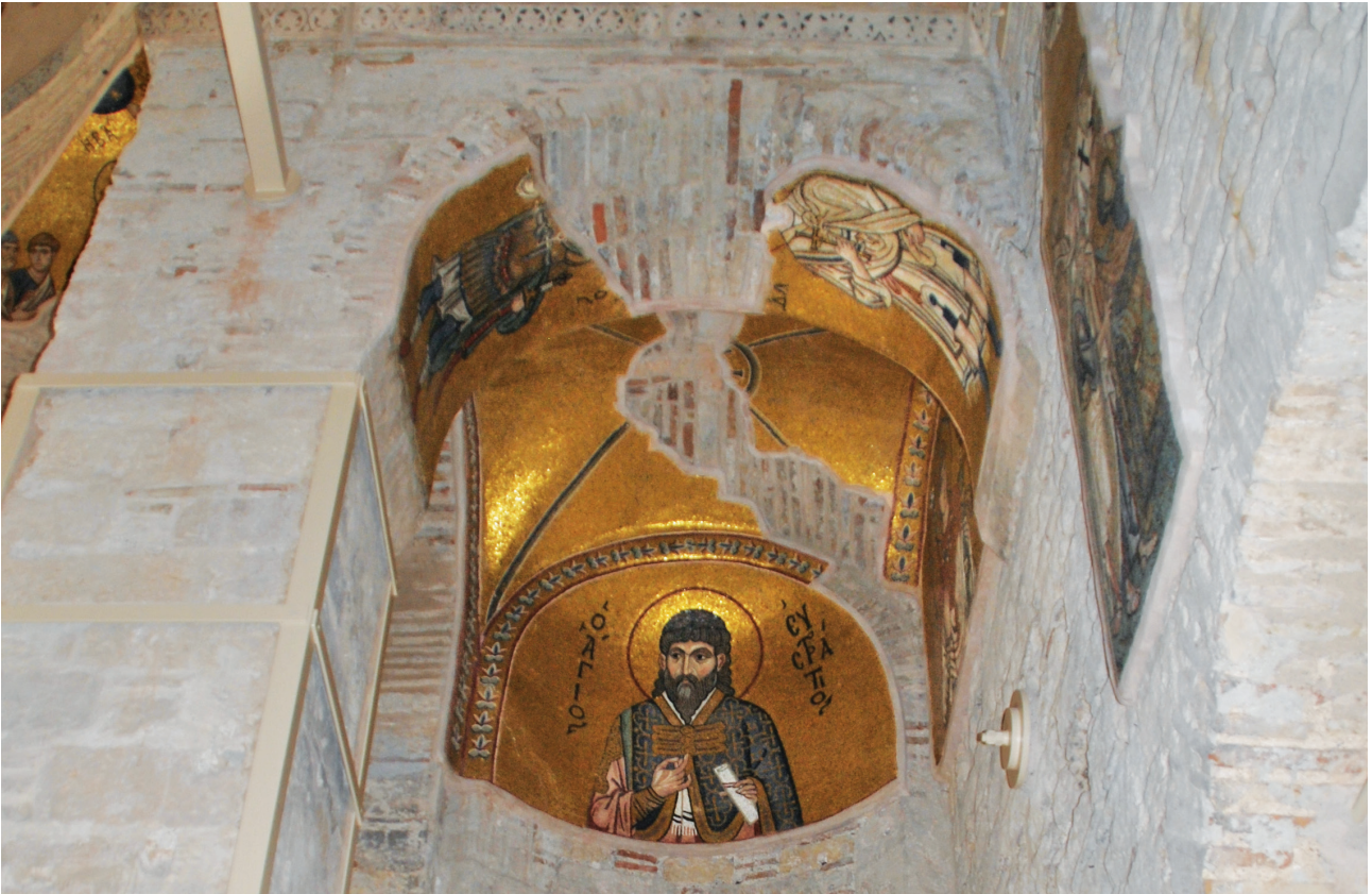
Εικ. 18. Μονή Δαφνίου, καθολικό της Κοίμησης της Θεοτόκου. Νοτιοδυτικό διαμέρισμα, νότια κόγχη: ο άγιος Ευστράτιος, στο εσωράχιο είναι ορατοί οι άγιοι Μαρδάριος και Ορέστης.

νίσσεται αγάπη προς τη θαυματουργική δράση 105 .