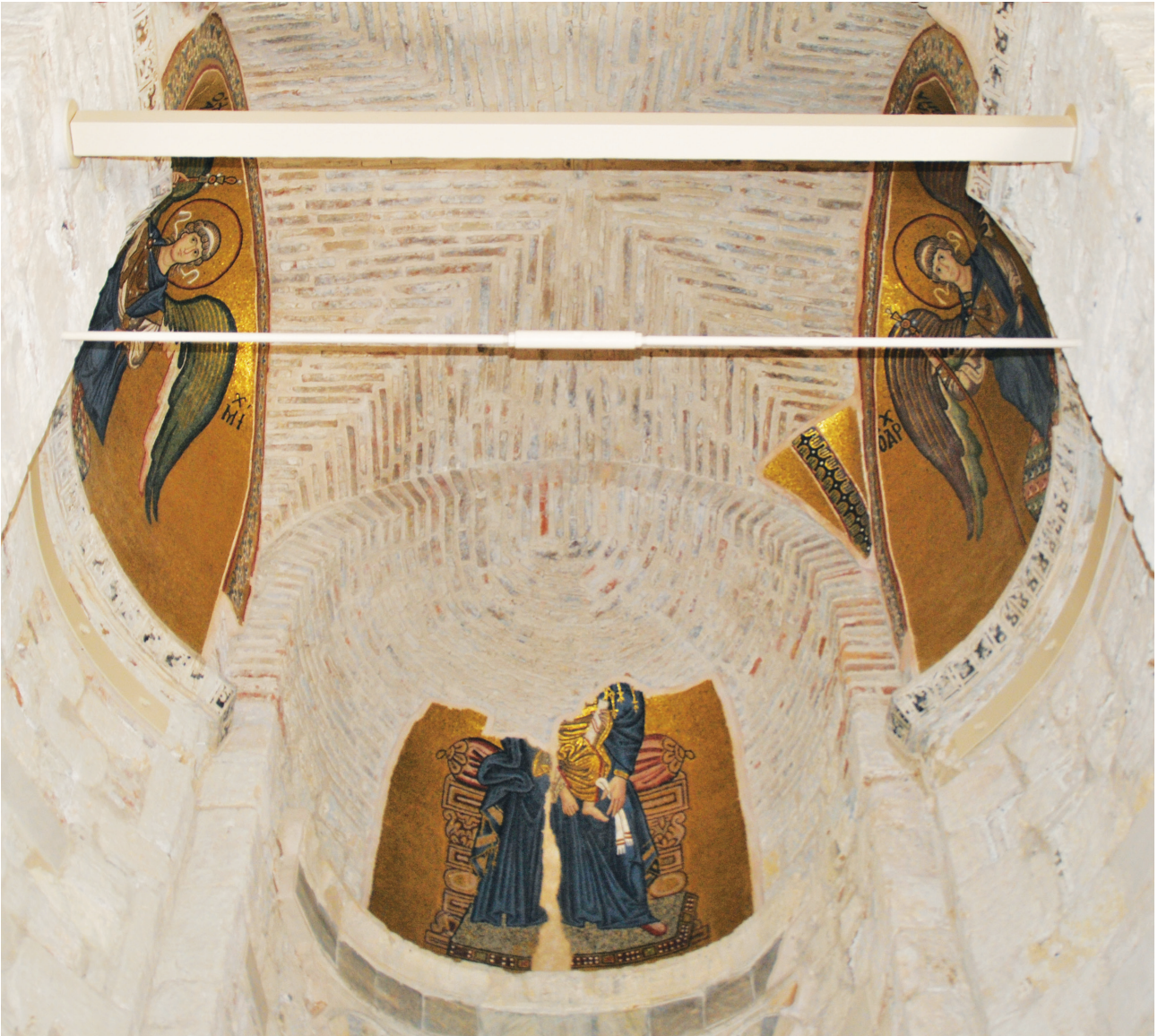
Εικ. 4. Μονή Δαφνίου, καθολικό της Κοίμησης της Θεοτόκου. Ιερό, αψίδα, τεταρτοσφαίριο: η Παναγία ένθρονη βρεφοκρατούσα. Βόρεια κόγχη: ο αρχάγγελος Μιχαήλ, νότια κόγχη: ο αρχάγγελος Γαβριήλ.

που καλύπτει τον υπόλοιπο χώρο της πρόθεσης, προβάλλει από το χρυσό βάθος το χρίσμα 46 .