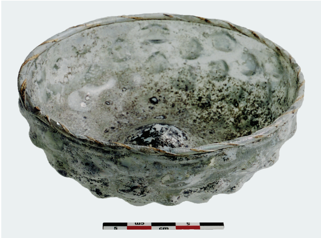
Εικ. 9: Γυάλινη κούπα (16ος αιώνας).

στο συμπέρασμα ότι η θέση του τέμπλου και στο κεντρικό ιερό, παρ' όλο που εδώ δεν εντοπίστηκαν εγκοπές για την τοποθέτησή του, δεν ήταν δυτικότερα, όπως έχει υποστηριχθεί 49 , αλλά στην ίδια ευθεία με αυτήν των παρεκκλησίων.