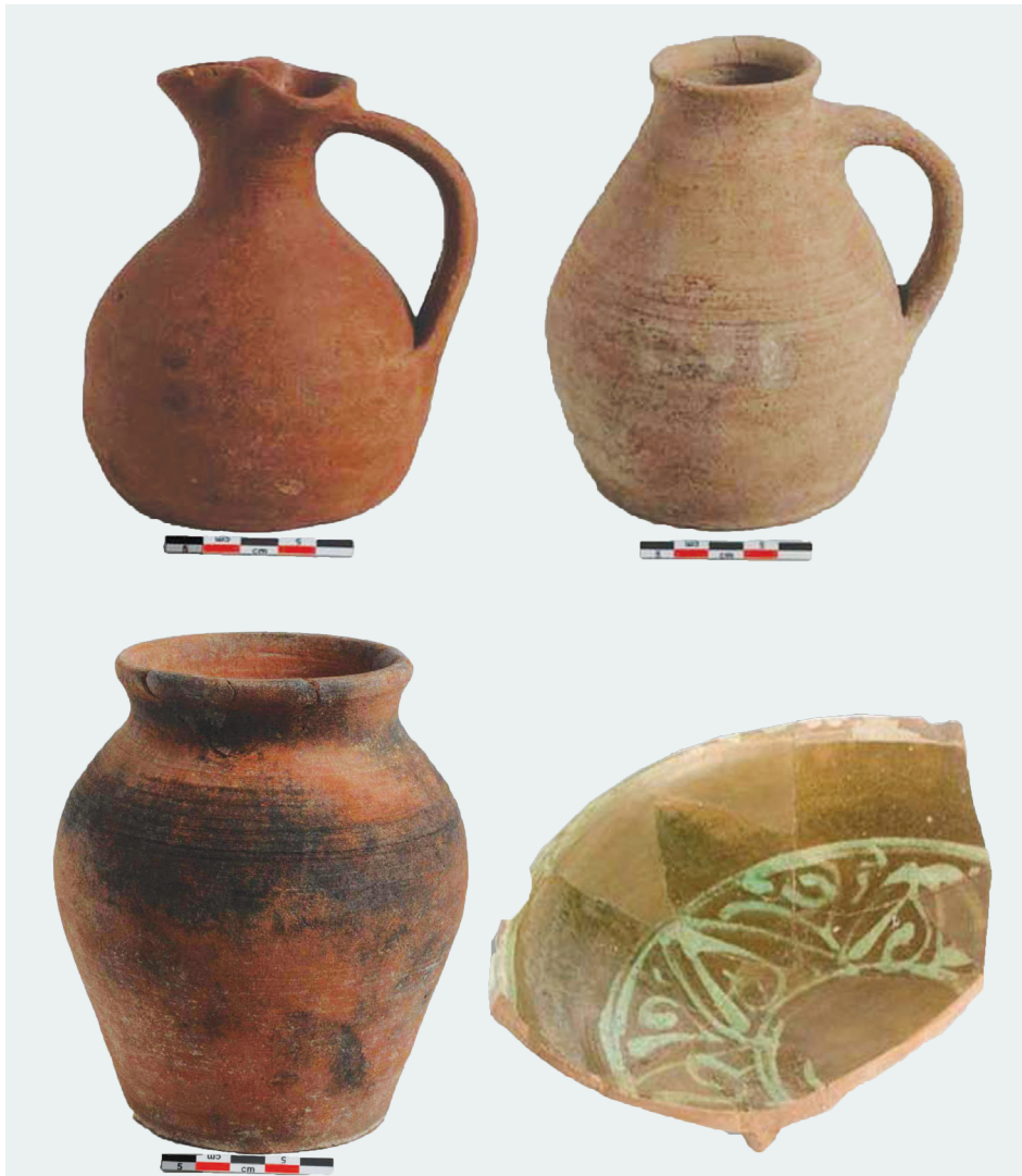
Εικ. 1: Αγγεία αβαφή (τέλη βου - αρχές 7ου αιώνα) και τμήμα εφναλωμένου πινακίου (12ος αιώνας) από τις ανασκαφές των Βαναρών.