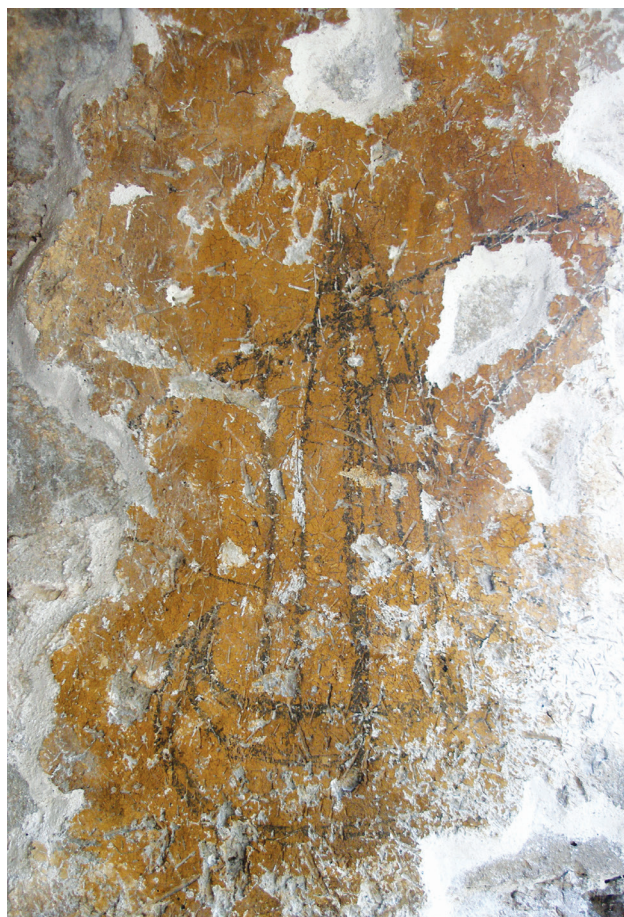
Εικ. 13: Γραπτή παράσταση πλοίου από το εσωρράχιο του νότιου τρίλοβου παραθύρου (ανατολικά).

χαρακτηριστικά, και με την παράσταση του οσίου Λουκά στον ναό του Αγίου Δημητρίου Θεσσαλονίκης 68 . Και στα δύο αυτά παραδείγματα ο εικονιζόμενος έχει την ίδια στάση δέησης με τον μοναχό της Σκριπούς.