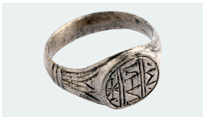
Εικ. 2: Αργυρό σφραγιστικό δακτυλίδι μεταβυζαντινών χρόνων από τις ανασκαφές των ετών 1966-1972.