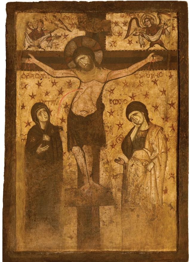
Εικ. 15α-β: Η αμφιπρόσωπη εικόνα του Βυζαντινού και Χριστιανικού Μουσείου με αριθ. κατ. ΒΧΜ 995.

μπορεί να συμπεράνει κανείς ότι η εύφορη παραλίμνια περιοχή του Ορχομενού δεν εγκαταλείφθηκε ποτέ.