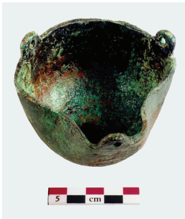
Εικ. 7: Χάλκινη κανδήλα βυζαντινών χρόνων.

Στο εσωτερικό του ναού αποκαλύφθηκαν συνολικά δεκαεπτά τάφοι, αλλά υπάρχουν σαφείς ενδείξεις στον κυρίως ναό για την ύπαρξη περισσότερων 41 . Τρεις από τους τάφους τοποθετούνται στο βόρειο παρεκκλήσιο, και μάλιστα ο ένας ανατολικότερα της θέσης του αρχικού μαρμάρινου τέμπλου (βλ. ανωτέρω). Οι τάφοι αυτοί ήταν λακκοειδείς και ως μόνα ευρήματα απέδωσαν λίγα σιδερένια καρφιά σε έναν από αυτούς. Μία πόρπη που βρέθηκε κοντά σε περιοχή με οστά, χρονολογείται στον 16ο-17ο αιώνα. Στο νότιο κλίτος, πλησίον της νότιας όψης του νοτιοδυτικού πεσσού, ανασκάφηκε ένας τάφος επίσης λακκοειδής, στον οποίο