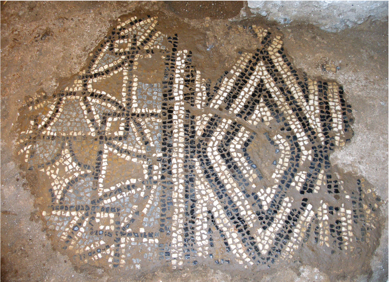
Εικ. 5: Τμήμα ψηφιδωτού δαπέδου πλησίον του βορειοδυτικού πεσσού.

Διάσπαρτα υπολείμματα ψηφιδωτού, που εντοπίστηκαν ανατολικότερα, παρουσιάζουν διαφορετικό σχέδιο που διαμορφώνεται από επαναλαμβανόμενα, κάθετα και οριζόντια, οκτώσχημα που κοσμοούνται με τρίγωνα και συνδέονται μεταξύ τους με μικρά ορθογώνια (Εικ. 6). Το σχέδιο αποτελεί παραλλαγή των αντίστροφων πελτών που συναντάται σε πολλά σωζόμενα ψηφιδωτά δάπεδα 32 . Χρησιμοποιούνται ψηφίδες στις ίδιες