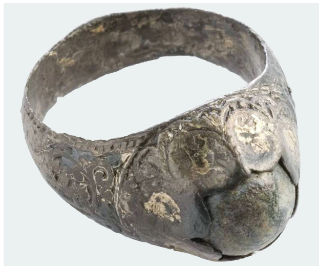
Εικ. 10: Δακτυλίδι από τον κιβωτιόσχημο τάφο του νάρθηκα.

Στον χώρο κάτω από τον τρούλο, προς τον νοτιοδυτικό πεσσό, αποκαλύφθηκε και ένα πηγάδι, την ύπαρξη του οποίου μνημόνευαν οι γεροντότεροι κάτοικοι που το χρησιμοποιούσαν ως αγίασμα. Η διάμετρος στο στόμιό του είναι 0,48 μ. και στο εσωτερικό του 0,81 μ. Το ορατό βάθος του είναι περίπου 4,80 μ., ενώ κάτω από αυτό υπάρχει νερό 55 . Η επιμελής κατασκευή του