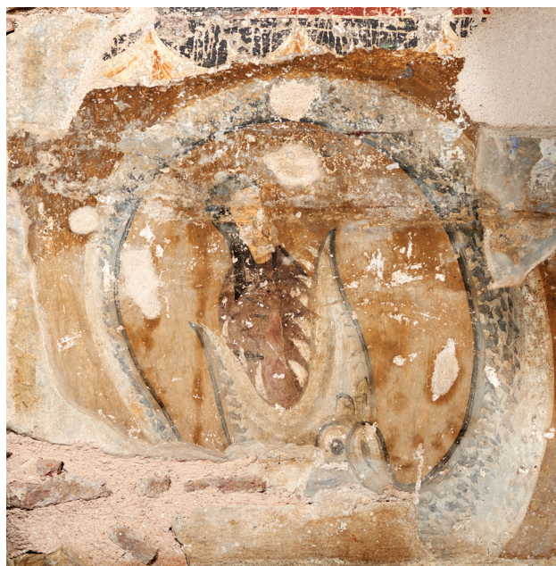
Εικ. 11: Τμήμα τοιχογραφημένης παράστασης στον βόρειο τοίχο του ιερού βήματος.