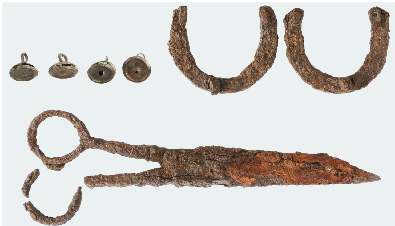
Εικ. 8: Μεταλλικά ευρήματα μεταβυζαντινών χρόνων από τους τάφους στο κεντρικό κλίτος και τον νάρθηκα.

ψαλίδι 43 . Επίσης, βρέθηκαν δύο ακέραια δακτυλίδια και τμήμα τρίτου, ο τύπος των οποίων είναι συνήθης κατά τους μέσους έως και τους μεταβυζαντινούς χρόνους 44 . Σε έναν από τους τάφους είχε εναποτεθεί με επιμέλεια στην αριστερή πλευρά του θώρακα του ενταφιασμένου ακέραιη γυάλινη κούπα με ημισφαιρικό σώμα, κατασκευασμένη σε μήτρα 45 (Εικ. 9). Εξωτερικά κοσμεύεται με ημισφαιρικά περίπου εξάρματα, ενώ στην κοίλη περιοχή της βάσης φέρει πολύφυλλο ρόδακα. Ίνες γυαλιού