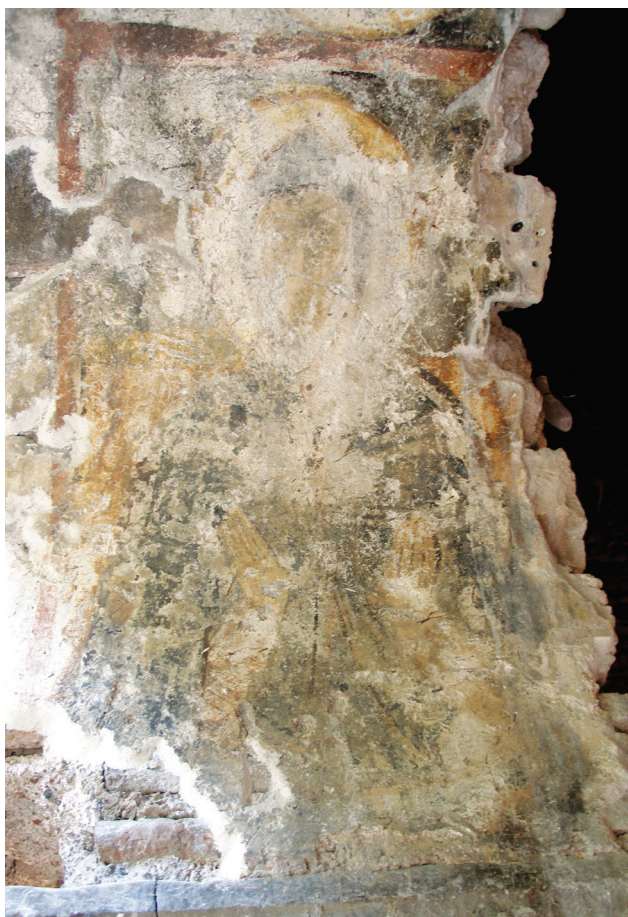
Εικ. 12: Τοιχογραφία με παράσταση μοναχού από το εσωρράχιο του νότιου τρίλοβου παραθύρου (δυτικά).