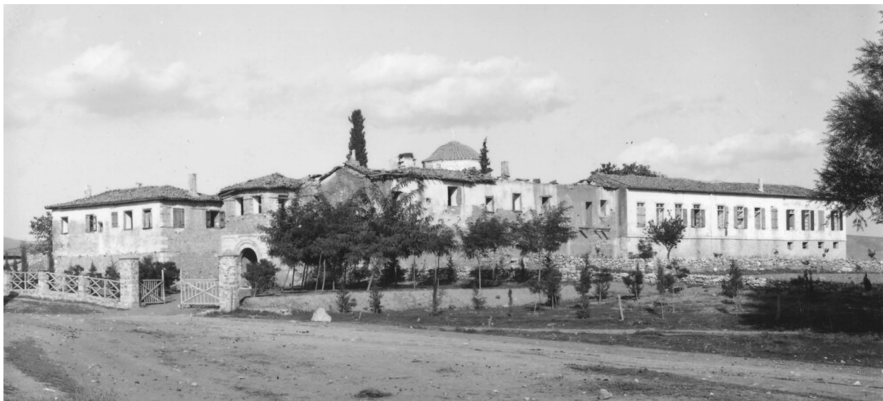
Εικ. 14: Το συγκρότημα της μονής στα τέλη του 19ου αιώνα.

ορόφου είχε καταρρεύσει και αντικατασταθεί προσωρινά με χόρτα, και έχρηζαν άμεσης επιδιόρθωσης 78 .