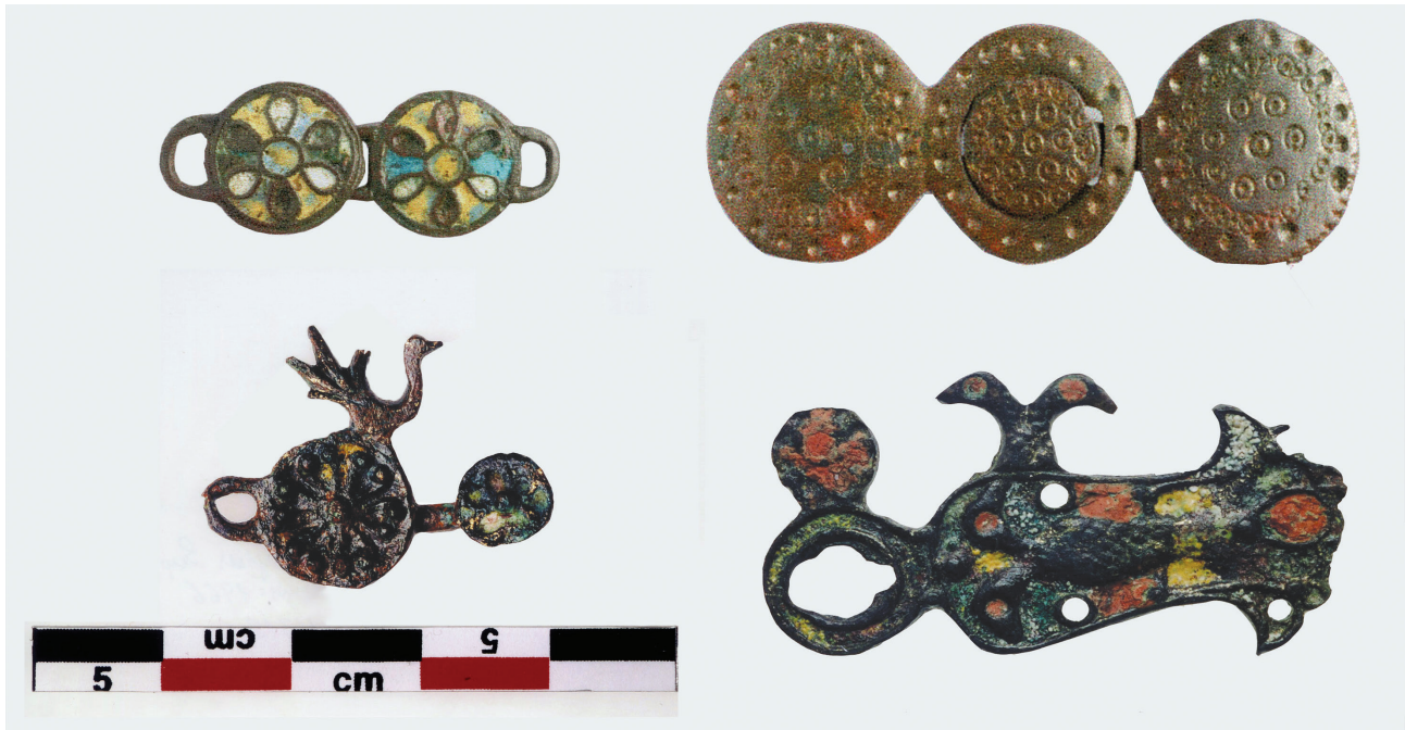
Εικ. 3: Μεταβυζαντινές πόρπες από τις ανασκαφές των ετών 1966-1972.