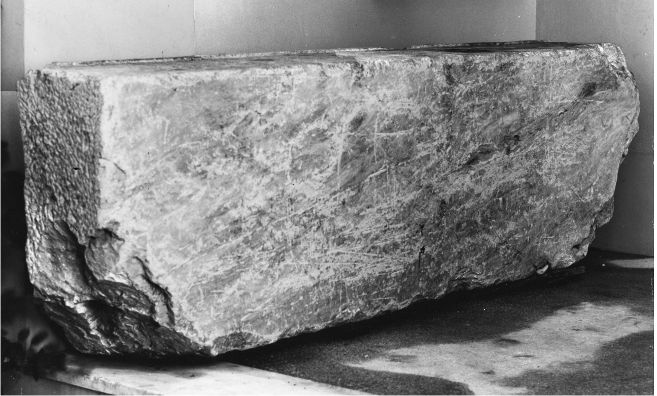
Εικ. 1. Ο λίθος από την Κανά της Γαλιλαίας (BMX 4403).

σε την υπόθεση ότι ο λίθος μεταφέρθηκε στην Κωνσταντινούπολη την εποχή του αυτοκράτορα Ηρακλείου και από εκεί στην Ελάτεια μετά την άλωση του 1204. Υπέθεσε, επίσης, ότι η μεταφορά του έγινε είτε από τον Othon de la Roche, πρώτο δούκα των Αθηνών, είτε από τον Guy Pallavicini, πρώτο μαρκήσιο της Βουδονίτσας, οι οποίοι θα πρέπει να οικοδόμησαν και τη Μεγάλη Παναγιά. Η ύπαρξη της δεύτερης αυτής επιγραφής ήταν η απόδειξη ότι ο λίθος που βρέθηκε στην Ελάτεια, ήταν το ανάκλιτρο στο οποίο είχε ανακλιθεί ο Ιησούς