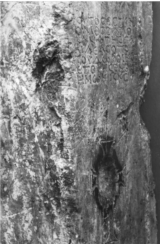
Εικ. 3. Η επιγραφή και ο σταυρός στον λίθο από την Κανά της Γαλιλαίας (BMX 4403).

της, ο Γεώργιος Λαμπάκης, είχε ιδρύσει τη Χριστιανική Αρχαιολογική Εταιρεία (ΧΑΕ) τον Δεκέμβριο του 1884, την οποία η βασίλισσα είχε θέσει υπό την προστασία της 11 , και ήταν ο ουσιαστικός δημιουργός της χριστιανικής συλλογής 12 . Εξάλλου, το κείμενο του Diehl κατέληγε με μια πρόσκληση στην κυβέρνηση: «Nous espérons que le gouvernement hellénique tientra à sauver de la destruction un monument aussi respectable et voudra recueillir en un lieu digne d'elle la relique découverte par M. Paris». Με αυτή την πρόσκληση επέλεξε να κλείσει το κείμενό της και η Εφημερίς : «νάποθέσει τὸ εὔρημα τοῦ κ. Paris εἰς τόπον ἀντάξιον τῆς ιερότητος καὶ τῆς σπουδαιότητος του».