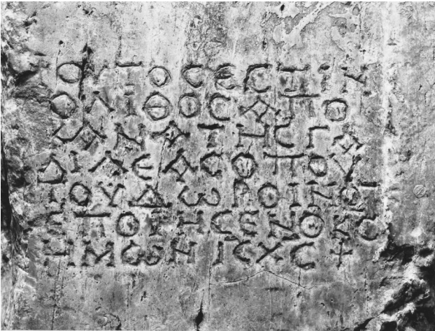
Εικ. 2. Η επιγραφή στον λίθο από την Κανά της Γαλιλαίας (BMX 4403).