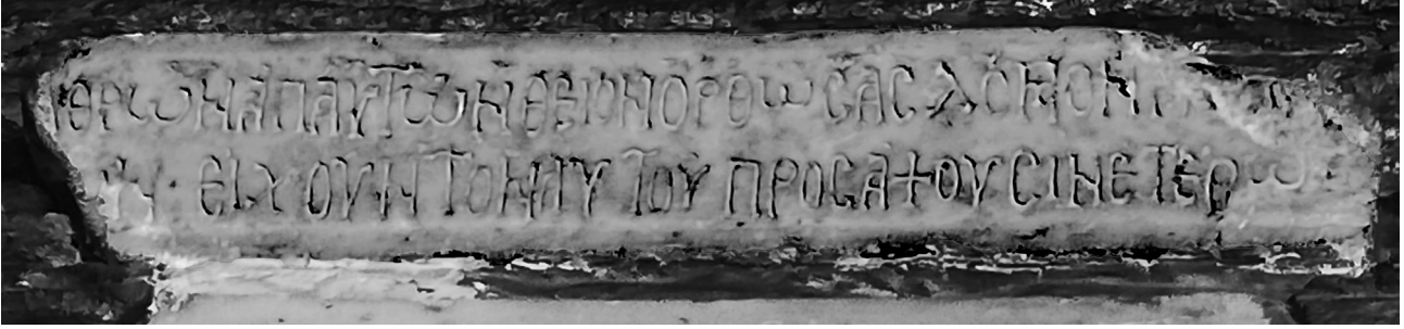
Εικ. 1. Άνδρος, Χώρα, ναός της Παναγίας Θεοσκεπάστης. Η επιγραφή.

του επιθέτου «άπάντων», που δεν έχει παράλληλο 9 , δηλώνει εμφατικά ότι πρόκειται για ένα εξ ολοκλήρου νέο έργο, ενώ ίσως θέλει ακόμη να προβάλλει την αποκλειστική ευθύνη και δαπάνη του κτήτορα για την υλοποίησή του.