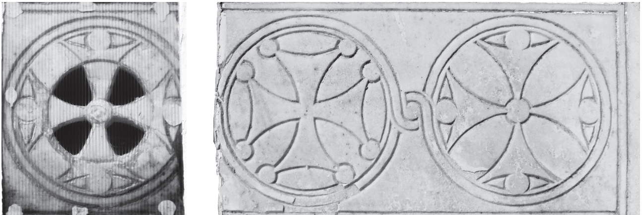
Εικ. 6. Άνδρος, Μεσαριά, ναός του Αγίου Νικολάου. Πλάκα ψευδοσαρκοφάγου σε δύο τμήματα.

(Εικ. 6) 77 . Στον περιβόλο του ίδιου ναού σωζόταν άλλοτε δεύτερη πλάκα ψευδοσαρκοφάγου 78 , η οποία έχει αποδοθεί σε εργαστήριο που έδρασε στην Άνδρο και τη Νάξο κατά τα τέλη του 11ου – αρχές 12ου αιώνα 79 . Πρόσφατα εντοπίστηκαν επαναχρησιμοποιημένα σε σύγχρονο μνήμα στο Ταφείο της Μεσαριάς τρία τμήματα μεσοβυζαντινών πλακών ψευδοσαρκοφάγων που ανήκαν στο ίδιο σύνολο 80 . Σε τύμπανο ταφικού αρκοσολίου έχει επίσης αποδοθεί από τον Χαράλαμπο και τη Λασκαρίνα Μπούρα η μοναδική ως προς το σχήμα της ημικυκλική πλάκα με τρίλοβη διαμόρφωση στην κάτω πλευρά, που σώζεται εντοιχισμένη επίσης στον Άγιο Νικόλαο της Μεσαριάς 81 . Είναι αξιοσημείωτο ότι τα ταφικά γλυπτά της Άνδρου συναγωνίζονται σε αριθμό και ποιότητα τα αντίστοιχα της Νάξου, όπου έχουν εντοπιστεί τρεις βέβαιες περιπτώσεις πλακών