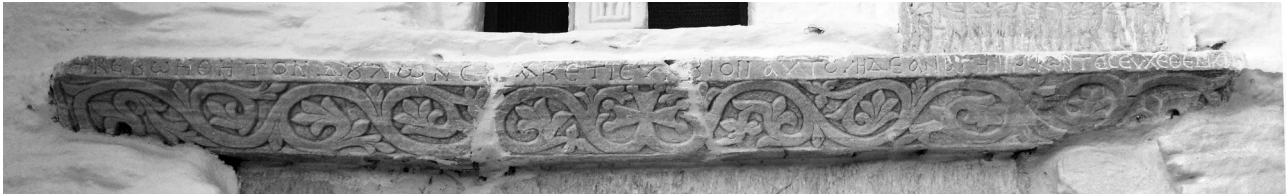
Εικ. 4. Άνδρος, Αηδόνια, ναός των Αγίων Τεσσαράκοντα. Το ενεπίγραφο επιστύλιο τέμπλου.