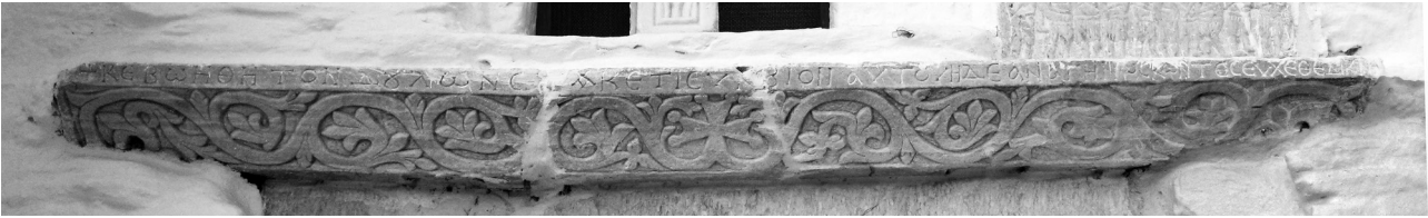
Εικ. 4. Άνδρος, Αηδόνια, ναός των Αγίων Τεσσαράκοντα. Το ενεπίγραφο επιστύλιο τέμπλου.