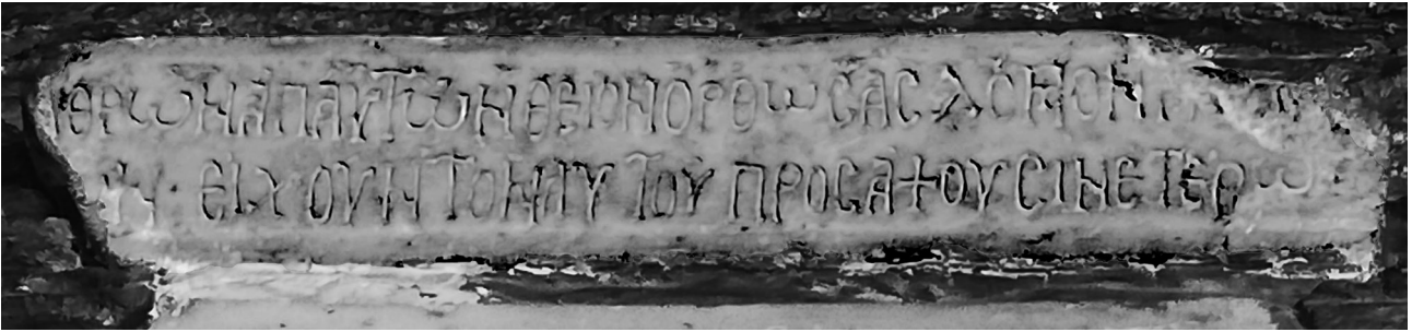
Εικ. 1. Άνδρος, Χώρα, ναός της Παναγίας Θεοσκεπάστης. Η επιγραφή.

του επιθέτου «άπάντων», που δεν έχει παράλληλο 9 , δηλώνει εμφατικά ότι πρόκειται για ένα εξ ολοκλήρου νέο έργο, ενώ ίσως θέλει ακόμη να προβάλλει την αποκλειστική ευθύνη και δαπάνη του κτήτορα για την υλοποίησή του.