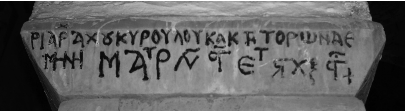
Εικ. 2. Άνδρος, Μεσσαριά, Μεγάλος Ταξιάρχης. Η επιγραφή στο επίθημα του βόρειου κίονα, 1156.