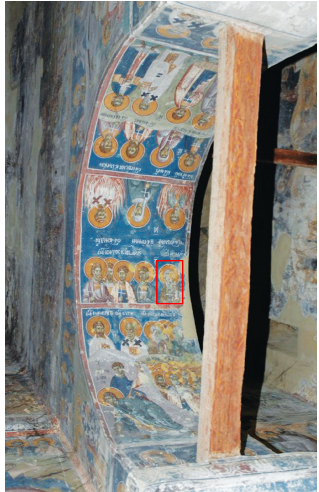
Εικ. 6. Staro Nagoričino, Μονή του Αγίου Γεωργίου, καθολικό, νάρθηκας. Ο όσιος Θωμάς, 1313-1318.

Ο όσιος εικονίζεται επίσης στον νότιο τοίχο του νάρθηκα της μονής του Αγίου Γεωργίου του Staro Nagoričino, ενός από τα σημαντικότερα βυζαντινά μνημεία της Σερβίας, που έχει τοιχογραφηθεί από τους Θεσσαλονικείς ζωγράφους Ευτύχιο και Μιχαήλ Αστραπά στις αρχές του 14ου αιώνα 134 (Εικ. 6). Ο Θωμάς παρουσιάζεται με τον συνήθη εικονογραφικό του τύπο, μετωπικός με πυκνά άσπρα μαλλιά και γένια, κρατώντας σταυρό, μετά τον μάρτυρα Ίσαυρο και τους σὺν αὐτῷ μάρτυρες, σύμφωνα με την επιγραφή: Ὁ ἅγιος Ίσαυρος καὶ οἱ σὺν αὐτῷ 135 . Πρόκειται για τον μάρτυρα Ίσαυρο και τους