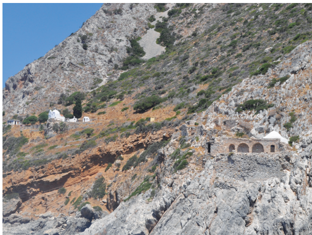
Εικ. 3. Λακωνία, όρος Μαλέας. Οι ναοί του Αγίου Γεωργίου και της Αγίας Ειρήνης.

οικοδομική φάση του ναού μπορεί να ενταχθεί στα ύστατα παλαιοχριστιανικά ή και στα πολύ πρόωγα μεσοβυζαντινά χρόνια 113 . Θεωρούμε πιθανόν ότι η μεσοβυζαντινή φάση του ναού του Αγίου Γεωργίου σχετίζεται με την λειτουργία εκκλησίας, δηλαδή ευκτηρίου οίκου, που, σε συνδυασμό με τα σπηλαιώδη ασκητήρια και τις δεξαμενές νερού που βρίσκονται λαξευμένες στον βράχο, εξυπηρετούσε τις ανάγκες των ασκητών που διαβιούσαν στην γύρω περιοχή.