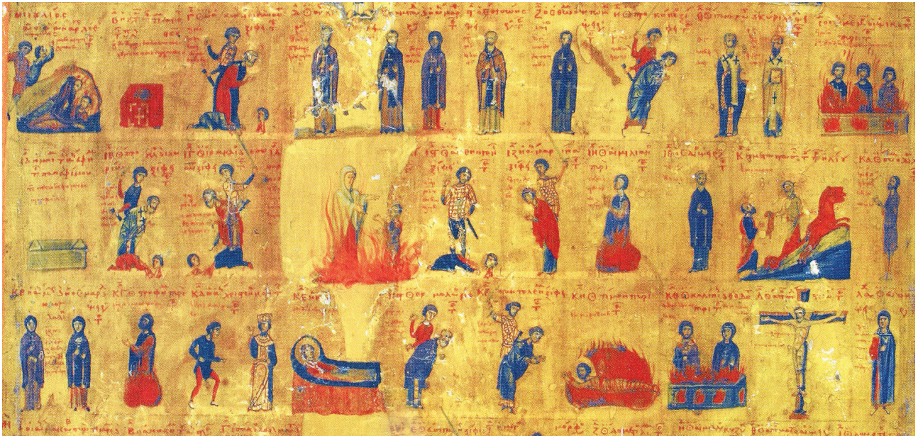
Εικ. 4. Μονή Σινά, Εξάπτυχο. Ο όσιος Θωμάς εν Μαλεῶ, λεπτομέρεια, 11ος αιώνας.

(έτος 818) 119 . Παράλληλα, στην περιοχή αναδεικνύονται, τον 9ο αιώνα, δύο μείζονες εμβέλειες ηγετικές εκκλησιαστικές μορφές, οι επίσκοποι Λακεδαιμόνος Θεόκλητος και Μονεμβασίας Θεοφάνης ο Ομολογητής, οι οποίοι ενεπλάκησαν άμεσα ή έμμεσα υπέρ των εικονοφίλων κατά την δεύτερη φάση της εικονομαχικής έριδας 120 . Τέλος, έκφραση εικονομαχικών πεποιθήσεων των κατοίκων της Μάνης απηχούν σαφώς οι ανεικονικές τοιχογραφίες του ναού του Αγίου Προκοπίου (πρώτο μισό του 9ου αιώνα), αντίστοιχες των οποίων έχουν επισημανθεί στην Νάξο, κυρίως στον ναό του Αγίου Ιωάννη του Θεολόγου στ' Αθησαρού 121 .