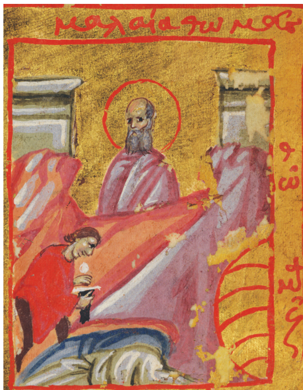
Εικ. 5. Μηνολόγιο της Οξφόρδης, Oxford, Bodleian Library, Gr. th. f. 1, φ. 46ν . Ο όσιος Θωμᾶς ἐν Μαλαίῳ, 1322-1340.