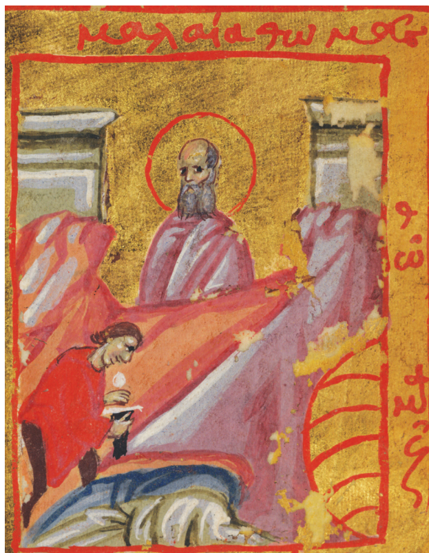
Εικ. 5. Μηνολόγιο της Οξφόρδης, Oxford, Bodleian Library, Gr. th. f. 1, φ. 46v . Ο όσιος Θωμᾶς ἐν Μαλαίῳ, 1322-1340.