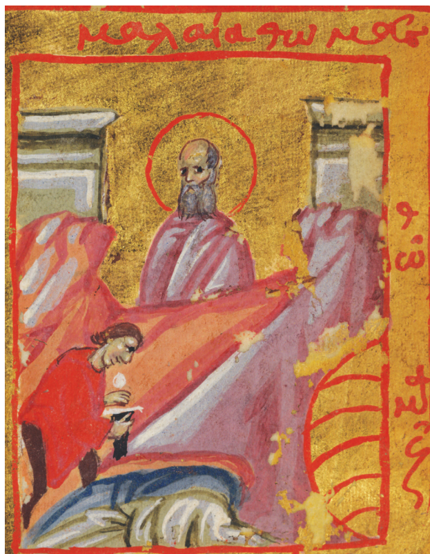
Εικ. 5. Μηνολόγιο της Οξφόρδης, Oxford, Bodleian Library, Gr. th. f. 1, φ. 46v. Ο όσιος Θωμάς ἐν Μαλαίῳ, 1322-1340.