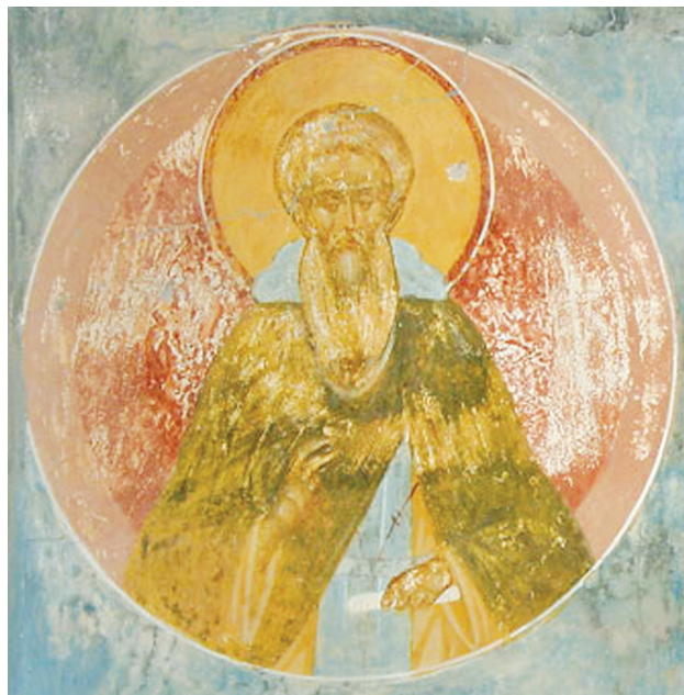
Εικ. 7. Belozersky, Ferapontov, μονή της Γεννήσεως της Θεοτόκου. Ο όσιος Θωμάς ἐν Μαλεῶ, περ. 1502.

το Μηνολόγιο του Βασιλείου Β΄. Συμπεριλαμβάνεται ακόμη στο Τυπικό της μονής της Ευεργέτιδος, που απεικονίζει την λειτουργική πρακτική όπως αυτή είχε διαμορφωθεί στα μέσα του 11ου αιώνα, εποχή κατά την οποία γίνεται γνωστός για πρώτη φορά και ο εικονογραφικός τύπος του οσίου. Η μελέτη του σωζόμενου σύντομου συναξαριακού Βίου οδηγεί στην διαπίστωση ότι αυτός βασίζεται σε εκτενέστερο και παλαιότερο Βίο, που, προς το παρόν τουλάχιστον, λανθάνει. Ωστόσο, η προσεκτική μελέτη του συναξαριακού βίου, η σύγκρισή του με αντίστοιχους Βίους στρατιωτικών που ασπάστηκαν τον μοναστικό και αναχωρητικό βίο (Ιωαννικίου, Αντωνίου του Νέου, Νίκωνος, στρατιώτη Νικολάου κ.ά.), η εξέταση του ύφους της διήγησης, η αξιολόγηση των ελάχιστων ιστορικών και βιογραφικών μαρτυριών καθώς και η χρήση αγιολογικών τόπων οδηγούν στην εκτίμηση ότι ο χρονικός ορίζοντας της δράσης του αιγιματικού οσίου εντάσσεται στα τέλη του 8ου ή στις πρώτες δεκαετίες του 9ου αιώνα, πιθανόν στην διάρκεια της δεύτερης φάσης της εικονομαχικής κρίσης (787-843). Ωστόσο, τίποτε σχετικό με τις πεποιθήσεις του οσίου πριν από την κουρά του δεν γίνεται γνωστό. Είχε εικονομαχικές αντιλήψεις, όπως συνηθίζονταν στους στρατιωτικούς κύκλους της εποχής του; Η επιλογή της