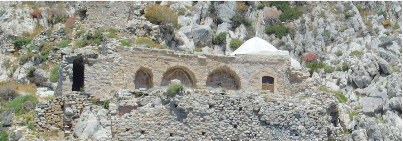
Εικ. 1. Λακωνία, όρος Μαλέας. Ο ναός του Αγίου Γεωργίου.

Το πρώτο ασκητήριο είναι μια ημιφυσική σπηλιά με ένα θολωτό χώρο και δάπεδο που βρίσκεται σε χαμηλότερο επίπεδο από εκείνο της εισόδου 109 , ενώ το δεύτερο, απρόσιτο, έχει σπηλαιώδη διαμόρφωση και φράσσεται από ξερολιθιά 110 . Τα ασκητήρια είναι σχετικά κοντά στον βυζαντινό ναό του Αγίου Γεωργίου, που φέρει τοιχογραφίες του πρώτου τρίτου του 15ου αιώνα 111 . Ο ναός του Αγίου Γεωργίου είναι προσκολλημένος στην βορειοανατολική γωνία παλαιότερου και μεγαλύτερου ερειπωμένου ναού, ο οποίος εκτεινόταν σε όλο το πλάτωμα της βραχώδους πλαγιάς. Ο γύρω χώρος φανερώνει την αλλοτινή παρουσία ασκητών και αναχωρητών, αφού στους βράχους έχουν λαξευτεί στενά ενδιαιτήματα και δεξαμενές νερού. Από τον μονόχωρο, άλλοτε καμαροσκέπαστο ναό με την ημικυλινδρική αψίδα σώζονται ο βόρειος τοίχος ως την γένεση της καμάρας (Εικ. 1, 2). Θεωρείται πιθανή η ύπαρξη δύο τουλάχιστον οικοδομικών φάσεων. Την ημικυλινδρική αψίδα εσωτερικά περιθέει χτιστό βαθμιδωτό