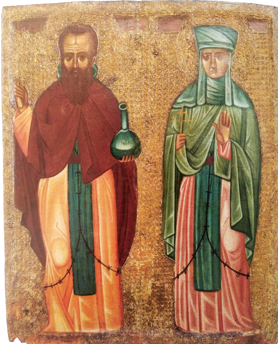
Εικ. 4. Κύπρος, Καλοπαναγιώτης, Εικονοφυλάκιο μονής Αγίου Ιωάννου Λαμπαδιστού. Εικόνα με τον άγιο Ανδρόνικο και την αγία Αθανασία, 14ος αιώνας.

όταν είχαν ασπαστεί τον μοναχισμό, καθώς και τα σκληρά, σχεδόν ανδρικά, χαρακτηριστικά της Αθανασίας, που συνδέονται με τη μεταμφίεσή της σε άνδρα 40 , αποτελούν στοιχεία του καθιερωμένου εικονογραφικού τύπου τους, τα οποία εντοπίζονται στο σύνολο των κυπριακών παραστάσεών τους και εδώ.