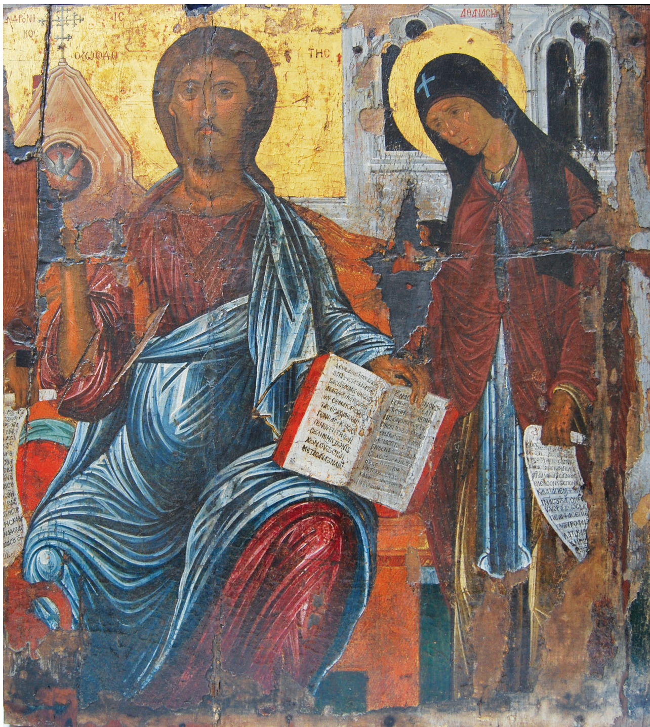
Εικ. 2. Κίωλος, Χωριό, ναός του Αγίου Σπυρίδωνος. Εικόνα Δέησης με τον ένθρονο Χριστό Παντοκράτορα πλαισιωμένο από τον άγιο Ανδρόνικο (τμήμα) και την αγία Αθανασία.