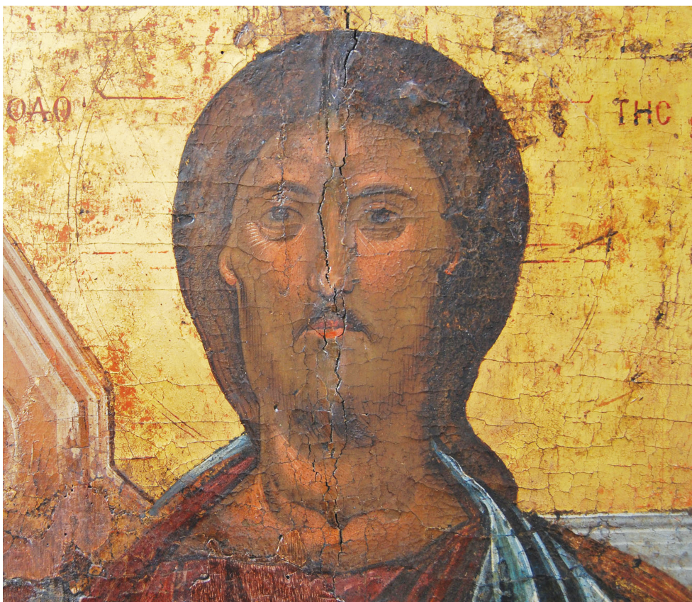
Εικ. 8. Ο Χριστός (λεπτομέρεια της Εικ. 2).

Τέλος, η γραφή των χωρίων στον κώδικα του Χριστού και στα ειλητήρια των δύο αγίων αποτελεί ένα ακόμη στοιχείο για τη χρονολόγηση της εικόνας της Κιμώλου στην ίδια περίοδο, στο δεύτερο μισό του 14ου αιώνα. Σύμφωνα με τον Αγαμέμνονα Τσελίκα, τον οποίο ευχαριστώ θερμά που μοιράστηκε πρόθυμα μαζί μου τις παρατηρήσεις του για τις επιγραφές αυτές, η ορθογραφημένη γραφή, η έκταση και ο ορθός τονισμός καθώς και η μορφή και η απλή χάραξη