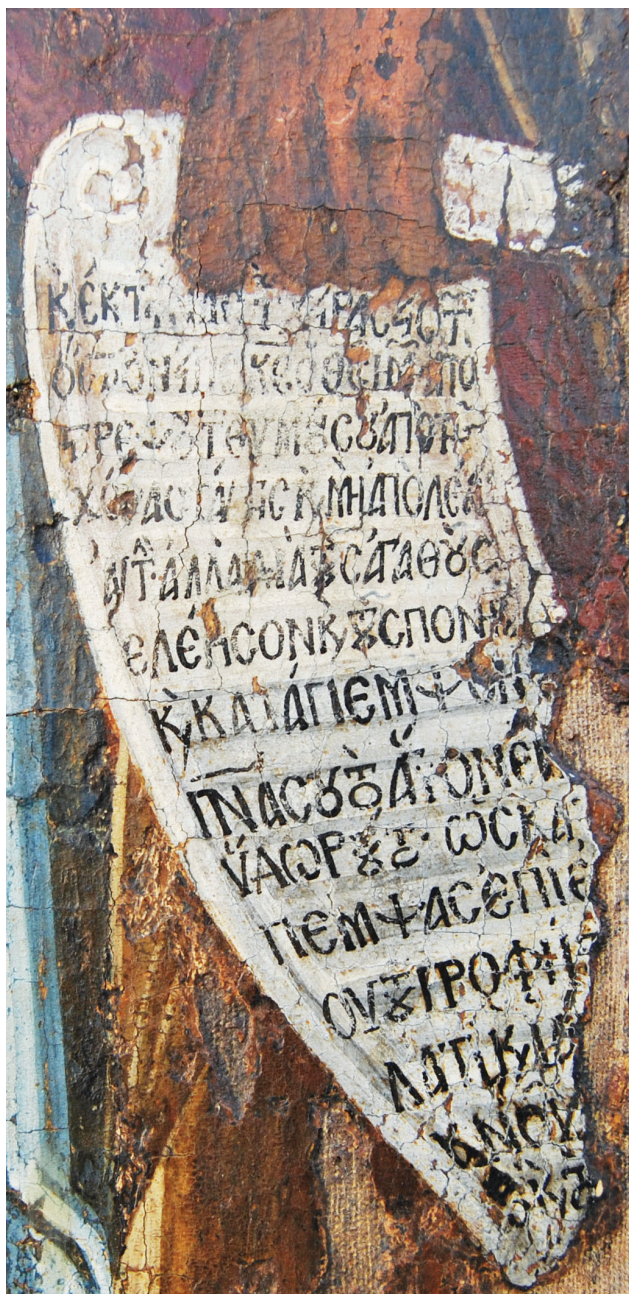
Εικ. 5. Το ειλητάριο της αγίας Αθανασίας (λεπτομέρεια της Εικ. 2).

ορθόδοξης Θεολογίας υπερβαίνει τα όρια της μελέτης μας. Βλ. ενδεικτικά K. Aland, «The Problem of Anonymity and Pseudonymity in Christian Literature of the First Two Centuries», The Journal of Theological Studies 12 (1961), 39-49. R. Balz, «Anonymität und Pseudepigraphie im Urchristentum. Überlegungen zum literarischen und theologischen Problem der urchristlichen