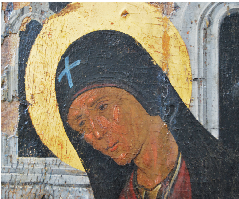
Εικ. 9. Η αγία Αθανασία (λεπτομέρεια της Εικ. 2).

εικονίζει τον Χριστό σε μεγαλύτερη κλίμακα από τους δύο αγίους (Εικ. 2). Πρόκειται για μια επιβλητική μορφή που αποτελεί το κύριο πρόσωπο της σύνθεσης, δίπλα στην Αθανασία που παριστάνεται αδύνατη, σε όρθια συνεσταλμένη στάση. Οι γεωμετρικές πτυχώσεις των ενδυμάτων τους ακολουθούν τις στάσεις τους: οι ταραγμένες, άλλοτε επαπτόμενες και άλλοτε συμπλεκόμενες πτυχές του βαθυγάλαζου μιατίου του ένθρονου Παντοκράτορα έρχονται σε αντίθεση με την ήρεμη πτυχολογία του ομόχρωμου αναλάβου της αγίας. Διαπιστώνεται, κυρίως, η ευρεία χρήση του υπόλευκου στα ενδύματα αυτά, η οποία τους προσδίδει μεταλλική όψη. Στο μιάτιο του Χριστού εμφανής είναι η μανιεριστική τάση απόδοσης της πτυχολογίας και ο λεπτός δεξιοτεχνικός τρόπος στη χρήση του χρυσού στην παρυφή του. Με την τοποθέτηση του Παντοκράτορα –ως αποδέκτη των δεήσεων των δύο τοπικών αγίων της Κύπρου– στο κέντρο της σύνθεσης, με την εφαρμογή της ιεραρχικής κλίμακας ως προς τα