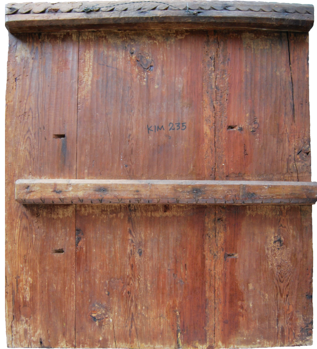
Εικ. 1. Κίμωνος, Χωριό, ναός του Αγίου Σπυριδωνος. Εικόνα με παραλλαγή Δέησης, πίσω όψη.

Πάριση αυτής ήταν η μορφή του αγίου Ανδρονίκου διακρίνεται μικρό τμήμα της γενειοφόρου μορφής του, γυρισμένης και αυτής κατά τα τρία τέταρτα προς τον ένθρονο Χριστό, να δέεται με το δεξί και να κρατάει ανοικτό ειλητάριο με το αριστερό (Εικ. 2). Από τα ενδύματά του ορατό είναι μικρό μόνο τμήμα του κεραμιδί χιτώνα του, στο αριστερό χέρι επάνω από τον καρπό.