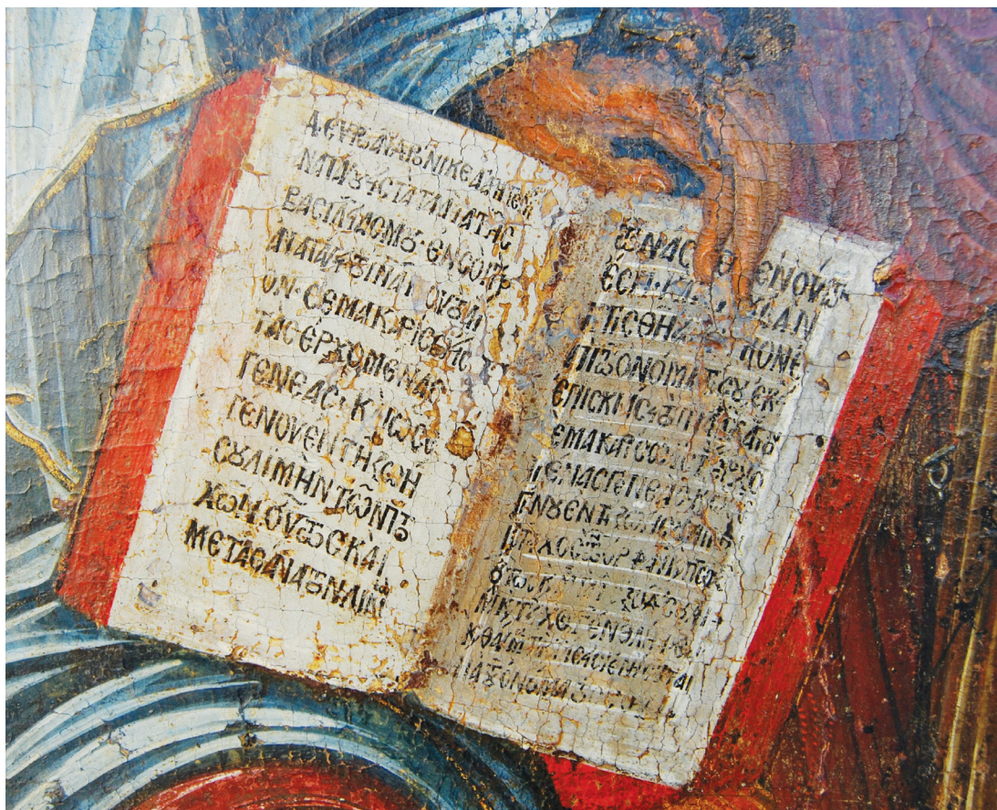
Εικ. 7. Ο κώδικας του Χριστού (λεπτομέρεια της Εικ. 2).

την απεικόνιση της περιστεράς, ως συμβόλου του αγίου Πνεύματος, μπροστά από το τετράφυλλο άνοιγμα του κτηρίου, μεταξύ Ανδρονίκου και Χριστού, θα πρέπει να συνδεθεί με το χωρίο «ὅπου ἔαν κτισθῆ ευκτήριον ἐπὶ τῷ ὀνόματι σου ἐκεῖ ἐπισκιάσει τὸ Πνεῦμα μου τὸ ἅγιον» στο κείμενο του Χριστού και αποτελεί πιθανότατα ἔμμεση ἔνδειξη για την προέλευση της εικόνας από ναό αφιερωμένο στους δύο αγίους.