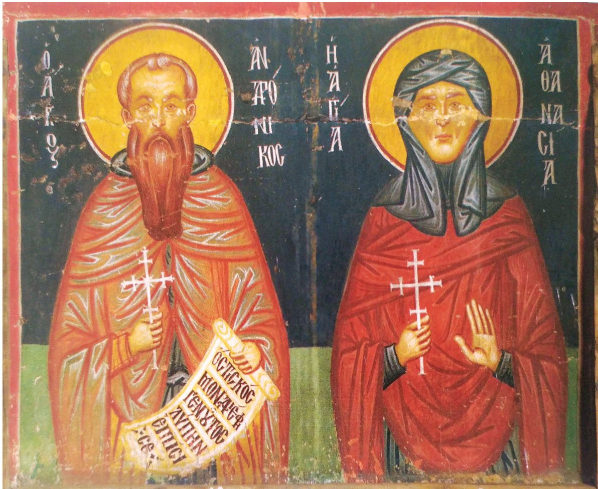
Εικ. 3. Κύπρος, Πεδουλάς, ναός του Αρχαγγέλου Μιχαήλ, δυτικός τοίχος. Οι άγιοι Ανδρόνικος και Αθανασία, 1474.

Δεδομένου ότι στις ανωτέρω παραστάσεις οι μορφές των δύο αγίων εικονίζονται ιστάμενες και μετωπικές, η μία δίπλα στην άλλη, σε κοινό εικονογραφικό τύπο που επαναλαμβάνεται σταθερά, με μικρές μόνο παραλλαγές ως προς τις χειρονομίες και τα attributa τους, η εικόνα της Κιμώλου αποκτά ιδιαίτερη σημασία.