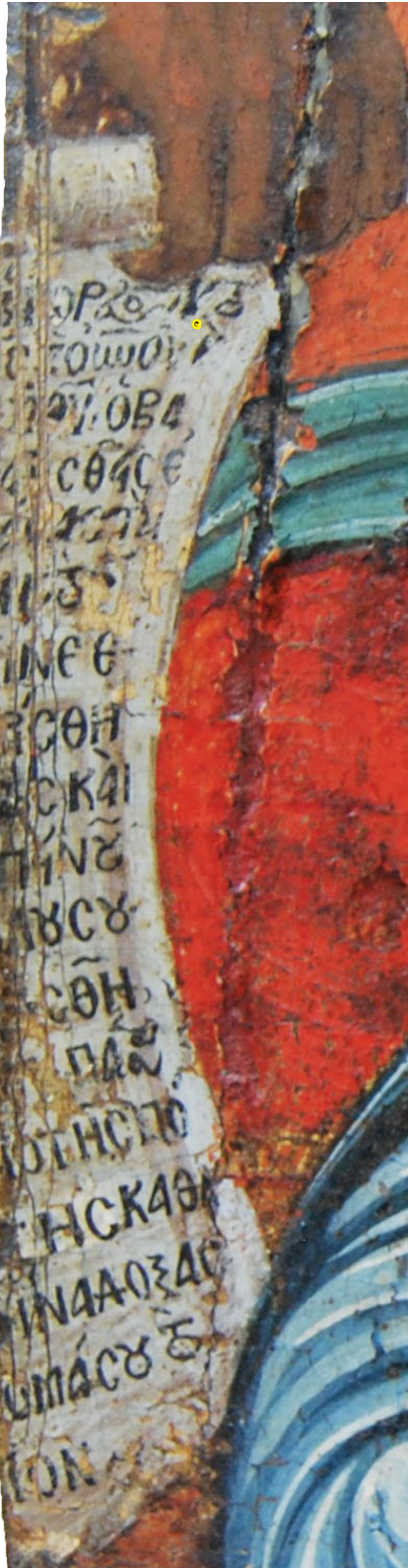
Εικ. 6. Το ειλητάριο του αγίου Ανδρονίκου (λεπτομέρεια της Εικ. 2).

αναγράφεται στις δύο σελίδες του ανοικτού κώδικα του Χριστού (στ. 501-508) (Εικ. 7): Δεῦρω Ἀνδρόνικε ἀγαπητὲ μ[ου] / ἀναπαύου εἰς τὰ ταμεῖα τῆς / βασιλείας μου ἐν σοὶ γὰρ / ἀναπαύει τὸ Πν(εῦ)μα [μ]ου τὸ ἅγιον / σὲ μακαρίζω εἰς / τὰς ἐρχομένας / γενεὰς καὶ ὡς ἐγένου ἐν τῇ ζωῇ / σου λιμῆν τῶν πτωχῶν, οὕτως καὶ / μετὰ θάνατον λιμῆν / τῶν ἀσθενούντων / ἔση καὶ [ὄπ]ου ἐὰν / κτισθῆ εὐ[κτῆ]ριον ἐπὶ τῷ ὀνόματι σου ἐκεῖ / ἐπισκιάσει τὸ Πν(εῦ)μα μου τὸ ἅγιον / [σ]ὲ μακαρίζω εἰς / τ(ὰς) ἐρχο/μένας γενεὰς κα(αὶ) ὡς ἐ/γίνου ἐν τῇ ζωῇ σου λιμῆν / κα(αὶ) τεῖχος τῶν ὀρφαν(ῶν) κα(αὶ) πτωχ(ῶν) / οὕτως κα(αὶ) μετὰ τ(ῆν) ἔξοδ[όν] σου λι/μ(ῆ)ν κα(αὶ) τεῖχος τ(ῶν) ἐν θλήψεσι / κα(αὶ) θαύματα καὶ ἰάσεις γενήσονται / διὰ τοῦ ὀνόματός σου. Ο Χριστὸς καλεῖ τον ἅγιο να αναπαυθεῖ στα ταμεῖα τῆς βασιλείας του και τον καλοτυχιζεῖ να γίνει προστάτης των αρρώστων και των θλιμμένων μετὰ τον θάνατό του, ὅπως ἦταν προστάτης των φτωχῶν και των ορφανῶν στη ζωῇ του. Και το ἅγιο Πνεῦμα του θα επισκιάσει ναὸ αφιερωμένο στον ἅγιο, ὅπου κι αν κτισθεῖ, και θα γίνονται θαύματα στο ὄνομά του. Στο τμήμα της διήγησης του Εφραῖμ, που ακολουθεῖ την τελευταία αυτή περικοπή, περιγράφεται ο θάνατος και η κηδεία του Ανδρονίκου.