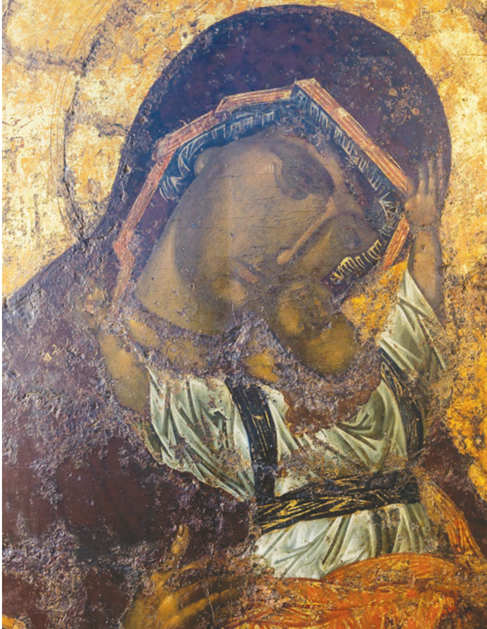
Εικ. 10. Αμοργός, μονή Παναγίας Χοζοβιτιώσης. Εικόνα με την Παναγία βρεφοκρατούσα, λεπτομέρεια.

του άνω και κάτω τμήματος της μορφής του Χριστού και των χειρών του.