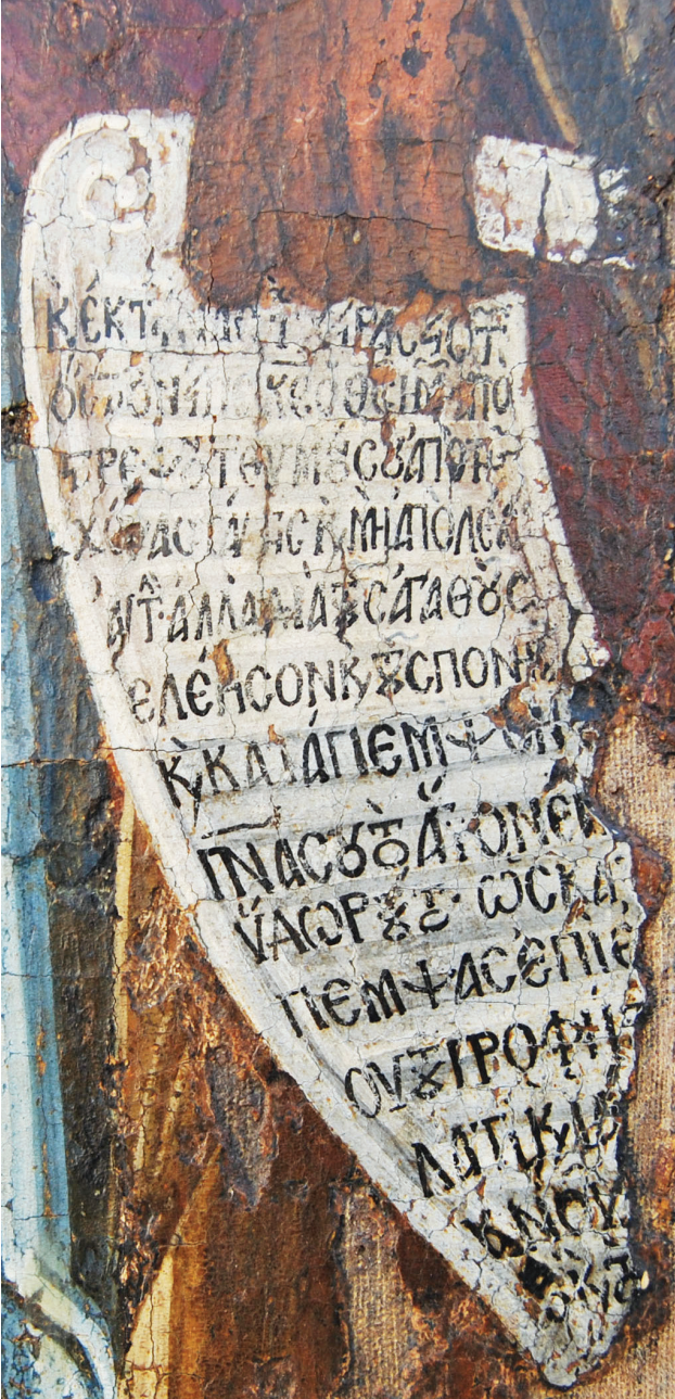
Εικ. 5. Το ειλητάριο της αγίας Αθανασίας (λεπτομέρεια της Εικ. 2).

ορθόδοξης Θεολογίας υπερβαίνει τα όρια της μελέτης μας. Βλ. ενδεικτικά K. Aland, «The Problem of Anonymity and Pseudonymity in Christian Literature of the First Two Centuries», The Journal of Theological Studies 12 (1961), 39-49. R. Balz, «Anonymität und Pseudepigraphie im Urchristentum. Überlegungen zum literarischen und theologischen Problem der urchristlichen