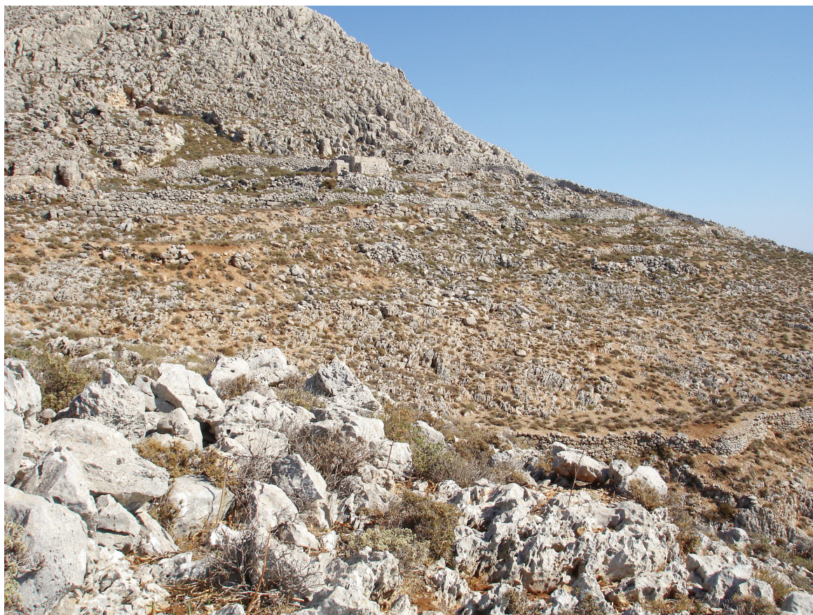
Εικ. 8. Χάλκη, Άις Νόφρης στον Άι Νόφρη το βουνό.

Στην κατηγορία των καθολικών μοναστηριού κατατάξαμε έναν ακόμα ναό, τον Άι Νόφρη του Άι Νόφρη το βουνό 70 , συνεκτιμώντας τη θέση του –στην Πλαγιά, ψηλότερα από το προηγούμενο μοναστήρι και εκτός των κύριων μονοπατιών του νησιού–, μορφολογικά χαρακτηριστικά του –όπως τον νάρθηκα και το αρκοσόλιο στο εσωτερικό του νάρθηκα 71 – καθώς και την αφιέρωσή του σε άγιο ερημίτη, τον Ονούφριο 72 (Εικ. 8). Ο ναός φέρει εντελώς άτεχνες και