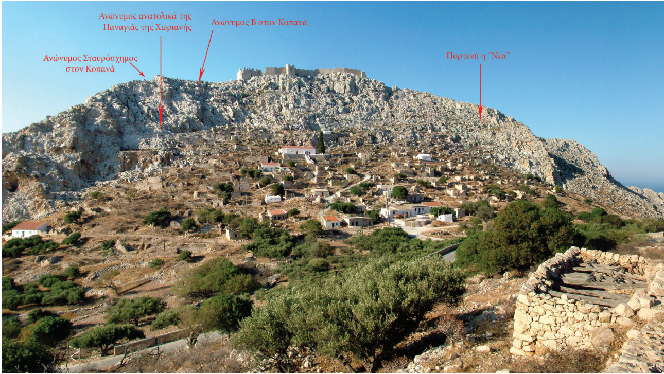
Εικ. 2. Χάλκη. Πανοραμική εικόνα του κάστρου και του Χωριού με σημειωμένη τη θέση των ασκηταριών.

(α) Η θέση του ναού. Οι ναοί-ασκηταριά βρίσκονται πάντα σε δυσπρόσιτες και απόκρημνες θέσεις, συχνά σε κορυφές λόφων και βουνών 29 . Τα «καθολικά» μοναστηριών βρίσκονται σε πλαγιές, έξω από το κύριο μονοπάτι του νησιού, την κύρια οδική του αρτηρία που το διέσχισε από τα ανατολικά προς τα δυτικά. Αντίθετα, τα μεσαιωνικά «χωριά» της Χάλκης βρίσκονται στη μια ή στην άλλη πλευρά του μονοπατιού αυτού 30 .