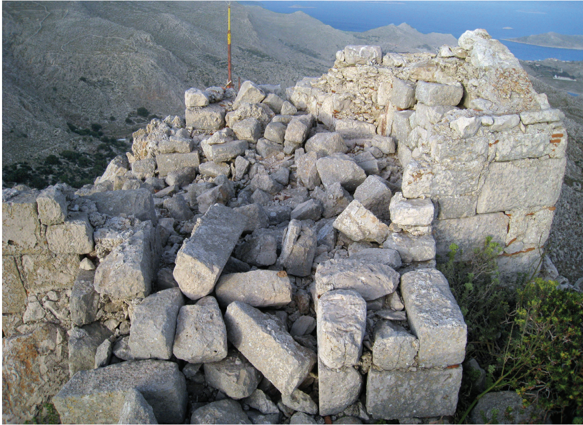
Εικ. 4. Χάλκη. Ανώνυμος Α σταυρόσχημος στον Κοπανά.

στη μεσοβυζαντινή περίοδο 41 , προσιδιάζει σε χρήση μοναστική. Παραδείγματα καθολικών αλλά και ησυχαστηρίων σε σχήμα σταυρού υπάρχουν πολλά στην Κρήτη αλλά και αλλού 42 . Αρκετά από αυτά τα μοναστικά ναύδρια της Κρήτης ανεγέρθηκαν τον 11ο αιώνα από τον Ιωάννη τον Ξένο 43 . Το δεύτερο ασκηταριό, ο Ανώνυμος Β στον Κοπανά 44 , πιθανότατα της περιόδου της Ιπποτοκρατίας, έχει ελλειψοειδή κάτοψη (Εικ.