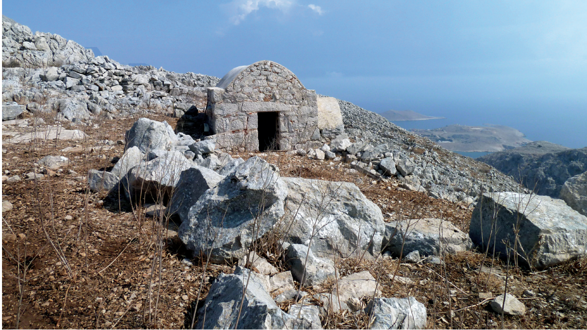
Εικ. 6. Χάλκη. Άις Αντριάς στου Άι Αντριά το βουνό.

που συλλειτουργούσαν, κάτι που εξηγεί ίσως και την ανάγκη για μεγάλο ιερό και θρανία σε αυτό. Στην προκειμένη περίπτωση το κτίσμα στα νότια ίσως ήταν τράπεζα. Το μοναστικό εγκαθίδρυμα με τη στέρνα του θα εξασφάλιζε στους αναχωρητές και το απαραίτητο νερό. Ίσως έχουμε, δηλαδή, εδώ ένα είδος λαύρας.