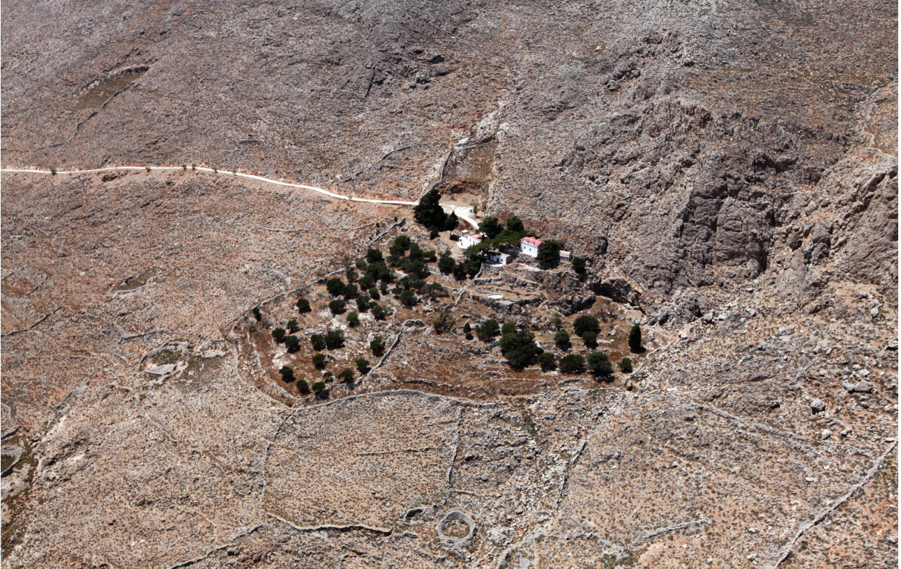
Εικ. 7. Χάλκη. Πανοραμική στην Πλαγιά ή Παλαρνιώτης στου Αι Νόφρη το βουνό.

κατά τον 19ο αιώνα ανανεώθηκε η λατρεία με την ανέγερση νέων ναών πλάι στους παλαιούς. Αυτό δεν παρατηρείται σε ναούς αγροτικών χωριών ή ποιμενικών εγκαταστάσεων.