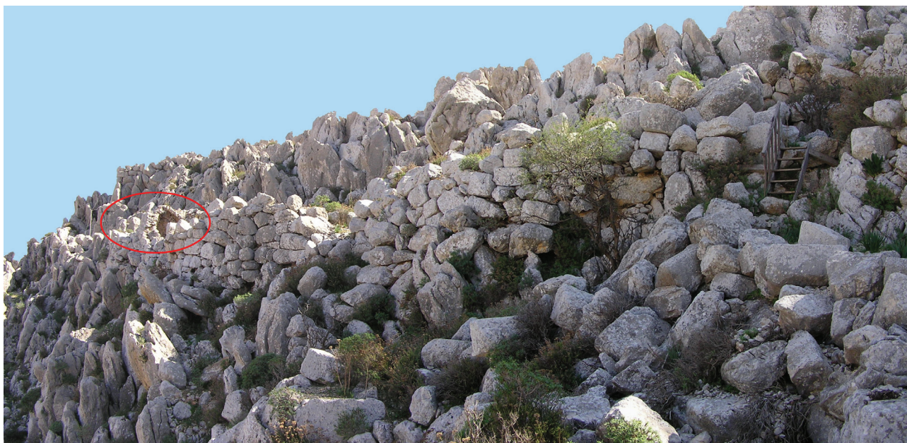
Εικ. 5. Χάλκη. Ανώνυμος Β στον Κοπανά.

τα εκκλησιάκια της Χάλκης 47 . Και ενώ για τα δύο πρώτα η κατάσταση στο εσωτερικό τους δεν επιτρέπει να αποφανθεί κανείς με απόλυτη βεβαιότητα για την ύπαρξη ή μη χαμηλού φράγματος πρεσβυτερίου, η τρίτη περίπτωση, η Πορτενή η «Νέα», δεν αφήνει αμφιβολία. Απλώς, το ανατολικό άκρο του ναόσχημου ασκηταριού είναι υπερυψωμένο σε σχέση με τον υπόλοιπο χώρο. Η απουσία τέμπλου σε ναό έχει συνδεθεί από κάποιους ερευνητές με τη μη τέλεση σε αυτόν θείας λειτουργίας 48 . Ωστόσο, στα δύο από τα τρία ναόσχημα ασκηταριά υπάρχει αγία τράπεζα, κάτι που θα μπορούσε να σημαίνει ότι τελούνταν μεν θεία λειτουργία αλλά από ιερομόναχους για αυτούς τους ίδιους, δεν απευθυνόταν, δηλαδή, σε λαϊκούς, άρα δεν υπήρχε ανάγκη φράγματος, διαχωρισμού κλήρου-λαού 49 .