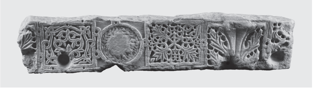
Εικ. 7. Καλαμάτα, Αρχαιολογικό Μουσείο Μεσσηνίας. Τμήμα επιστυλίου τέμπλου από τον ναό του Σωτήρος Χριστού στους Χριστιάνους Τριφυλίας.

τότε το εντυπωσιακό αυτό τμήμα των οχυρώσεων της Μεθώνης, που προστατεύει και «κατοχυρώνει» από τις εχθρικές επιθέσεις την πιο ευάλωτη χερσαία πλευρά της πόλης, κατασκευάστηκε το 1084/85, επί Αλεξίου Α΄ Κομνηνού.