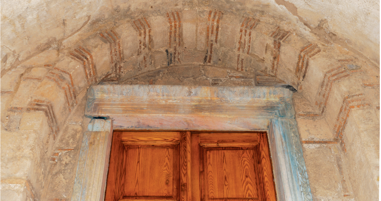
Εικ. 10. Χριστιάνοι Τριφυλίας, ναός Σωτήρος Χριστού. Λεπτομέρεια του ανακουφιστικού τόξου της δυτικής θύρας εισόδου στον ναό.

μεταξύ των βασικότερων χαρακτηριστικών της κωνσταντινουπολίτικης αρχιτεκτονικής παράδοσης ήδη από τη μέση βυζαντινή περίοδο 52 . Εξ όσων μάλιστα γνωρίζω, ο ναός των Χριστιάνων παρέμεινε για αιώνες το μοναδικό παράδειγμα εφαρμογής της μικτής τοξοδομίας στην Πελοπόννησο, έως και τις πρώτες δεκαετίες του 14ου αιώνα, όταν οικοδομήθηκε στον Μυστρά ο ναός της Οδηγήτριας από τον ηγούμενο της μονής Βροντοχίου Παχώμιο, όπου και πάλι η υιοθέτηση της