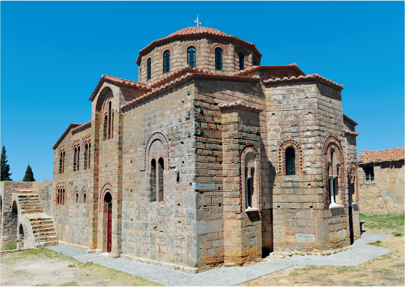
Εικ. 6. Χριστιάνοι Τριφυλίας, ναός Σωτήρος Χριστού. Γενική άποψη από τα νοτιοανατολικά.

ενός εντυπωσιακού τμήματος των τειχών της Μεθώνης, μεταξύ εξωτερικής και ενδιάμεσης πύλης (Εικ. 5) 44 , με την έμμετρη επιγραφή που εδώ μας απασχολεί. Η επιμέλεια στον τρόπο κατασκευής του εν λόγω τμήματος των τειχών με λαξευτές λιθοπλίνθους κατά το ισόδομο σύστημα δομής θυμίζει αρχαία μνημεία, έχοντας μάλιστα οδηγήσει ορισμένους ερευνητές σε λανθασμένα συμπεράσματα ως προς τη χρονολόγησή του 45 . Λεπτομέρειες, όμως, όπως η παρεμβολή σφηνών