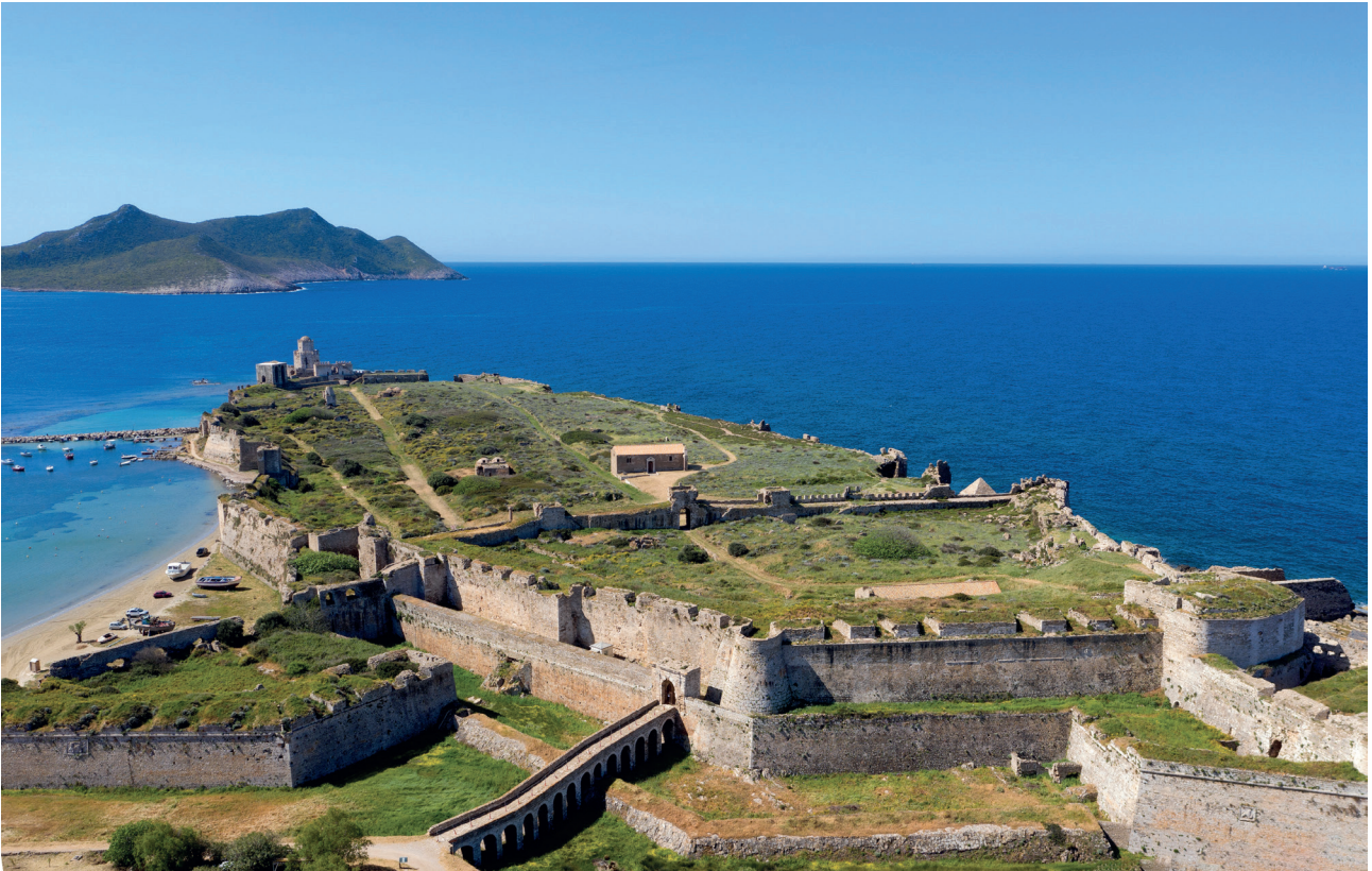
Εικ. 3. Μεθώνη, γενική άποψη του κάστρου από τα βορειοανατολικά.

Στο υπό εξέταση ενεπίγραφο τμήμα δεν διευκρινίζεται η ιδιότητα του Θεοφυλάκτου, ενώ και η χρονολογία σώζεται αποσπασματικά. Ωστόσο, η αναφορά της αυτοκρατορικής οικογένειας των Κομνηνών, σε συνδυασμό με τη μνημόνευση των Νορμανδών στην τελευταία σειρά της επιγραφής, οριοθετούν ένα ασφαλές χρονικό πλαίσιο που εκτείνεται από το τελευταίο τέταρτο του 11ου έως και τα μέσα της ένατης δεκαετίας του 12ου αιώνα.