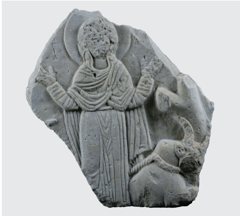
Εικ. 4. Καλαμάτα, Αρχαιολογικό Μουσείο Μεσσηνίας. Μαρμάρινη ανάγλυφη εικόνα της αγίας Θέκλας από τον ναό του Αγίου Νικολάου στη Μεθώνη.

αυτής της προσπάθειας θα ανέμενε κανείς μια συνολική μέρμινα για την αμυντική θωράκιση κομβικών πόλεων της αυτοκρατορίας, ειδικά εκείνων που βρίσκονταν κατά μήκος των δυτικών ακτών των βαλκανικών επαρχιών της. Εάν η ανάλυση που προηγήθηκε ευσταθεί, η ενεπίγραφη πλάκα από τη Μεθώνη έρχεται να επιβεβαιώσει την αγωνία της κεντρικής εξουσίας, υπό την αυξανόμενη πίεση των Νορμανδών, να «κατοχυρώσει» έμπρακτα τις κτήσεις της, αναχαιτίζοντας με τον τρόπο αυτό τις φιλόδοξες βλέψεις του νορμανδού ηγεμόνα Ροβέρτου Γισκάρδου και των διαδόχων του.