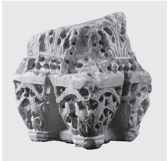
Εικ. 8. Καλαμάτα, Αρχαιολογικό Μουσείο Μεσσηνίας. Περιτέχνο κιονόκρανο προσκνητηαρίου από τον ναό του Σωτήρος Χριστού στους Χριστιάνους Τριφυλίας.

Ταυτόχρονα σχεδόν με την επιδιόρθωση των τειχών της Μεθώνης, πιθανότατα κατά το έτος 1086, αναδιοργανώνεται η εκκλησιαστική διοίκηση της ευρύτερης περιοχής και δημιουργείται στα βόρεια όρια της επισκοπής Μεθώνης μια νέα μητρόπολη, αυτή της Χριστιανουπόλεως 46 . Αμέσως μετά, στην έδρα της νέας μητροπόλεως, στη Χριστιανούπολη Τριφυλίας, εκκινούν οι εργασίες για την ανέγερση του μεγαλύτερου και λαμπρότερου ναού της μεσοβυζαντινής Πελοποννήσου (Εικ. 6), εκ των μεγαλύτερων σωζόμενων βυζαντινών