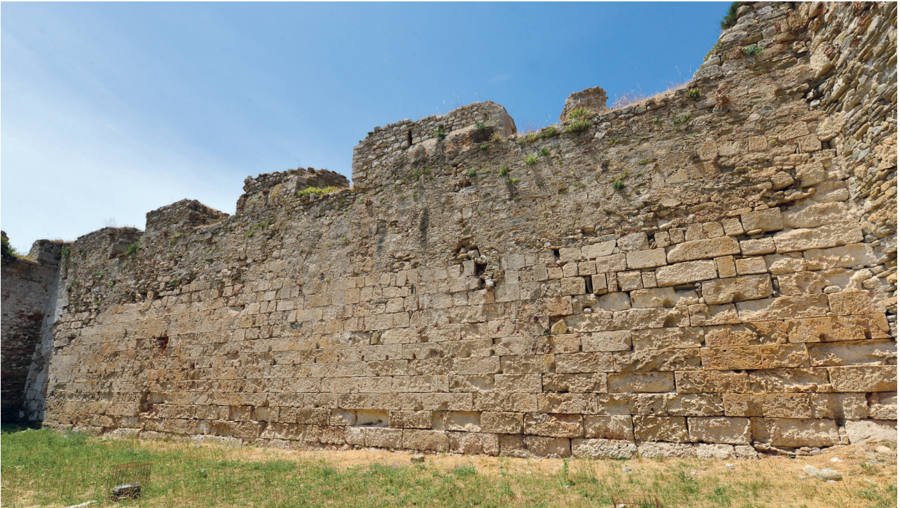
Εικ. 5. Μεθώνη, κάστρο. Γενική άποψη τμήματος του τείχους μεταξύ εξωτερικής και ενδιάμεσης πύλης.

τόσο αξιοθρήνητη όσο επιχειρεί να την παρουσιάσει ο επίσκοπός της Νικόλαος στην προσπάθειά του να εξασφαλίσει την περιπόθητη μετάκλησή του στην Κωνσταντινούπολη από τα «κατώτατα των Κατωτικών», όπως ο ίδιος αποκαλεί τον τόπο που «καταδικάστηκε να κατοικήσει» 40 .