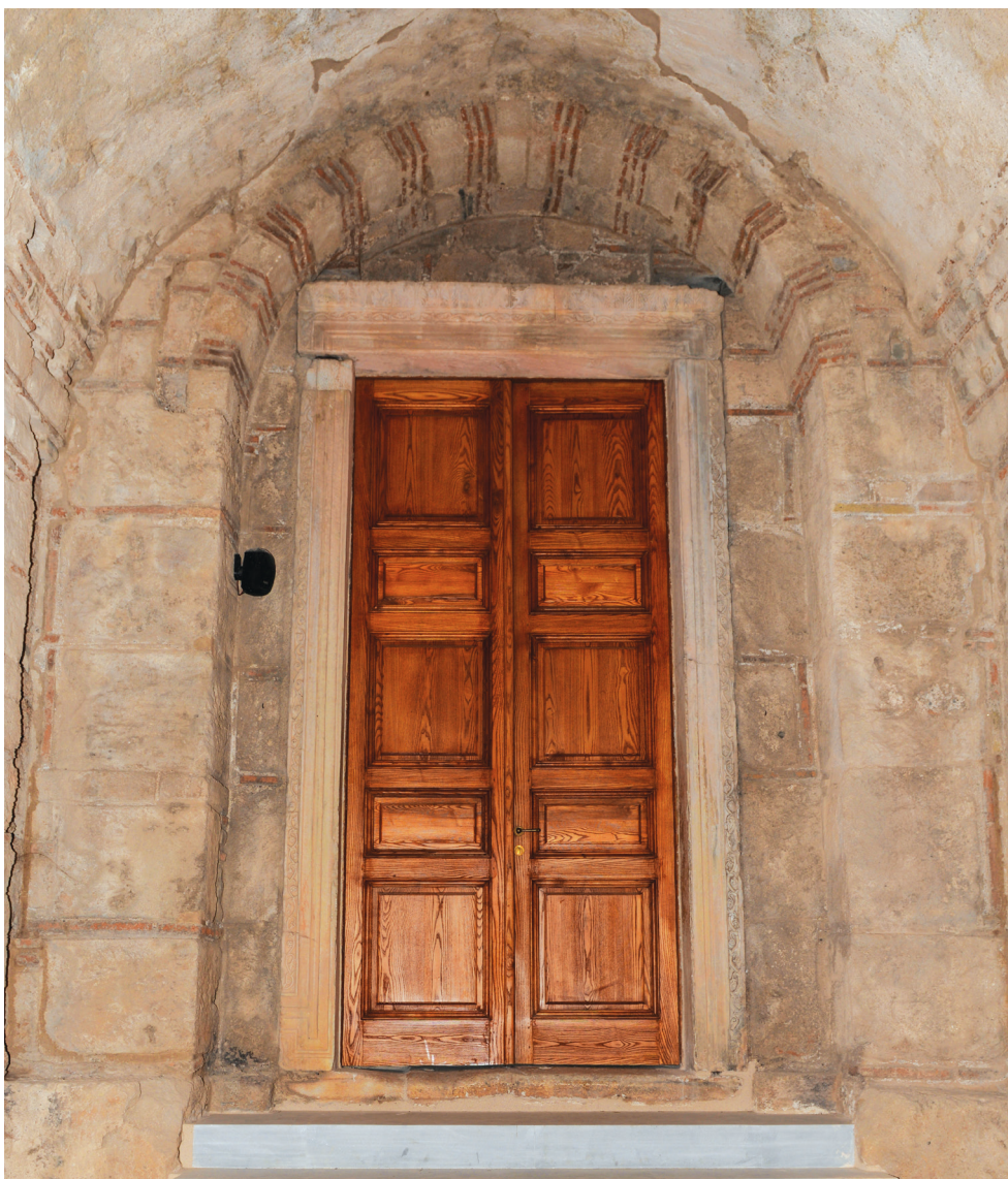
Εικ. 9. Χριστιάνοι Τριφυλίας, ναός Σωτήρος Χριστού. Η δυτική θύρα εισόδου στον νάρθηκα.

για τα πελοποννησιακά εργαστήρια γλυπτικής καθ' όλη τη διάρκεια του 12ου αιώνα 51 .