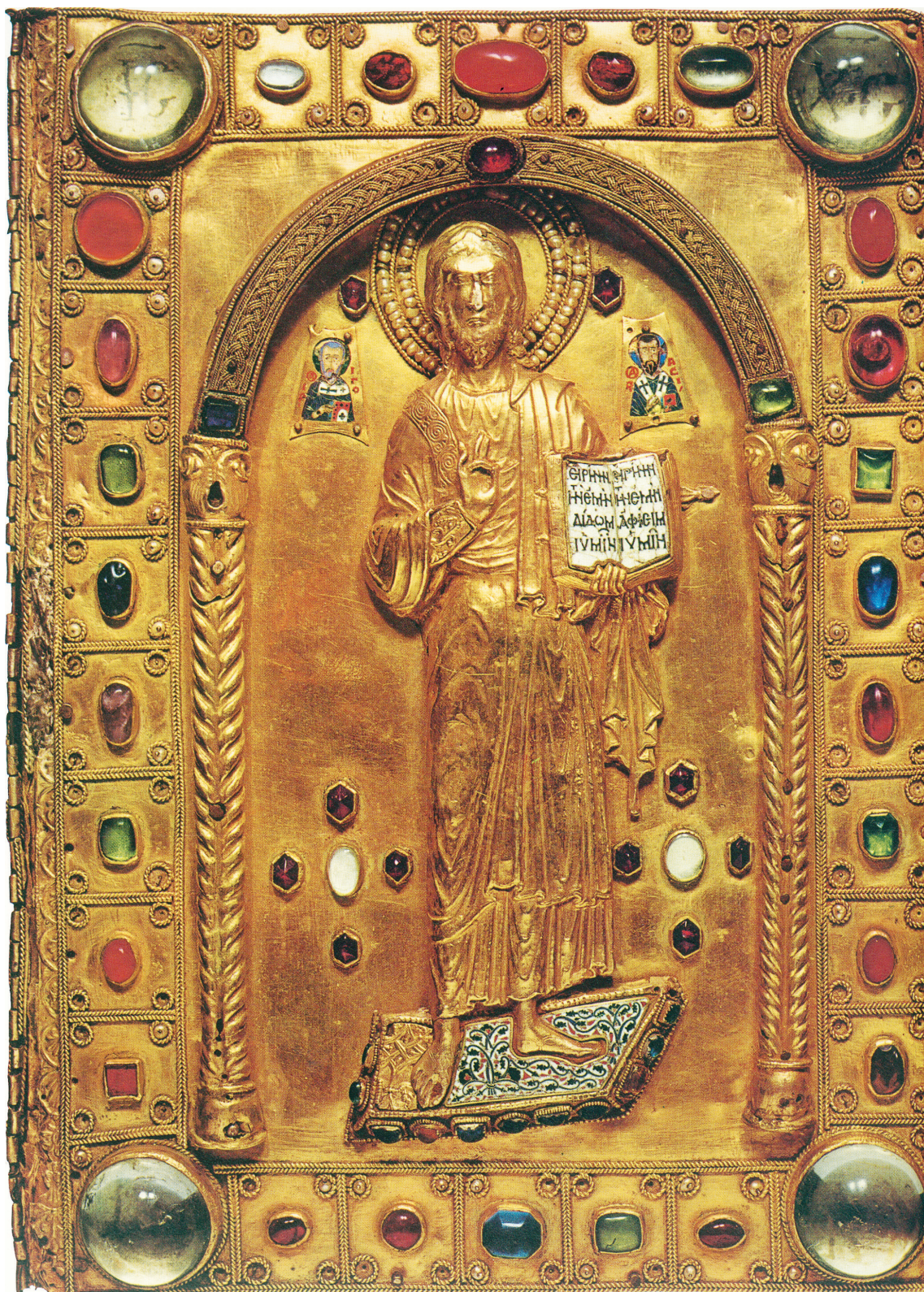
Εικ. 1. Άγιον Όρος, μονή Μεγίστης Λαύρας, Σκευοφυλάκιο. Η πρόσθια όψη της σταχώσεως του «Ευαγγελίου του Φωκά» (Σκευοφυλάκιον 1).