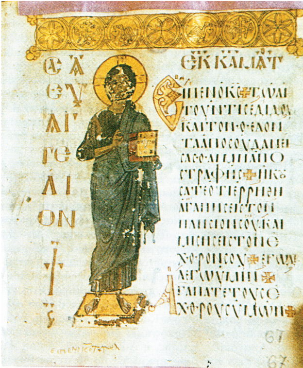
Εικ. 5. Άγιον Όρος, μονή Μεγίστης Λαύρας, Βιβλιοθήκη. Κώδικας Α 86, φ. 67α.

πάρα πολύ μεγάλη ομοιότητα με τη γνωστή παράσταση του Χριστού στο πρόσθιο εξώφυλλο της στάχωσης του Σκευοφυλακίου (Εικ. 1). Δηλαδή και στην περίπτωση της στάχωσης του «χειρογράφου του Φωκά», ο Χριστός Παντοκράτωρ παρουσιάζεται όρθιος, σε στάση κατ' ενώπιον. Και εδώ, στη μικρογραφία, με το δεξί χέρι ευλογεί και με το αριστερό κρατάει ανοιχτό, αυτή τη φορά, ευαγγέλιο 17 . Στις δύο παραστάσεις, της ολόσωμης μικρογραφίας του Α 86 και της στάχωσης «του Φωκά», η λεπτότητα και η στάση του σώματος, η πτυχολογία των ενδυμάτων και η κόμμωση είναι όμοιες ή, έστω, σχεδόν όμοιες, παρά τη διαφορά του υλικού με το οποίο έχουν αποτυπωθεί 18 . Η μόνη διαφορά έγκειται στο ότι στη μία παράσταση ο Χριστός κρατά