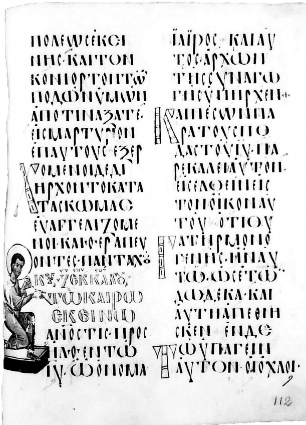
Εικ. 3. Άγιον Όρος, μονή Μεγίστης Λαύρας, Βιβλιοθήκη. Κώδικας A 86, φ. 112α.