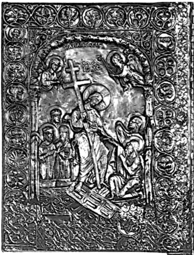
Εικ. 2. Άγιον Όρος, μονή Μεγίστης Λαύρας, Σκευοφυλάκιο. Η οπίσθια όψη της σταχόσεως του «Ευαγγελίου του Φωκά».

κάποιο άλλο χειρόγραφο που να ανταποκρίνεται στην παράδοση αυτή. Πρακτικά, δηλαδή, αξίζει να εξετάσουμε διάφορα χειρόγραφα που πληρούν ορισμένες προϋποθέσεις, για να διαπιστώσουμε αν κάποιο από αυτά θα μπορούσε να ήταν δώρο του Φωκά. Οι προϋποθέσεις αυτές είναι ότι το υπό αναζήτηση χειρόγραφο πρέπει: (α) να είναι ευαγγέλιο (ευαγγελιστάριο)· (β) να χρονολογείται στον 10ο αιώνα· (γ) να βρίσκεται μέσα στη Λαύρα, διότι ως πολύτιμο κειμήλιο θα έμενε εκεί προστατευμένο πάντα· (δ) να είναι πολυτελές ως αυτοκρατορικό δώρο.