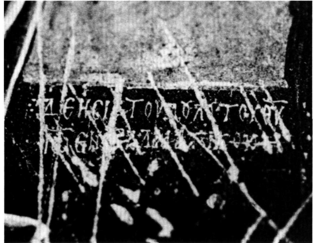
Fig. 5. Karanlık kilise, narthex : détail de l'inscription du donateur Jean avant la restauration des peintures (d'après G. de Jerphanion).

Il est regrettable que nous ne disposions pas de plus amples informations sur le donateur Jean et sur son rôle dans la décoration de Karanlık kilise. L'inscription dédicatoire de l'église, jadis peinte au-dessus de la porte qui mène du narthex au naos et courant probablement sur six lignes 21 , a été soigneusement grattée avant même que les premiers chercheurs n'aient visité le monument vers la fin du XIX e siècle. Cette inscription aurait probablement fourni des informations non seulement sur la date des peintures, aujourd'hui tellement controversée 22 , mais aussi sur les conditions