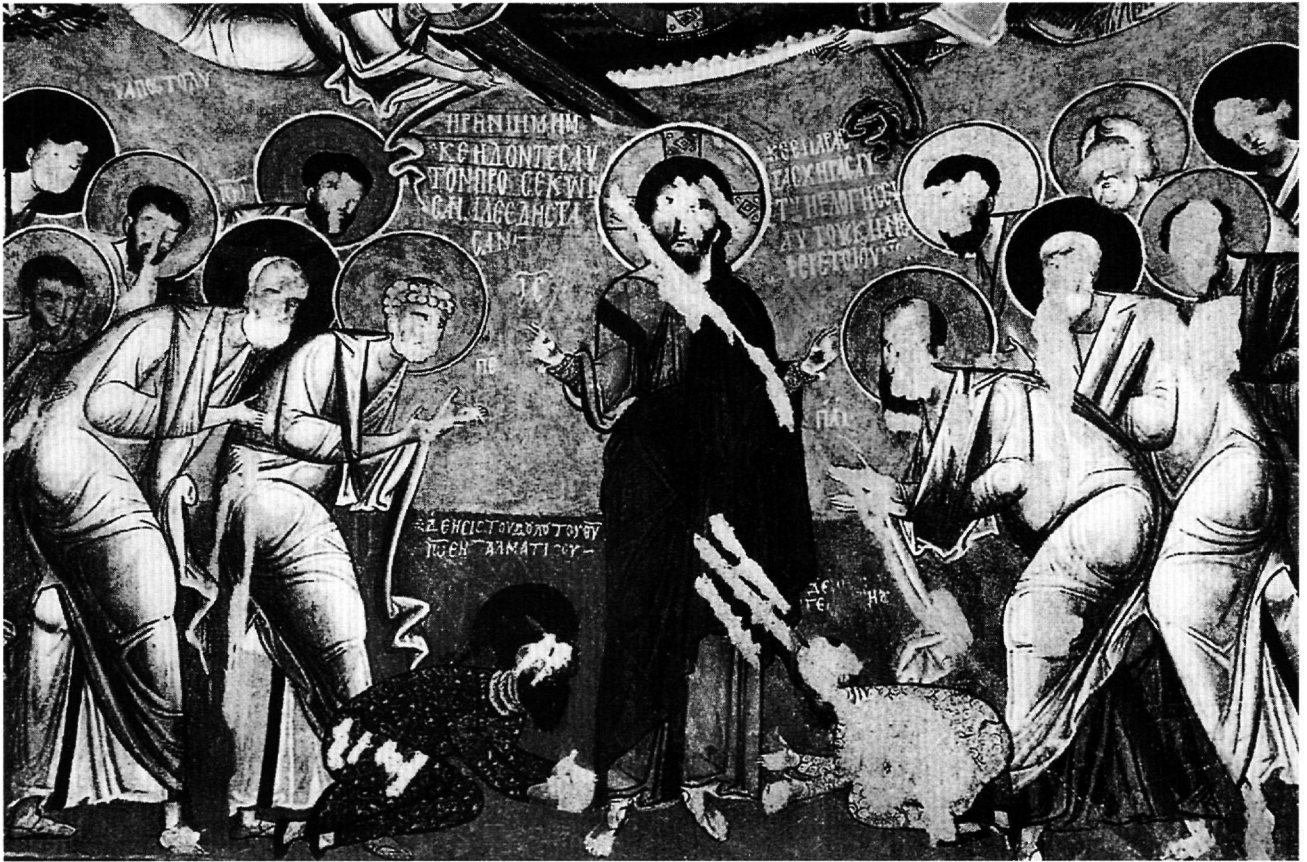
Fig. 2. Karanlık kilise, narthex : Bénédiction des apôtres et donateurs.

trois « églises à colonnes » de Göreme suivant le goût de la capitale. Cette dernière interprétation a généralement été reprise, toujours sous forme d'hypothèse, jusqu'aux publications les plus récentes 13 . Parallèlement, A. P. Každan a tenté de proposer une lecture différente dans une publication d'A. W. Epstein 14 : pour lui, le donateur Jean pourrait être un soldat, puisque le terme ἐνταγματικοῦ , apparemment dérivé du mot τάγμα , bataillon, est proposé pour la fin de l'invocation. Cette lecture demeure pourtant assez peu probable ; il n'y a aucune raison pour substituer, en cinquième place, la lettre « Γ » à la lettre « Λ », celle-ci étant