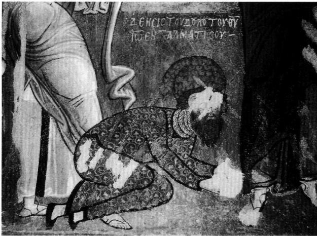
Fig. 3. Karanlık kilise, narthex : le donateur Jean accompagné de son invocation peinte.

dissement (Fig. 5). Comme on le voit nettement, la troisième lettre avant la fin du dernier mot est à moitié effacée. Cependant, il est facile de distinguer que les quelques restes de peinture encore conservés, surtout dans la partie supérieure de cette lettre, dessinent une ligne courbe. Ce qui nous conduit à considérer que, très probablement, ce caractère n'est pas un « K », dont les traits seraient nécessairement rectilignes ; il suffit pour s'en convaincre de comparer avec les caractères correspondants dans les autres inscriptions de la même scène, disposées de part et d'autre de la tête du Christ (Fig. 2). De plus, les traces de la lettre en question semblent correspondre aux deux extrémités, supérieure et inférieure, dans la partie droite d'un caractère qui aurait alors dessiné une courbe vers la gauche ; seule la lettre « C » peut à la fois avoir cette forme et donner sens à la phrase 17 . Compte tenu de cette rectification, on peut proposer pour l'inscription examinée la lecture suivante : ΔΕΗCΙ[C] ΤΟΥ ΔΟΛΘ ΤΟΥ Θ(ΕΟ)Υ / ΙΩ(ΑΝΝΟΥ) ΕΝ- [Τ]ΑΛΜΑΤΙ[C]ΟΥ, (Δέησις τοῦ δούλου τοῦ Θεοῦ Ἰωάννου, ἐντάλματί σου, Prière du serviteur de Dieu Jean selon ton mandat) 18 .