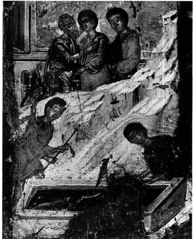
Εικ. 17. Έφεσος. Ο ενταφιασμός του Ιωάννη (πρβλ. Εικ. 3, 14).

γές του θέματος. Στην περίπτωση όμως αυτή θα είχαμε κατ' αρχήν μία σαφή παρανόηση των γεγονότων και έναν προφανή, κραυγαλέο «αναχρονισμό» εκ μέρους του ζωγράφου, πρώτα η μετάσταση και μετά ο ενταφιασμός. Ο ζωγράφος εν τούτοις δείχνει απόλυτη συνέπεια στη χρονική ακολουθία των συμβάντων του βίου όσον αφορά τη διάταξη των υπόλοιπων σκηνών του πλαισίου. Και κατά δεύτερο λόγο στα παραδείγματα με το παραδοσιακό σχήμα που μας είναι γνωστά, ο απόστολος απεικονίζεται όρθιος μέσα στο κενοτάφιο, ώστε να εξυπνοείται έτσι η μετάστασή του με την εικονιστική απόδοση της «Ανάστασης από το μνήμα» 37 και όχι έξω από αυτό, όπως στην εικόνα μας. Ακόμα και στην περίπτωση που ο ζωγράφος, έχοντας συλλάβει ως μία παραστατική ενότητα τις δύο σκηνές, είχε την πρόθεση να περιγράψει με την πρώτη τη μετάσταση του ευαγγε-