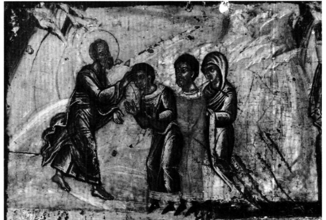
Εικ. 9. Έφεσος. Η βάπτιση του Δόμνου, του Διοσκορίδη και της Ρωμάνας (πρβλ. Εικ. 3, 6).

12. Ο Ἰωάννης παραδίδει το Ευαγγέλιο και αναχωρεί για την Έφεσο (Εικ. 15). Ο τόπος λυτρώνεται από τα κακά, ο όχλος μεταστρέφεται και προσκυνεί τον Ἰωάννη και ικανός αριθμός πολιτών βαπτίζεται. Σχεδόν ολόκληρο το νησί προσηλυτίζεται σταδιακά στον χριστιανισμό, ο νέος αυτοκράτορας ανακαλεί τον Ἰωάννη από την εξορία και ενώ οι πιστοί της εκκλησίας της Πάτμου τον ικετεύουν να μην τους εγκαταλείψει, εκείνος τους παραδίδει γραμμένο σε ειλητά το κείμενο του Ευαγγε-