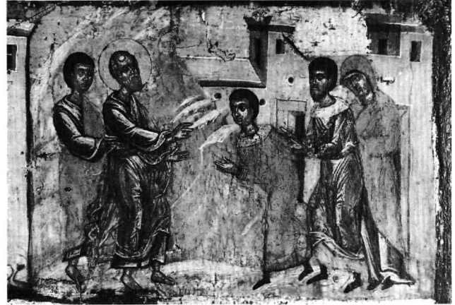
Εικ. 12. Πάτμος. Η βάπτιση του Απολλωνίδη, του Μύρωνα και της Φωνής (πρβλ. Εικ. 3, 9).

Στη διάταξη των επεισοδίων από αριστερά προς τα δεξιά τηρήθηκε με συνέπεια η χρονική σειρά των γεγονότων, όπως εξιστορούνται στο κείμενο των Πράξεων. Έχουν επιλεγεί τα σημαντικότερα περιστατικά της ιστορίας, η περιγραφή τους είναι συνοπτική αλλά συνάμα