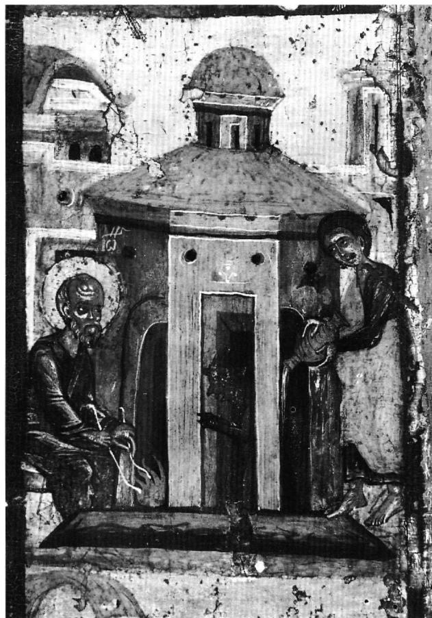
Εικ. 7. Έφεσος. Ο Ιωάννης κανστής και ο Πρόχορος περιχύτης στο βαλανείο (πρβλ. Εικ. 3, 4).

9. Βάπτισμα του Απολλωνίδη, του Μύρωνα και της Φωνής (Εικ. 12). Ακολουθούν διαβολικές ενέργειες και διωγμοί εναντίον του αποστόλου και, τέλος, με διαταγή του αυτοκράτορα εξορίζεται: ή ήμετέρα τοίνυν κελεύει εξουσία, Ιωάννην και Πρόχορον τούς ἀποστάτας οικεῖν ἐν Πάτμῳ τῇ νήσῳ ( Acta Joannis , 46). Στη διάρκεια του ταξιδιού προς την εξορία ο απόστολος πραγματοποιεί πολλά θαύματα. Κατά την παραμονή του στο νησί, σε πόλη ονόματι Φορά, θεραπεύει τον ρήτορα Απολλωνίδη, γιο του Μύρωνα και της Φωνής, από πνεύμα πύθωνος, που ενοικούσε στον νέο από ηλικίας τριών