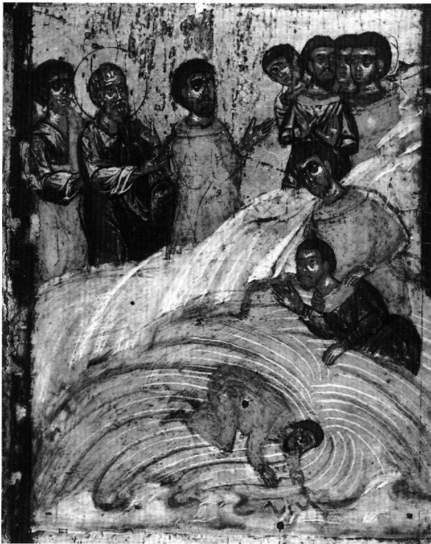
Εικ. 13. Πάτμος. Δαμονικές ενέργειες του μάγου Κύνωπα (πρβλ. Εικ. 3, 10).