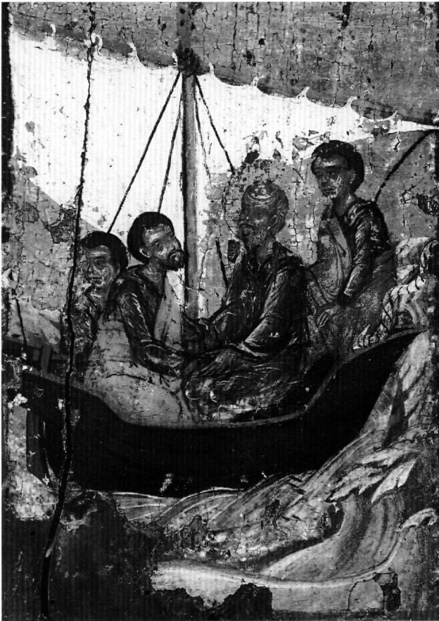
Εικ. 4. Το ταξίδι από την Παλαιστίνη στην Ασία (πρβλ. Εικ. 3, 1).

ρίδης γνωρίζοντας ακριβώς τις συγκεκριμένες ημερομηνίες κατά τις οποίες συνέβαινε η ἐπιβουλή αὐτή , έστειλε τον δεκαοκτάχρονο μοναχογιό του Δόμνο να λουστεί μόνος του τις άλλες ημέρες. Σε μία από εκείνες τις ημέρες και ενώ οι δούλοι του νεαρού είχαν απομακρυνθεί, ο δαίμονας όρμησε και έπνιξε τον Δόμνο. Η Ρωμάννα οδύρεται, κατηγορεί τον Ιωάννη ως μάγο και τον απειλεί να του αφαιρέσει την ζωή αν δεν επαναφέρει στη ζωή τον γιο του κυρίου της. Τότε ο απόστολος περιχαρής γενόμενος ... είσεπήδησεν δέ έν τῷ βαλανείῳ ... είσοικίζει την ψυχὴν τοῦ νεανίσκου και ἐπιλαβόμενος τῆς χειρὸς αὐτοῦ ἐξήγαγεν αὐτὸν ζῶντα και εἶπεν πρὸς Ρωμάναν λαβέ τὸν υἱὸν τοῦ κυρίου σου (Acta Joannis, 28).