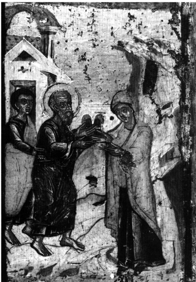
Εικ. 6. Έφεσος. Ο Ιωάννης ανακρίνεται από την Ρωμάνα (πρβλ. Εικ. 3, 3).

λος σεισμός, οι νεκροί ανασταίνονται και βαπτίζονται στο όνομα του αληθινού Θεού ( Acta Joannis , 35).