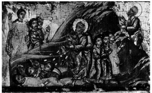
Εικ. 10. Έφεσος. Η ανάσταση των οκτακοσίων ανδρών (πρβλ. Εικ. 3, 7).

λίου, τους αποχαιρετά και αποπλέει με τον Πρόχορο για την Έφεσο (Acta Joannis, 158).