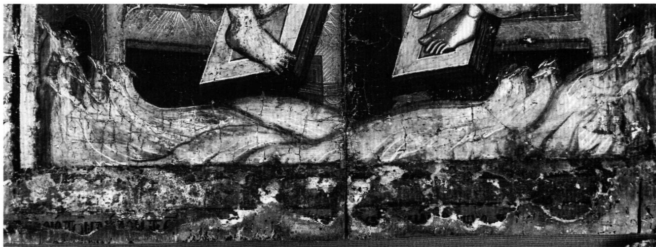
Εικ. 2. Η αφιερωτική επιγραφή. Λεπτομέρεια της Εικ. 1.

σμένα κεφαλαία. Άγγελος με ορθάνοιχτες φτερούγες υπερίπταται του Ιωάννη, με το ένα χέρι δείχνει τον ουρανό και με το άλλο τον ευαγγελιστή. Σε επαφή με το λοξόστητο πλαίσιο του πίνακα επάνω διαβάζεται επιγραφή με κόκκινα κεφαλαία τονισμένα: (ΤΑ) ΘΑΥΜΑΤΑ ΤΟΥ ΑΓΙΟΥ ΙΩ(ΑΝΝΟΥ) ΤΟΥ ΘΕΟΛΟΓΟΥ 5 . Πιο κάτω, ανάμεσα στις κορυφές των βουνών, υπάρχει, με κόκκινα κεφαλαία επίσης, η επιγραφή: Ο ΑΓΙΟΣ ΙΩ(ΑΝΝΗΣ) Ο ΘΕΟΛΟΓΟΣ. Τέλος, εκατέρωθεν του φωτοστεφάνου του Προχόρου έχει γραφεί με λευκά γράμματα η επιγραφή: Ο ΑΓΙΟΣ ΠΡΟΧΟΡΟΣ.