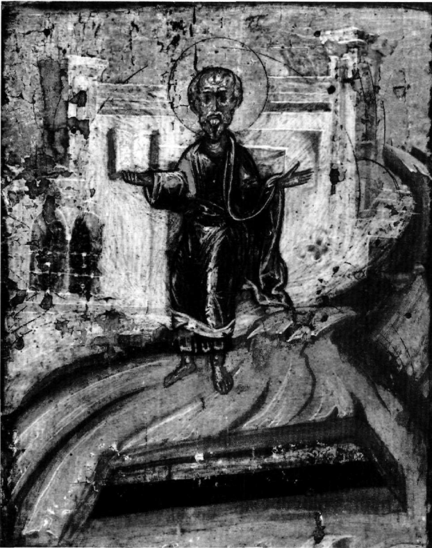
Εικ. 16. Έφεσος. Η προσευχή του Ιωάννη (πρβλ. Εικ. 3, 13).