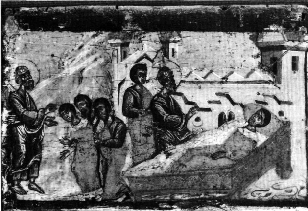
Εικ. 11. Έφεσος. Η θεραπεία του παράλυτου άνδρα (πρβλ. Εικ. 3, 8).

στους υπόλοιπους πιστούς το γεγονός, εκείνοι ζήτησαν να δουν τον τάφο του, έφθασαν εκεί, βρήκαν το μνήμα άδειο και έκλαψαν πικρά.