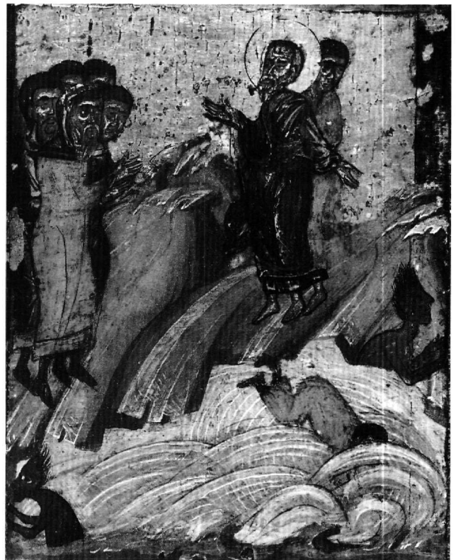
Εικ. 14. Πάτμος. Ο Ιωάννης καταβυθίζει στη θάλασσα τον Κύνωπα (πρβλ. Εικ. 3, 11).

τερα ιδρύθηκε ο ναός του–, εκεί ετάφη από τους μαθητές του και εκεί μετέστη . Από τον τάφο του ανέβλυζε θαυματουργή σκόνη –το μάννα– κάθε χρόνο την 8η Μαΐου 31 .