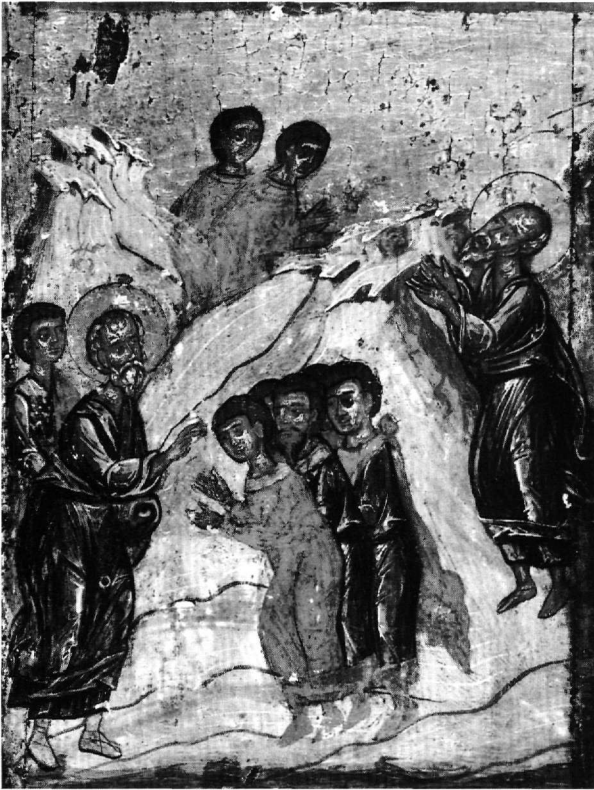
Εικ. 15. Πάτιμος. Ο Ιωάννης παραδίδει το Ευαγγέλιο και αναχωρεί για την Έφεσο (πρβλ. Εικ. 3, 12).

κοφάγο όρθιος, δεόμενος 34 . Στη σύγχρονη με τις αγιορείτικες τοιχογραφίες παράσταση στη λιτή του καθολικού της μονής Οσίου Μελετίου στον Κιθαιρώνα το θέμα εμφανίζεται με το ίδιο σχήμα: δύο συνεχόμενα ευδιάκριτα επεισόδια που αφηγούνται τον ενταφιασμό και τη μετάσταση του αγίου 35 . Στο ένα επεισόδιο, που συνήθως αποδίδεται σε πρώτο πλάνο, οι μαθητές θρηνούν επάνω από την ανοιχτή σαρκοφάγο τον δάσκαλό τους και στο άλλο ο Ιωάννης είναι όρθιος, κατενώπιον,