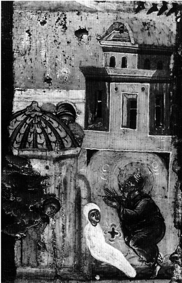
Εικ. 8. Έφεσος. Η ανάσταση του Δόμνου (πρβλ. Εικ. 3, 5).

σαν πάντες τὸν Ἰωάννην ἀποκτεῖναι (Acta Joannis, 99).