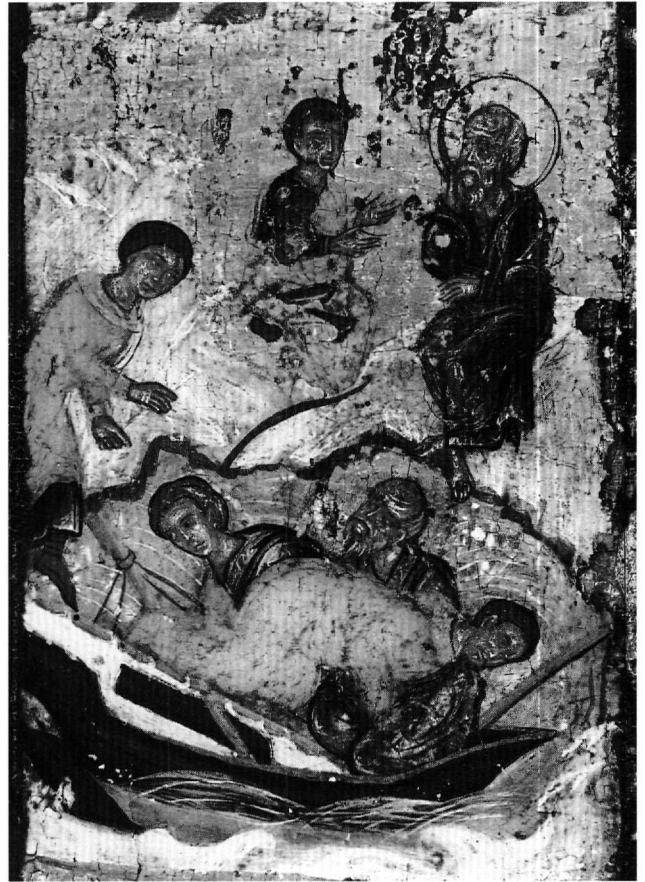
Εικ. 5. Το ναυάγιο του πλοίου και η συνάντηση των δύο ναυαγών (πρβλ. Εικ. 3, 2).

6. Βάπτισμα του Δόμνου, του Διοσκορίδη και της Ρωμάννας (Εικ. 9). Η Ρωμάννα μετανοεί και πιστεύει στον Θεό του Ιωάννη. Ο Διοσκορίδης όμως, όταν μαθαίνει τον θάνατο του γιου του, πέφτει από τη θλίψη νεκρός.