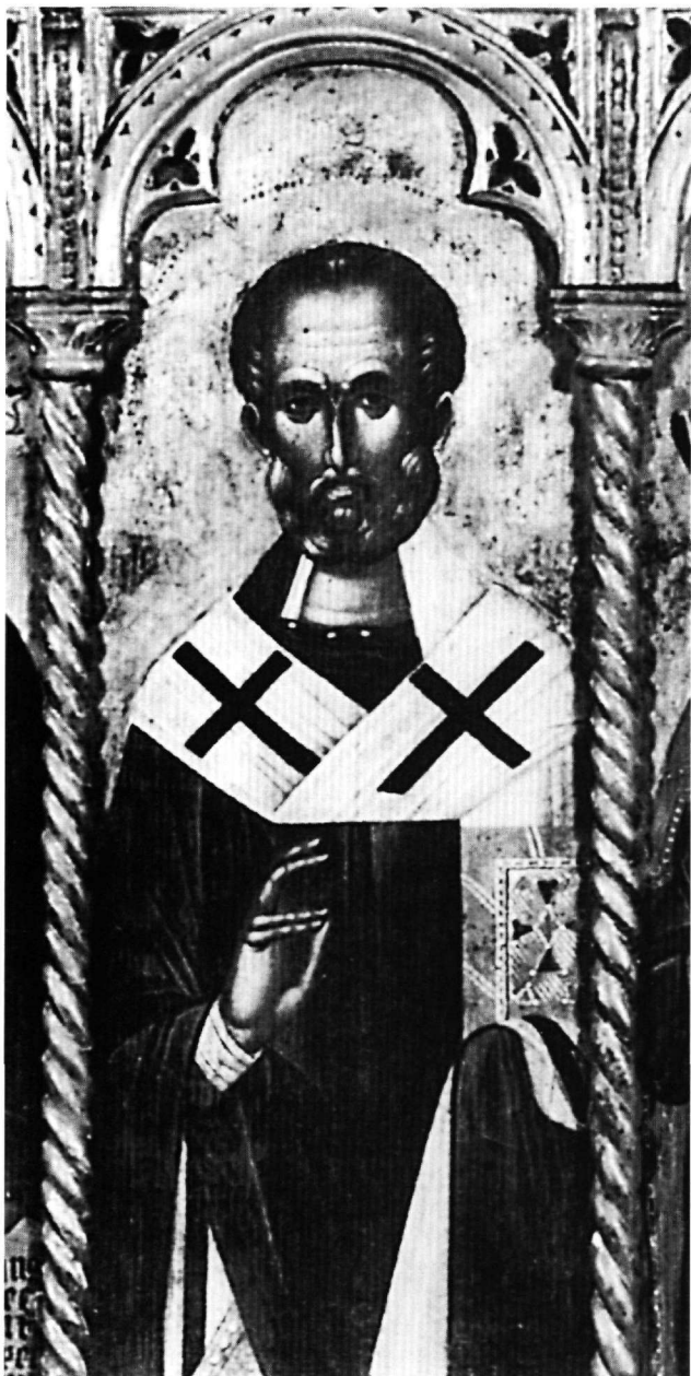
Εικ. 6. Μουσείο Καλών Τεχνών, Βοστώνη. Πολύπτυχο με ένθρονη Παναγία βρεφοκρατούσα και αγίους, λεπτομέρεια: Ο άγιος Νικόλαος.