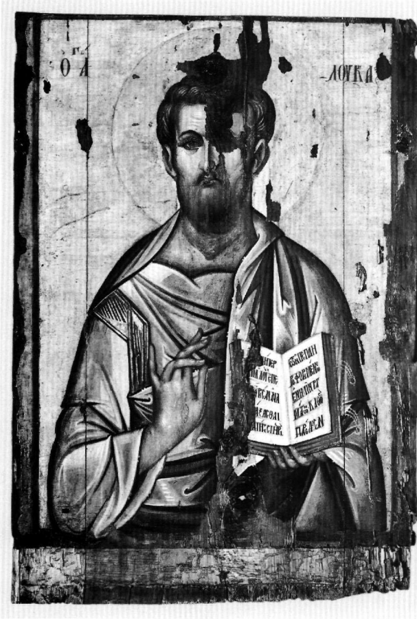
Εικ. 7. Ρόδος, Παλάτι του Μεγάλου Μαγίστρου. Αμφίγραπτη εικόνα, οπίσθια όψη: Ο άγιος Λουκάς.

αποστάσεις. Εξετάζοντας την πιθανότητα ο ζωγράφος της εικόνας της Νισύρου να επηρεάστηκε παρομοίως από κάποιο προσιτό σε αυτόν πρότυπο, παρατηρούμε τις αναλογίες ανάμεσα στον άγιο Νικόλαο και τον άγιο Λουκά (Εικ. 7), που εικονίζεται στην πίσω όψη της Παναγίας Οδηγήτριας. Το πλάσιμο του Λουκά είναι περισσότερο λεπτομερειακό, με μαλακές φωτοσιότητες, ενώ το χρώμα στα ενδύματα δημιουργεί αντιθέσεις. Το στήσιμο όμως και των δύο μορφών είναι μνημειακό, η πτυχολογία βαριά και γραμμική, επιμέρους χαρακτηριστι-