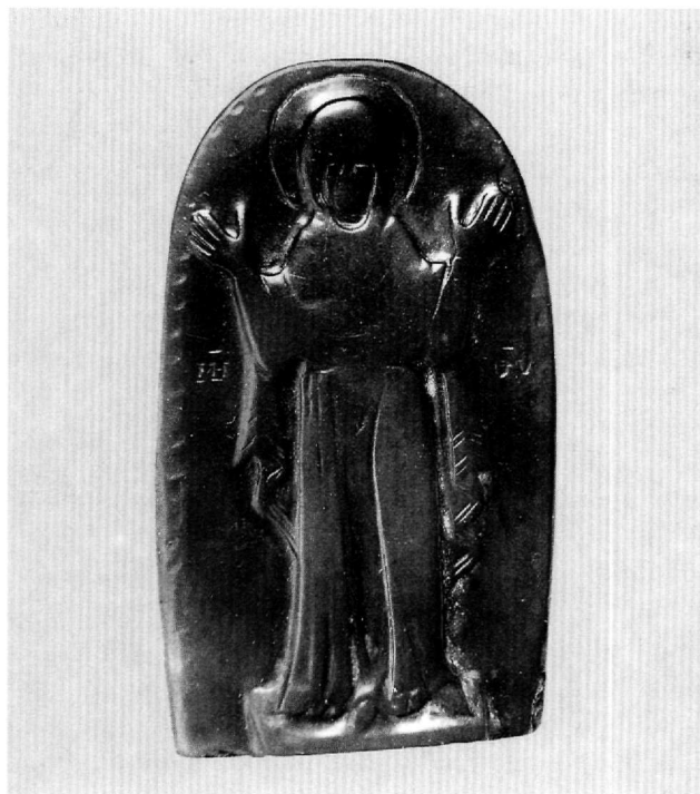
Εικ. 6-7. Αμφιπρόσωπος καμέος από νεφρίτη. Κύρια και πίσω όψη. 11ος-12ος αι. Μουσείο Μπενάκη, Αθήνα (αριθ. ευρ. 13511).

κής Βιβλιοθήκης της Γαλλίας στο Παρίσι (Εικ. 5) 40 . Με βάση τεχνοτροπικά κριτήρια ο καμέος αυτός έχει θεωρηθεί είτε ως έργο επαρχιακού εργαστηρίου του 10ου-11ου αιώνα είτε ως δυτική απομίμηση βυζαντινού προτύπου, χρονολογούμενη στο 13ο αιώνα. Στην ένδεση του καμέου, που τοποθετείται στο 13ο αιώνα και αποδίδεται σε γαλλικό εργαστήριο, αναγράφεται: SORTI-LEGIS VIRES ET FLUXUM TOLLO CRUORIS (Αφαιρώ από τις μαγείες την αποτελεσματικότητά τους και σταματώ την αιμορραγία). Επιπλέον, η κατάσταση διατήρησης τουλάχιστον δύο μεσοβυζαντινών καμέων 41 , των οποίων τα εξέχοντα μέρη έχουν αποστρογγυλωθεί (Εικ. 6-7), ίσως αποτελούν ενδείξεις και για μια άλλη πρακτική.