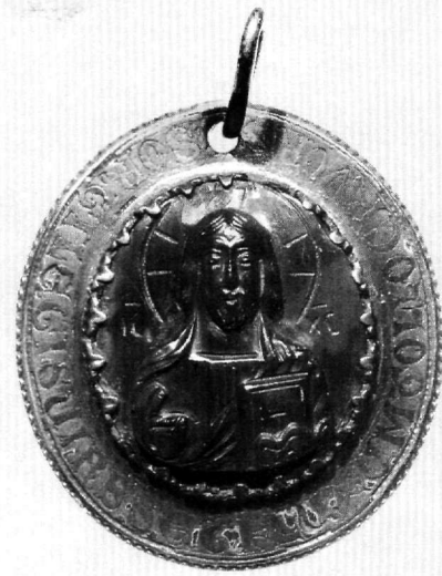
Εικ. 5. Καμέος από ηλιοτρόπιο με προτομή του Χριστού Παντοκράτορα. 10ος-11ος αι. (ή 13ος αι.). Εθνική Βιβλιοθήκη της Γαλλίας, Cabinet des Médailles, Παρίσι (αριθ. ευρ. D 2831).

Από πλευράς υλικών καταλοίπων ένα δεύτερο χαρακτηριστικό παράδειγμα, που επίσης μπορεί να τεκμη-