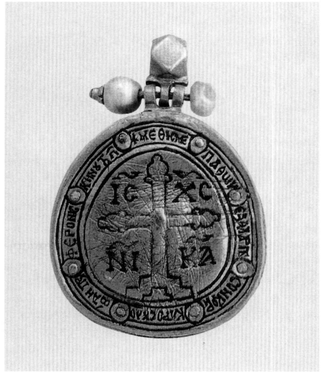
Εικ. 1-2. Εγκόλπιο με την απεικόνιση της Παναγίας Αγιοσοορίτισσας. Κύρια και πίσω όψη. 12ος-13ος αι. Ιερά Μονή Βατοπαιδίου, Άγιον Όρος.

σου ικετικά, Παρθένε, [εσένα] την οποία ο λίθος αμέθυστος απεικονίζει σε χλωώδη τόπο), μπορούμε να υποθέσουμε ότι ο κτήτορας του εγκολπίου ήταν επιρρεπής στην άκρατη οινοποσία και ίσως ακόμη έπασχε από αλκοολισμό. Αναγνωρίζοντας τις θλιβερές παρενέργειες της έξης του παρακαλεί την Παναγία να τον λυτρώσει από αυτές. Οίνος πάθους έγερσις έκλελοιπότης. / Ύλη γάρ εισρέουσα ρώννυσι φλόγα (το κρασί ξυπνά τα πάθη που έχουν σβήσει. / Χύνεται σαν προσάναμμα, τη φλόγα μεγαλώνει) αναφέρει ο Γρηγόριος ο Ναζιανζηνός στα