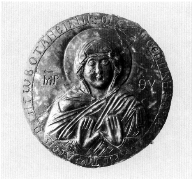
Εικ. 4. Καμέος από σφείτη λίθο με την Παναγία δεομένη και εγχάρακτη επιγραφή. 1078-1081. Victoria and Albert Museum, Λονδίνο (αριθ. ευρ. A.I-1927).

ἀμέθυστος γράφει) στην επιγραφή του εγκολπίου της μονής Βατοπεδίου δεν είναι σπάνια. Σε αρκετά επιγράμματα σχετικά με λίθινα έργα μικρογλυπτικής γίνεται λόγος για το υλικό κατασκευής τους και τις ιδιότητές του 16 . Ο αμέθυστος, ένας ημιδιαφανής ημιπολύτιμος λίθος, φανεροκρυσταλλική παραλλαγή του χαλα-