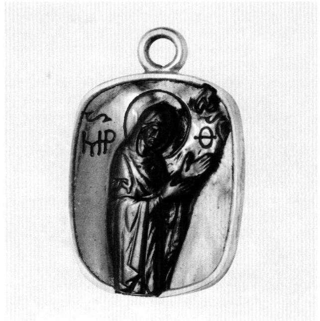
Εἰκ. 3. Καμέος ἀπὸ ἰάσπι με τὴ μορφή της Παναγίας Ἀγιοσορίτισσας. 11ος-12ος αἰ. Kunsthistorisches Museum, Βιέννη (αριθ. ευρ. XII 748).

Ἐχει παρατηρηθεῖ ὅτι, ἐξαιτίας των ἀλλαγῶν στη λατρεία των ἁγίων μετὰ τὸ τέλος της Εἰκονομαχίας, τὸ θεματολόγιο των καμέων χάνει τὸ διακοσμητικό, ἐμβληματικό ἢ ἀποτροπαϊκό χαρακτήρα του 12 . Περιορίζεται σε μορφές ἁγίων (και σπανιότερα σε σκηνές του Δωδεκαόρτου), πρὸς τους οποίους ἀπευθύνονται οὐ Βυζαντινοὶ ζητώντας τὴν εὐλογία ἢ τὴ μεσιτεία τους. Για τὸ λόγο αὐτὸ ὁ τύπος της Παναγίας Ἀγιοσορίτισσας ἐμφανίζεται σε μεσοβυζαντινοὺς καμέους με ιδιαίτερη συχνότητα 13 (Εἰκ. 3). Στὸ ἴδιο πλαίσιο ἐντάσσονται και οἱ επιγραφές σε μορφή ἐπίκλησης για βοήθεια ἢ σωτηρία, που εἶναι χαραγμένες σε μεσοβυζαντινοὺς καμέ-